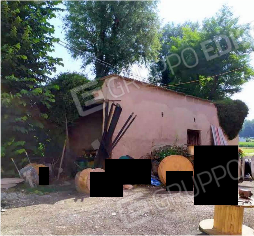
GARAGE PROSPETTI OVEST e SUD