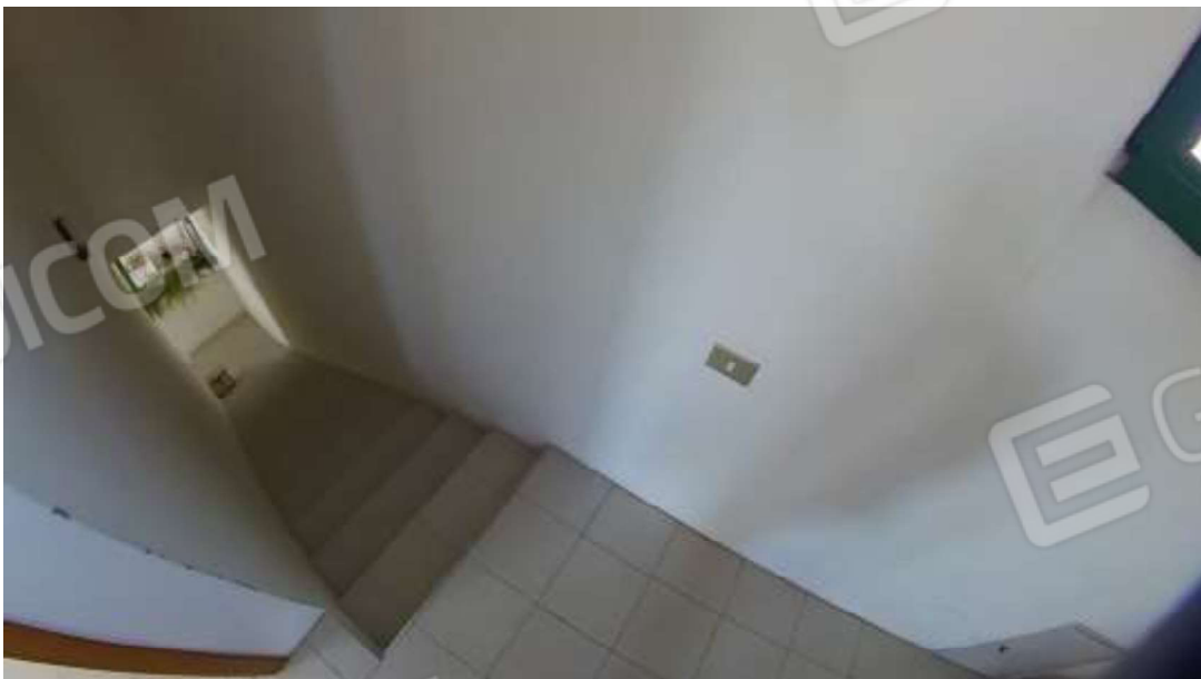
Figura 3 Primo piano mn 119