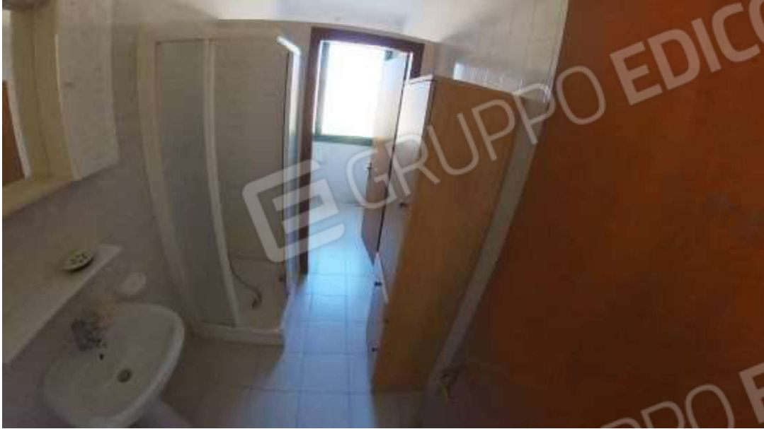
Figura 6 Primo piano mn 119