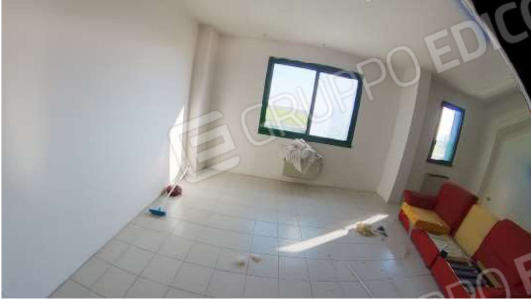
Figura 10 Primo piano mn 119