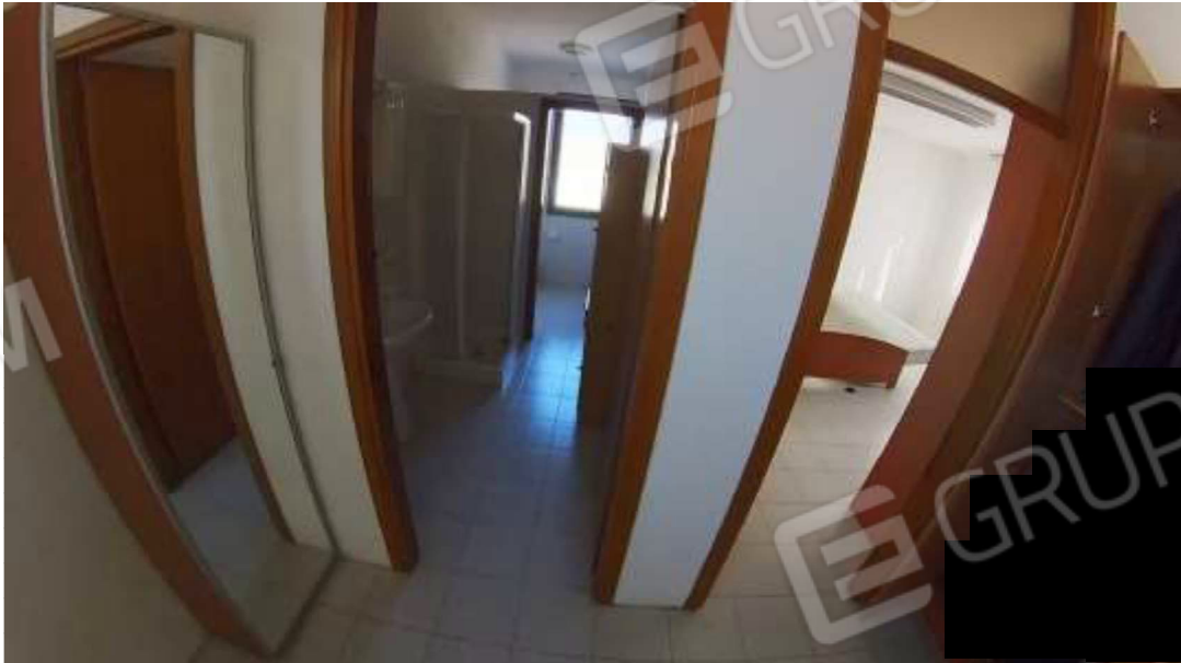
Figura 5 Primo piano mn 119