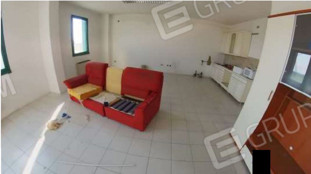
Figura 9 Primo piano mn 119