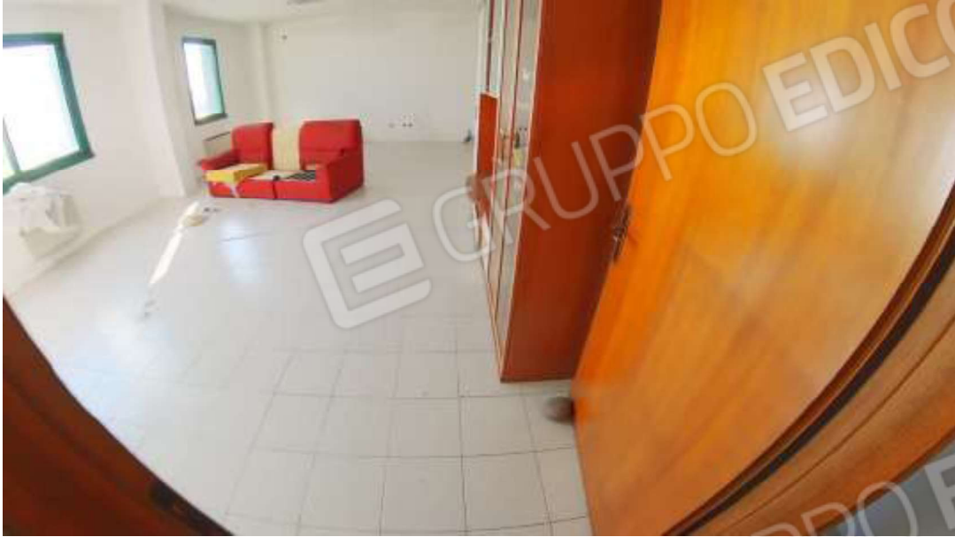
Figura 8 Primo piano mn 119