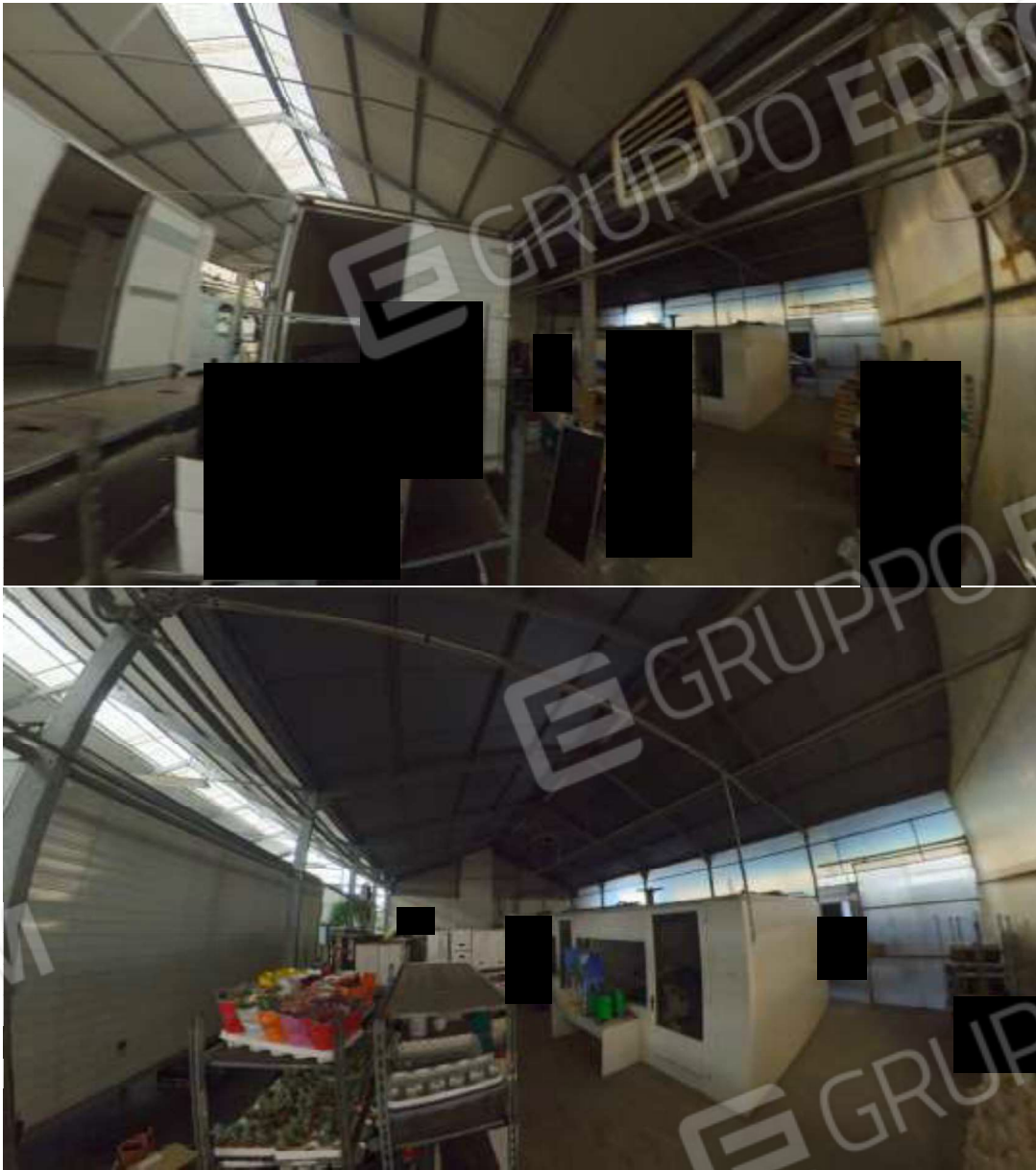
Figura 13 Capannone deposito