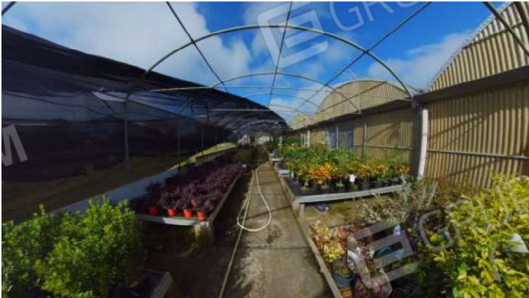
Figura 19 Ombradio lato Sud