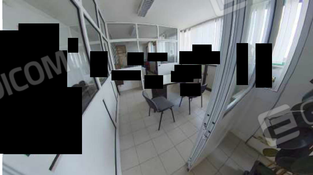
Figura 2 Uffici mn 119 fg 5