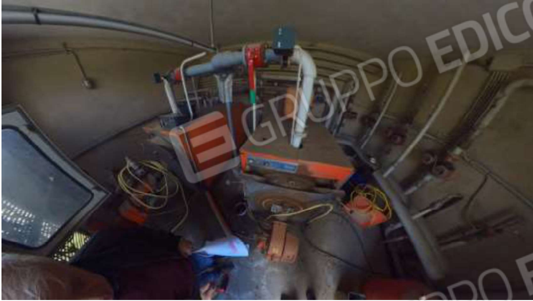
Figura 18 Centrale termica