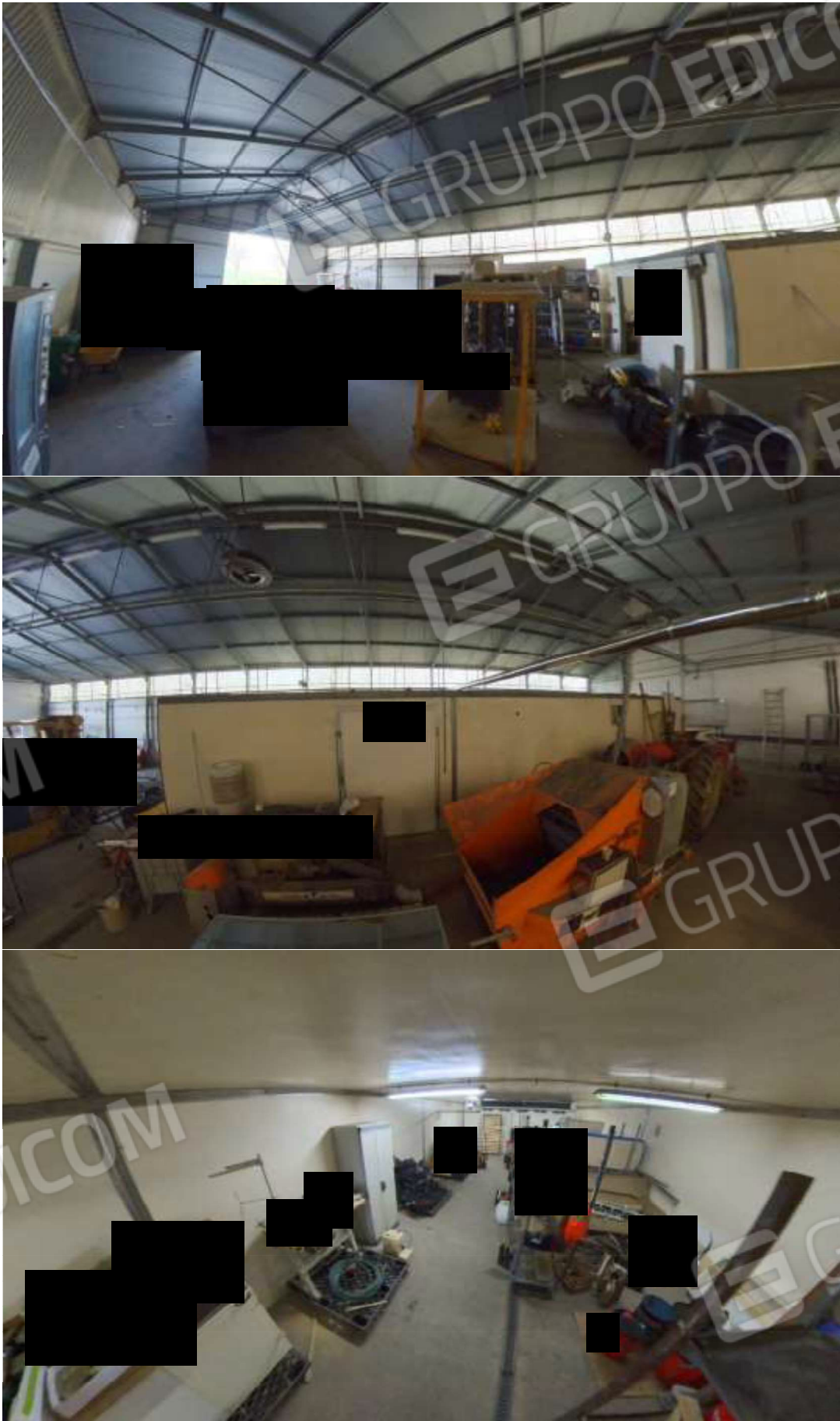
Figura 14 cella frigo interna al capannone