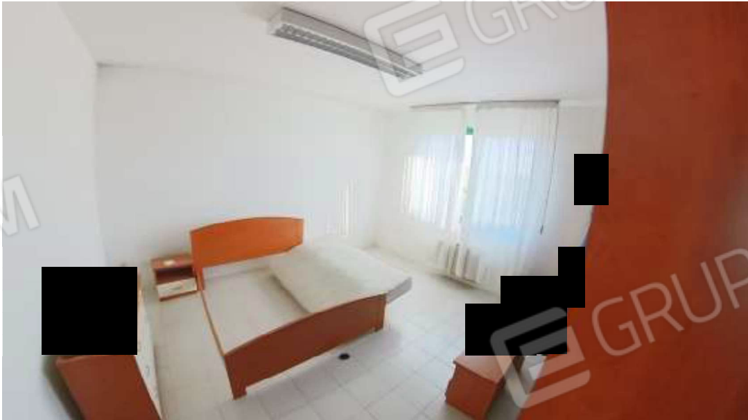
Figura 7 Primo piano mn 119