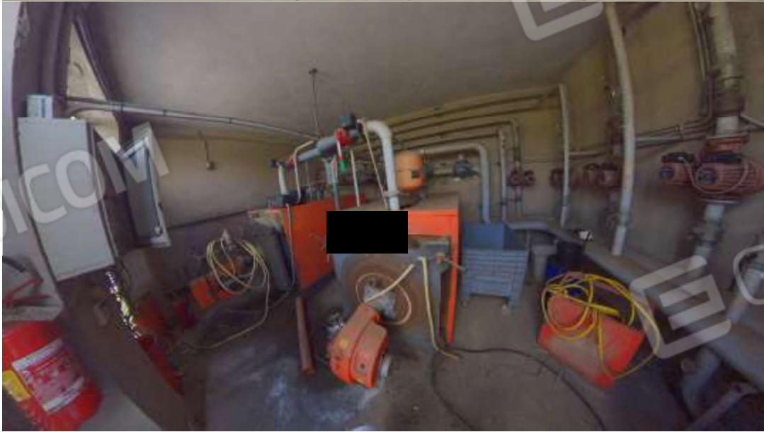
Figura 17 Centrale termica