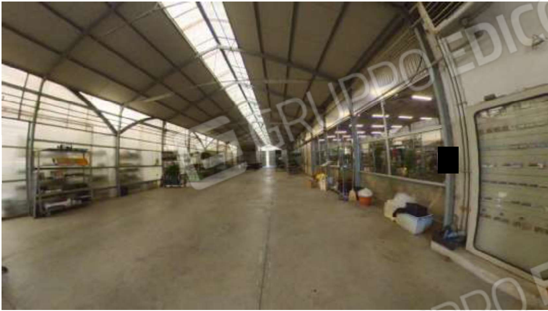
Figura 12 capannone avanserra