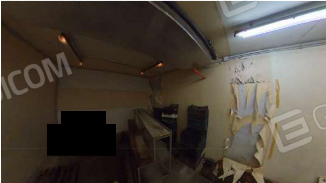
Figura 15 cella frigo Nord-Ovest