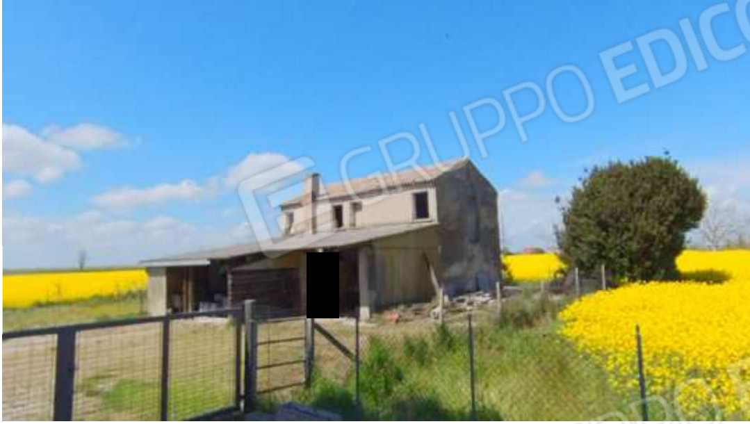
Figura 20 fabbricato insistente sul mappa 47, foglio 5