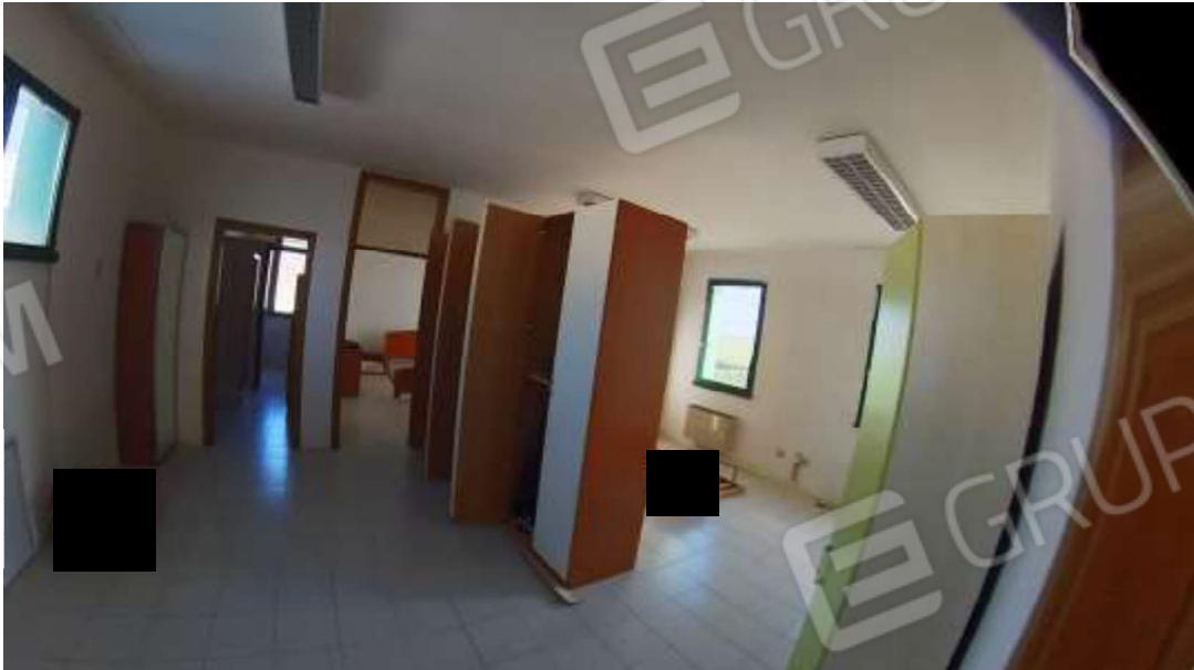
Figura 11 Primo piano mn 119