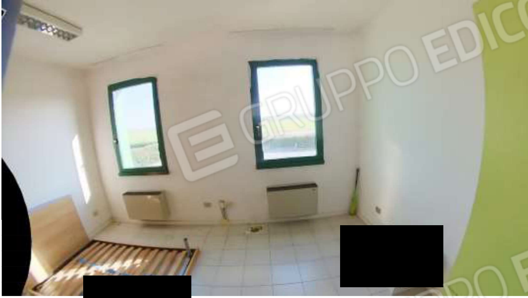
Figura 4 Primo piano mn 119