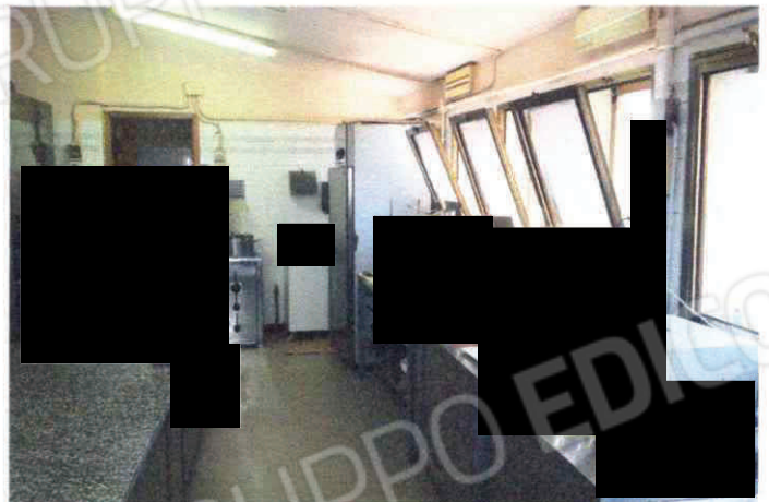
Tetto del locale laboratorio (necessità di ripassatura) Cortile interno