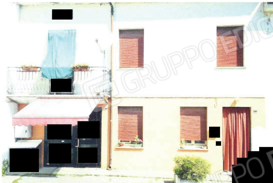
Prospetto principale (Copertura che necessita di interventi di ripassatura)