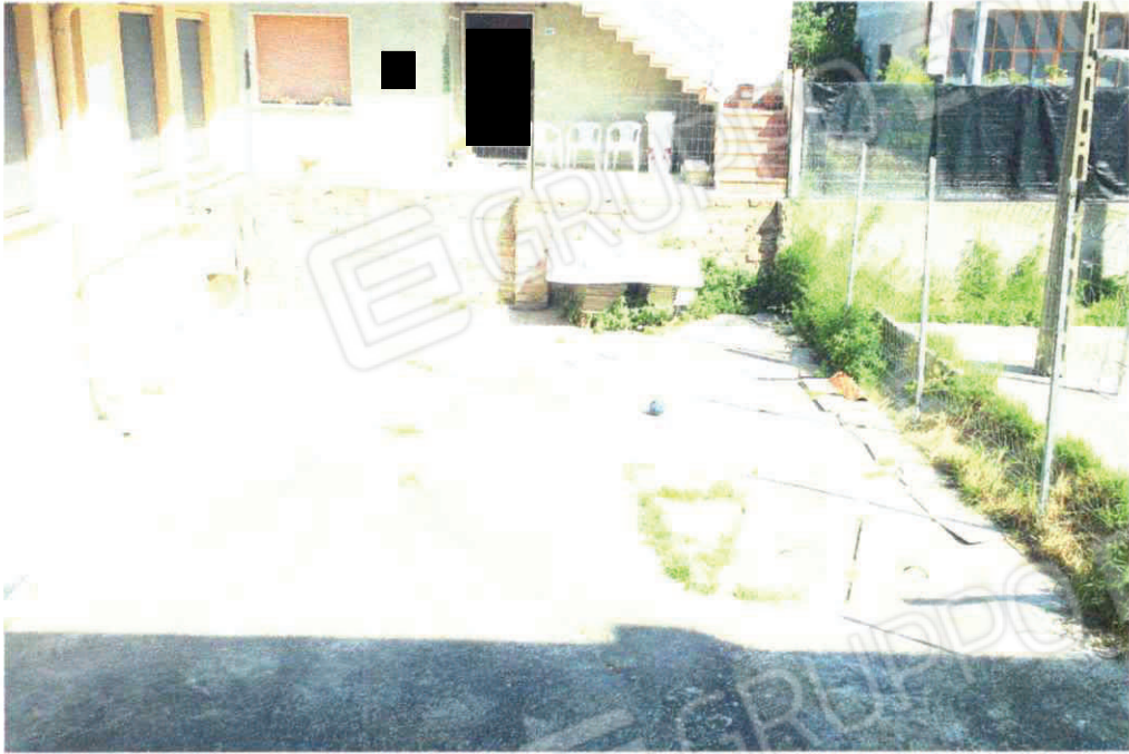
Cortile interno (Parte Nord)