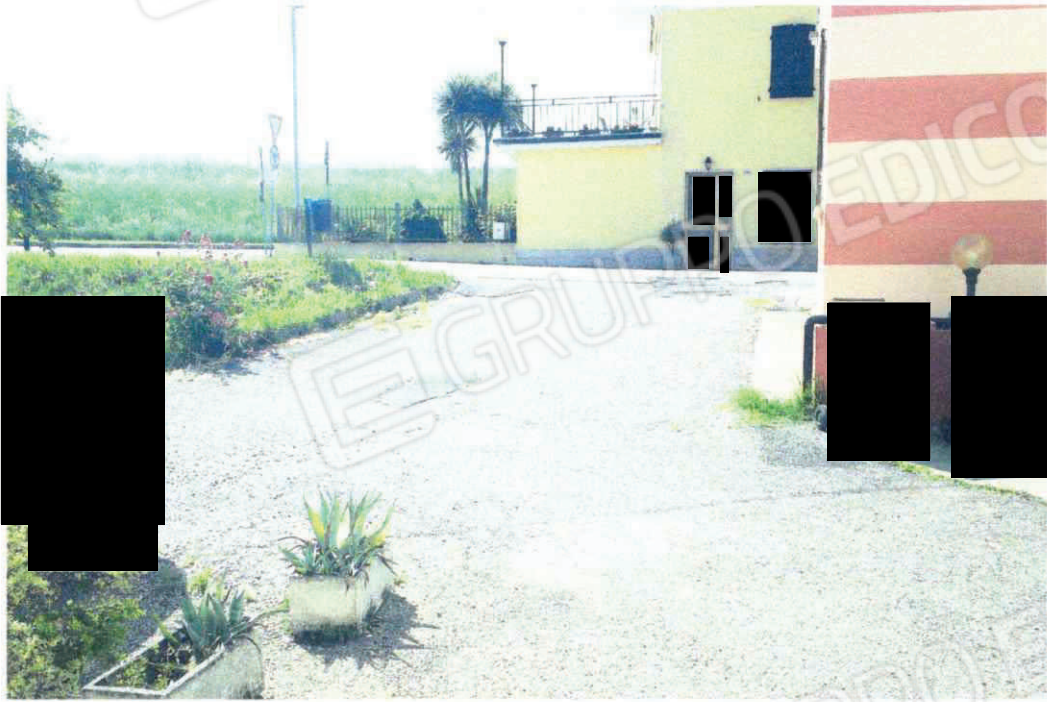
Accesso alla Via Pubblica (utilizzato anche da altre proprietà) e contatore ENEL