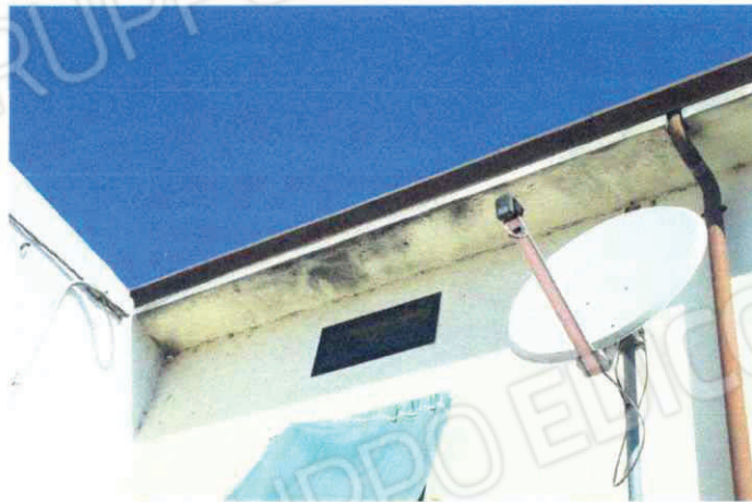
Cornice del tetto parzialmente danneggiata e interni con segni di infiltrazioni di acqua meteorica