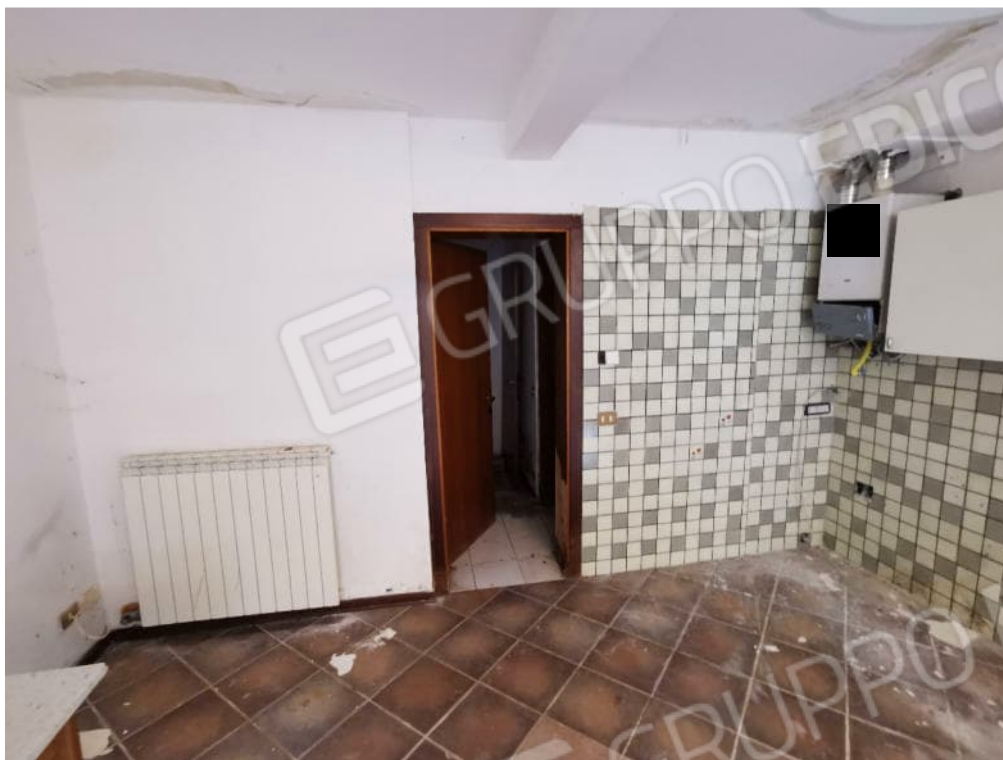
FOTOGRAFIA N.5 – particolare interno piano terra