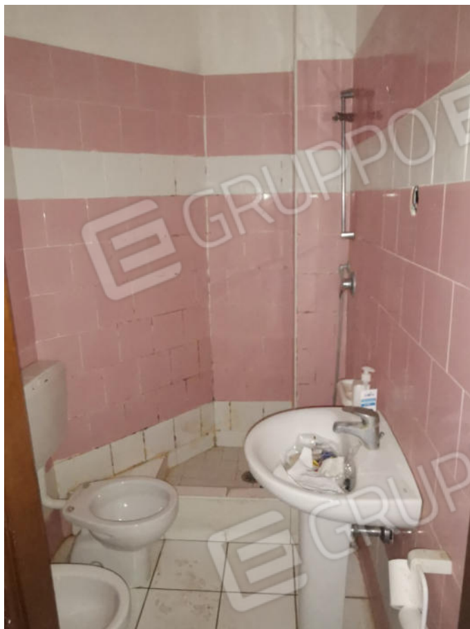
FOTOGRAFIA N.9 – particolare interno piano primo