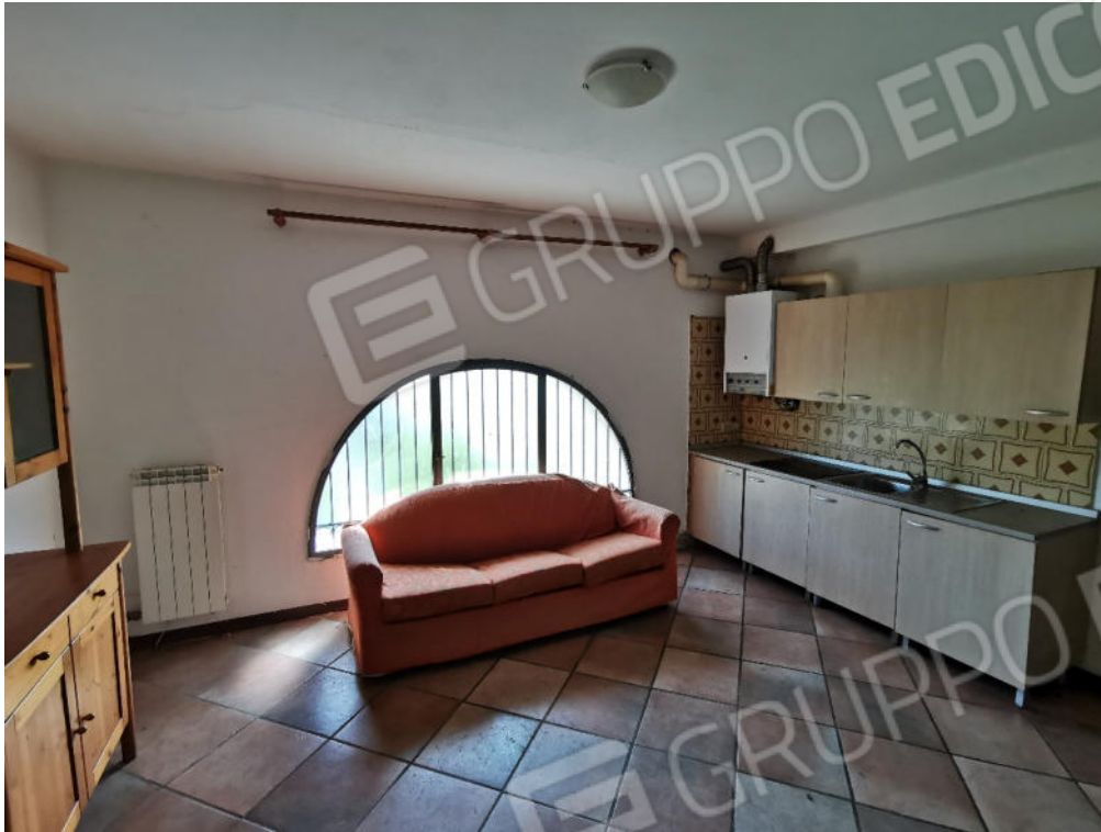
FOTOGRAFIA N.11 – particolare interno piano secondo