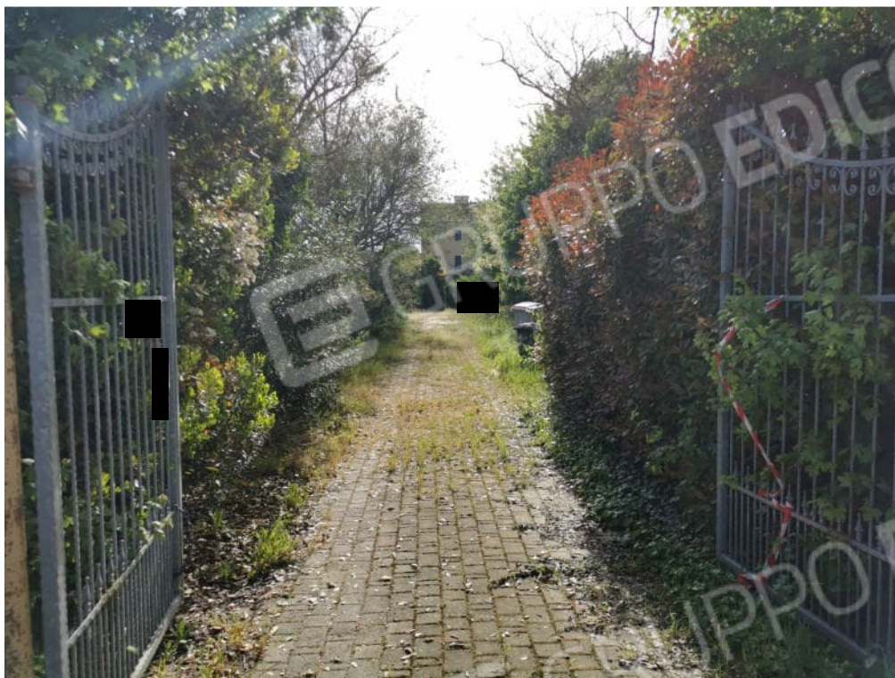
FOTOGRAFIA N.1 - violetto di ingresso