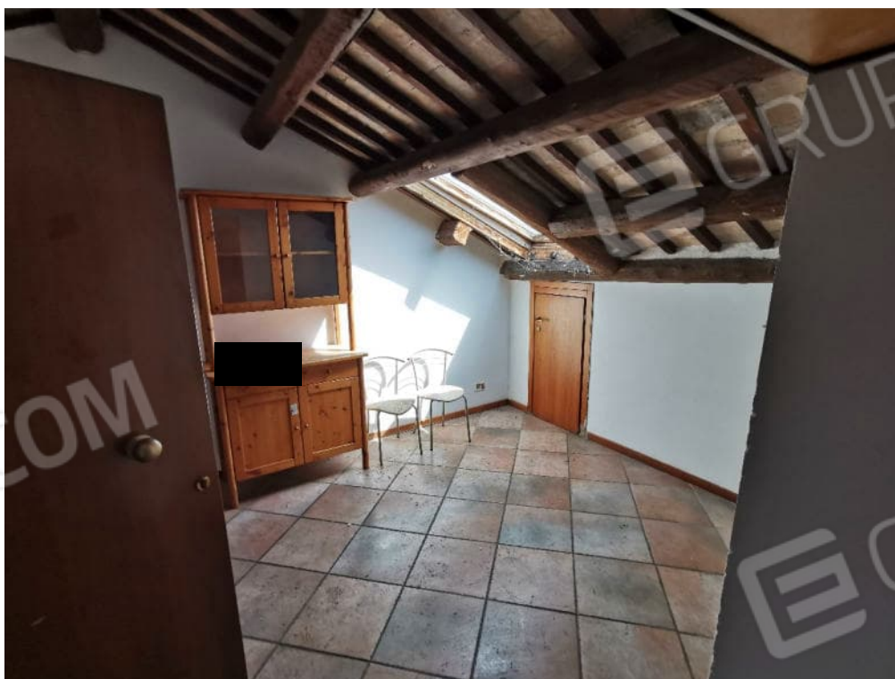
FOTOGRAFIA N.14 – particolare interno piano sottotetto