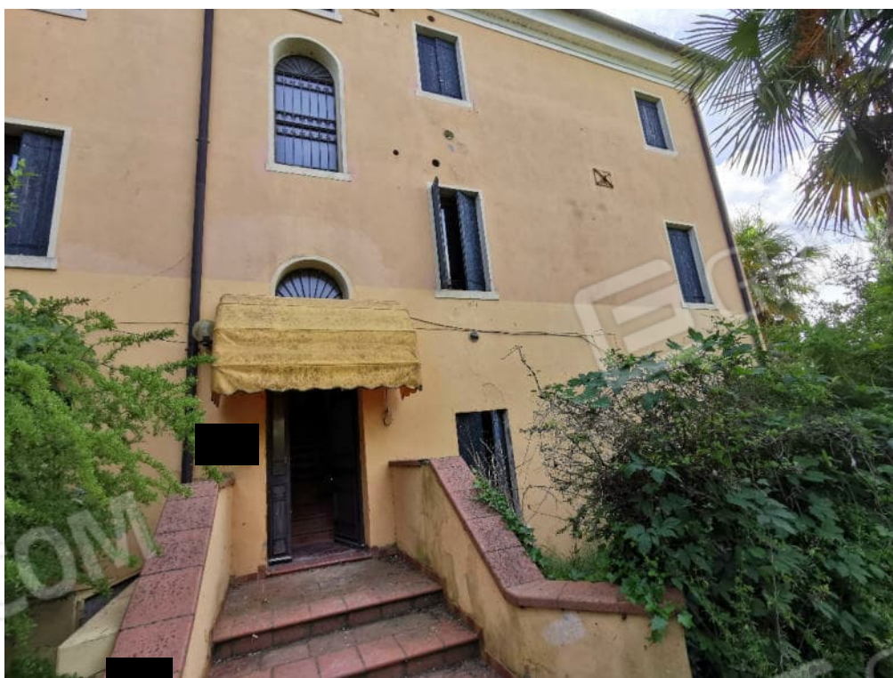
FOTOGRAFIA N.2 - particolare prospetto principale