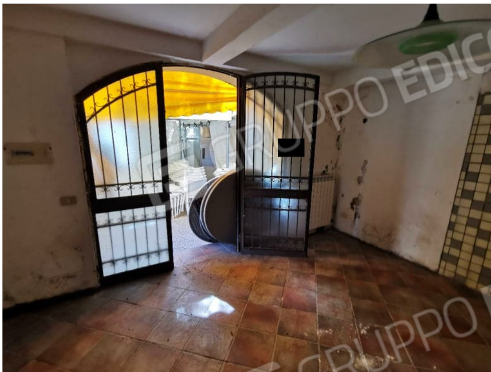
FOTOGRAFIA N.7 – particolare interno piano terra