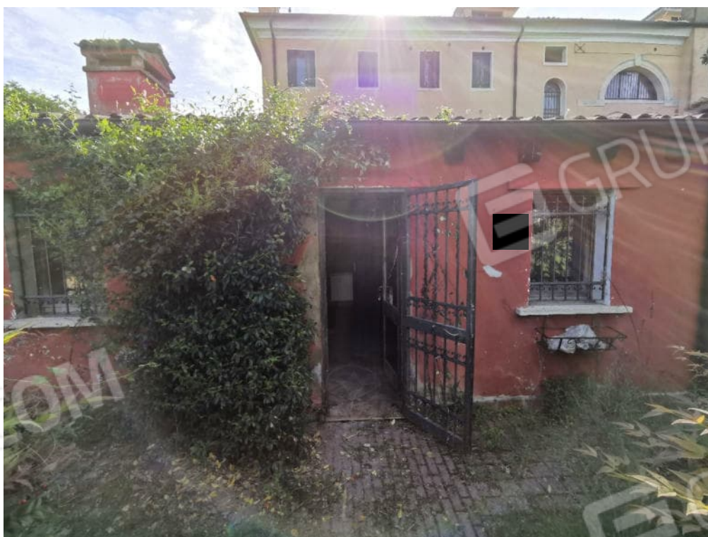
FOTOGRAFIA N.16 – particolare esterno manufatto sub. 27