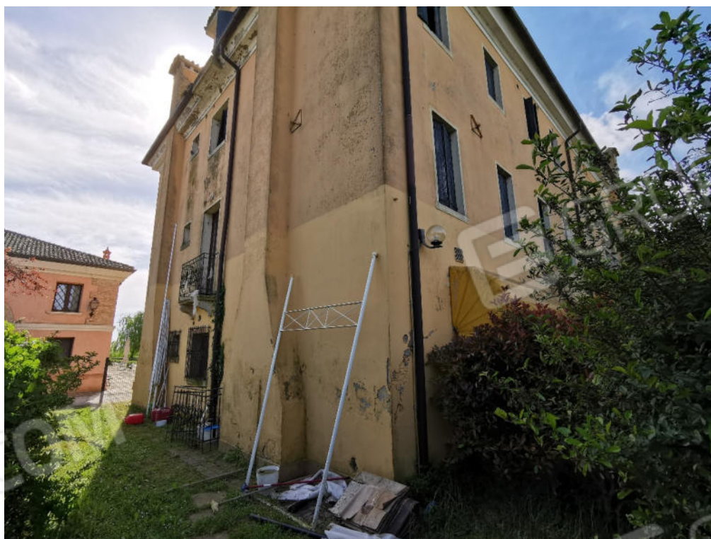
FOTOGRAFIA N.4 - particolare prospetto nord-ovest