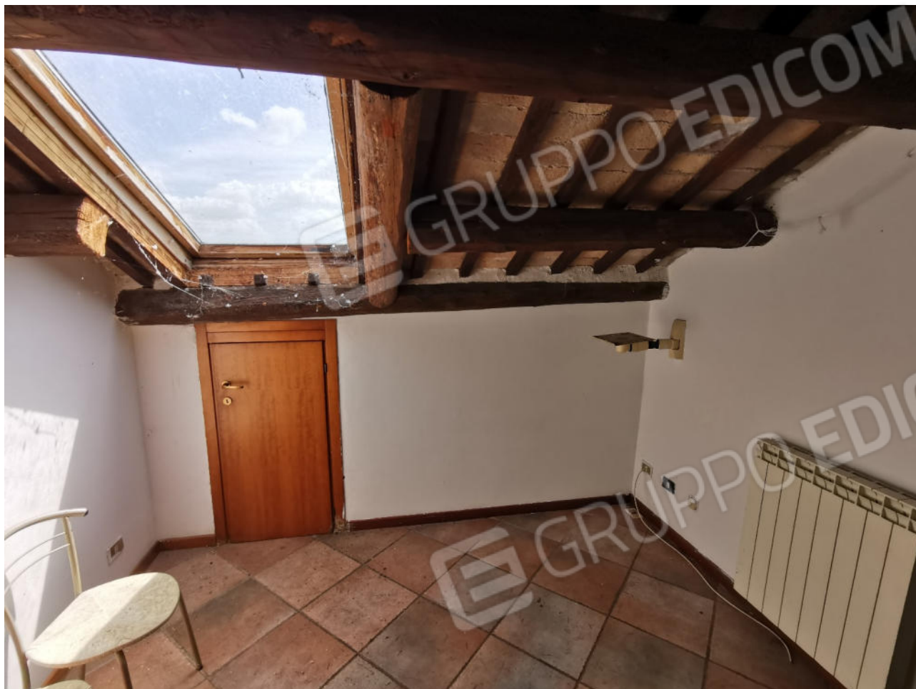
FOTOGRAFIA N.13 – particolare interno piano sottotetto