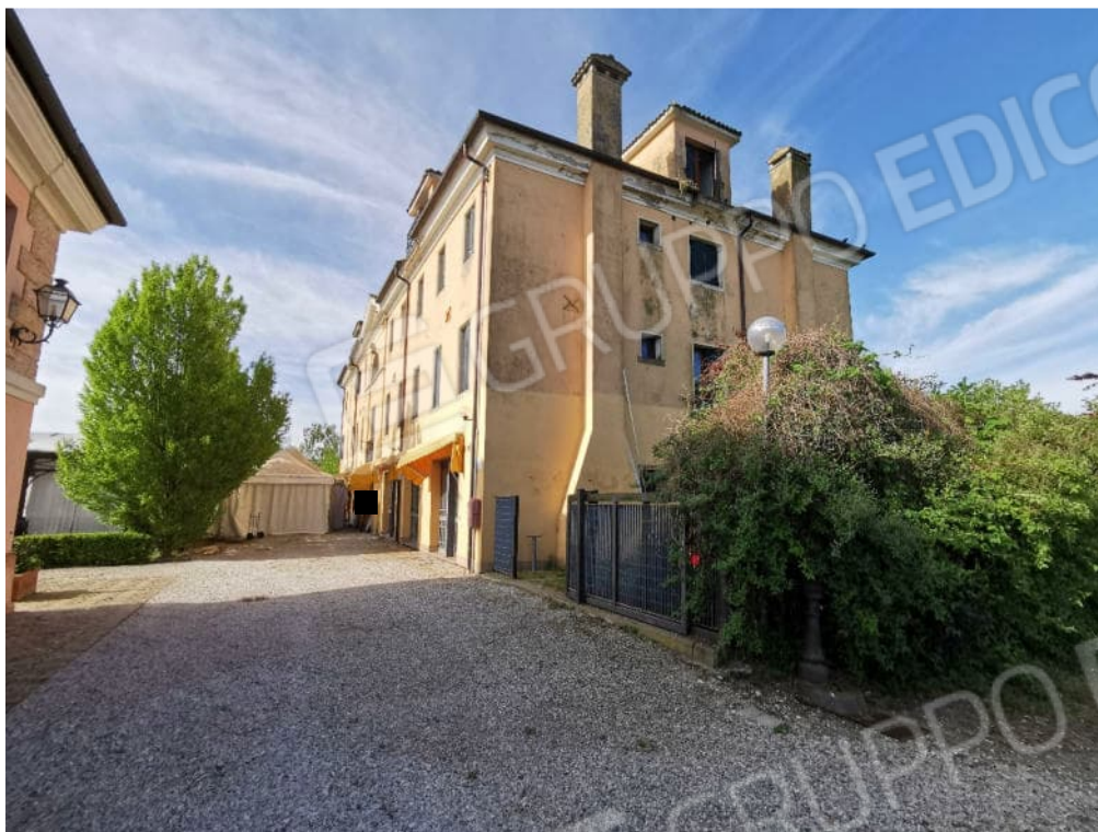
FOTOGRAFIA N.3 - particolare prospetto nord-est