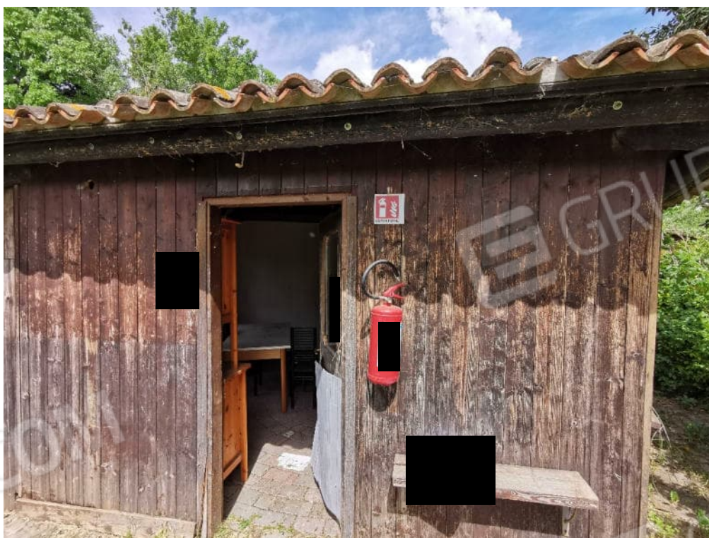
FOTOGRAFIA N.18 – particolare manufatto non autorizzato