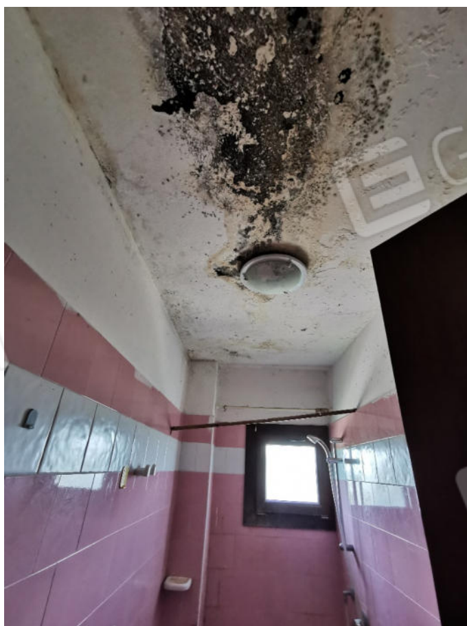
FOTOGRAFIA N.10 – particolare interno piano primo