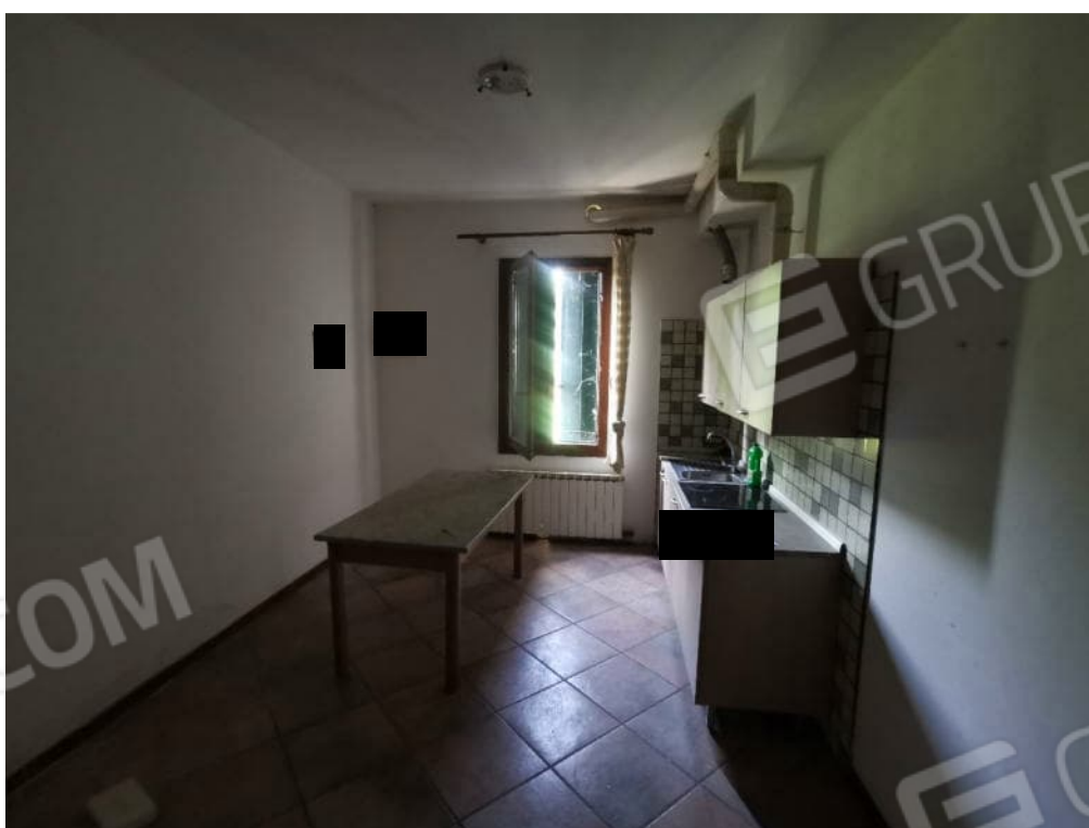
FOTOGRAFIA N. 8 – particolare interno piano primo