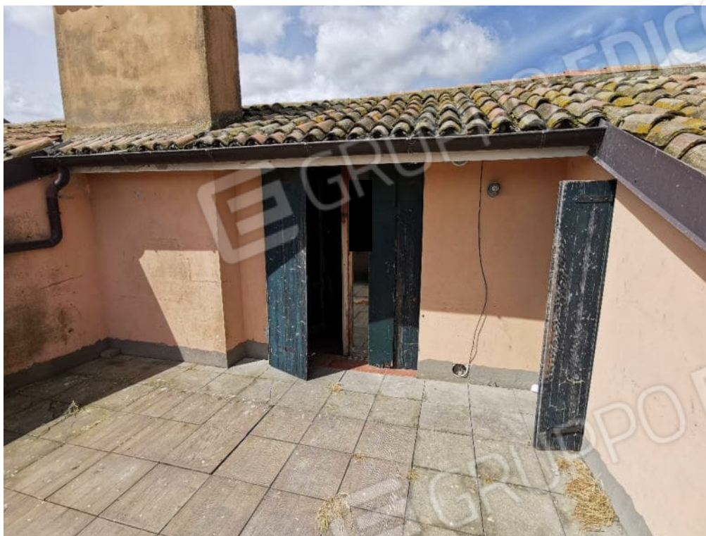
FOTOGRAFIA N.15 – particolare piano sottotetto