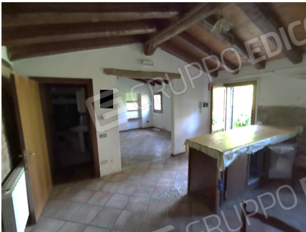
FOTOGRAFIA N.17 – particolare interno manufatto sub. 27