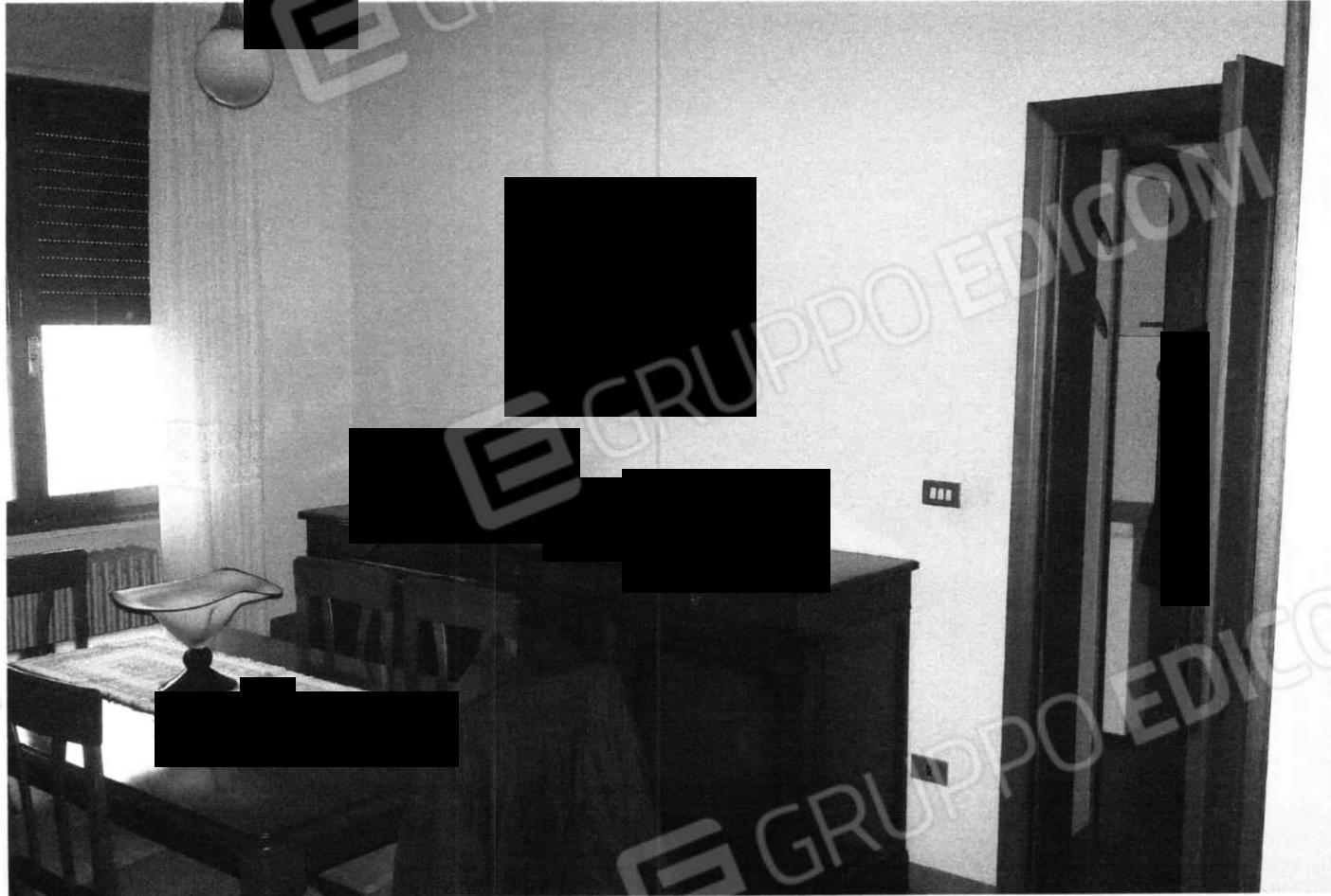
Soggiorno e salotto (Lotto 2)