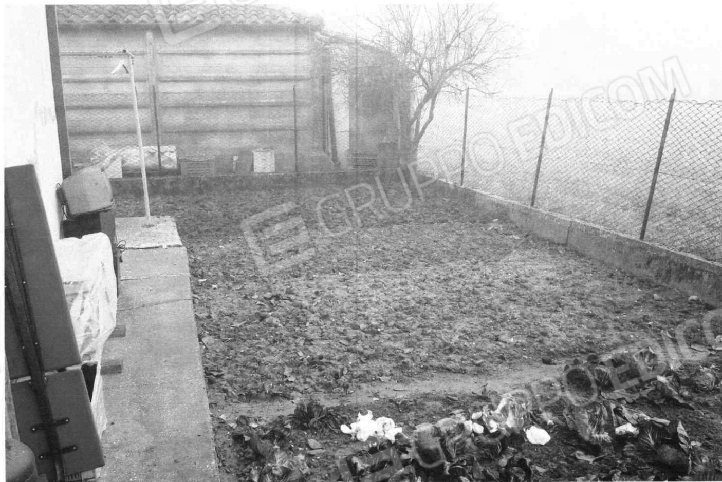
Area comune all'appartamento del piano terra e primo (lotti 1 e 2)