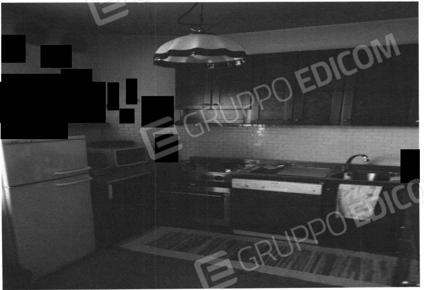
Cucina e Bagno (Lotto 1)