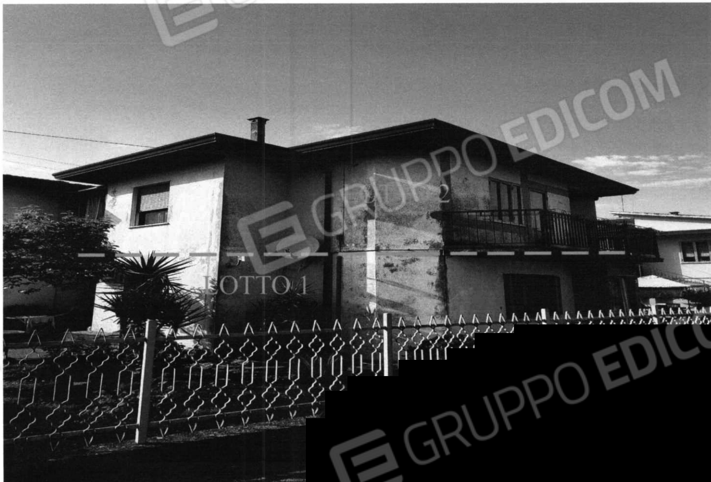
Prospetti del fabbricato con le due unità immobiliari