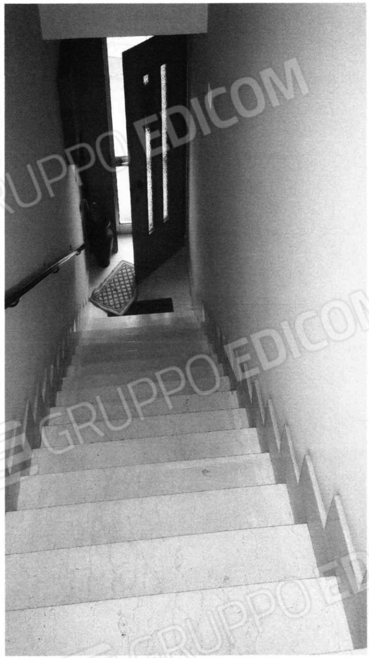
Scala di accesso all'appartamento del piano primo (Lotto 2)