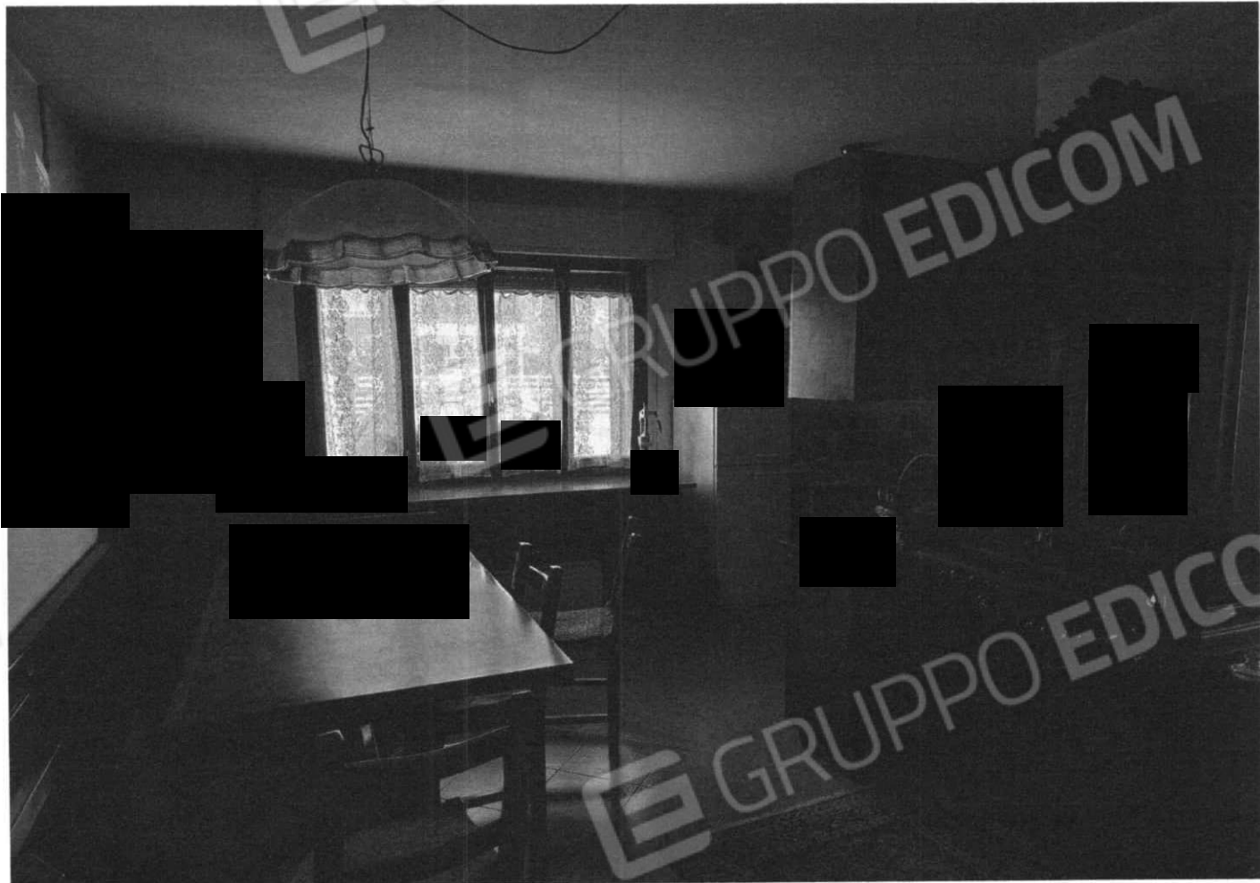
Soggiorno (Lotto 1)