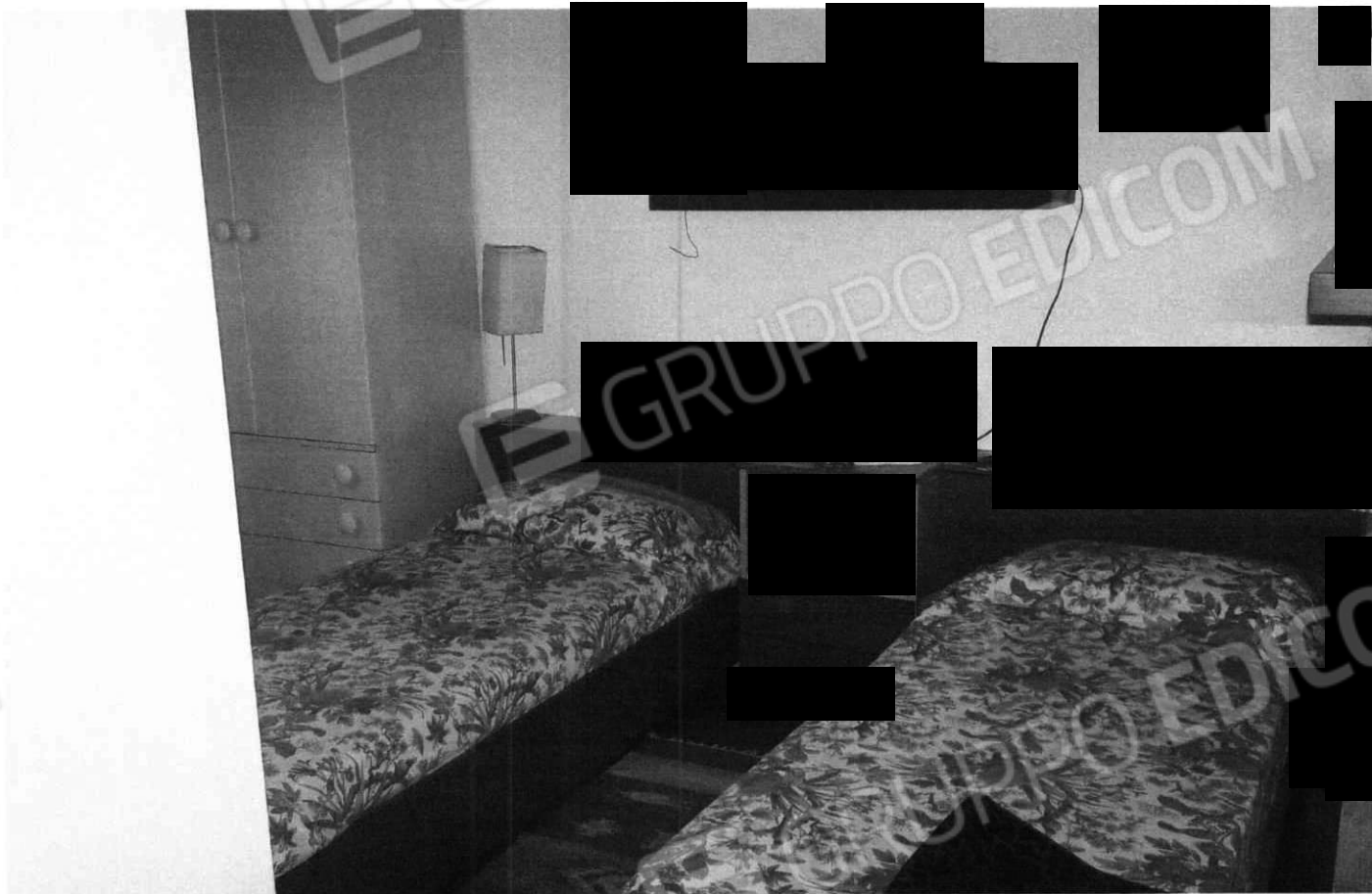
Stanze da letto (Lotto 2)