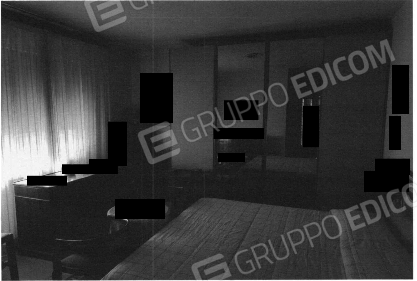
Stanza da Letto (Lotto 1)