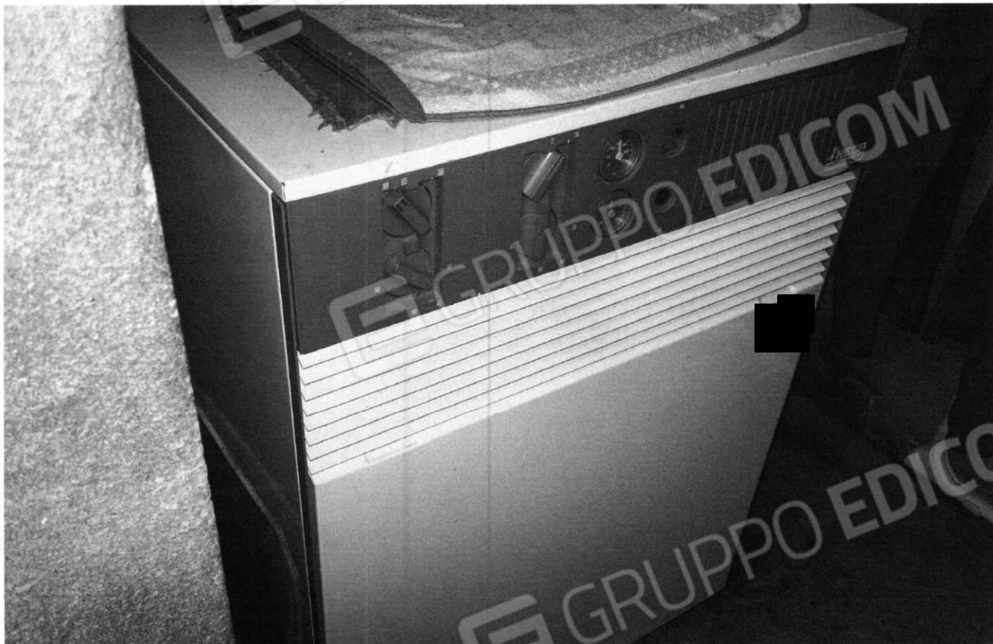
Locale caldaia al servizio dei lotti 1 e 2