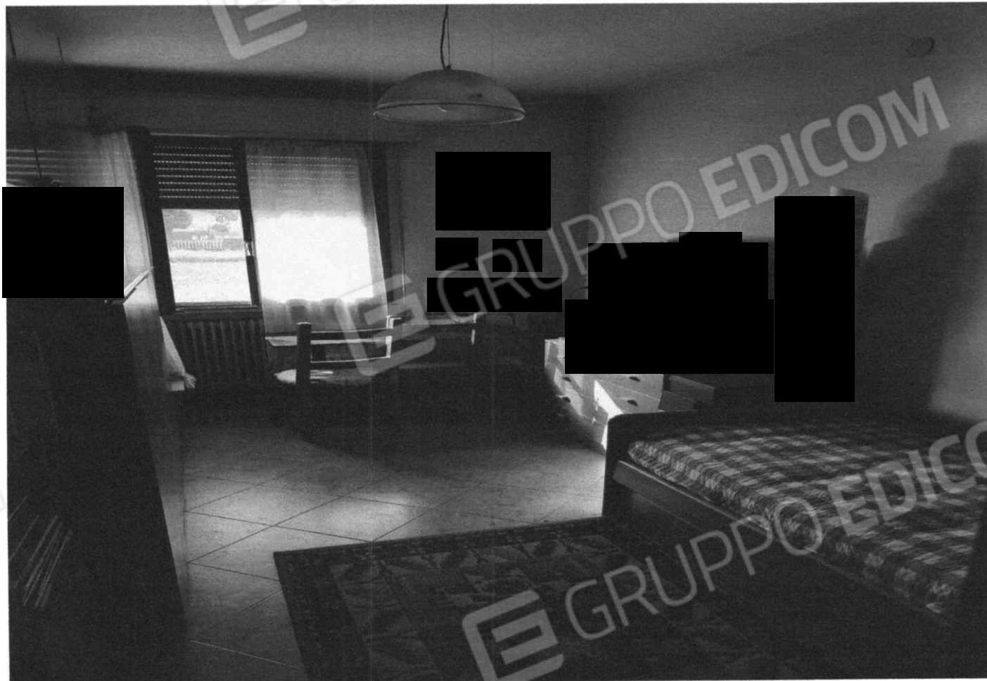
Vano e ingresso (Lotto 1)