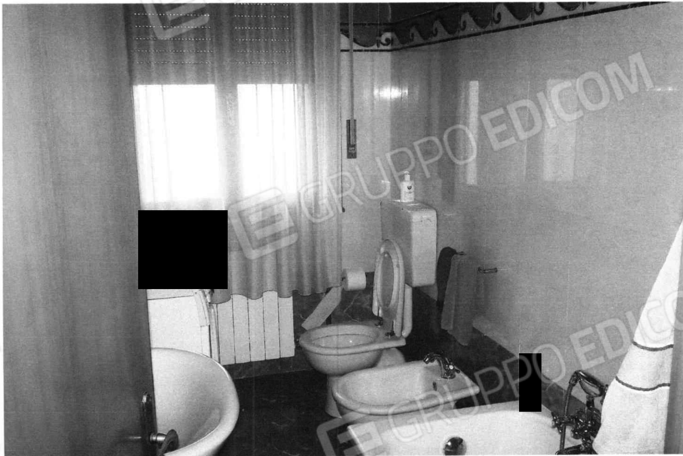
Bagno e cucina (Lotto 2)