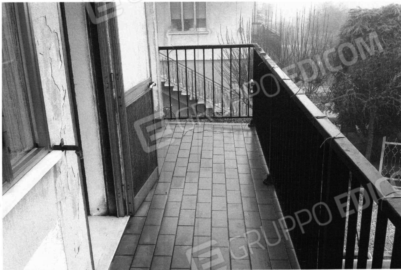
Terrazzo sul prospetto principale (Lotto 2)