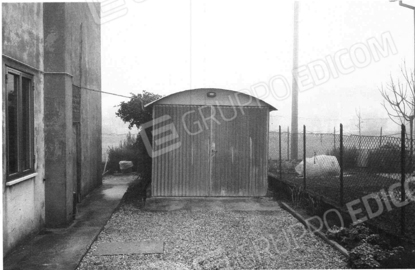
Garage annesso all'appartamento del piano primo