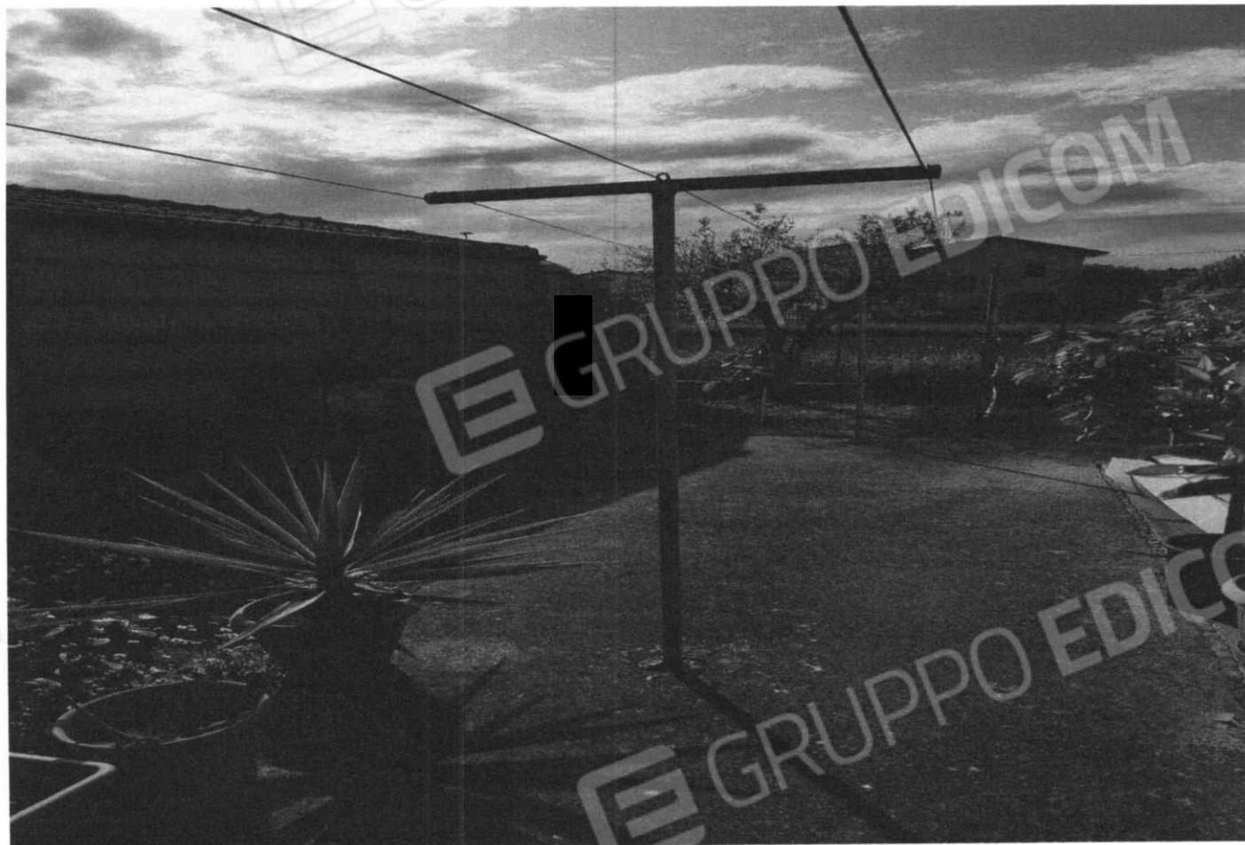
Area di corte comune ai due Lotti