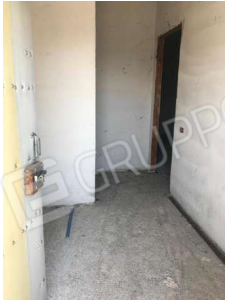
Corpo D area scoperta particelle 1514 e 76