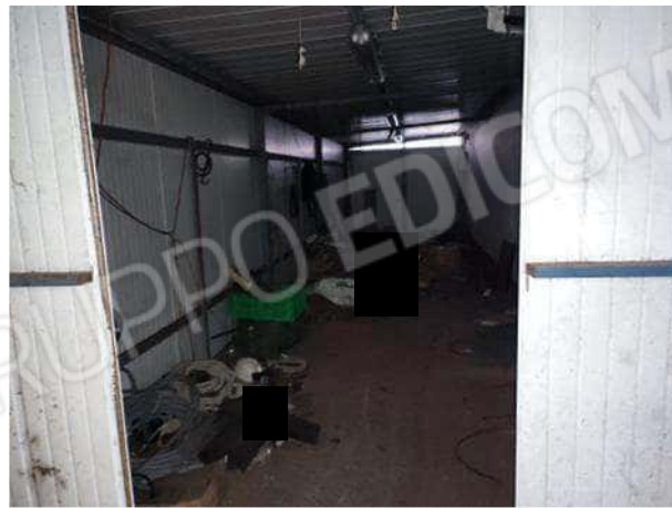
Corpo C particella 76 subalterno 2