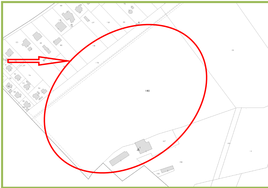
Estratto di mappa Censuario di ROVIGO – Sez. BUSO-SARZANO – Foglio 10 m.n. 178-180