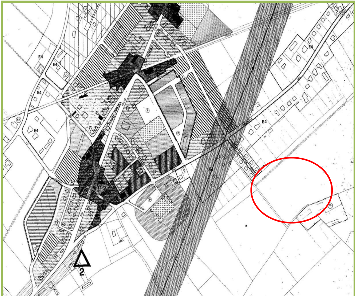
Estratto di P.R.G./P.I

Per quanto sopra si dichiara la conformità urbanistica.