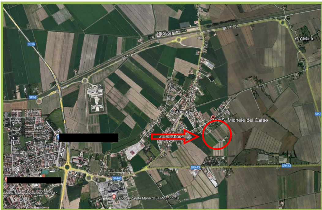
Immagine satellitare con posizionamento immobile

Terreno agricolo senza sovrastanti fabbricati, ubicato in Comune di Rovigo (Via San Michele al Carso - località Buso-Sarzano). La zona in cui si trova il terreno è situata a est rispetto al centro della Provincia; si trova a circa a 2,0 km dal centro della città.