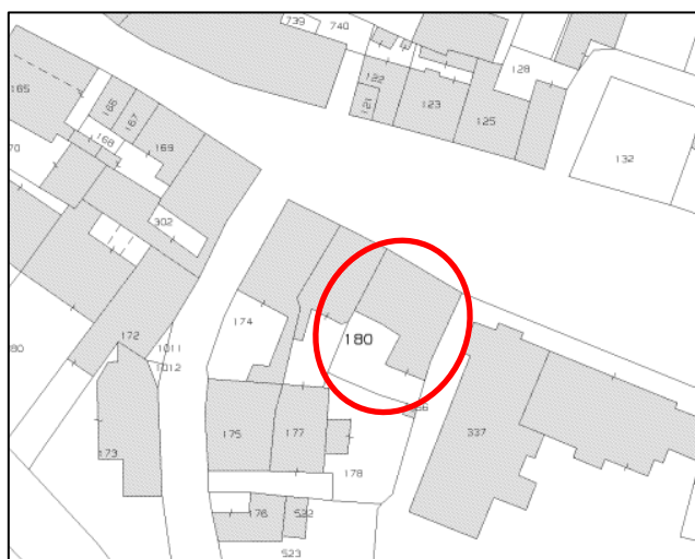
Estratto di mappa catastale particella 180 (riproduzione grafica non in scala)

Confini per tutto il lotto: Nord P.zza Umberto I, Est particella 449, Sud particelle 356- 178, Ovest particella 177.