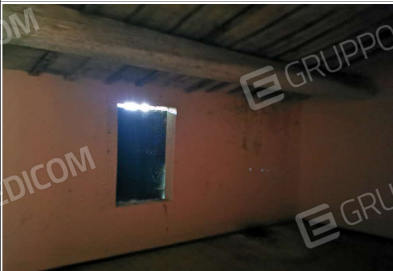
Camera da letto più piccola