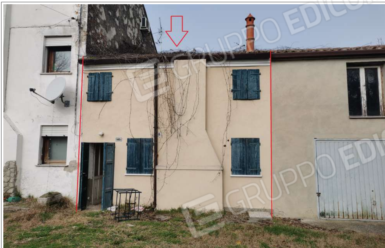
Veduta ingresso principale