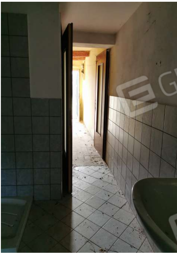
Bagno+Ingresso piano terra