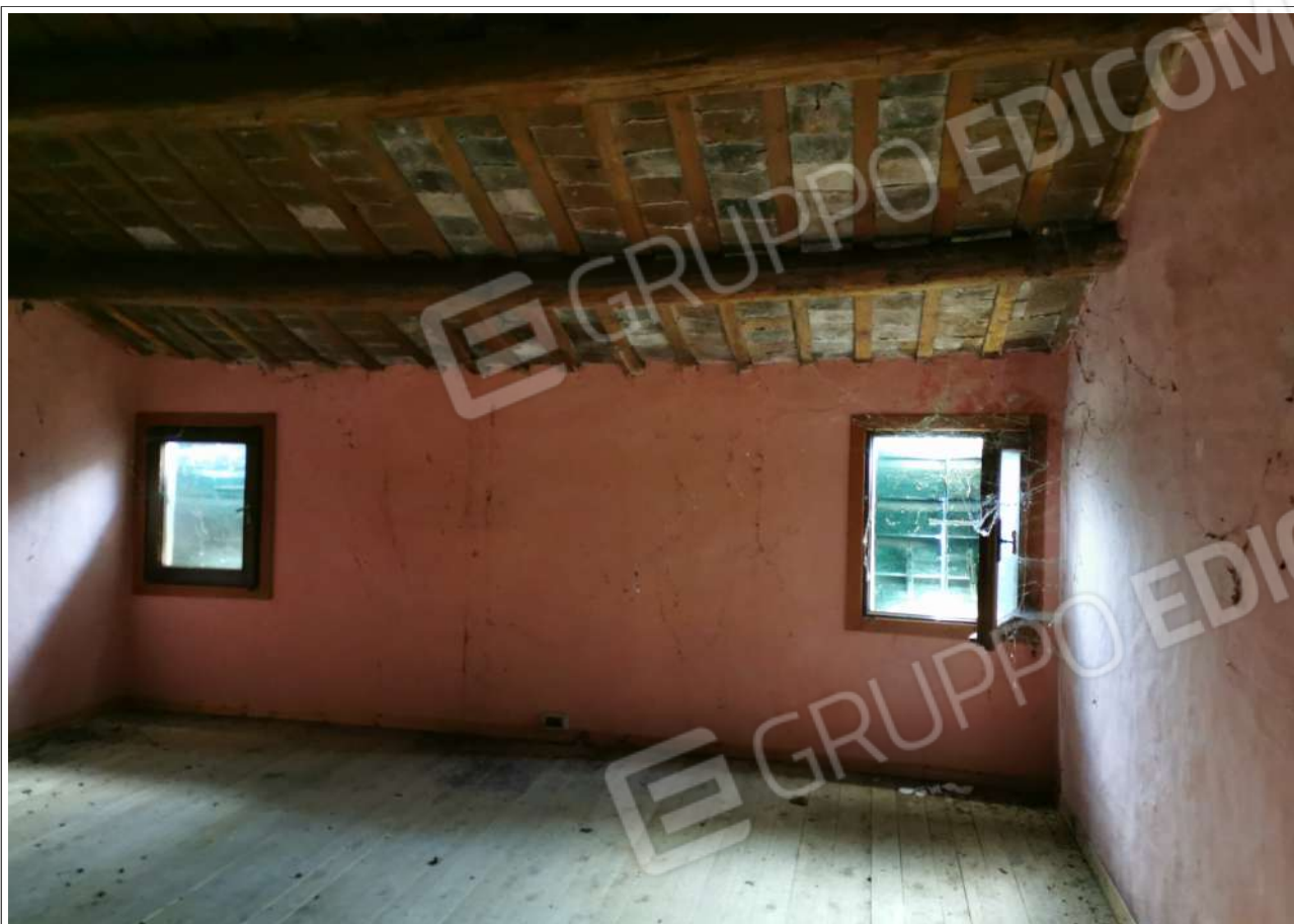
Camera da letto più grande