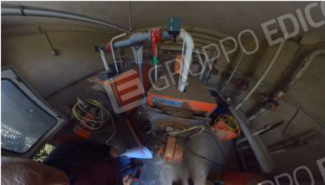
Figura 18 Centrale termica