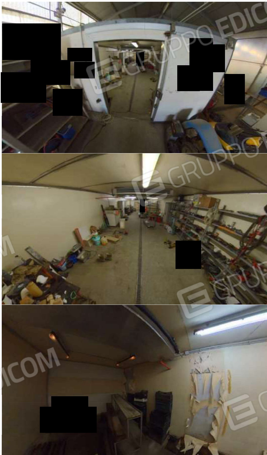
Figura 15 cella frigo Nord-Ovest