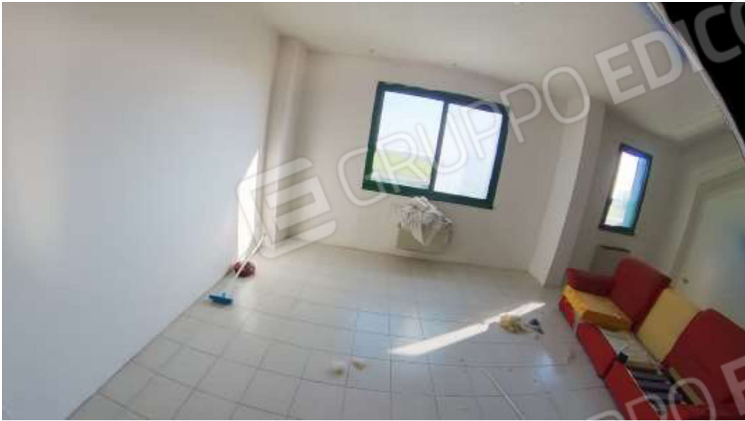
Figura 10 Primo piano mn 119