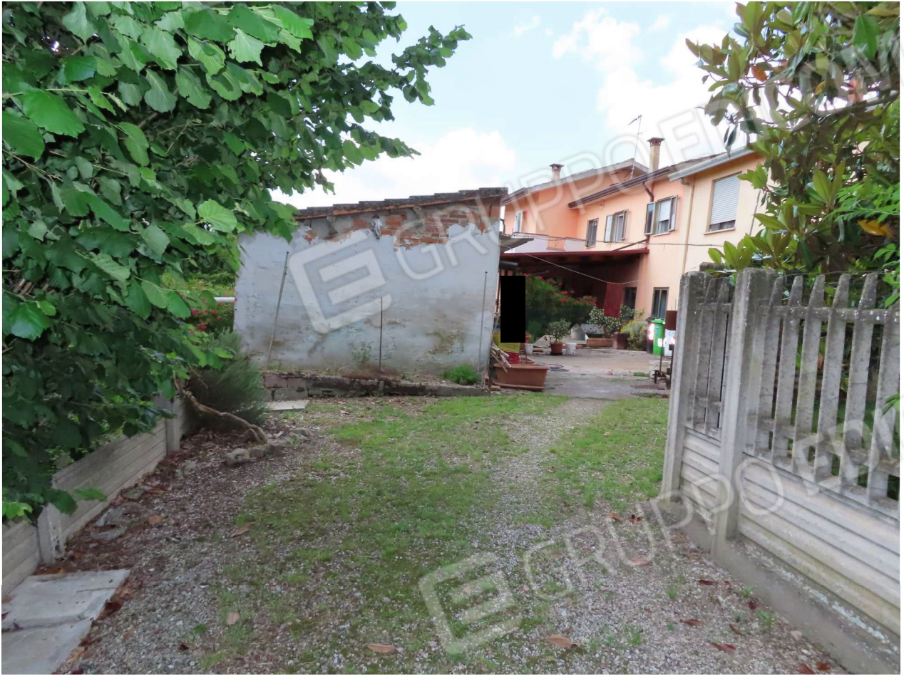
ACCESSO CARRAIO E PEDONALE AL CORTILE SUD