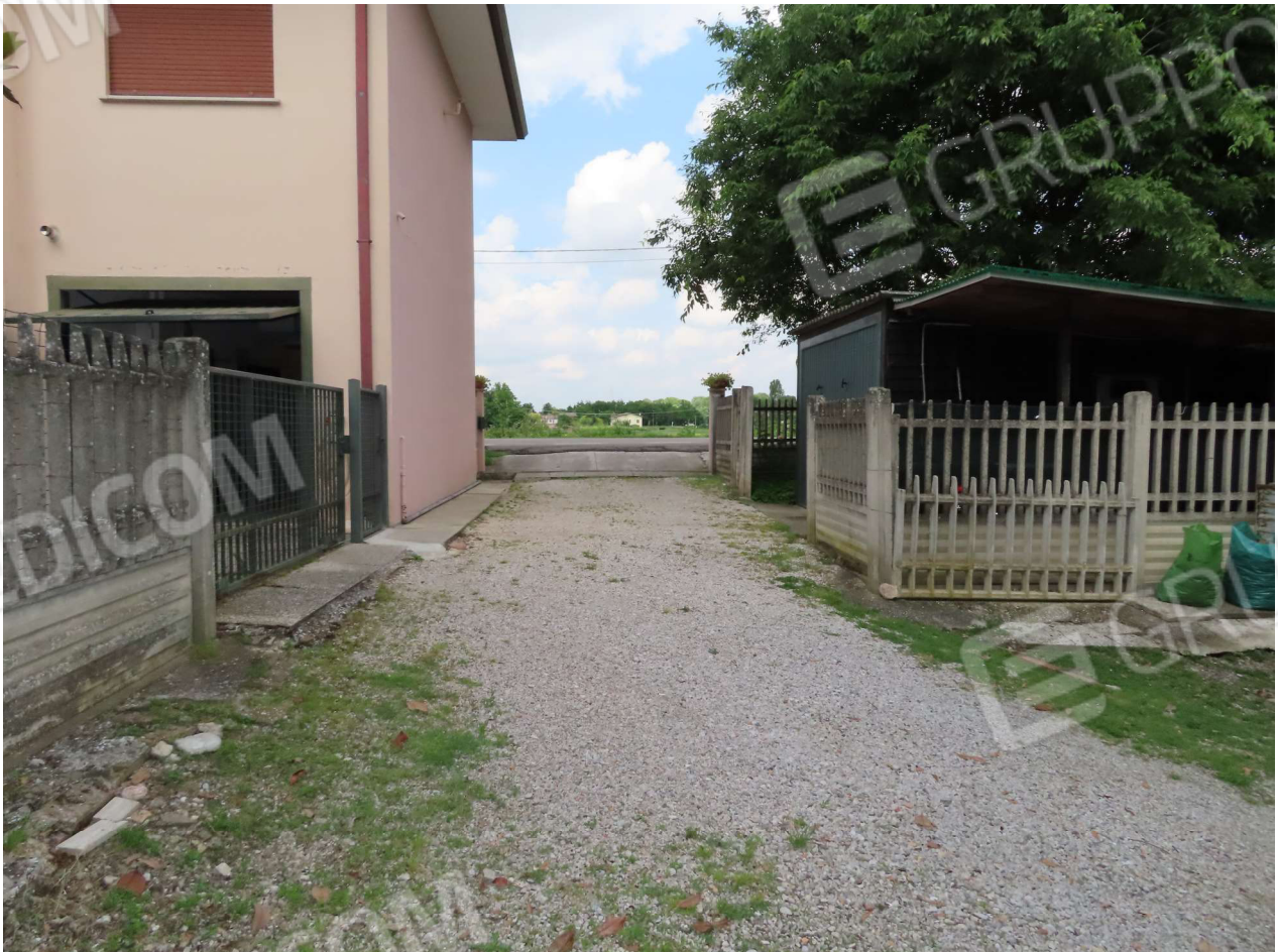
ACCESSO CARRAIO E PEDONALE DA VIA IV NOVEMBRE