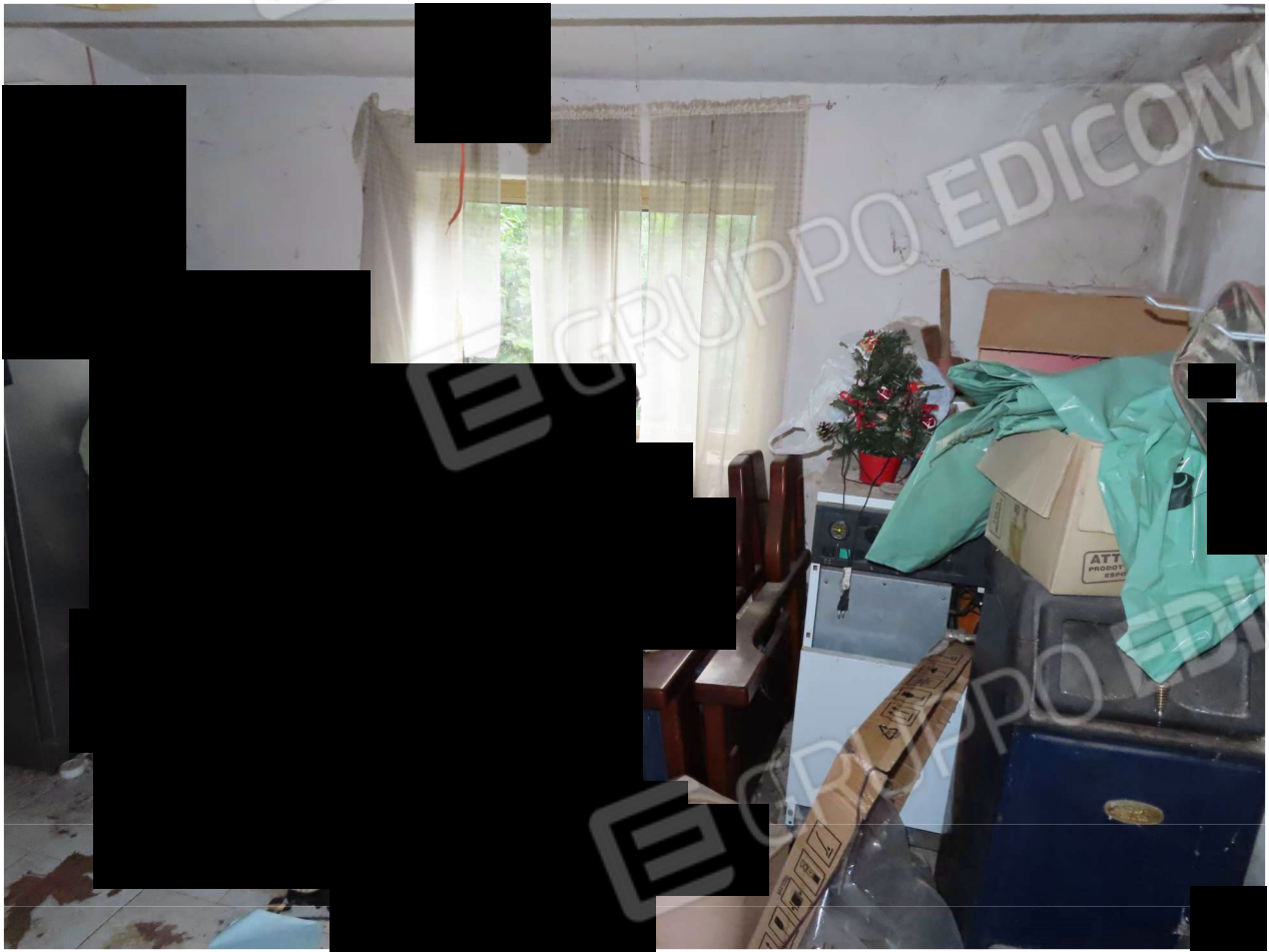
CANTINA ESTERNA CON CALDAIA