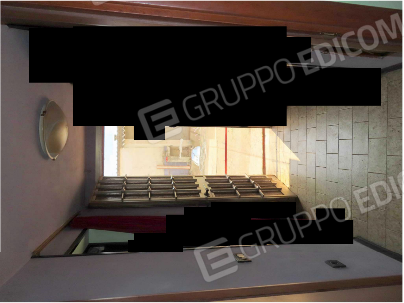
INGRESSO SECONDARIO SUL LATO SUD