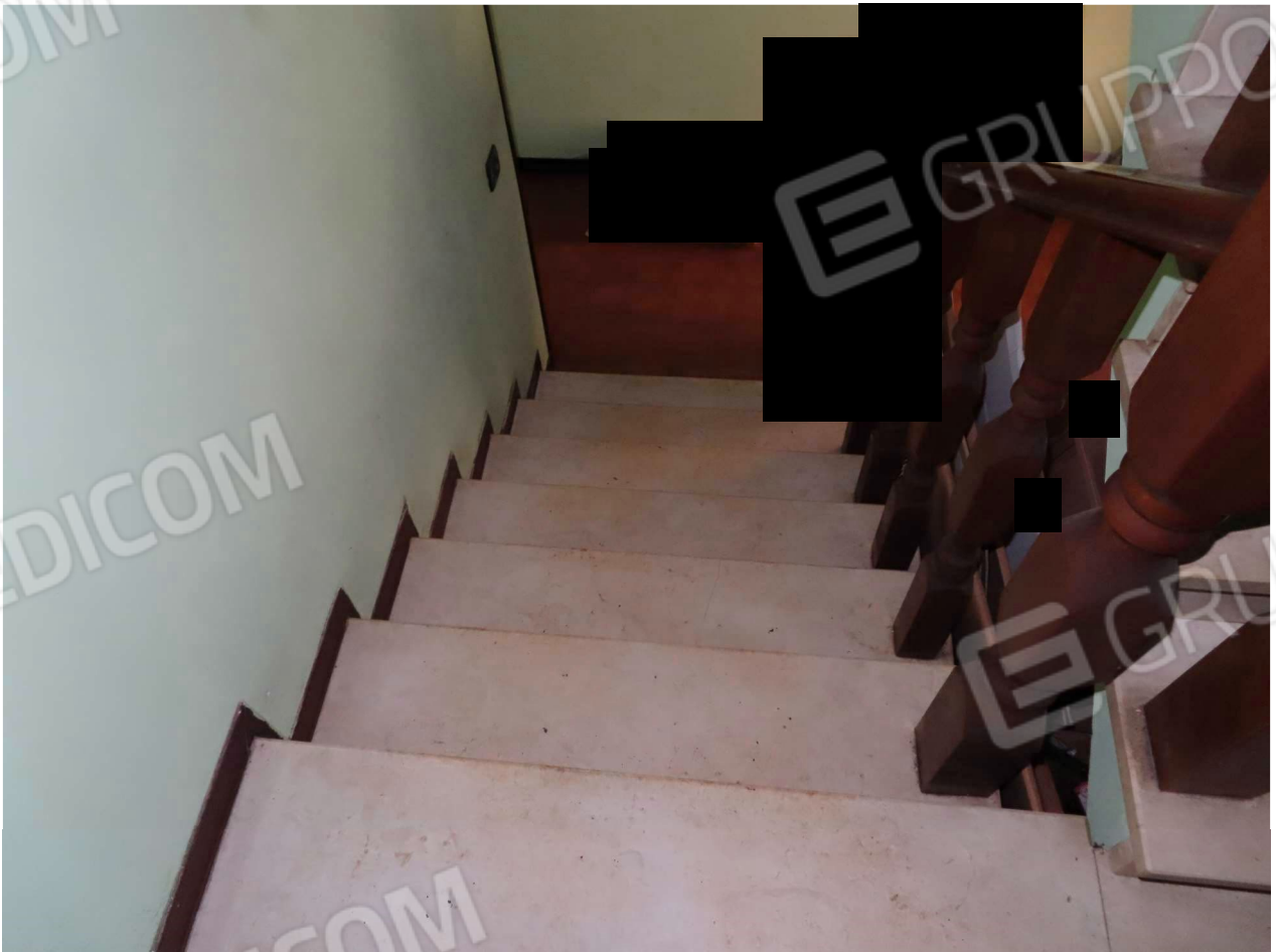
SCALA DI ACCESSO AL PIANO PRIMO