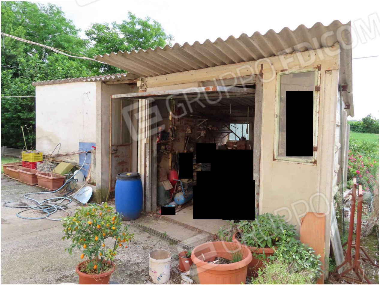
PROSPETTO NORD-EST ACCESSORI ESTERNI