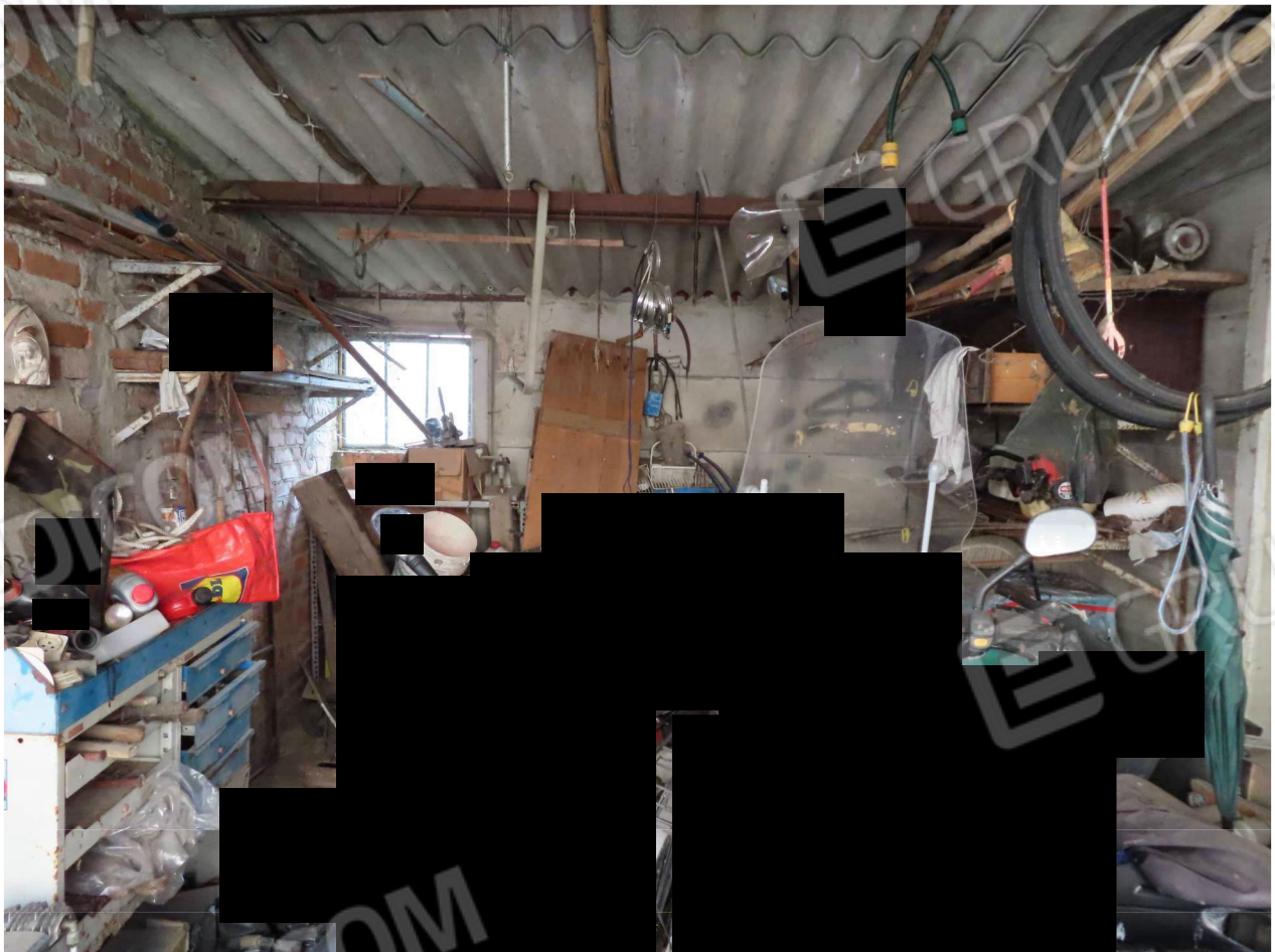
GARAGE ESTERNO ADIACENTE ALLA CANTINA