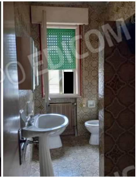
Piano Terra – laboratorio