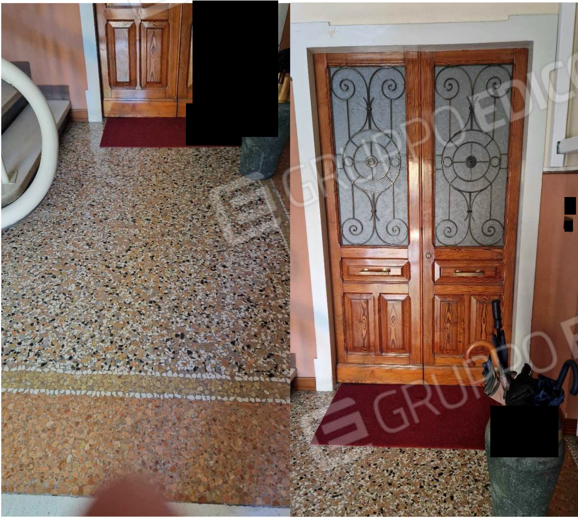
Atrio e entrata principale