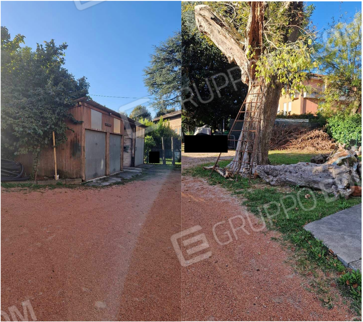
Parte giardino con edificio da demolire in parte e rimozione del container