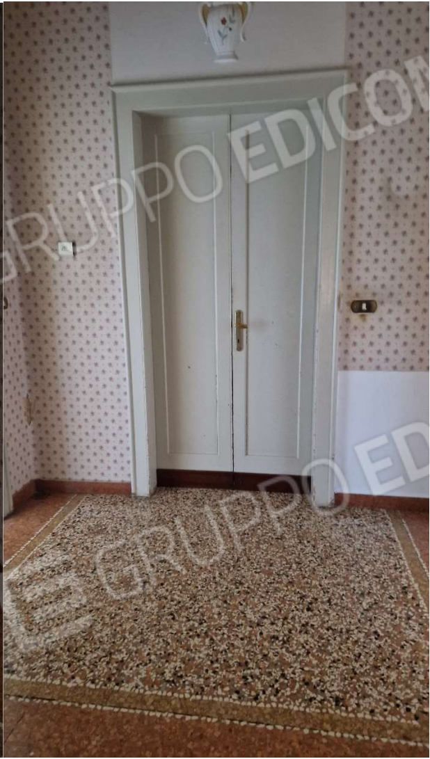
Pavimento immobile pignorato