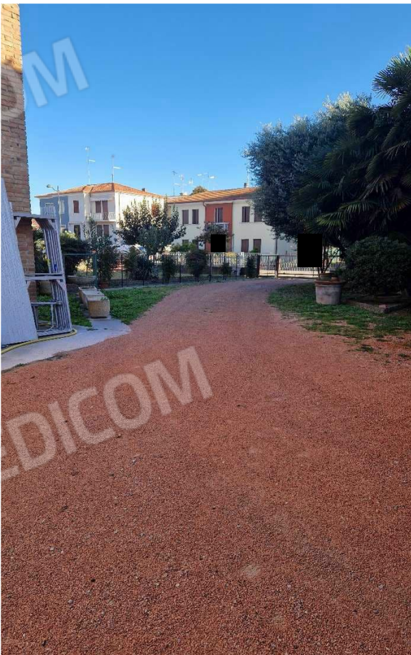
accesso condiviso con altra abitazione