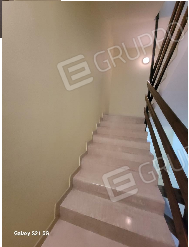
Galaxy S21 5G