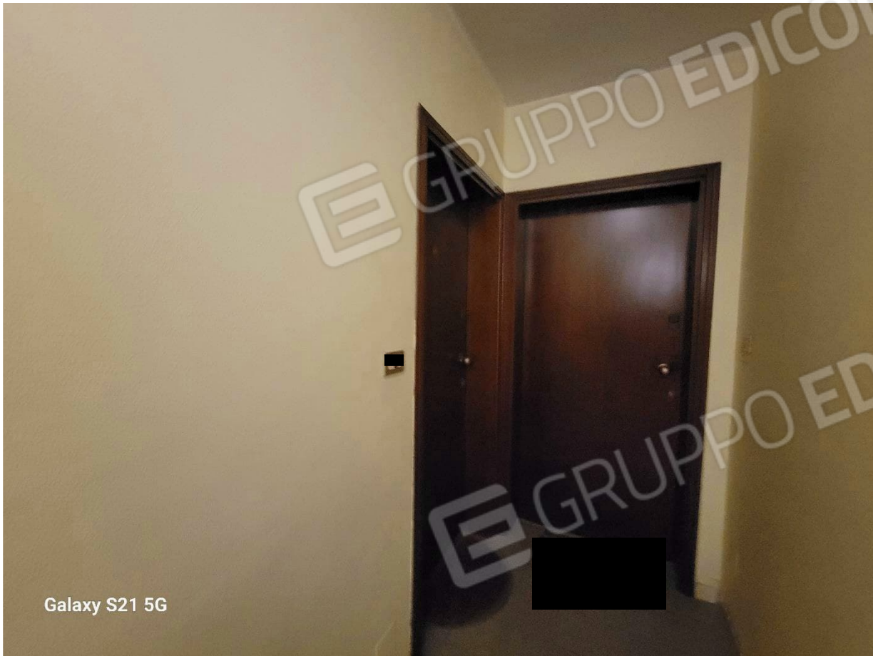
Figura 5 corridoio condominiale