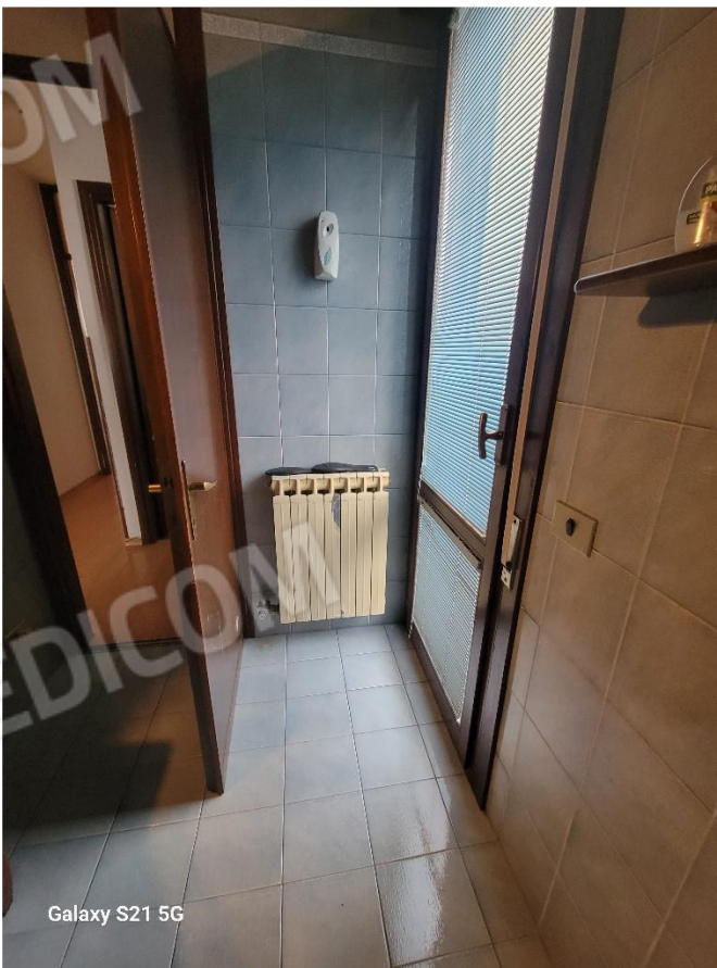
Figura 13 Interni appartamento