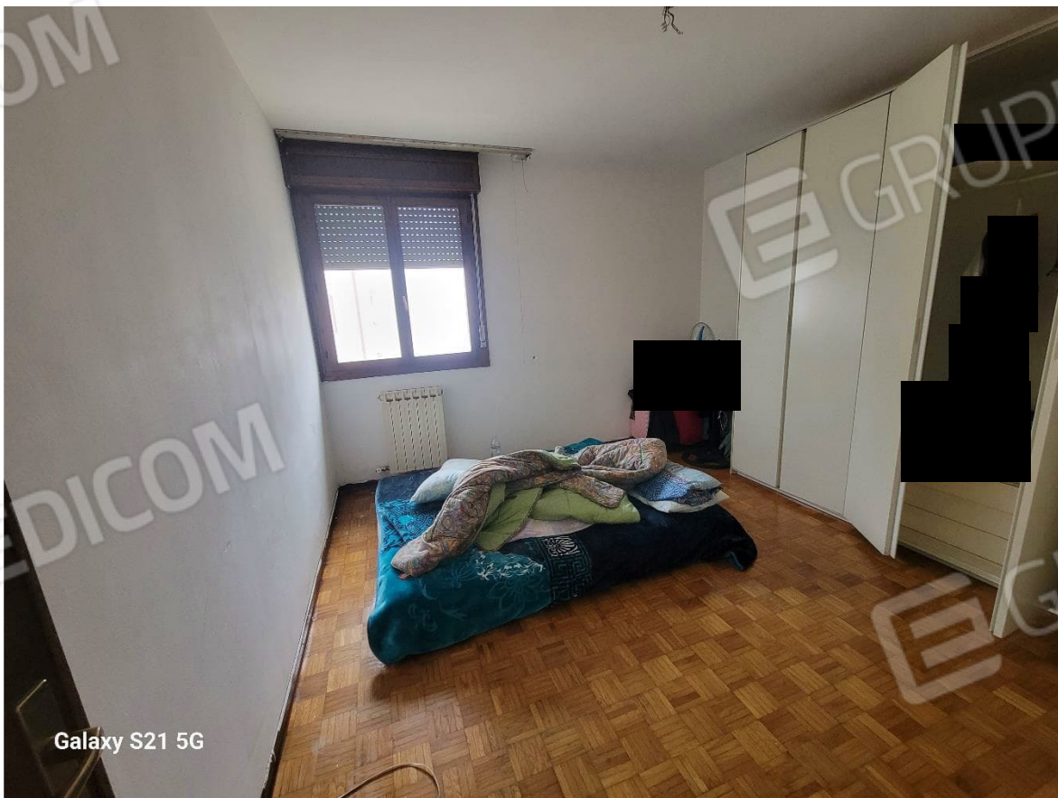
Figura 10 Interni appartamento