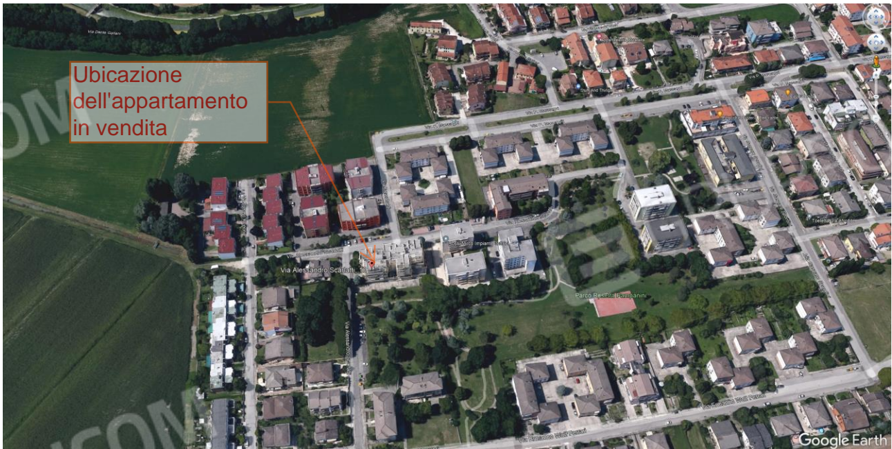
Figura 1 Veduta dall'alto

Giudice Delle Esecuzioni: Dott. MARCO PESOLI