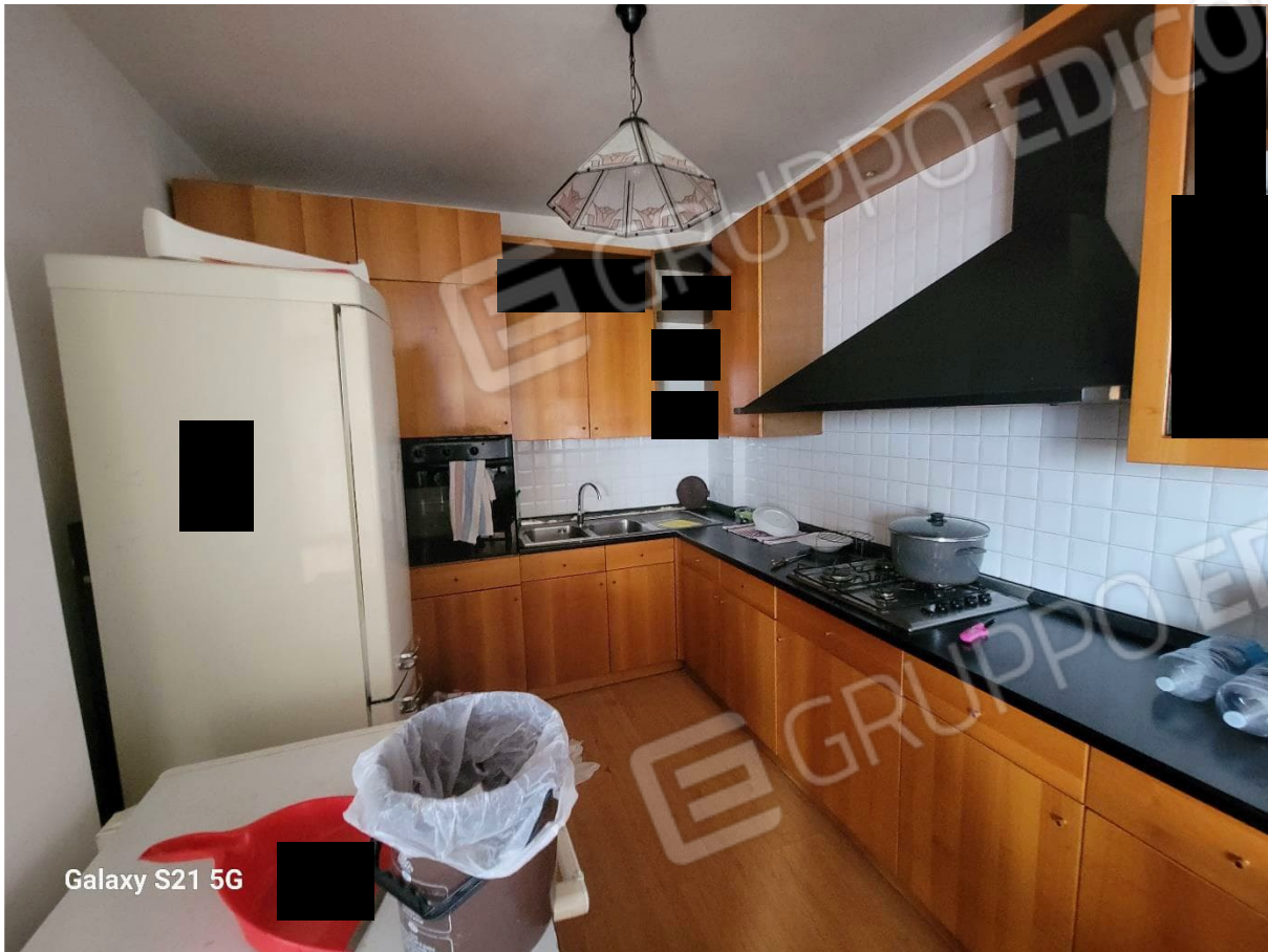
Figura 7 Interni appartamento