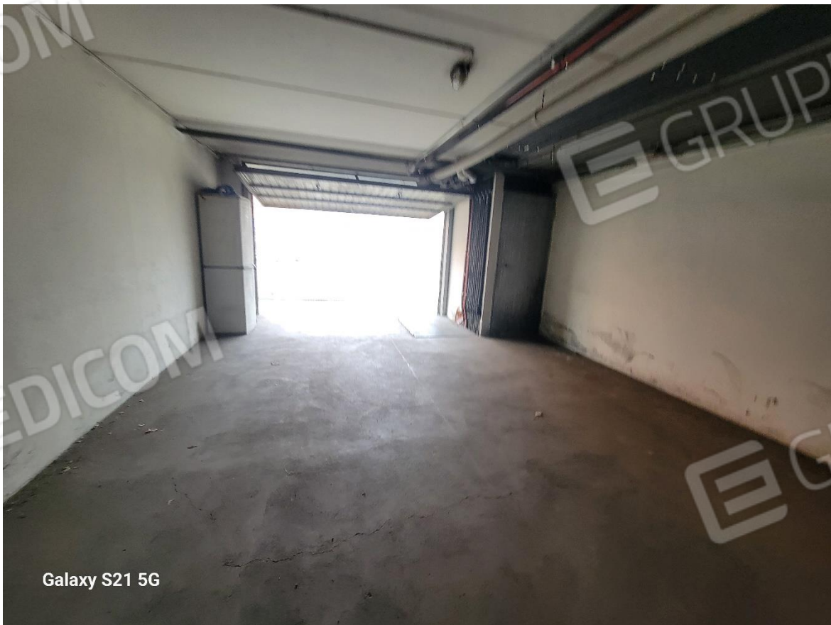
Figura 16 Interno garage da 6 posti auto