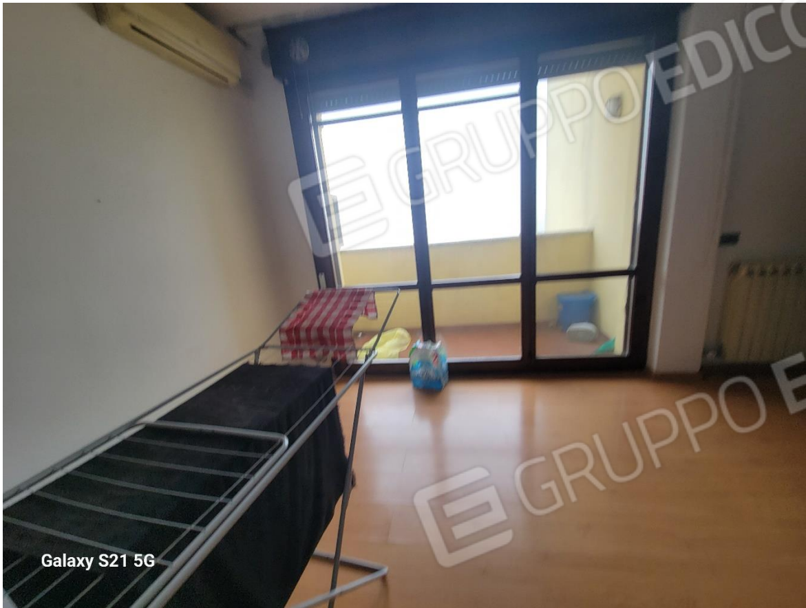
Figura 9 Interni appartamento