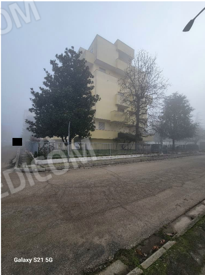
Figura 3 Esterno Lato Ovest