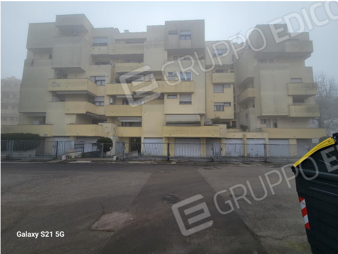
Figura 2 esterno lato Nord