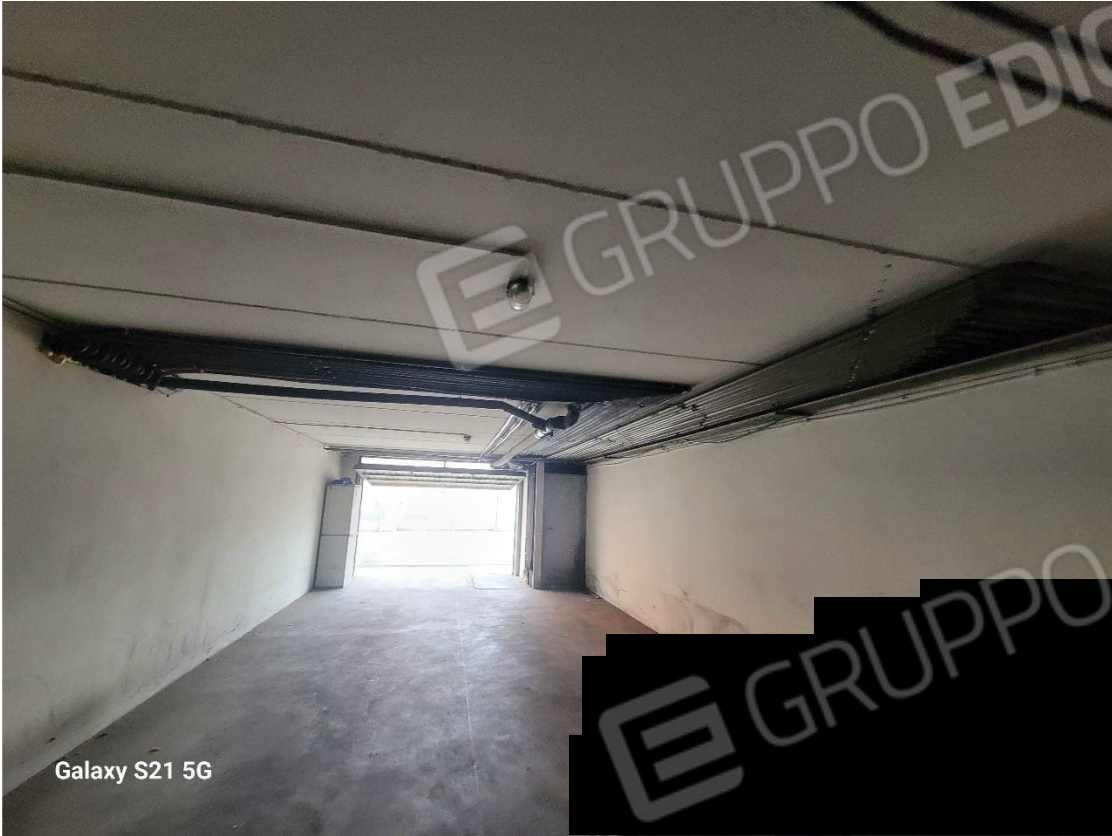
Figura 17 Interno garage da 6 posti auto