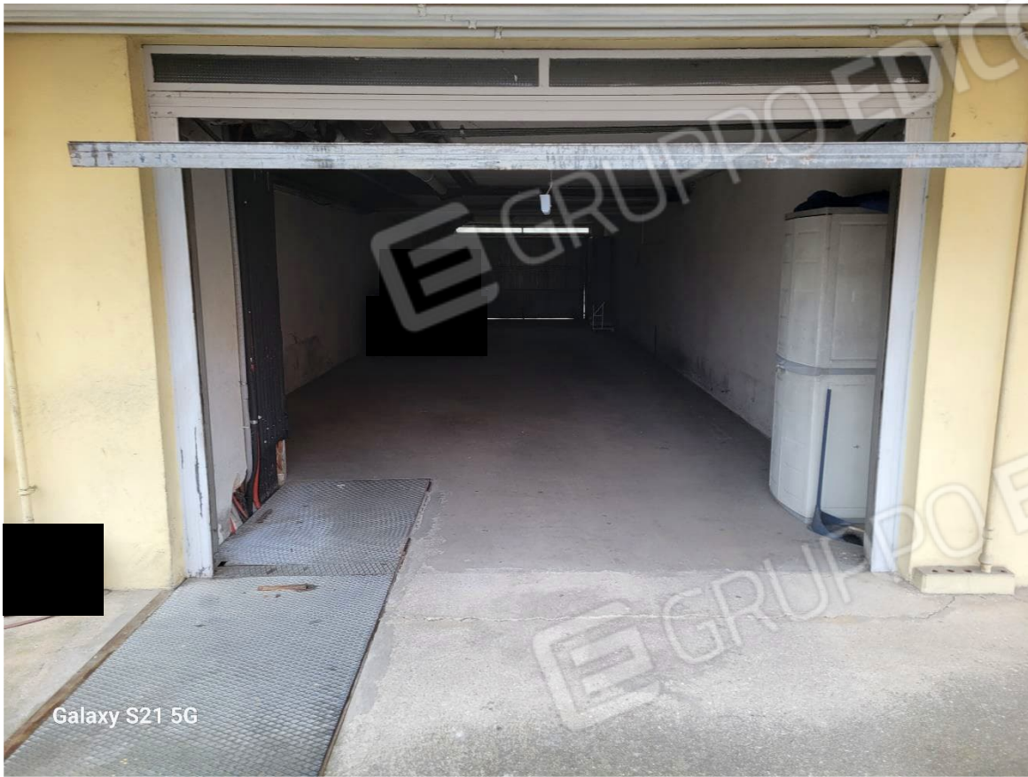
Figura 15 Garage da 6 posti auto