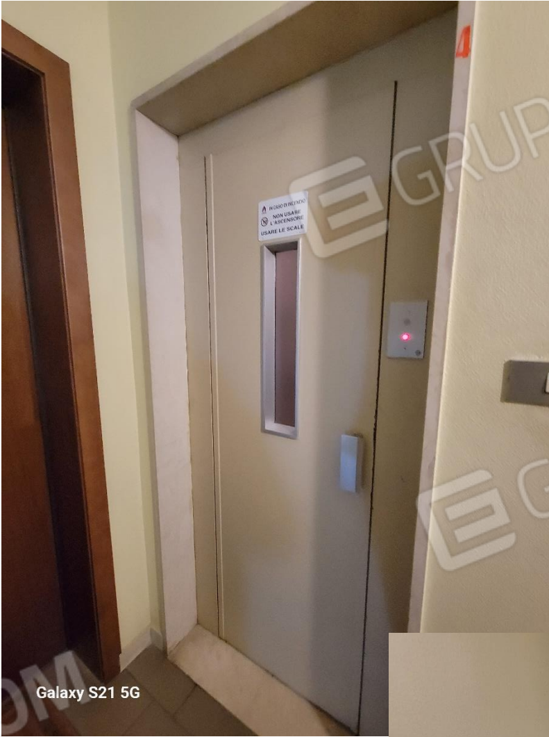
Galaxy S21 5G