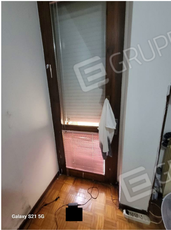
Figura 12 Interni appartamento stanza singola