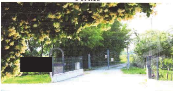
Ingresso comune a tutto il compendio