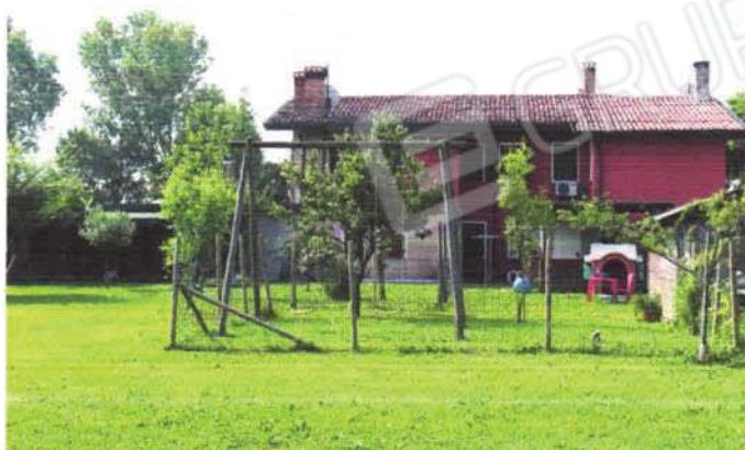
lato retro sub 7