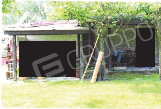
tettoia e corpo abusivi lato est