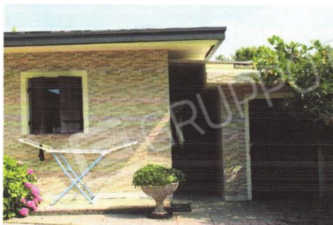
corpo abusivo lato est e tettoia abusiva collegamento sub 5