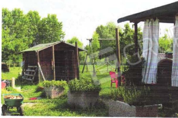
tettoia e casetta abusiva