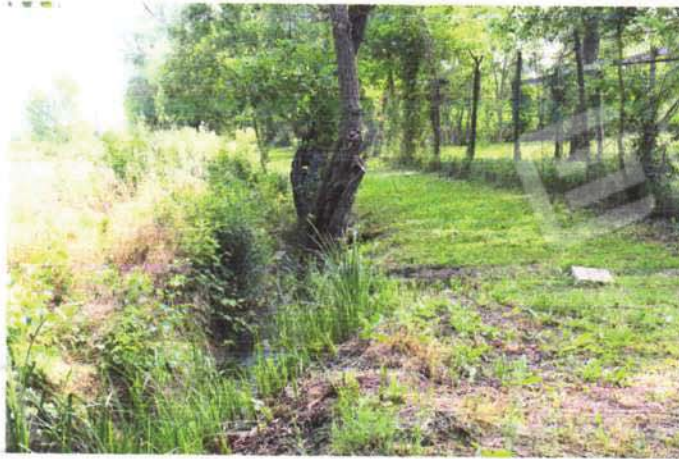
cavino lato nord