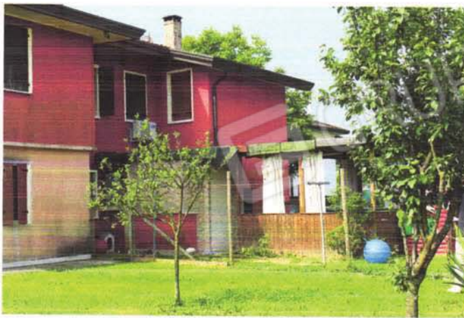
lato sud/cest corpo e tettoia abusivi