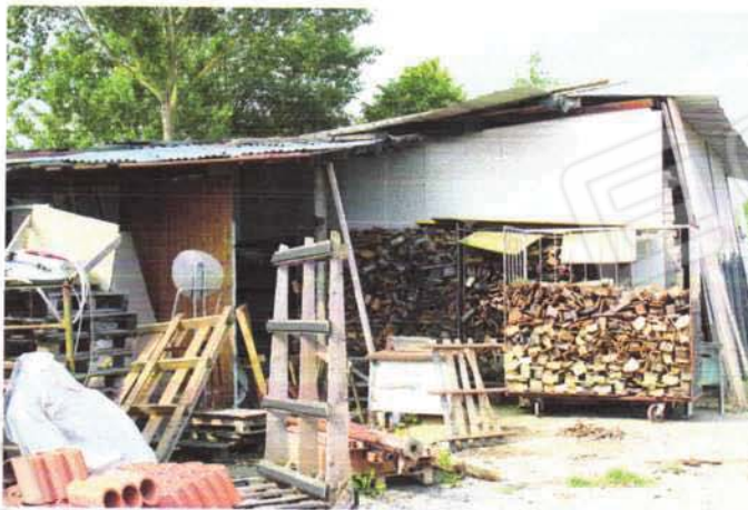
lato ovest-tettoia e vista abuso risdosso lato nord