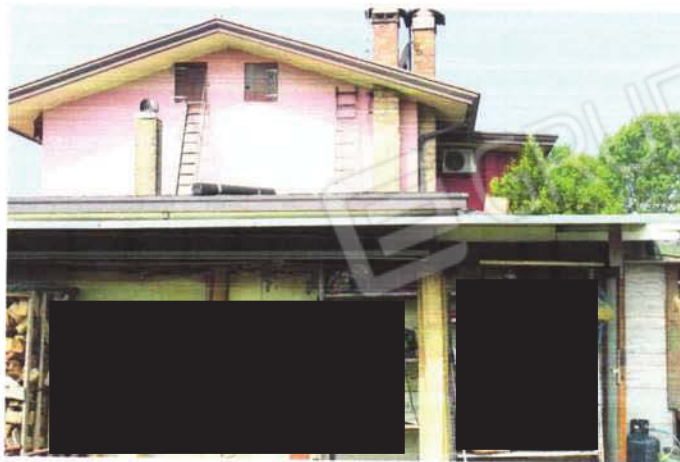
lato est vista tettoia abusiva