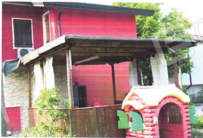
corpo e tettoia abusivi