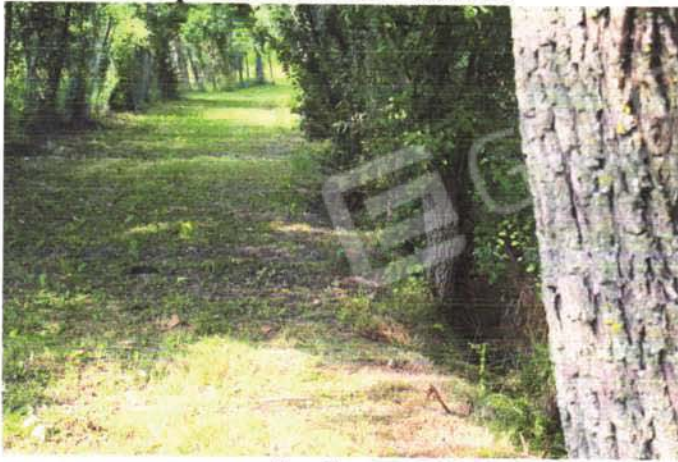
cavino lato nord