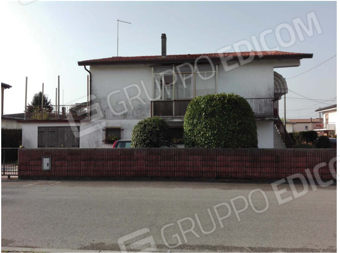
FOTO 4 IMMOBILE LATO NORD SU VIA BARACCA