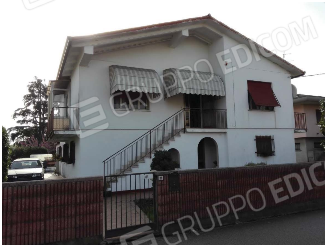
FOTO 2 ACCESSO PEDONALE VIA BERGAMO