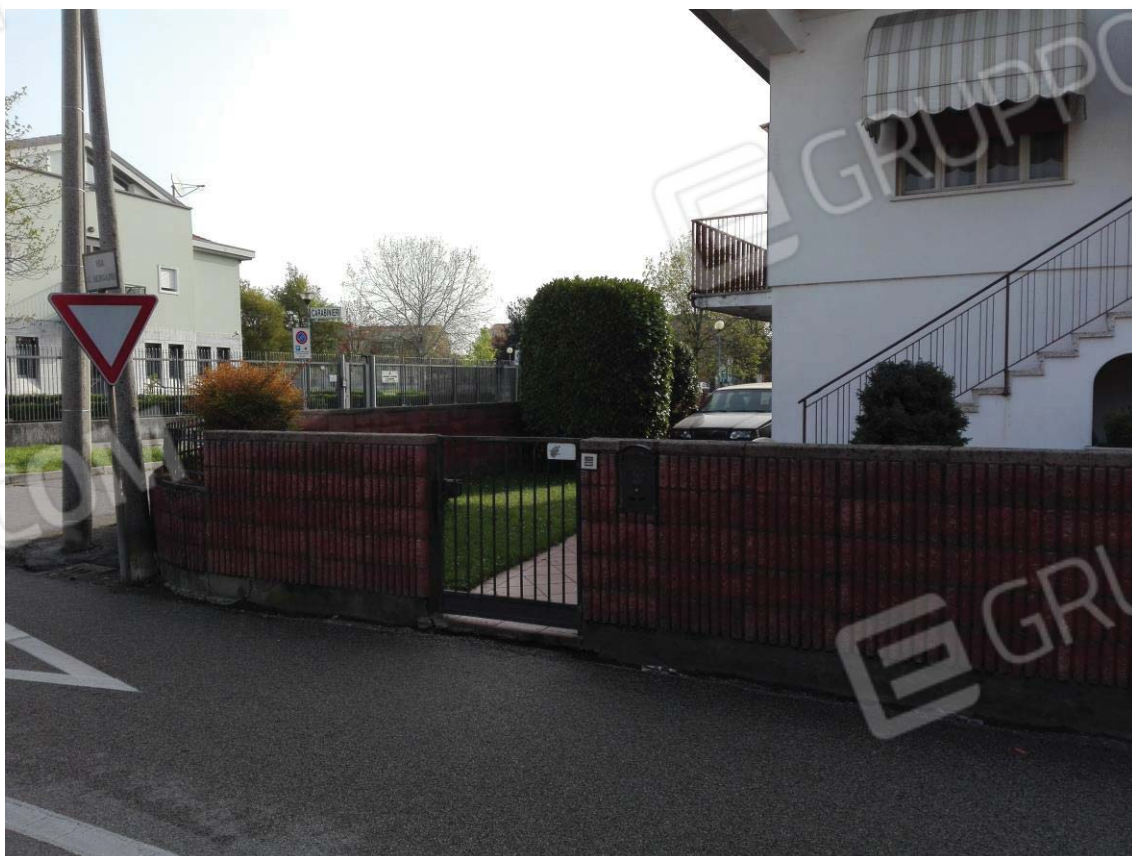
FOTO 1 VIA BERGAMO 36 ACCESSO PEDONALE

PLANIMETRIA CON CONI VISUALI ESTERNO PROPRIETA'