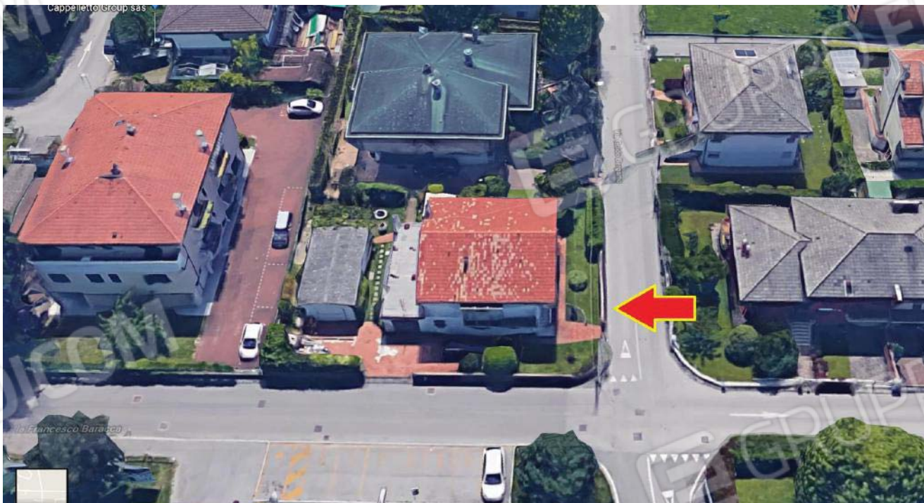
VISTA PROSPETTICA AEREA