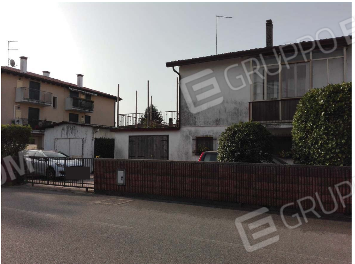
FOTO 5 ACCESSO CARRAIO SU VIA BARACCA