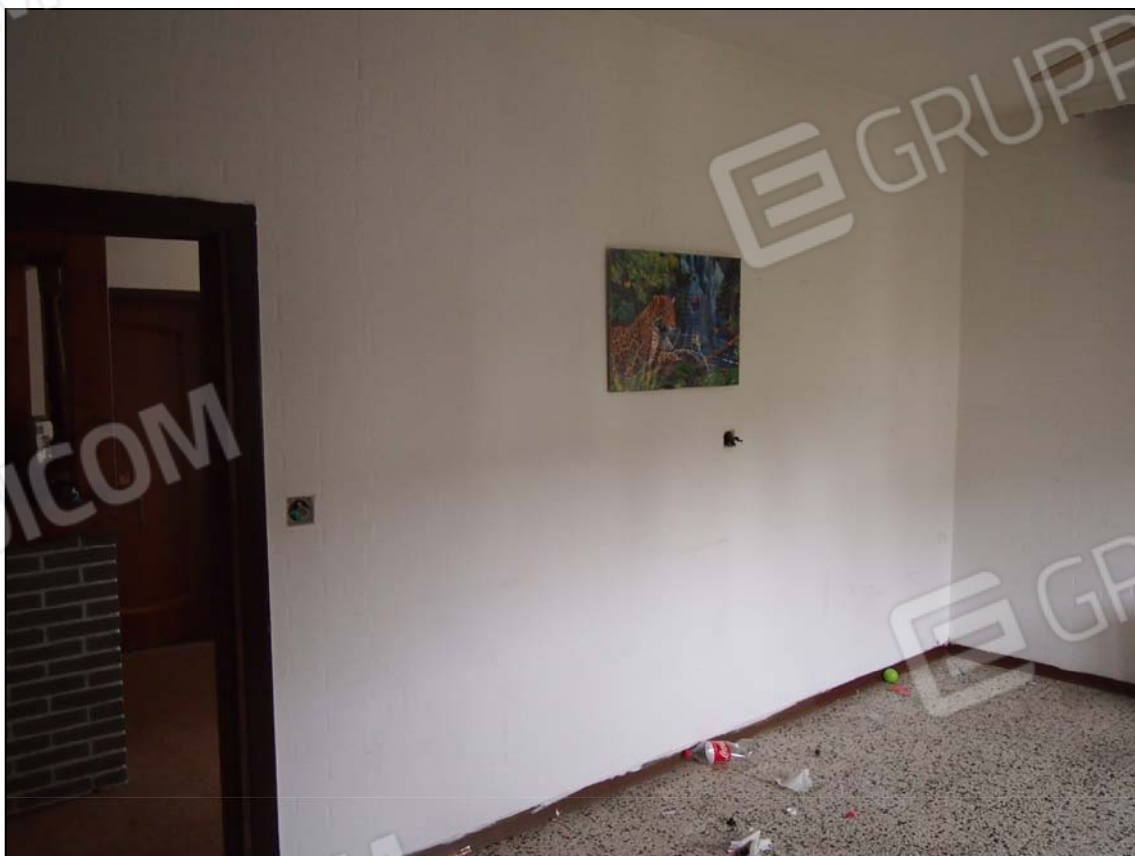
ZONA GIORNO: INGRESSO DALL'ATRIO