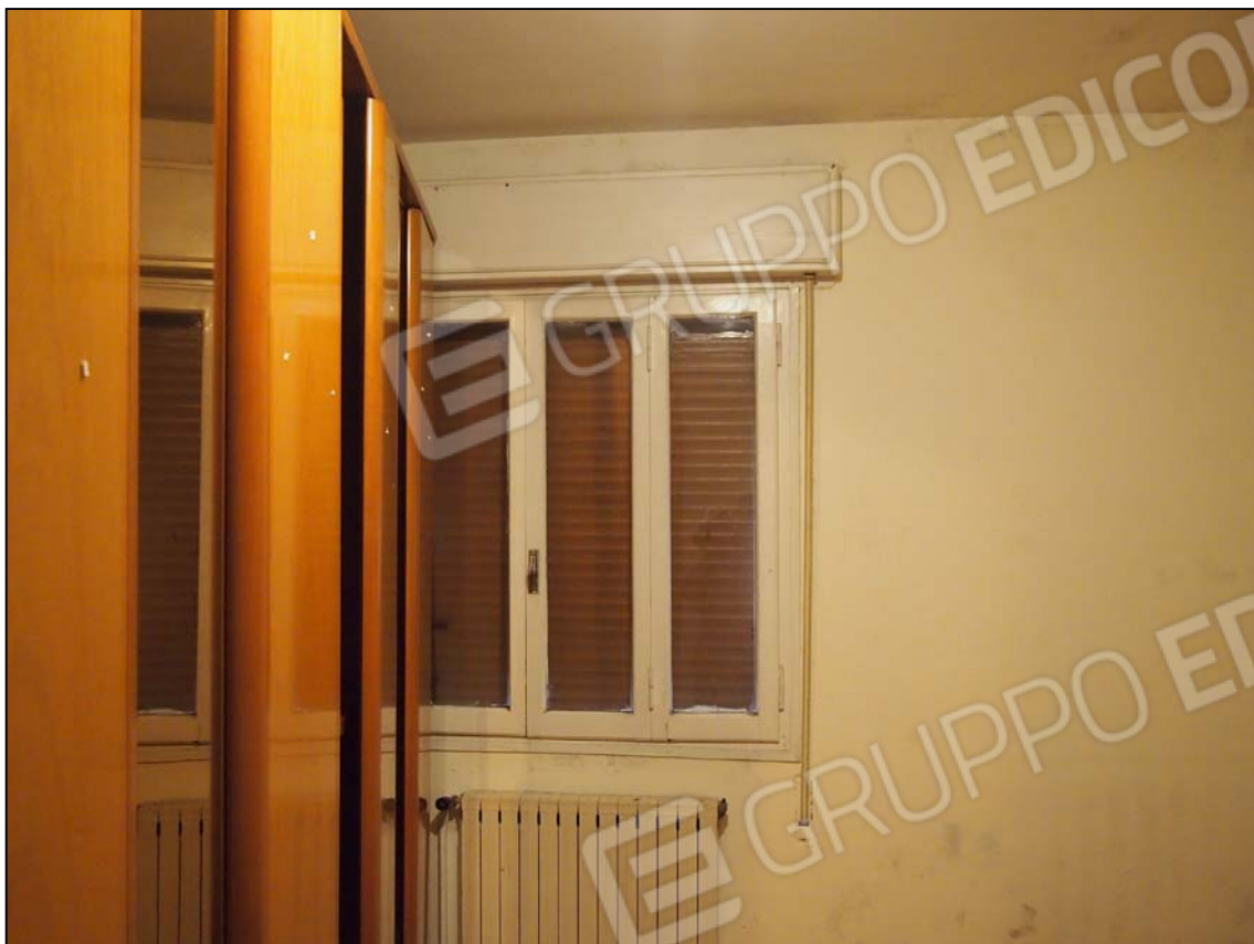
PRIMA CAMERA PARETE A OVEST