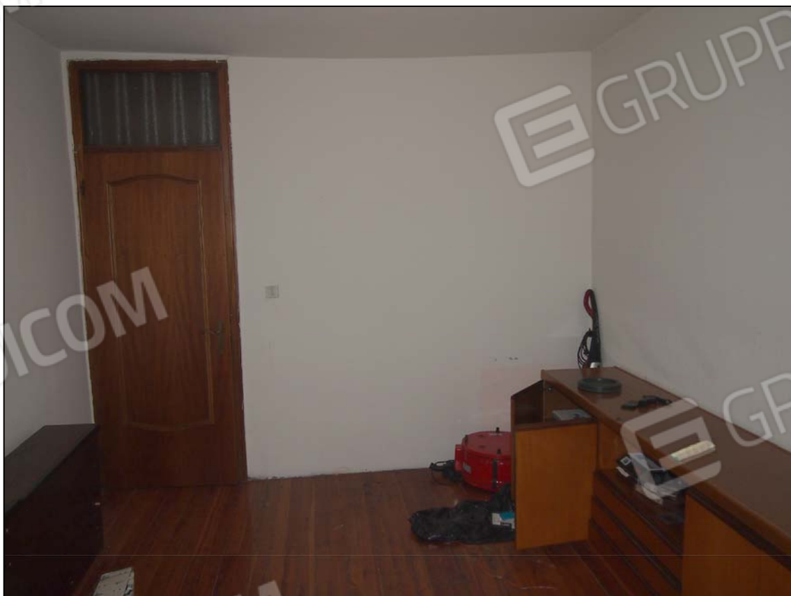
INGRESSO ALLA TERZA CAMERA DAL DISIMPEGNO