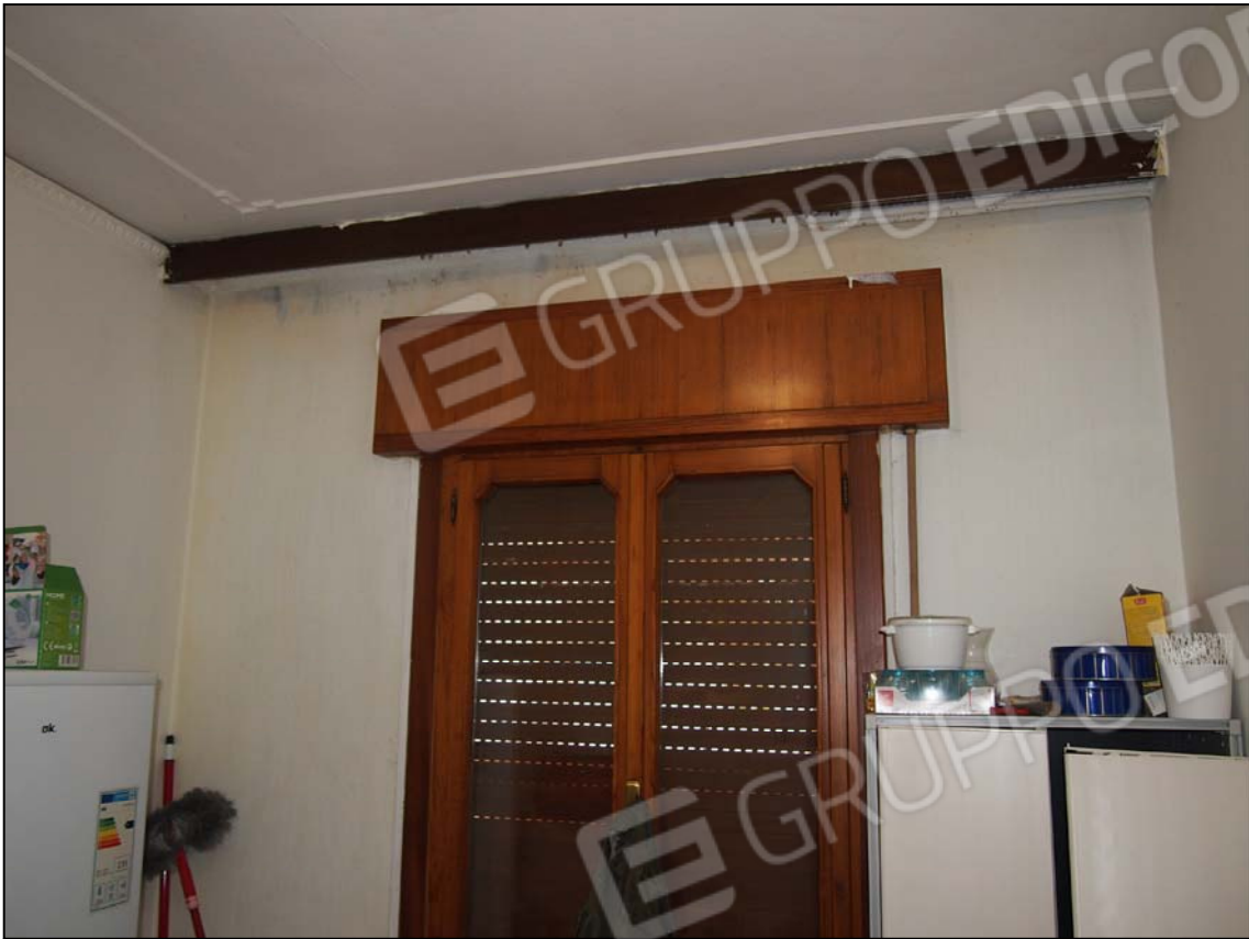
STANZA ADIACENTE LA ZONA PRANZO-SOGGIORNO