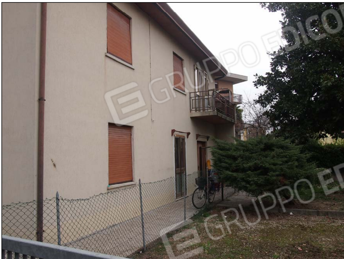
PROSPETTO SUD E PARTICOLARE DELLA LINEA DI CONFINE CON MAPPALE n. 117