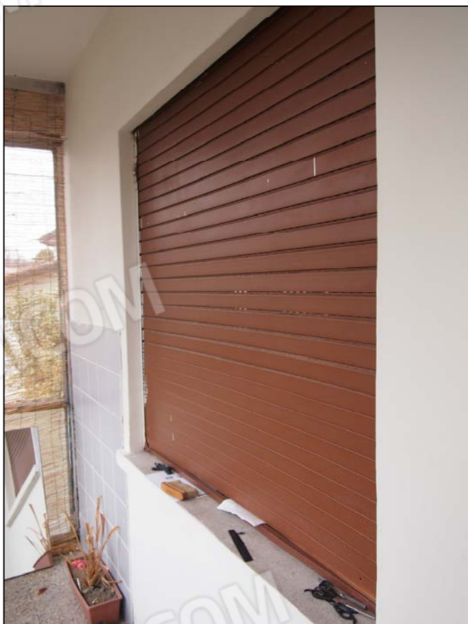
PARTICOLARE FINESTRA DELLA VERANDA CHE ERRONEAMENTE NON E' STATA INSERITA NELLA SCHEDA CATASTALE MA CHE ERA PRESENTE FIN DALL'INIZIO