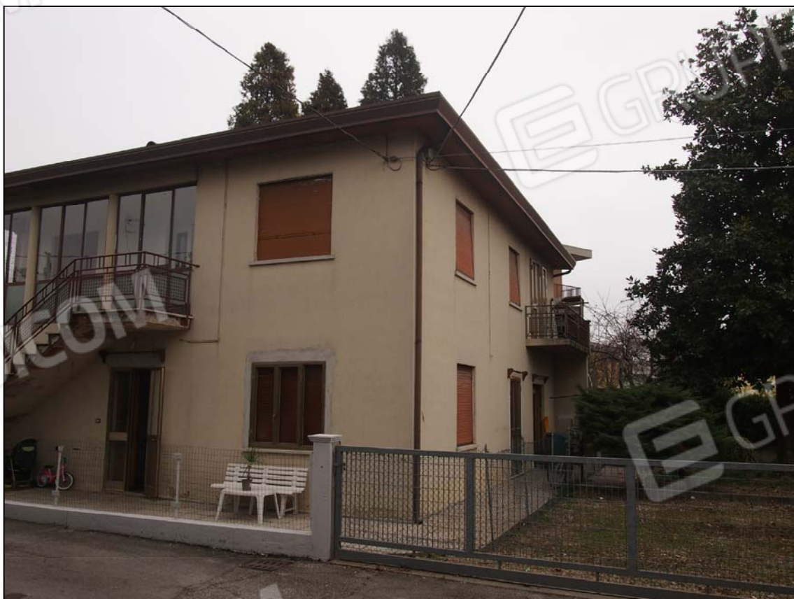
PROSPETTI SUD ed OVEST DA VIA F.LLI BANDIERA