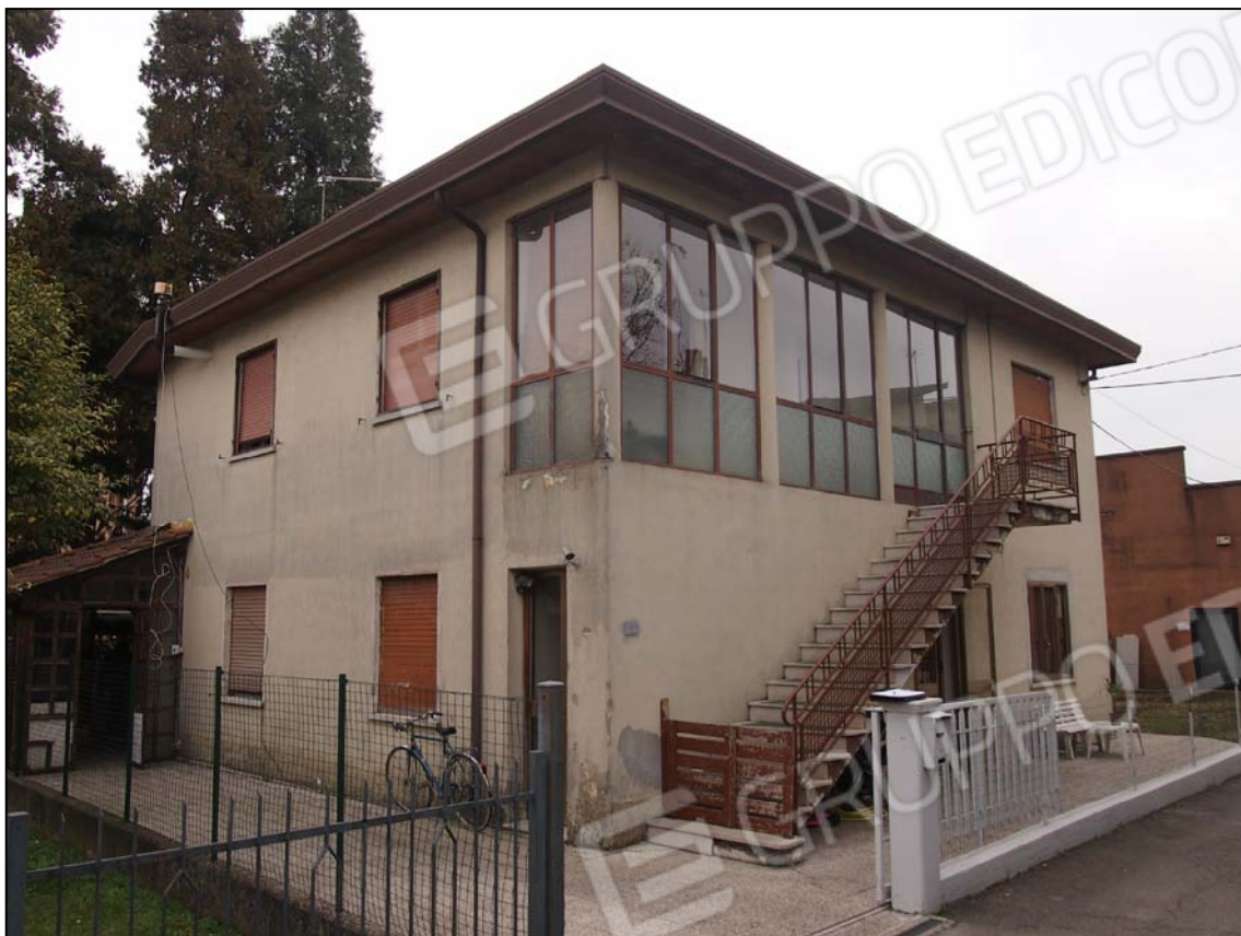
VISTA ACCESSO CARRAIO E PEDONALE DA VIA F.LLI BANDIERA