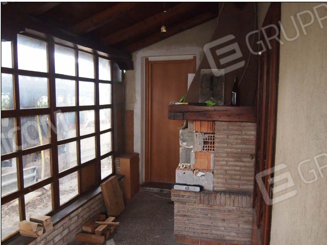
INTERNO PORTICATO SULLO SFONDO L'ACCESSO AL BAGNO DEL P.T.