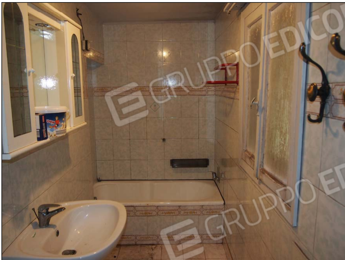
LOCALE BAGNO PARTICOLARE DEL SERRAMENTO VETUSTO