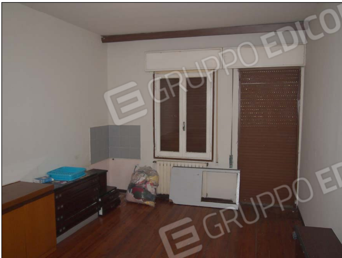
TERZA CAMERA (EX SOGGIORNO) PARETE A SUD