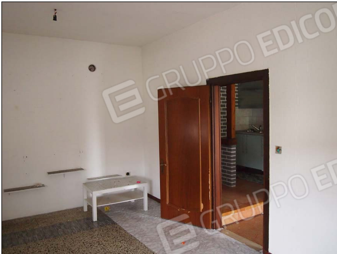
ZONA GIORNO PARETE AD EST LIMITROFA AL LOCALE BAGNO