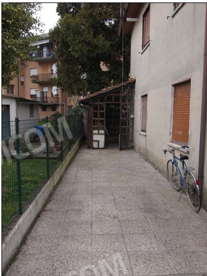
AREA SCOPERTA LATO NORD