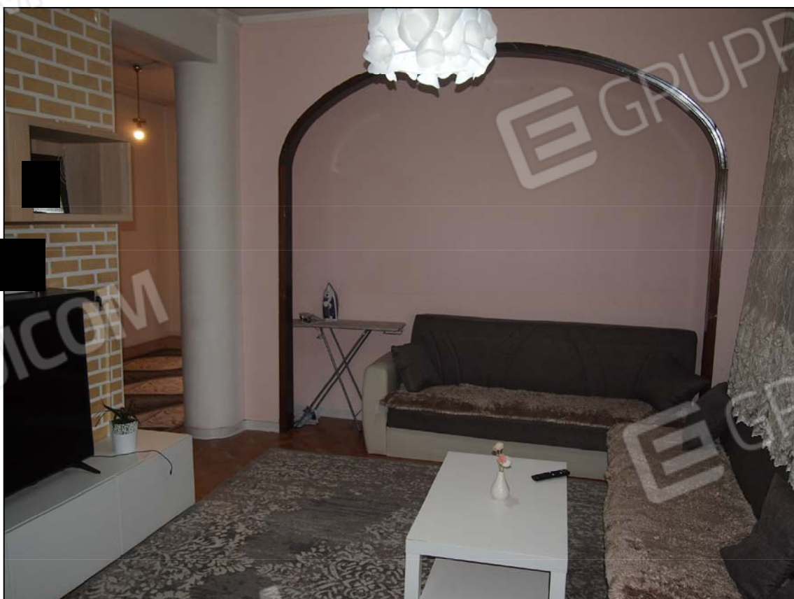
PARTICOLARE NICCHIA DELLA ZONA PRANZO-SOGGIORNO