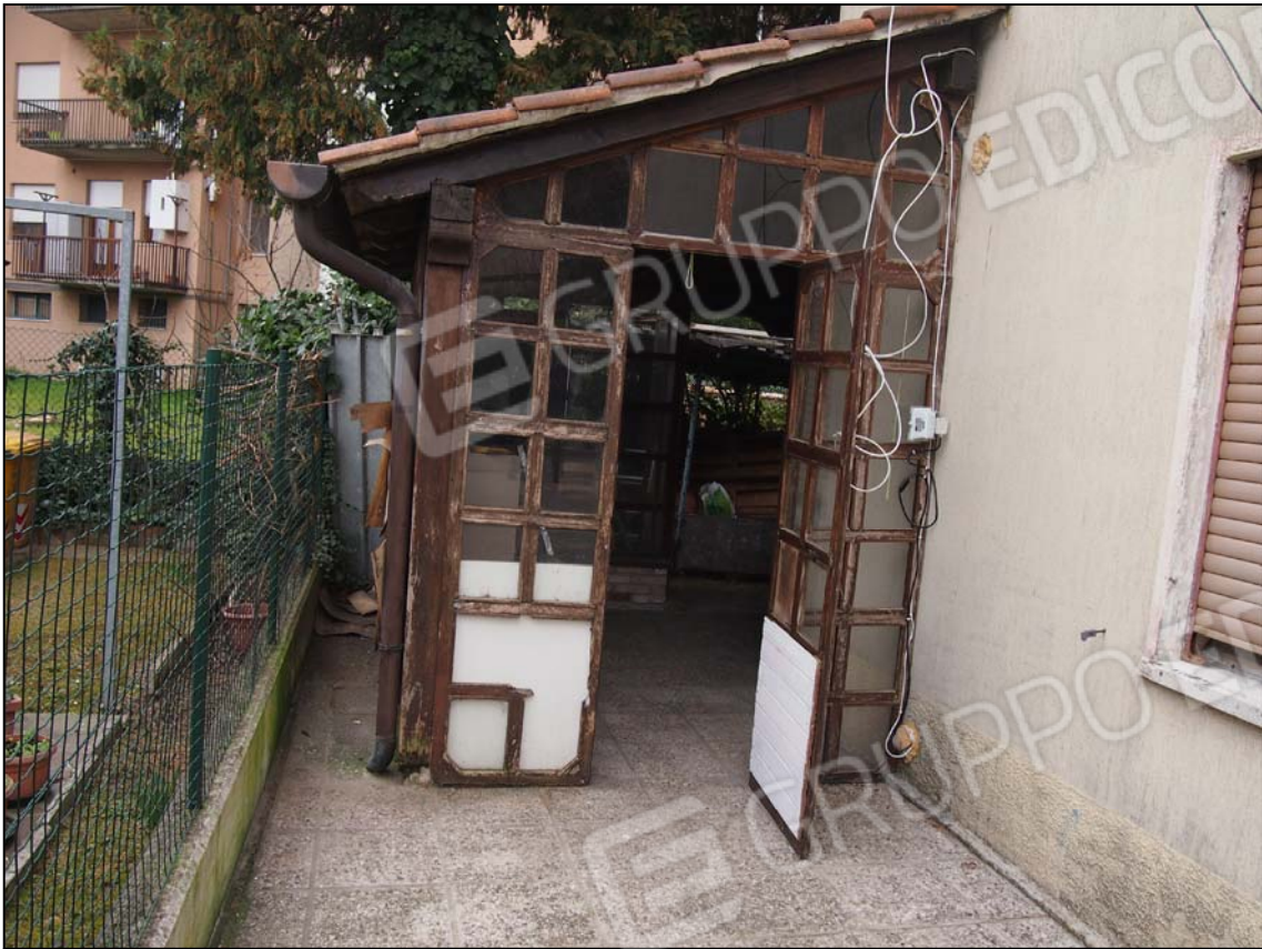
ACCESSO PORTICATO POSIZIONATO SUI LATI NORD ed EST