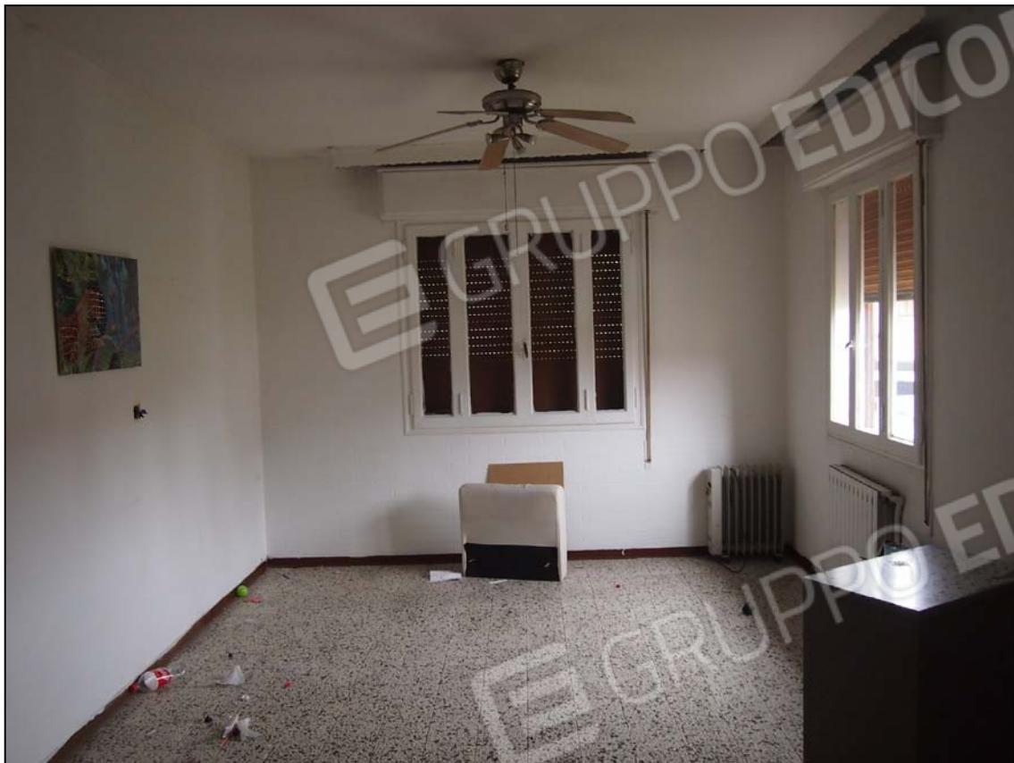
VISTA DELLA ZONA A GIORNO IN DIREZIONE OVEST