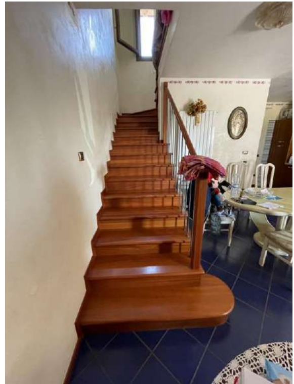
foto 8 scala