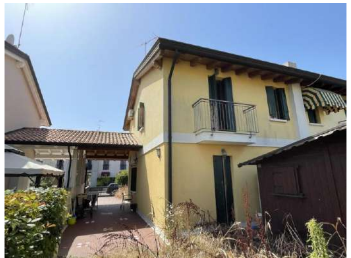
foto 14 facciata est