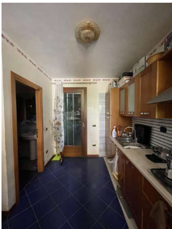
foto 5 zona cucina