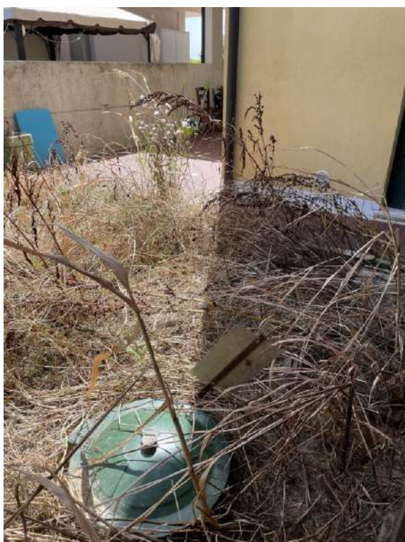
foto 17 particolare con bombolone gas GPL