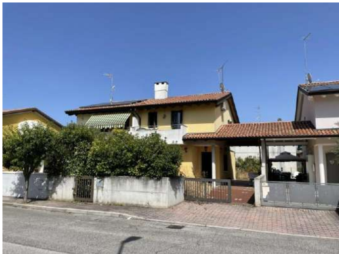
foto 1 ingresso al lotto da ovest