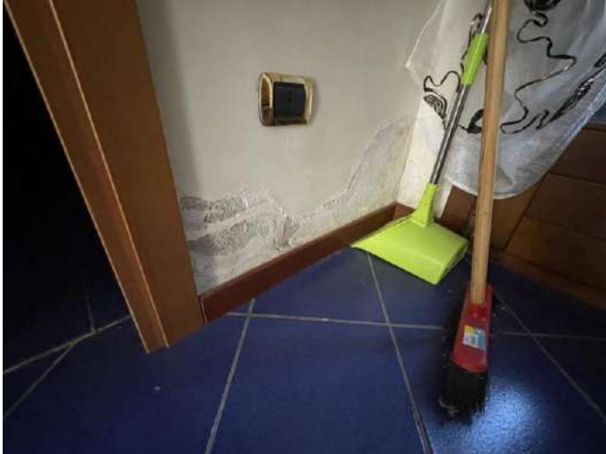
foto 7 particolare muratura del piano terra