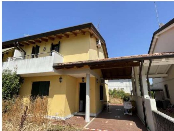
foto 2 facciata ovest