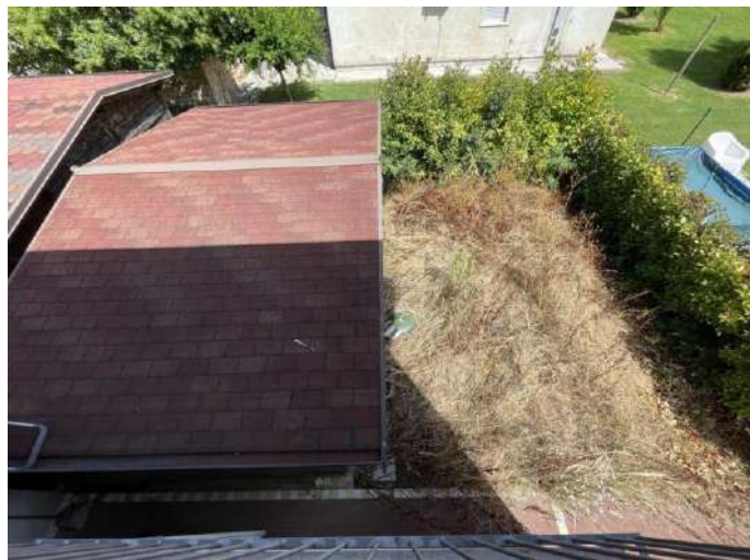
foto 16 vista su area scoperta vs est