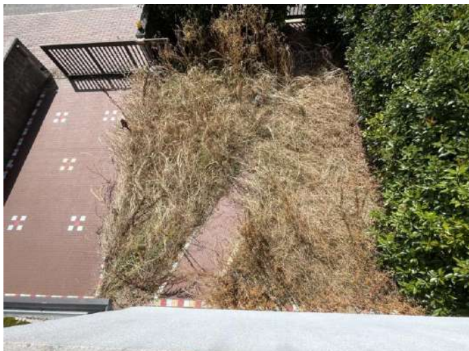
foto 15 vista su area scoperta vs ovest