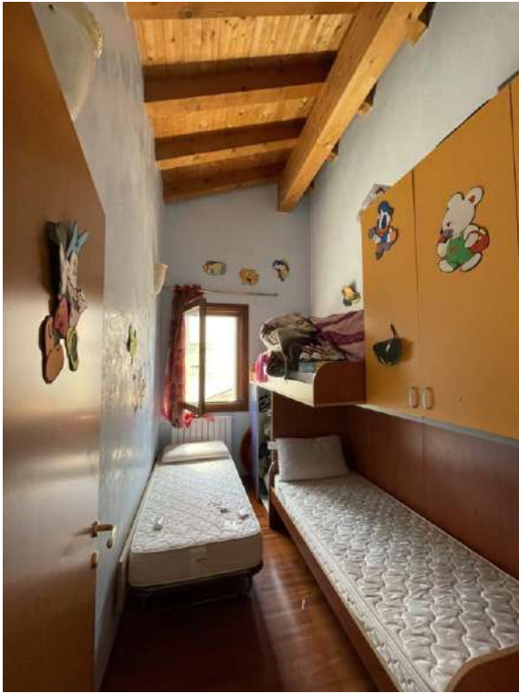
foto 11 locale utilizzato come camera