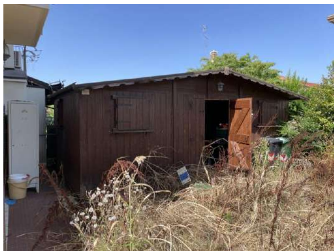
foto 18 casetta per attrezzi