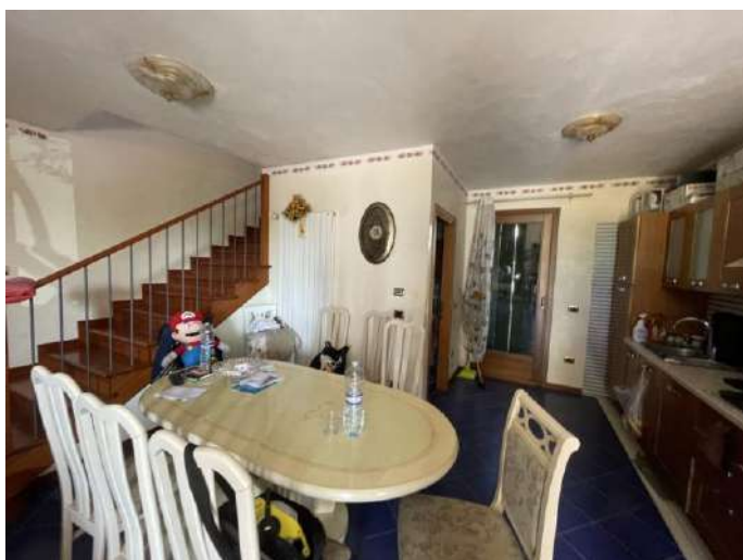
foto 3 cucina-soggiorno