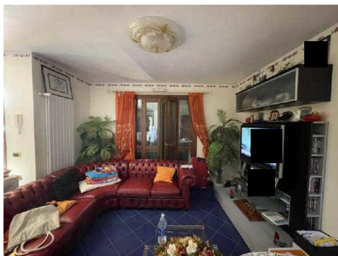
foto 4 zona soggiorno