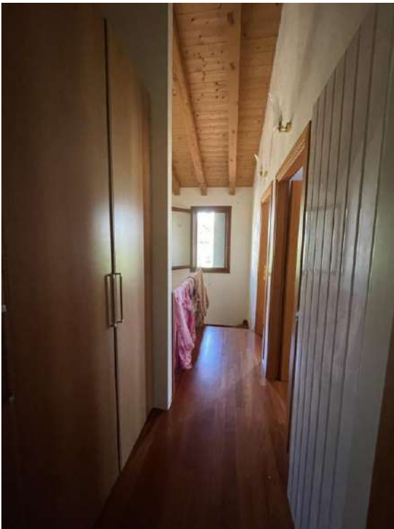
foto 9 disimpegno piano primo