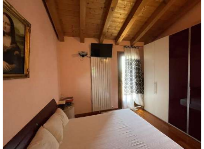
foto 12 camera doppia vs est