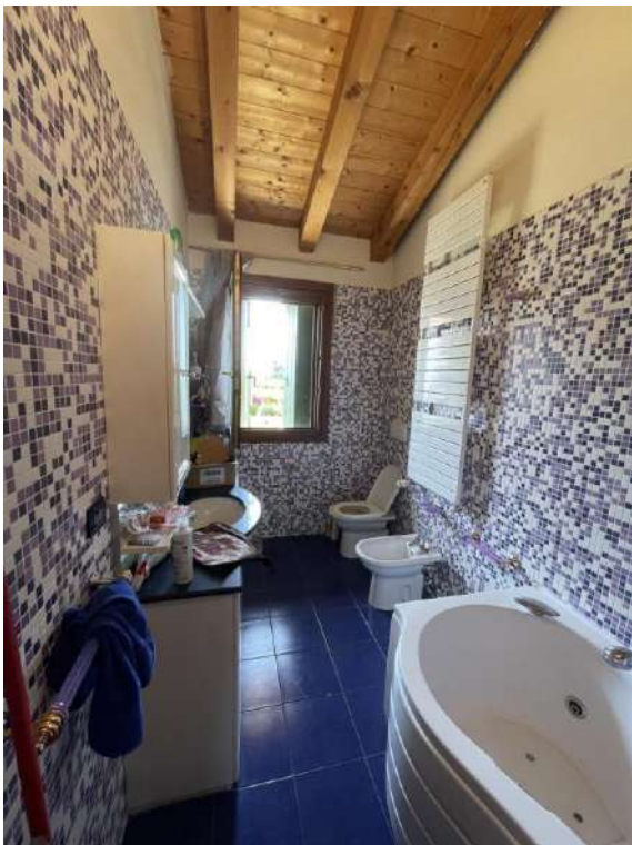
foto 13 bagno