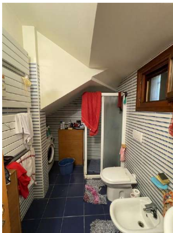
foto 6 bagno-lavanderia