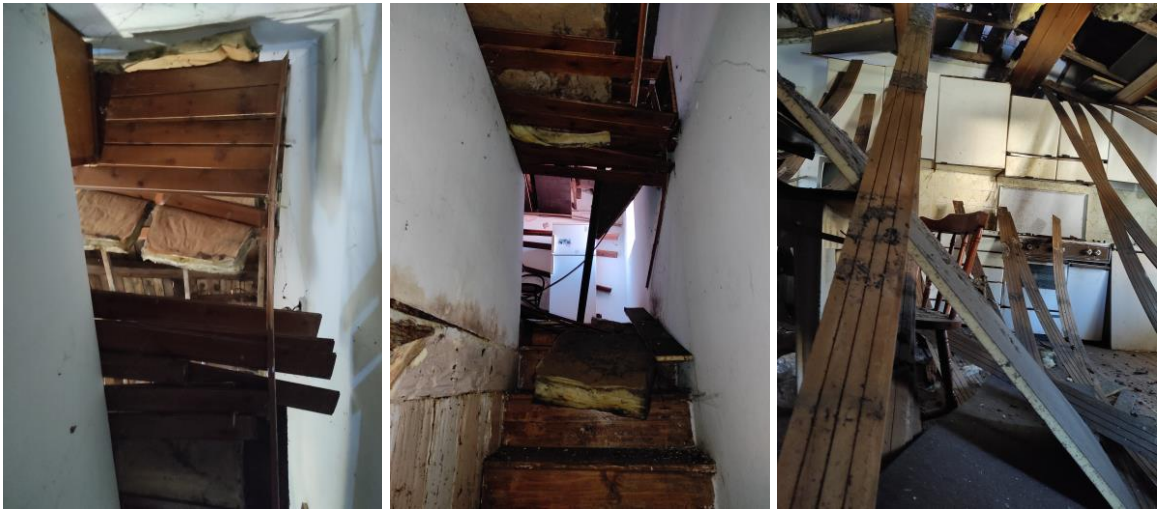
Mn. 1380 sub. 5: scala interna e vista sulla zona giorno

tavia, poiché parte della copertura era crollata anche sulla scala pertinenziale (come si evince dalle foto sotto riportate), ne risultava inibito l'uso.