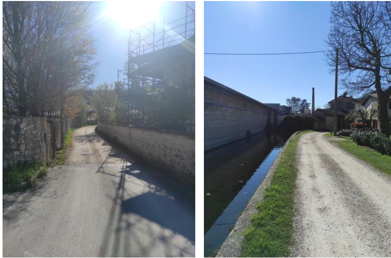
Innesto Via Molini (in sassi) su Via A. Calcinoni (asfaltata) - Via Molino

Come già anticipato, nel corso del sopralluogo svolto con il Custode giudiziario in data 04/04/2023 la scrivente ha potuto riscontrare che l'immobile pignorato era in stato di abbandono, così come l'unità immobiliare sottostante, proprietà di terzi; in tale occasione la scrivente ha potuto realizzare solo un rilevato parziale dello stato dei luoghi (vd. Allegato 3) in quanto nell'ispezione interna del fabbricato si è preso atto del crollo di parte della copertura del fabbricato sul bene pignorato e sui solai intermedi che, ammalorati a causa delle infiltrazioni provenienti dal tetto, rendevano impossibile garantire l'accesso in sicurezza all'alloggio stesso.