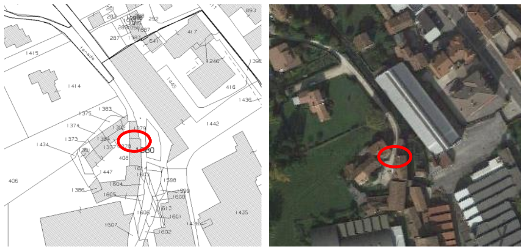
Estratto di mappa e fotogrammetria aerea

Confini : il mappale n. 1380 confina a NORD con il mn. 1379 sub. 5 (garage proprietà di terzi e dell'Esecutato 1 in quota parte, non oggetto di pignoramento); a EST con un torrente; a SUD con il mn. 1614 (residenziale proprietà di terzi); ad OVEST con il mn. 408 (area urbana proprietà di terzi, attraverso cui si accede a tutti gli immobili del comparto).