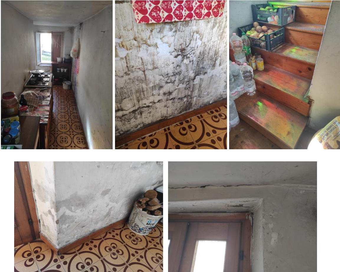
Particolari dell'ingresso comune

La scala comune è in legno (sia alzate che pedate) mentre il pavimento è rivestito con piastrelle (sia al piano terra che nel disimpegno al piano primo); le pareti sono intonacate e tinteggiate, gravemente ammalorate per la presenza di ampie fessurazioni e infiltrazioni con presenza di muffa e sfaldamento superficiale.