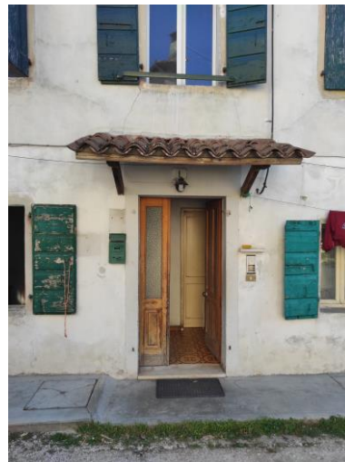
Prospetto OVEST sull'area scoperta (mn. 408)

Il fabbricato affaccia su un'ampia area (mn. 408) che di fatto funge da accesso e corte per tutti gli immobili che costituiscono il piccolo agglomerato, servito e raggiungibile solo tramite una strada bianca accessibile da Via A. Calcinoni.