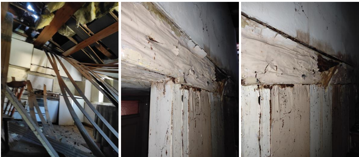
Mn. 1380 sub. 5: zona giorno e particolare travatura in legno del solaio 2 ^ piano (zona scala)

Inoltre, anche a causa delle inevitabili infiltrazioni riconducibili al danno della copertura, nell'unità del piano primo collocata al di sotto dell'unità pignorata (proprietà di terzi, aperta e anch'essa in stato di abbandono) si è potuto accertare un grave imbibimento e ammaloramento del solaio in legno interpiano (tra 1 ^ e 2 ^ piano) che in parte risultava crollato; tale stato confermava l'impossibilità di accedere in sicurezza al bene pignorato.