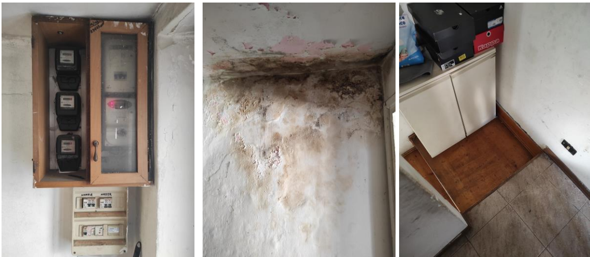
Contatori su Ingresso comune - Disimpegno comune (piano primo)

Nell'ingresso al piano terra sono presenti vecchi contatori dell'energia elettrica (presumibilmente inattivi) e due contatori di nuova generazione; non è stato tuttavia possibile accertarne il funzionamento né la pertinenza o meno degli stessi agli spazi comuni o al bene pignorato.