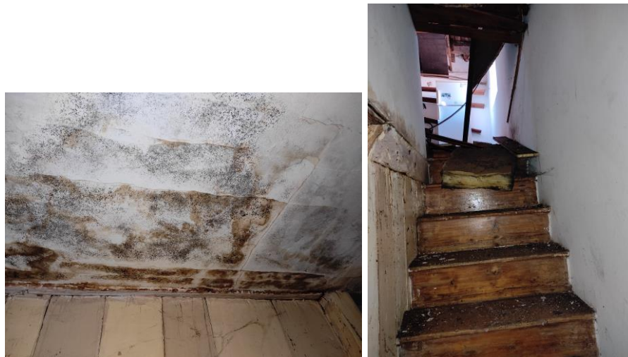
Ingresso unità (particolare intradosso solaio) e scala in legno

Non potendo accedere in sicurezza al piano secondo, null'altro è possibile aggiungere in termini di distribuzione interna, consistenze, dotazioni impiantistiche o finiture; sulla base di quanto è stato possibile rilevare, si ritiene che il piano secondo potrebbe avere una superficie interna complessiva di circa 45,8 mq (al lordo delle pareti interne e del vano scala) cui vanno aggiunti 1,5 mq di Ingresso al piano primo.