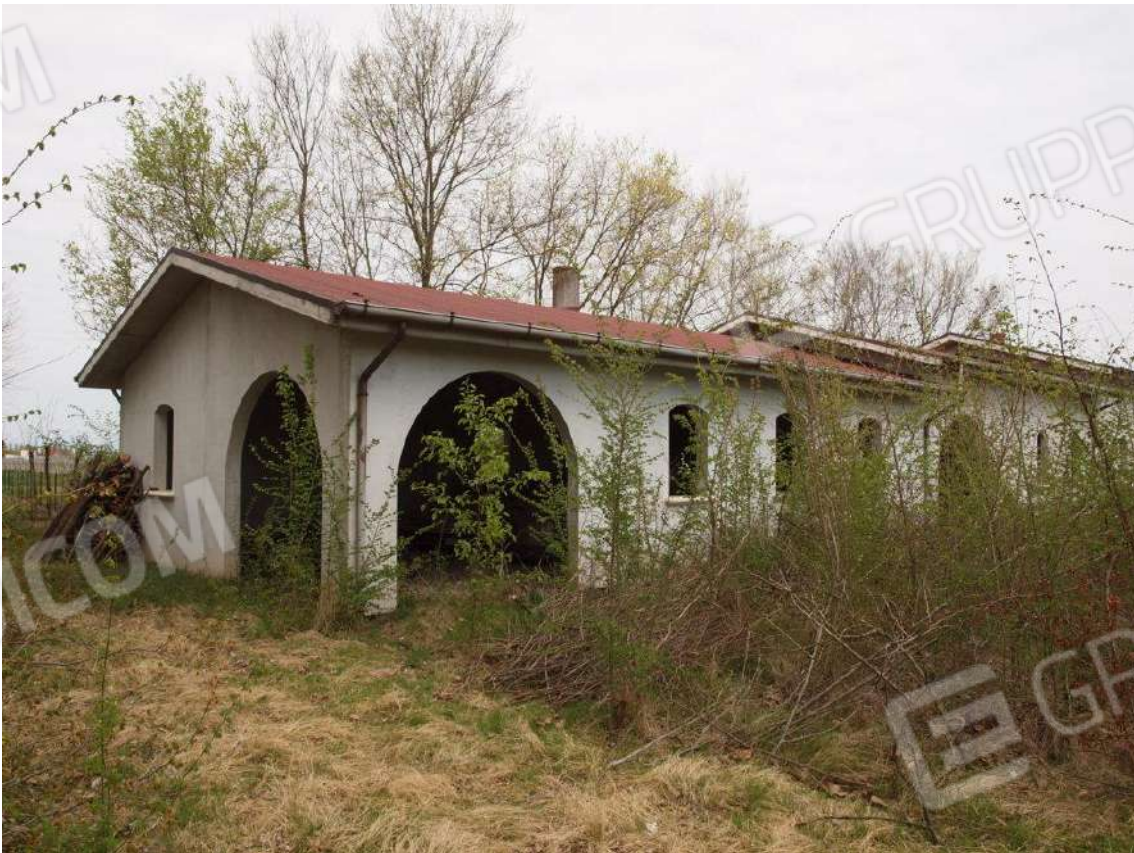
foto 2 vista esterna da sud-est