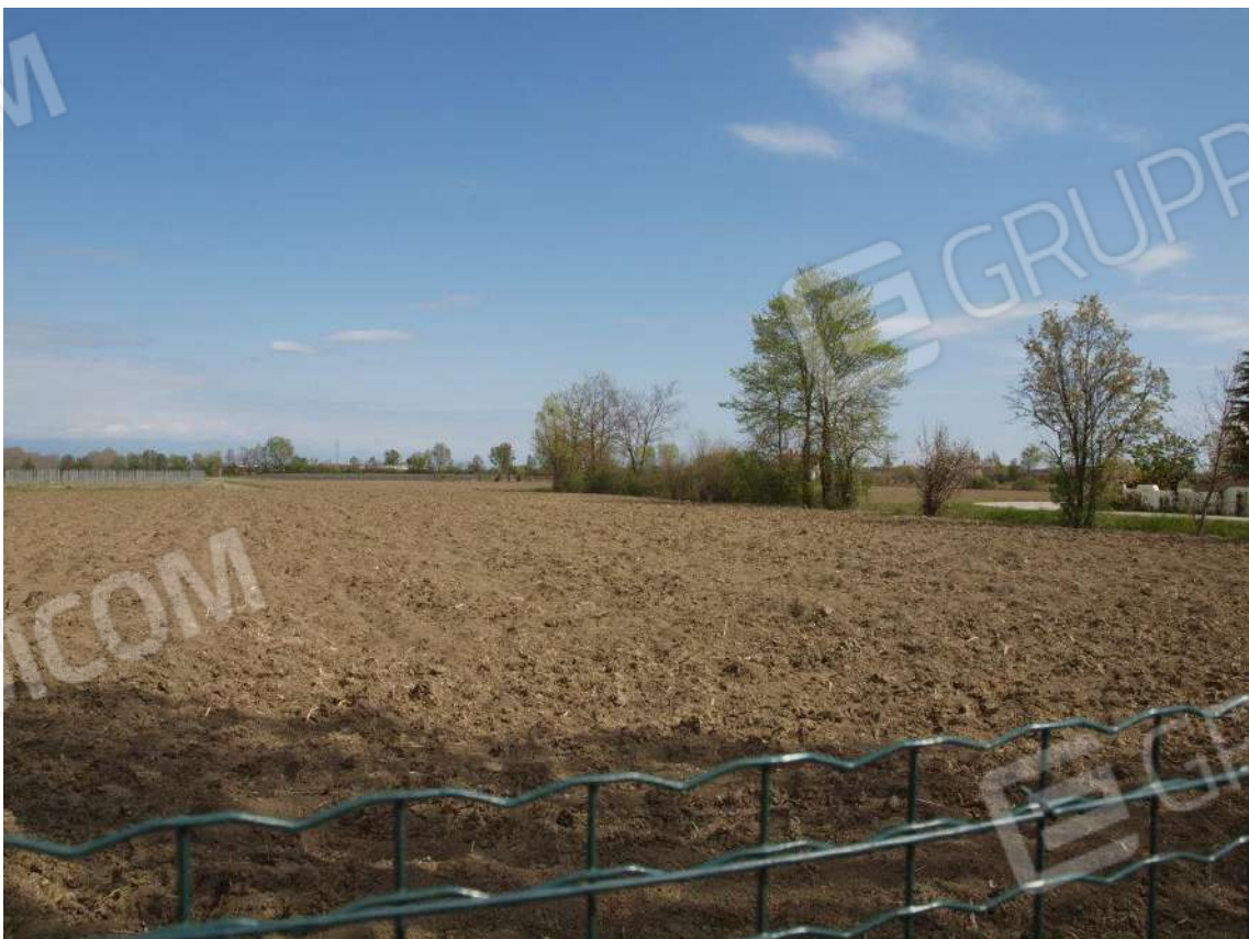
foto 4 vista verso il mapp. 313