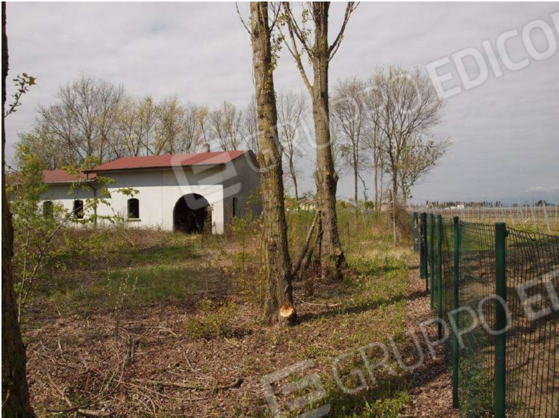
foto 3 vista esterna da nord-est