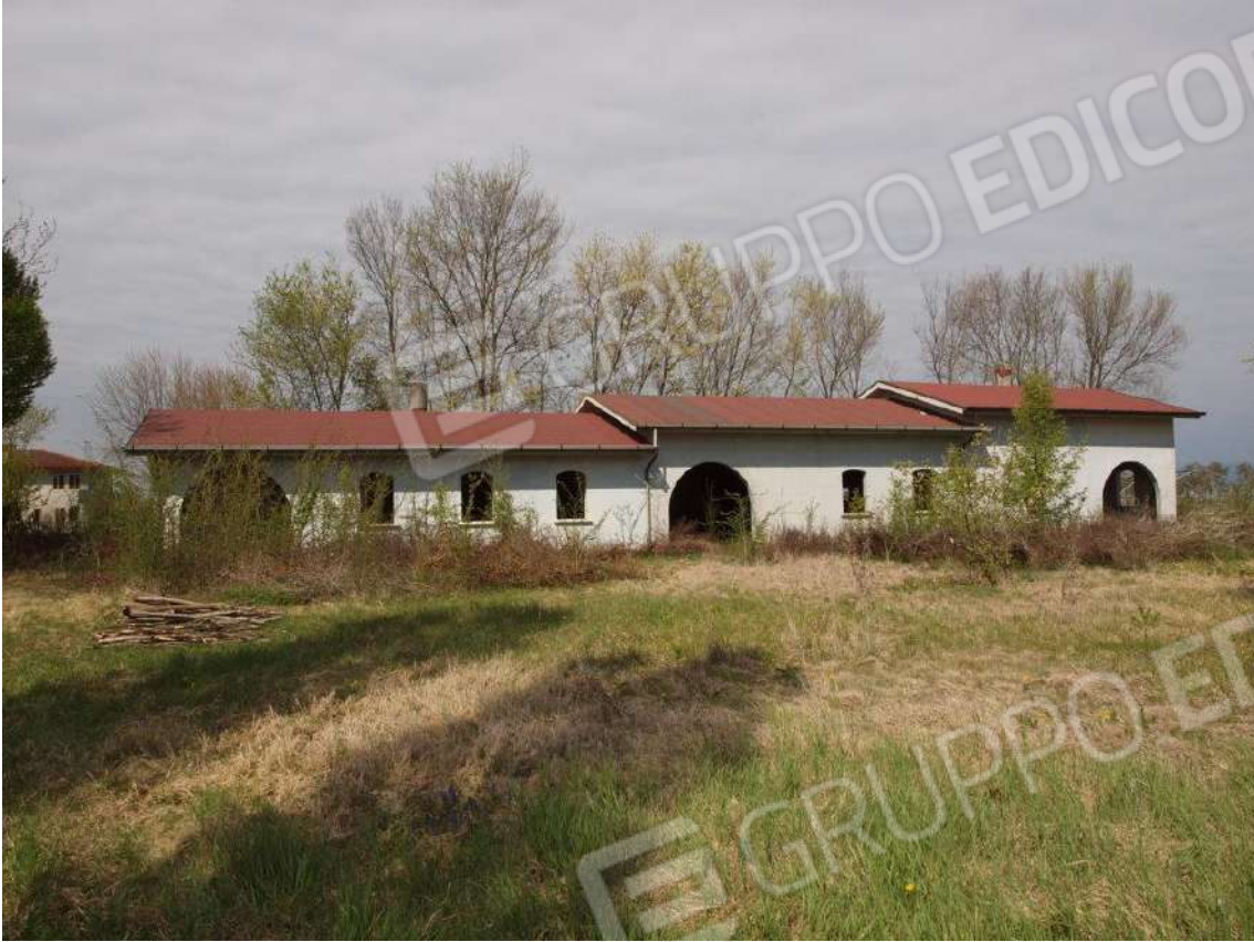
foto 1 vista esterna da est