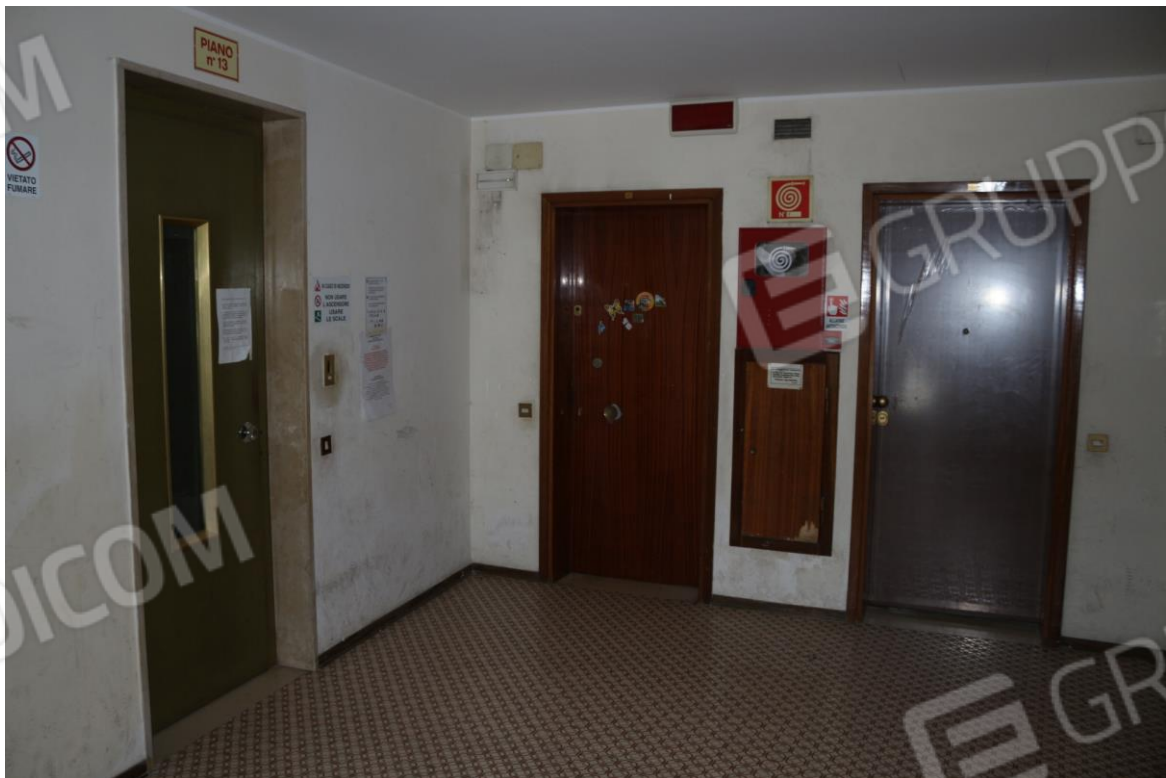
FOTO N°6. - visione interna - VANO SCALE E PIANEROTTOLO CONDOMINIALE