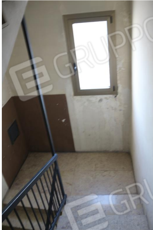
FOTO N°5. - visione interna - VANO SCALE E PIANEROTTOLO CONDOMINIALE