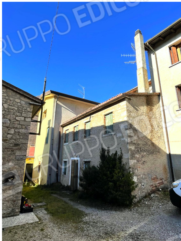
Prospetti Sud ed Est dell'edificio (abitazione a schiera)