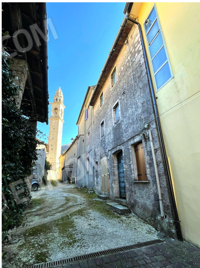
Prospetto Nord dell'edificio (abitazione a schiera)