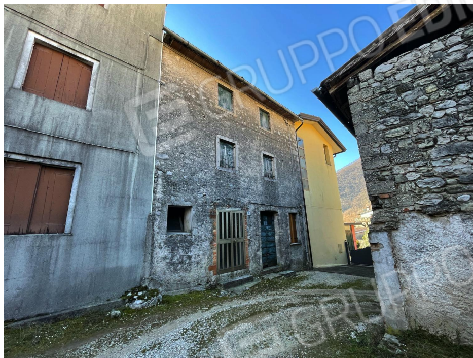
Prospetto Nord dell'edificio (abitazione a schiera)