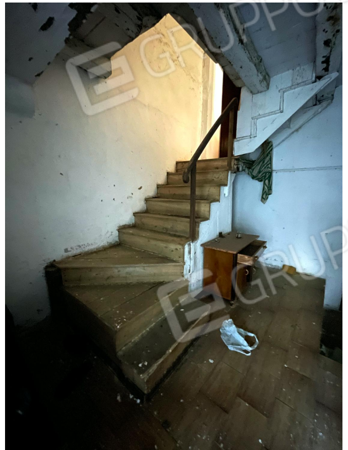
Scala di collegamento tra piano terra e primo piano