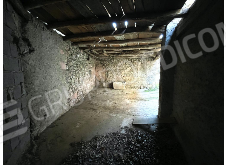
Autorimessa (piano terra)