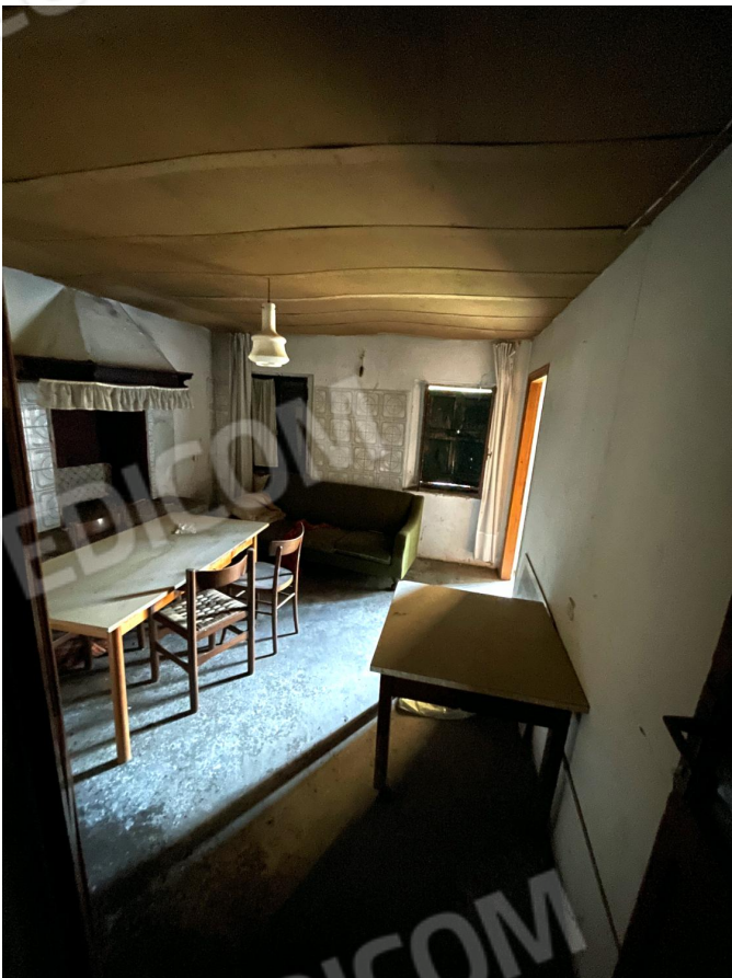
Soggiorno - pranzo (piano terra)