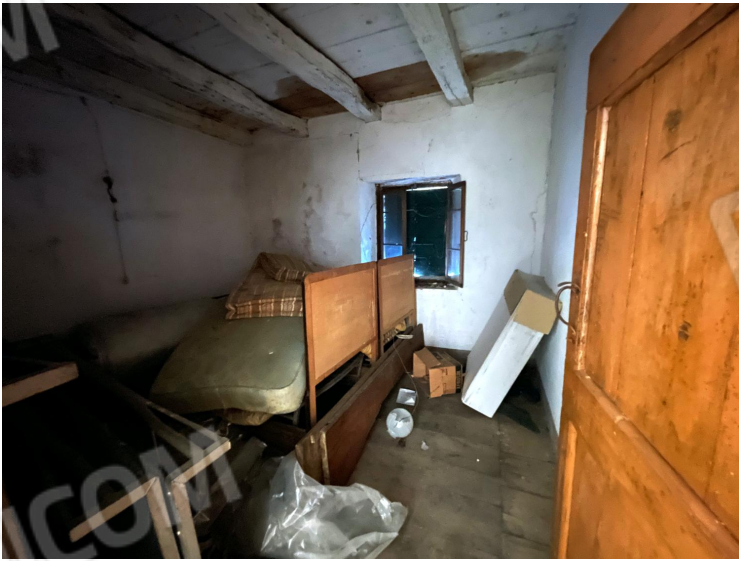
Camera (primo piano)