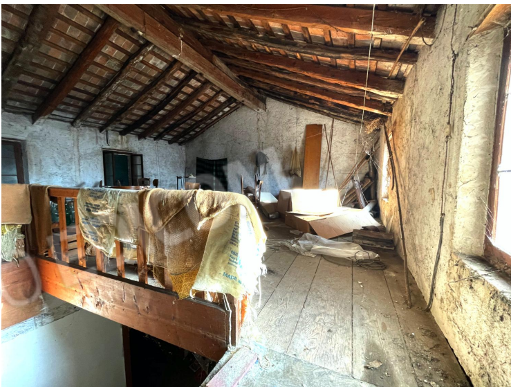
Soffitta (secondo piano)