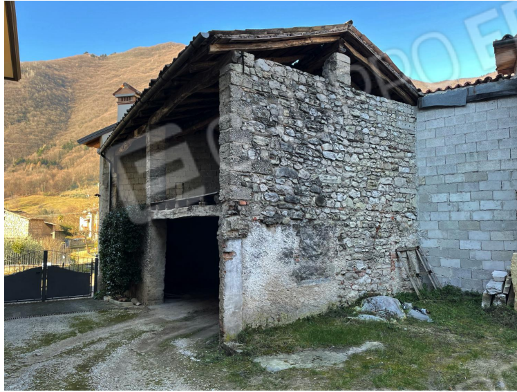
Prospetti Sud ed Est dell'edificio (corpo di fabbrica di servizio ad uso autorimessa con soffitta)