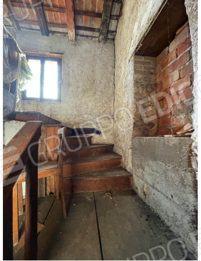
Scala di collegamento tra primo piano e secondo piano