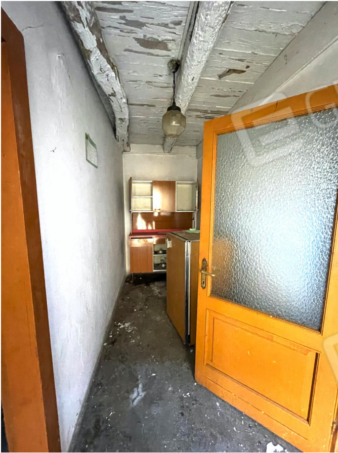
Ingresso (piano terra)