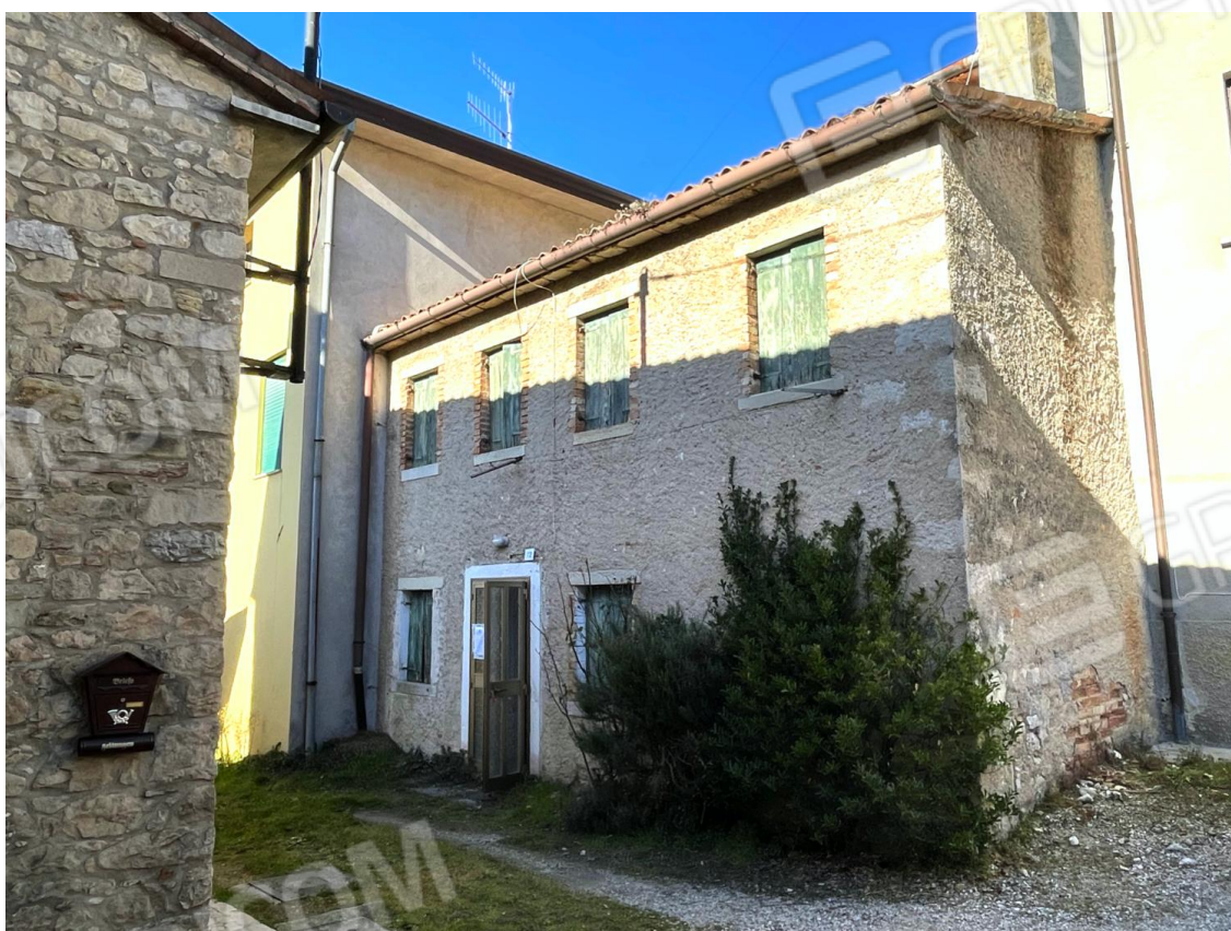
Prospetti Sud ed Est dell'edificio (abitazione a schiera)