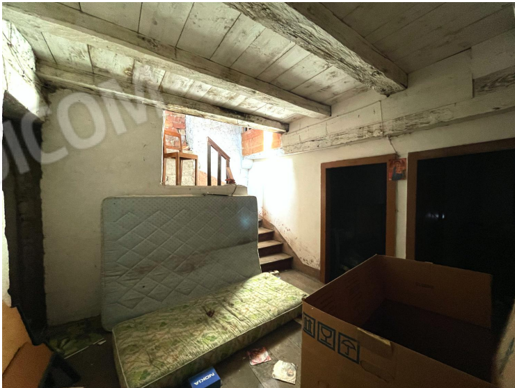
Disimpegno (primo piano)