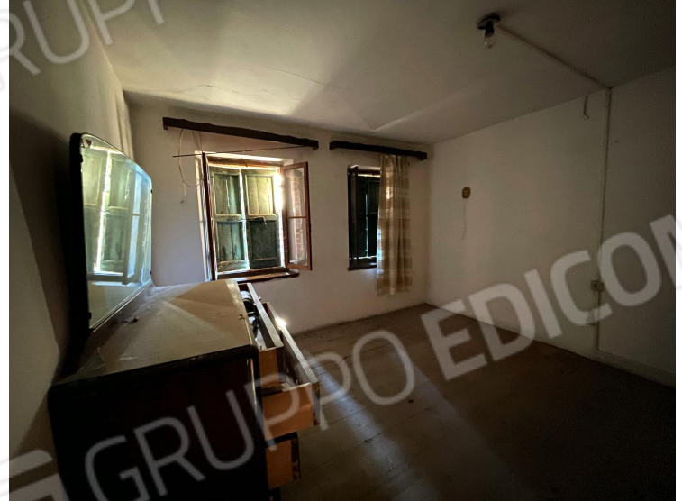
Camera (primo piano)