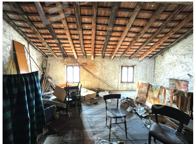
Soffitta (secondo piano)