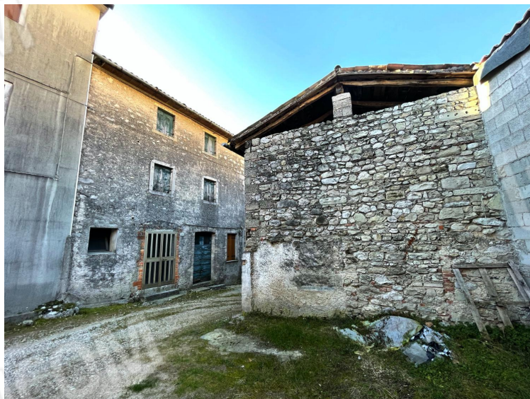
Prospetto Est dell'edificio (corpo di fabbrica di servizio ad uso autorimessa con soffitta)