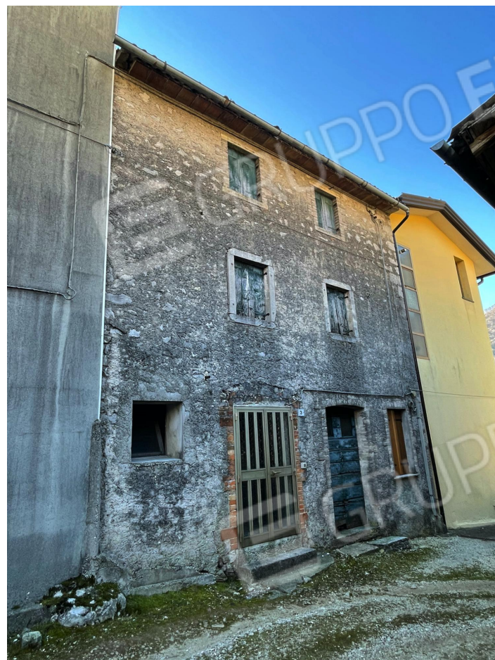
Prospetto Nord dell'edificio (abitazione a schiera)