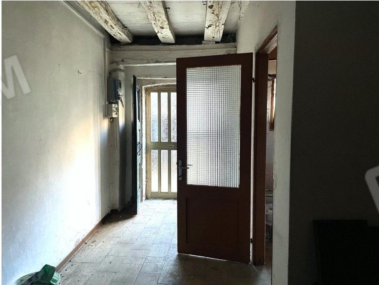
Disimpegno (piano terra)