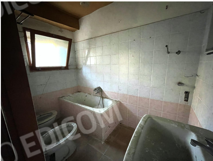
Bagno (piano terra)