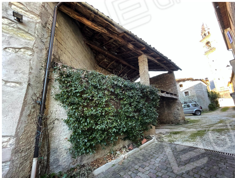
Prospetto Sud dell'edificio (corpo di fabbrica di servizio ad uso autorimessa con soffitta)