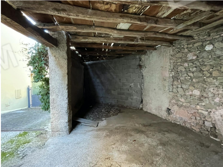
Autorimessa (piano terra)