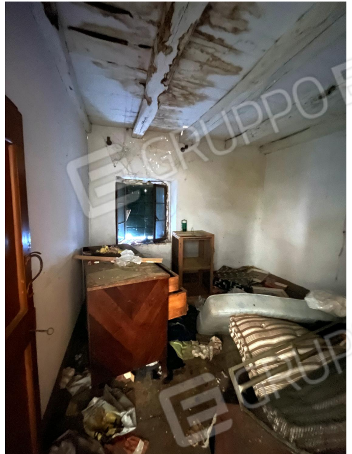
Camera (primo piano)