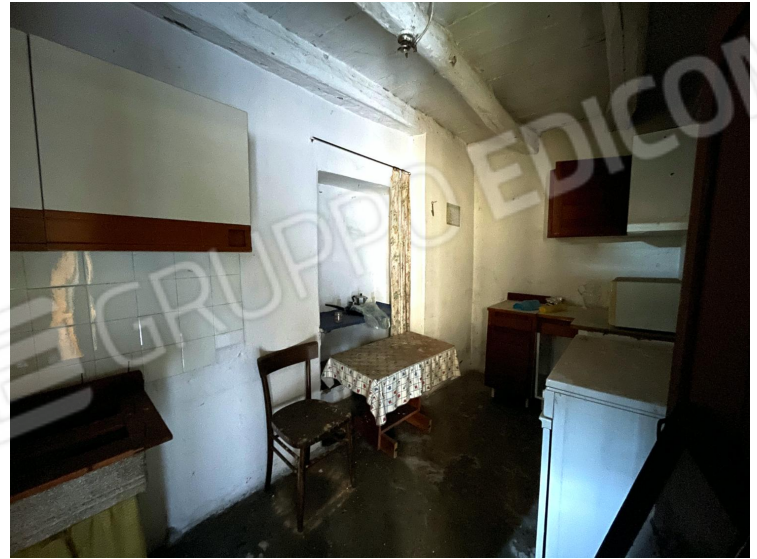
Cucina (piano terra)