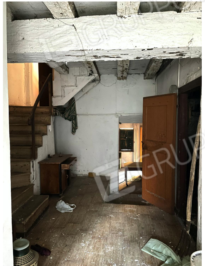
Disimpegno (piano terra)