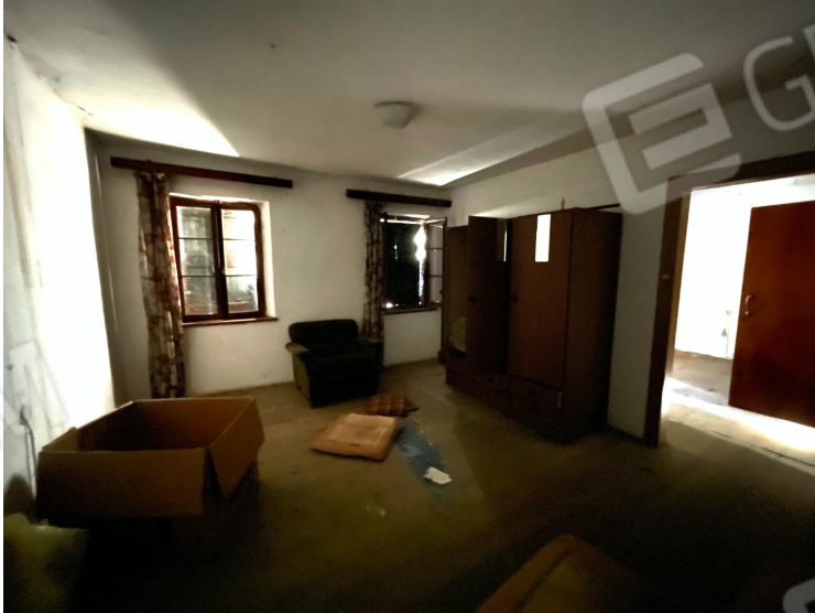
Camera (primo piano)