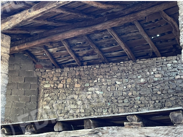
Soffitta (primo piano)