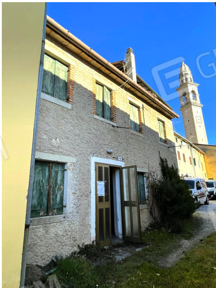
Prospetto Sud dell'edificio (abitazione a schiera)