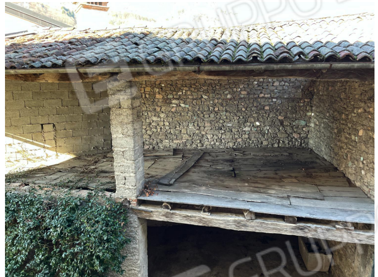
Soffitta (primo piano)