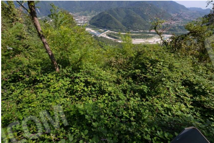
foto n. 3 – vegetazione (rovi e specie lianose) predominante nel lotto - giacitura del terreno molto acclive