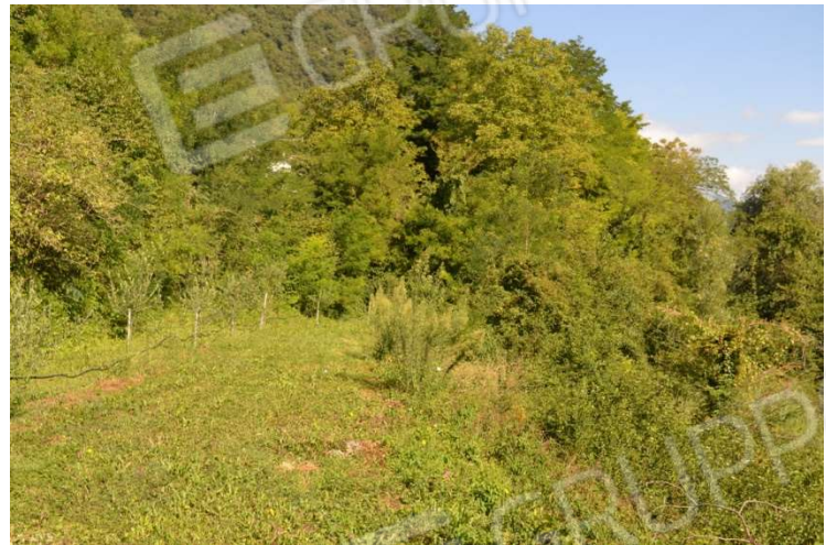
foto n. 18 – terreno a nord del fabbricato verso confine nord del lotto