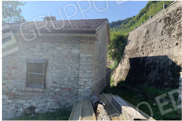
foto n. 3 – parte prospetto nord e prospetto est verso scarpata SR Feltrina