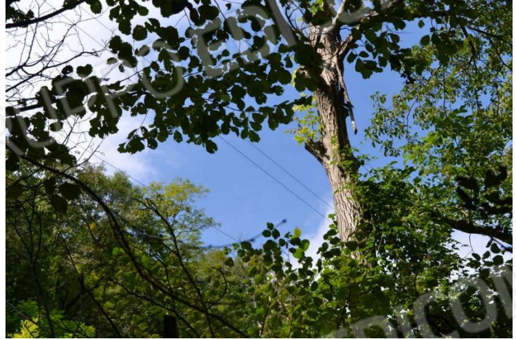
foto n. 2 – cavi aerei di linee elettriche elettrodotti in direzione nord-sud