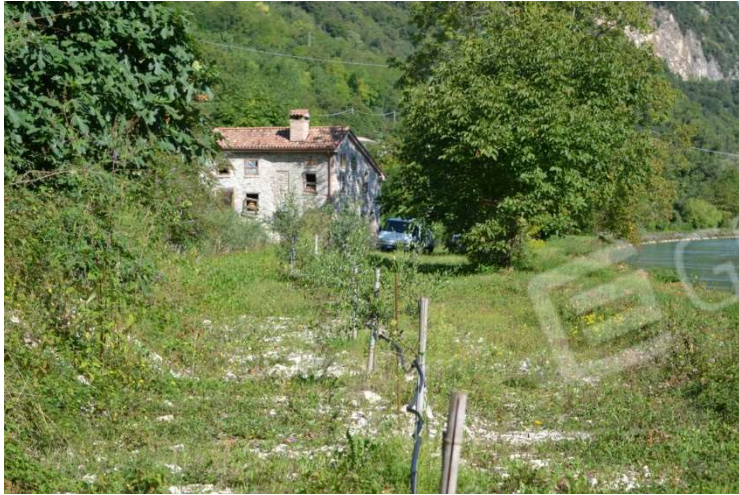
foto n. 13 – terreno a sud del fabbricato - ulivi e sulla destra canale Brentella