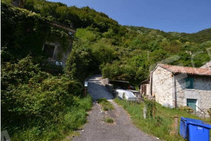
foto n. 1 – accesso al lotto dalla SR Feltrina - presenza di cancello chiuso alla fine della strada