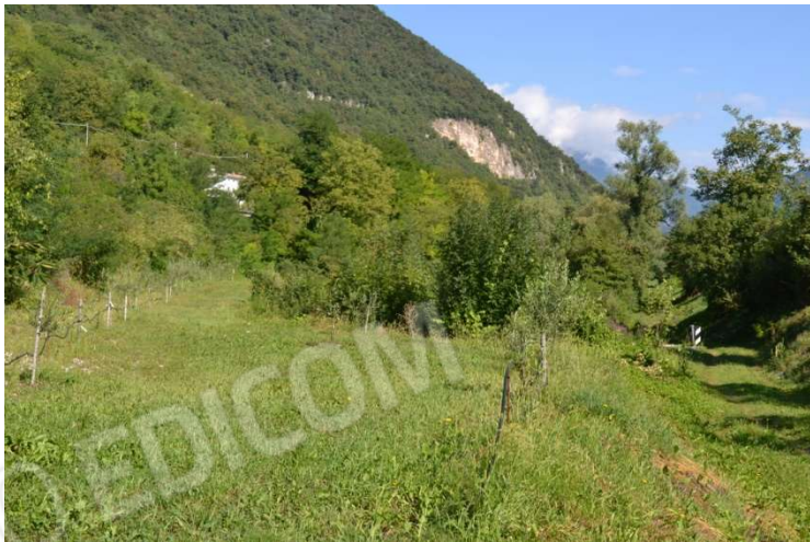
foto n. 17 – terreno a nord del fabbricato – sulla destra la strada consortile di accesso al lotto