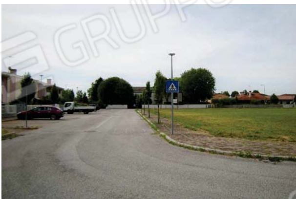
10. Vista verso sud, via degli Alpini.