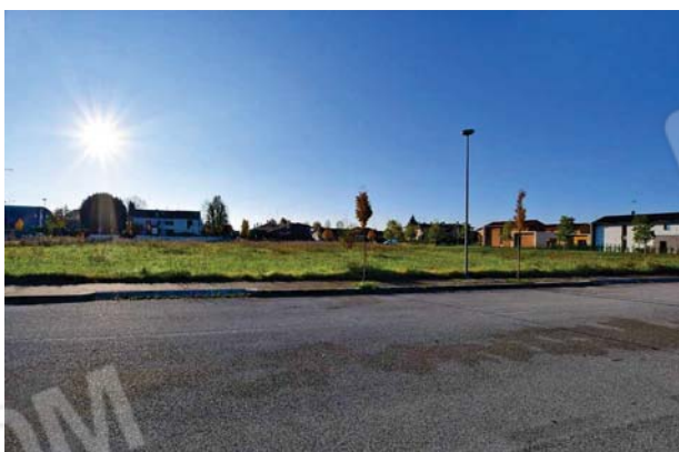
3. Interno , vista verso sud.