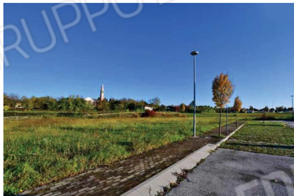
8. Vista verso nord est.