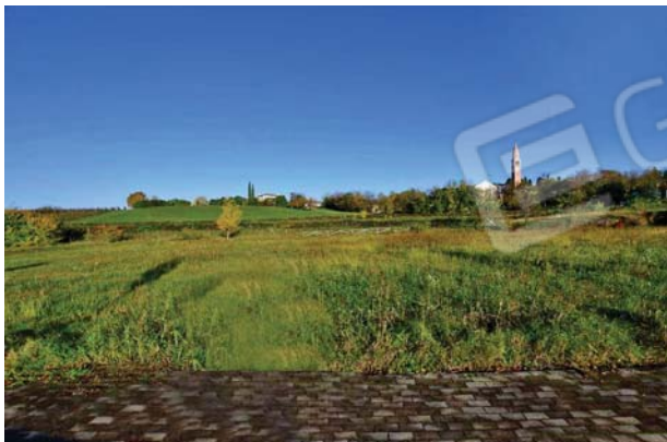
7. Vista verso nord.

LOTTO 3 – Quota pignorata: somma di frazioni diverse della piena proprietà di tre esecutati, variabili a seconda dei beni. Terreni edificabili in Comune di Susegana (TV) Via Degli Alpini.