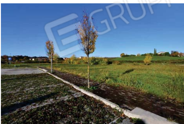
6. Vista verso nord ovest.