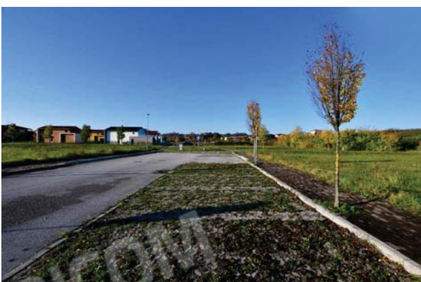
5. Vista verso ovest.