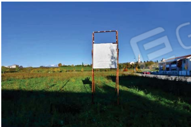
1. Cartello di lottizzazione.

LOTTO 3 – Quota pignorata: somma di frazioni diverse della piena proprietà di tre esecutati, variabili a seconda dei beni. Terreni edificabili in Comune di Susegana (TV) Via Degli Alpini.