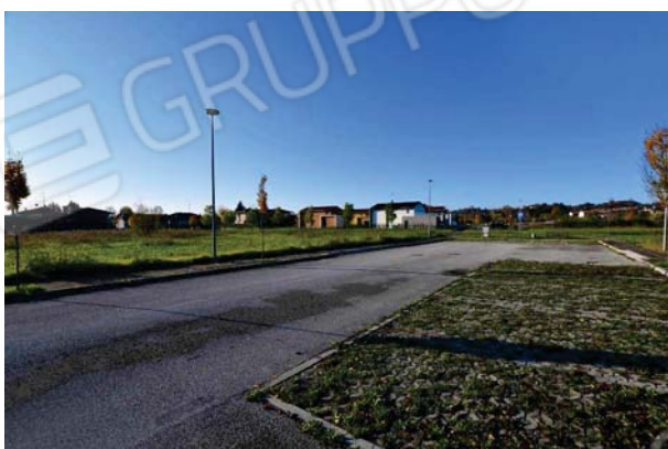
4. Vista verso sud ovest.