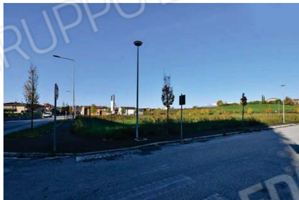
2. Via degli Alpini, ingresso Blocco A.