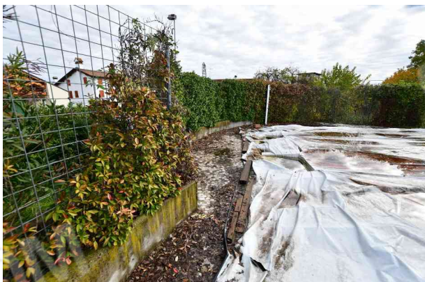
3. Vista verso est, lato nord (1 di 2).