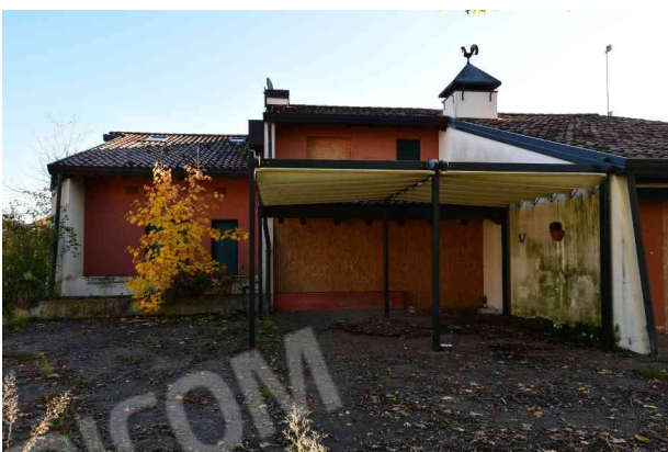
5. Prospetto ovest, pompeiana (1 di 2).