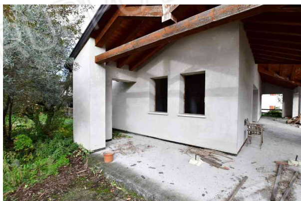
2. Portico a sud.