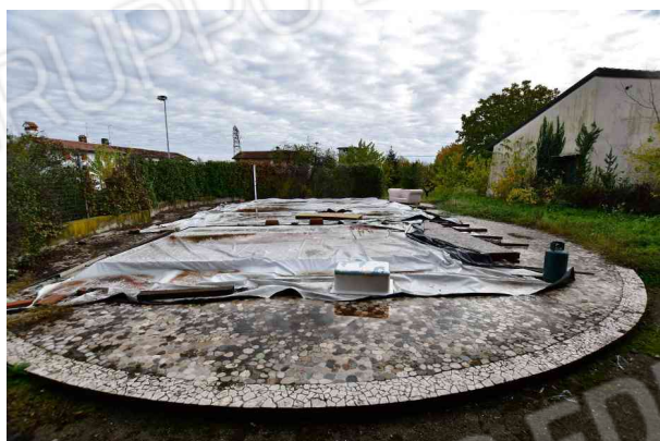
2. Vista verso est.