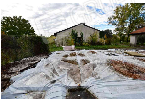
6. Vista verso sud.

Riferimento per l'individuazione dei luoghi: allegato grafico n. 3 – rilievo stato di fatto.