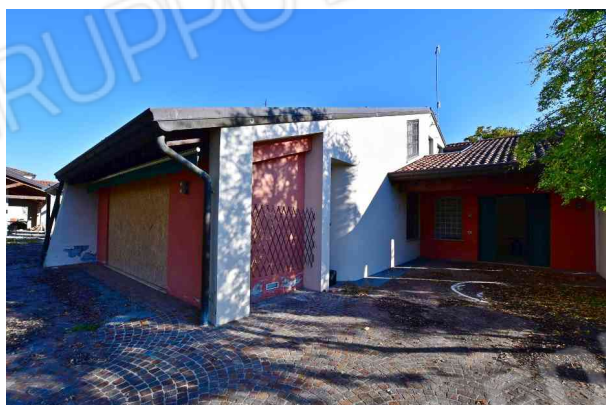
2. Prospetto sud ovest – ingresso principale.