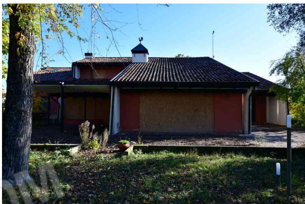
3. Prospetto ovest (1 di 2).