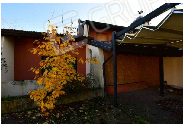
6. Prospetto ovest, pompeiana (1 di 2).