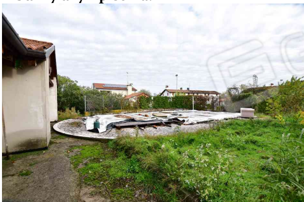
1. Vista verso nord est.