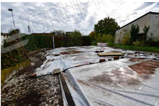
4. Vista verso est, lato nord (2 di 2).