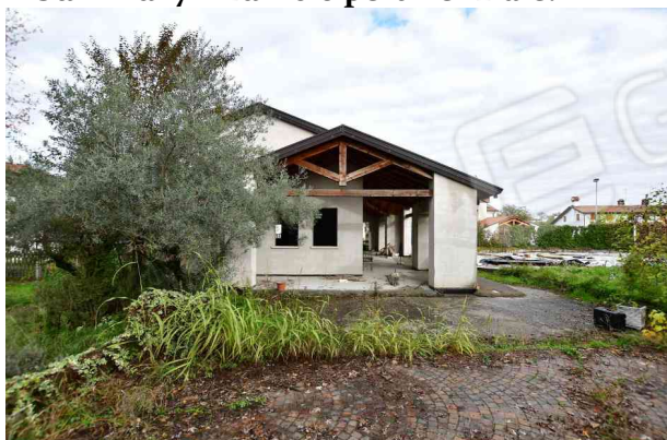
1. Prospetto sud.