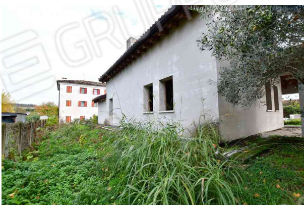
4. Prospetto ovest – area T.