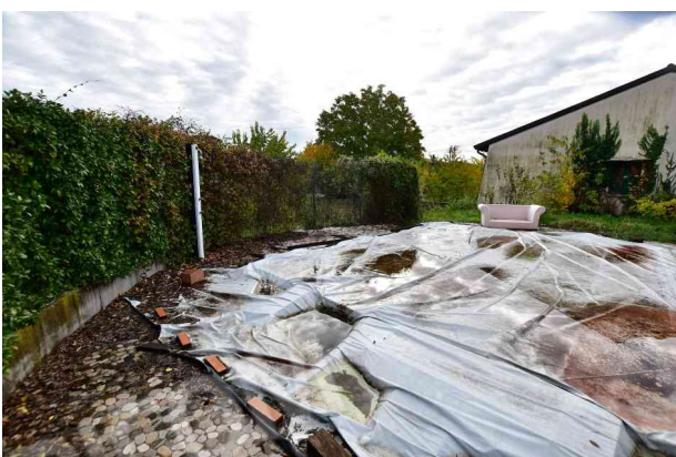
5. Vista verso sud est.