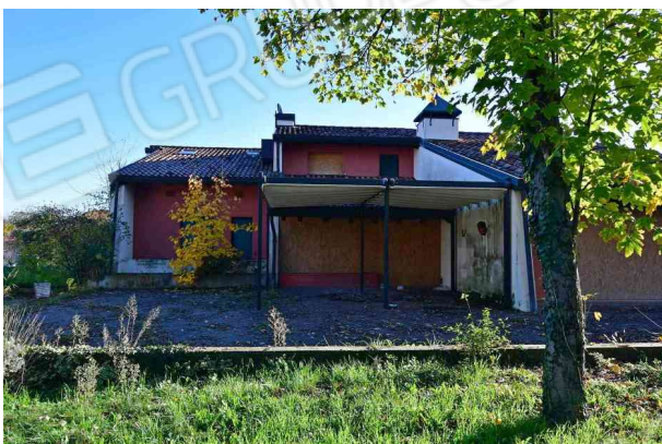
4. Prospetto ovest (2 di 2).