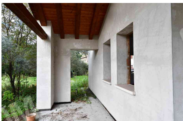
3. Portico, vista verso ovest.