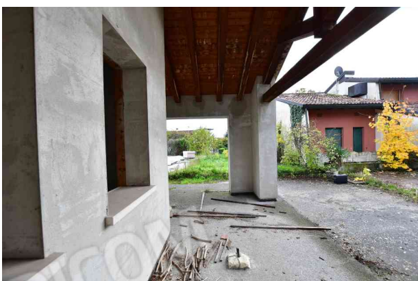
5. Portico, vista verso sud e la villa.