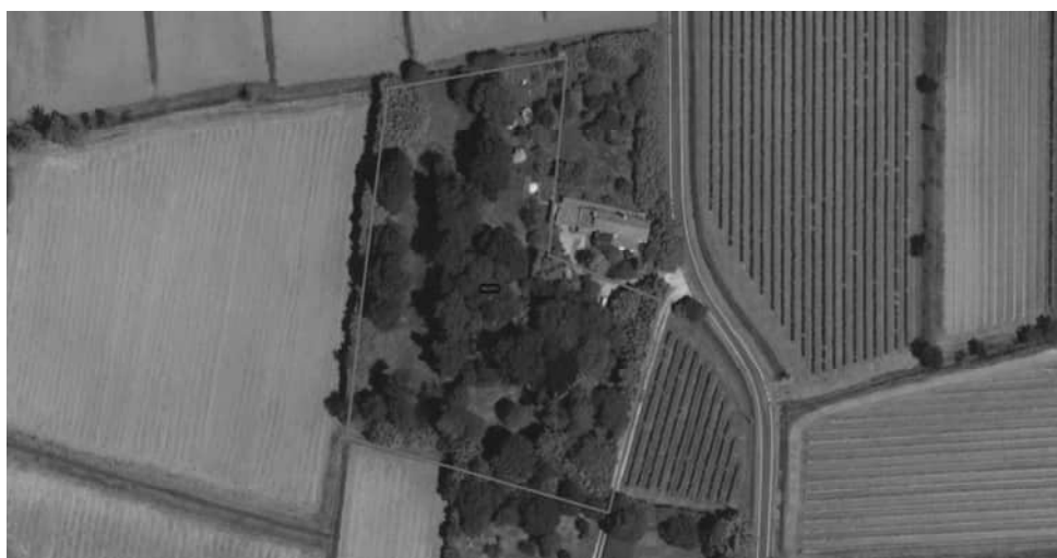
Fig. 1 – Foto aerea particella n. 243 coltivata a bosco di latifoglie

Si tratta di un terreno a destinazione agricola confinante con il lotto 1 avente una superficie di mq 7.760.