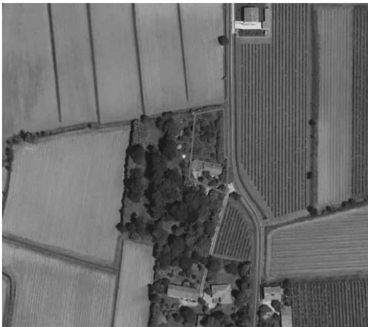
Fig. 1 – Foto aerea particella n. 146 comprendente i fabbricati

Il fabbricato presenta le seguenti caratteristiche: