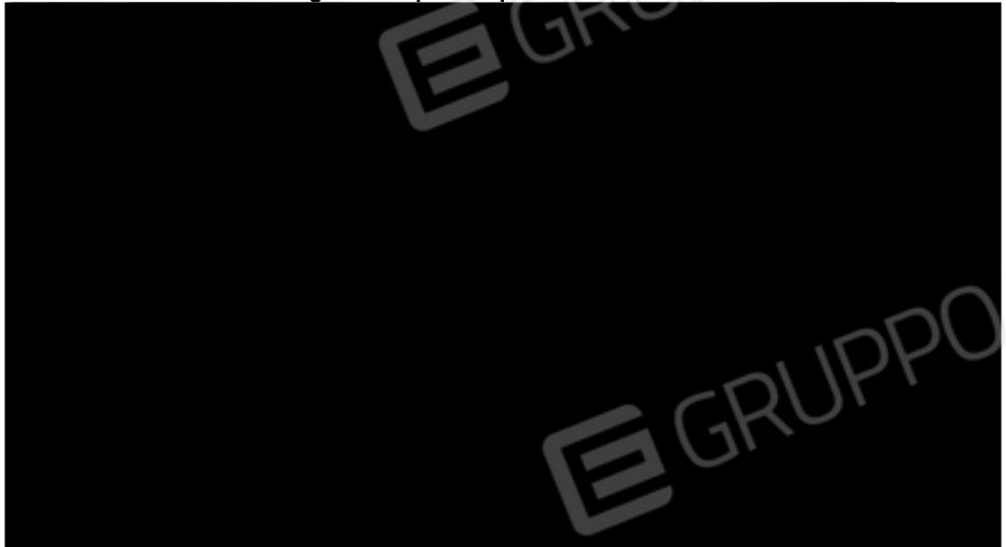
Fig. 1.20 – cantina piano terra