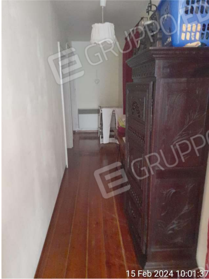
Corridoio piano primo