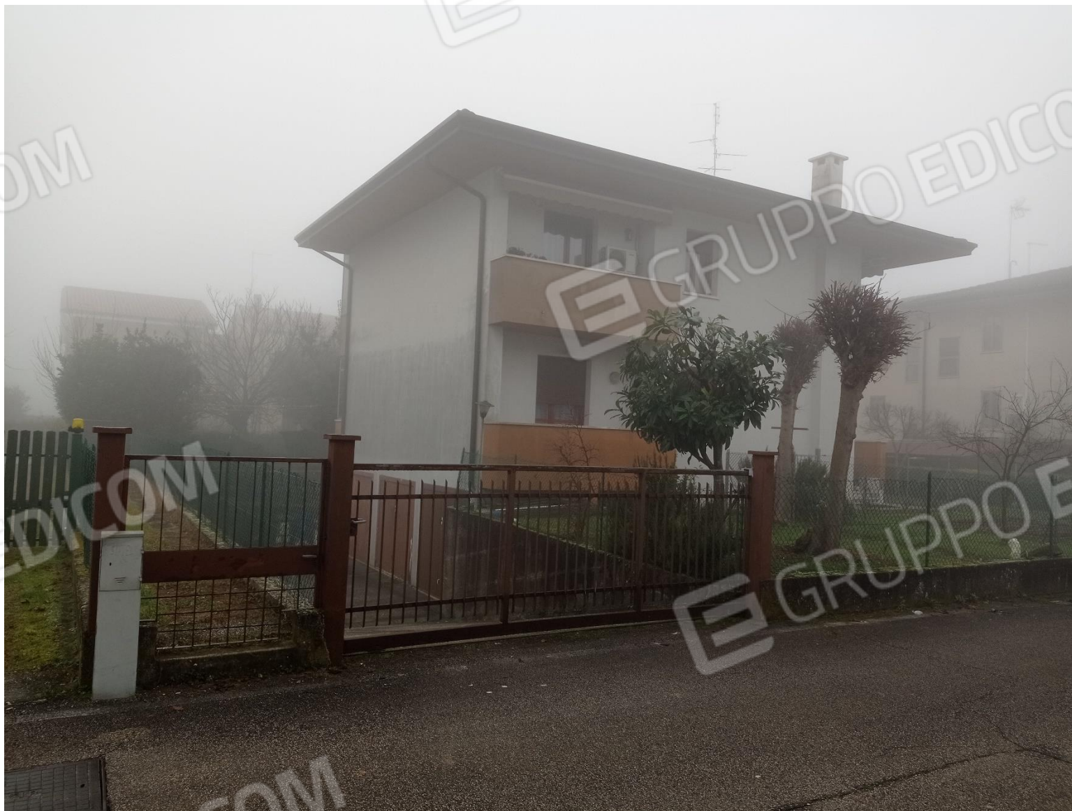
Foto 4 – Vista del fabbricato comprendente i beni oggetto del procedimento