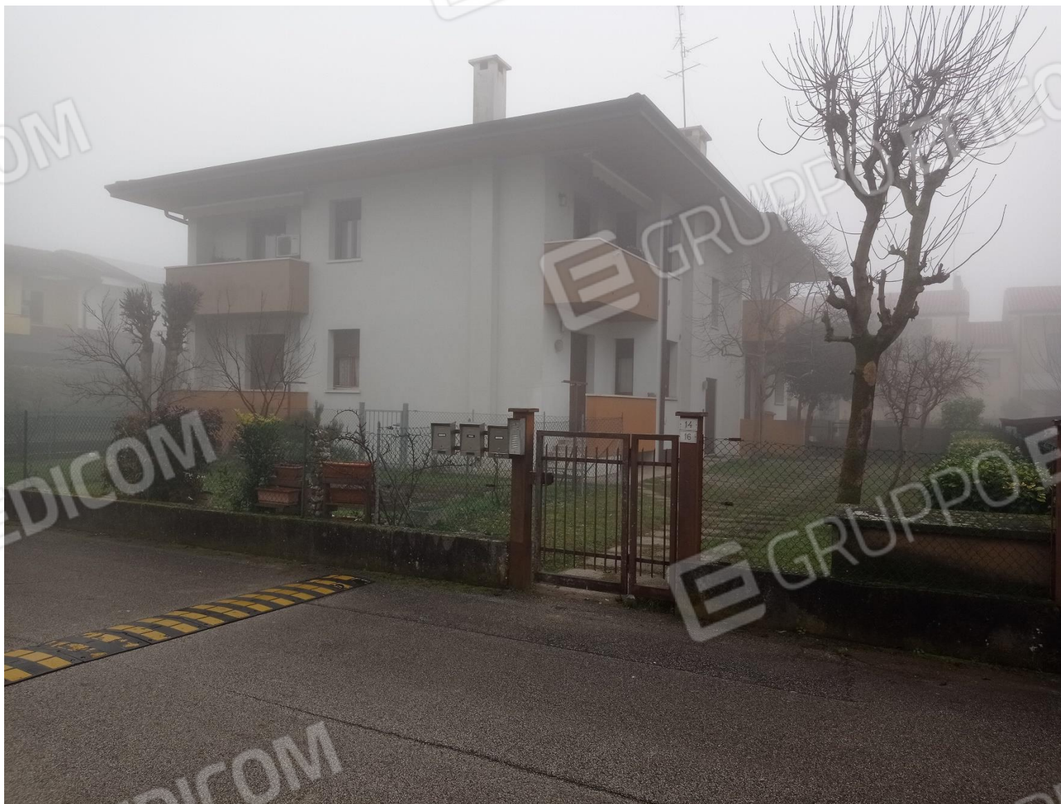
Foto 2 – Vista del fabbricato comprendente i beni oggetto del procedimento