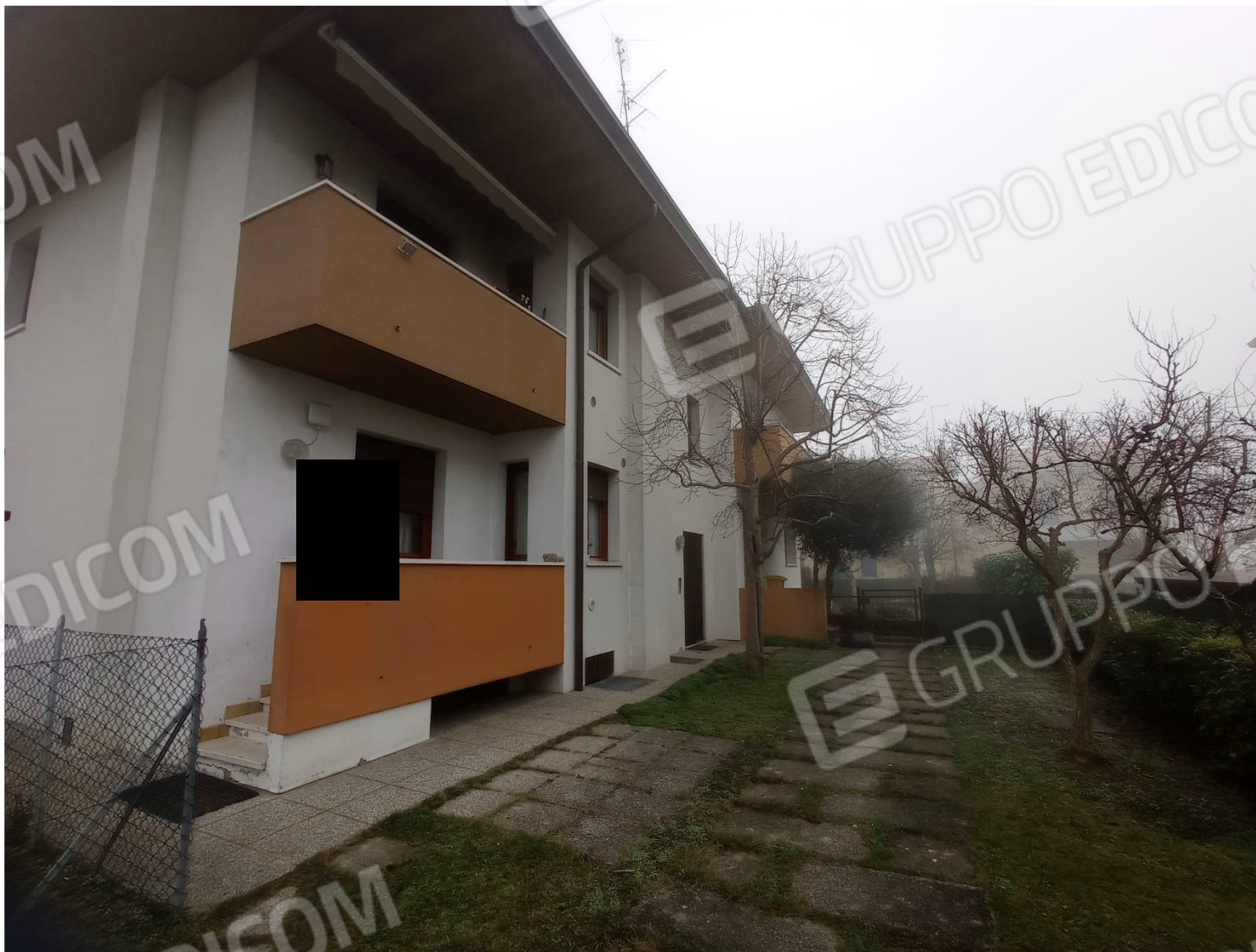
Foto 5 – Vista del fabbricato comprendente i beni oggetto del procedimento