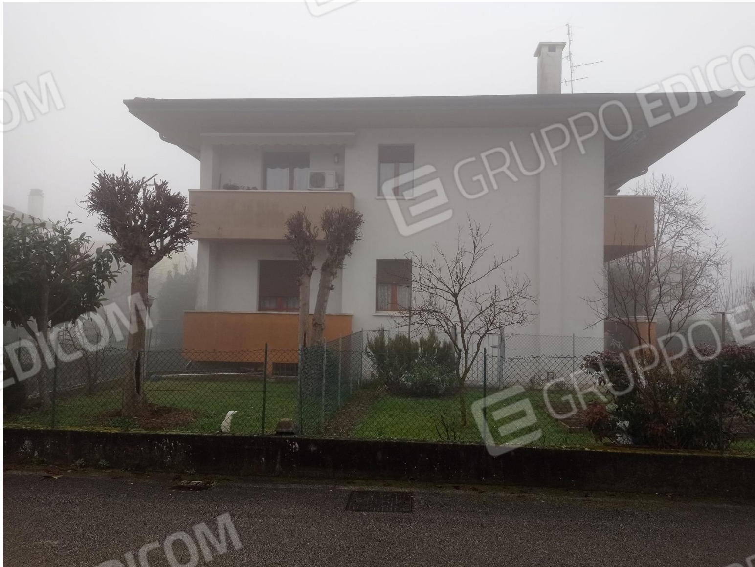
Foto 3 – Vista del fabbricato comprendente i beni oggetto del procedimento