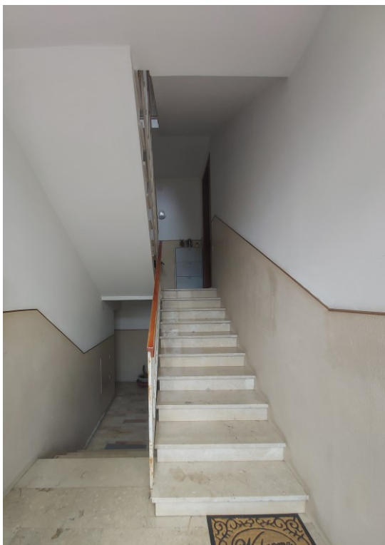
Vano scale condominiale