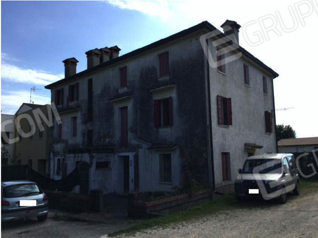
Prospetti Nord e Ovest dell'edificio (appartamento al secondo piano)