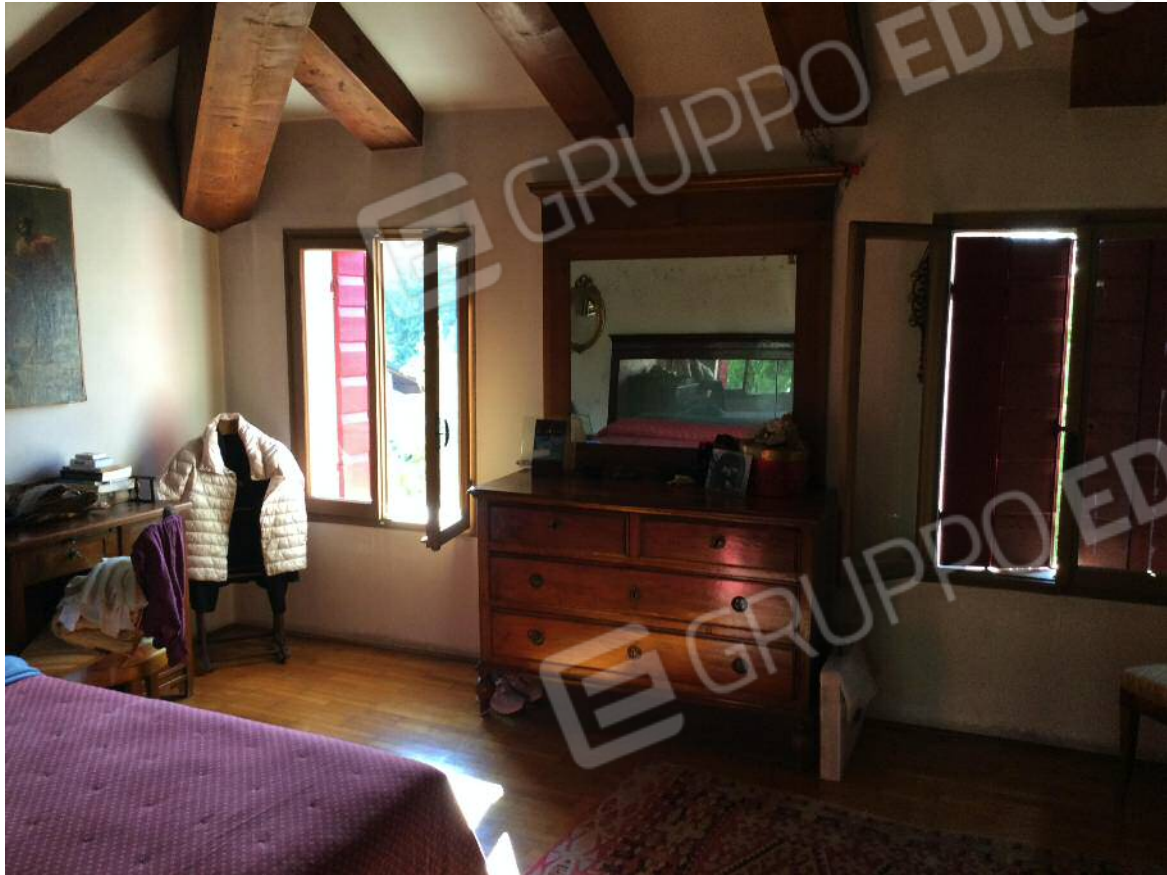
Camera (secondo piano)