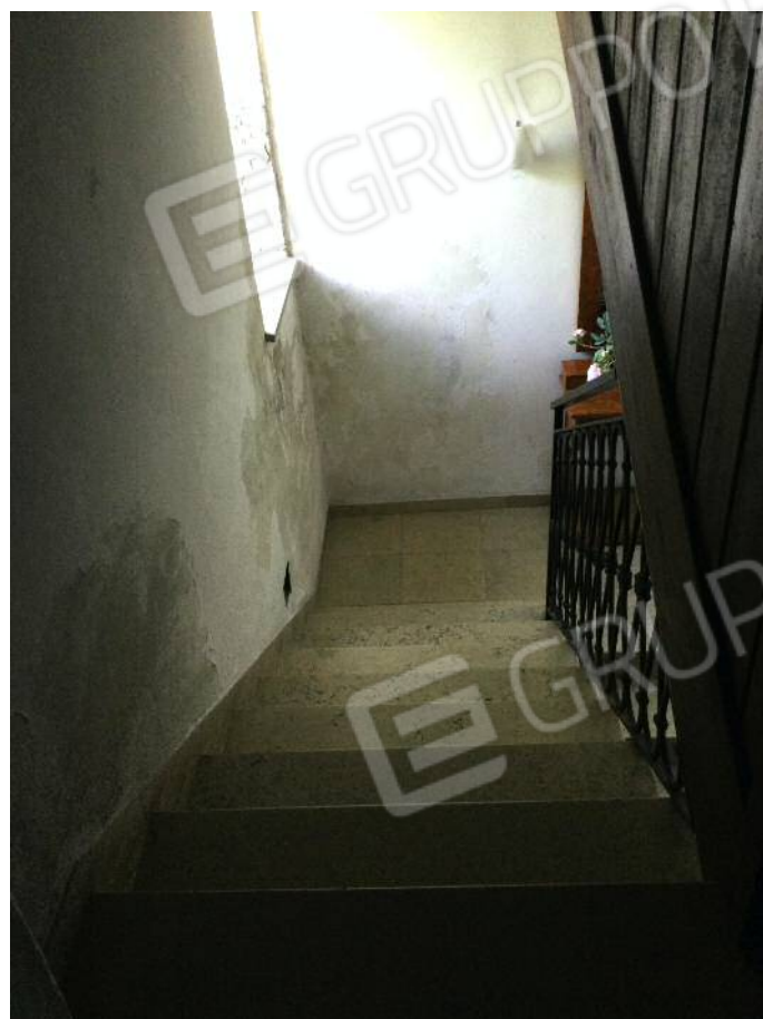
Vano scala comune