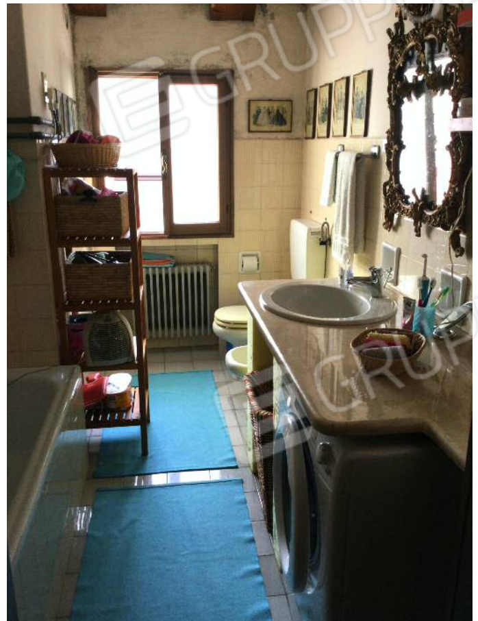
Bagno (secondo piano)