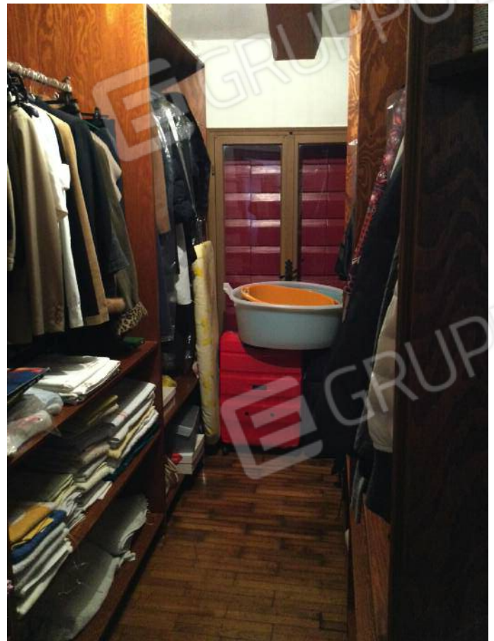
Ripostiglio (secondo piano)