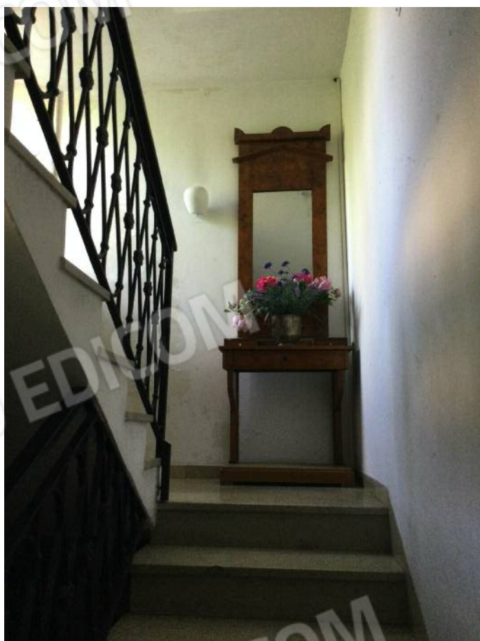
Vano scala comune