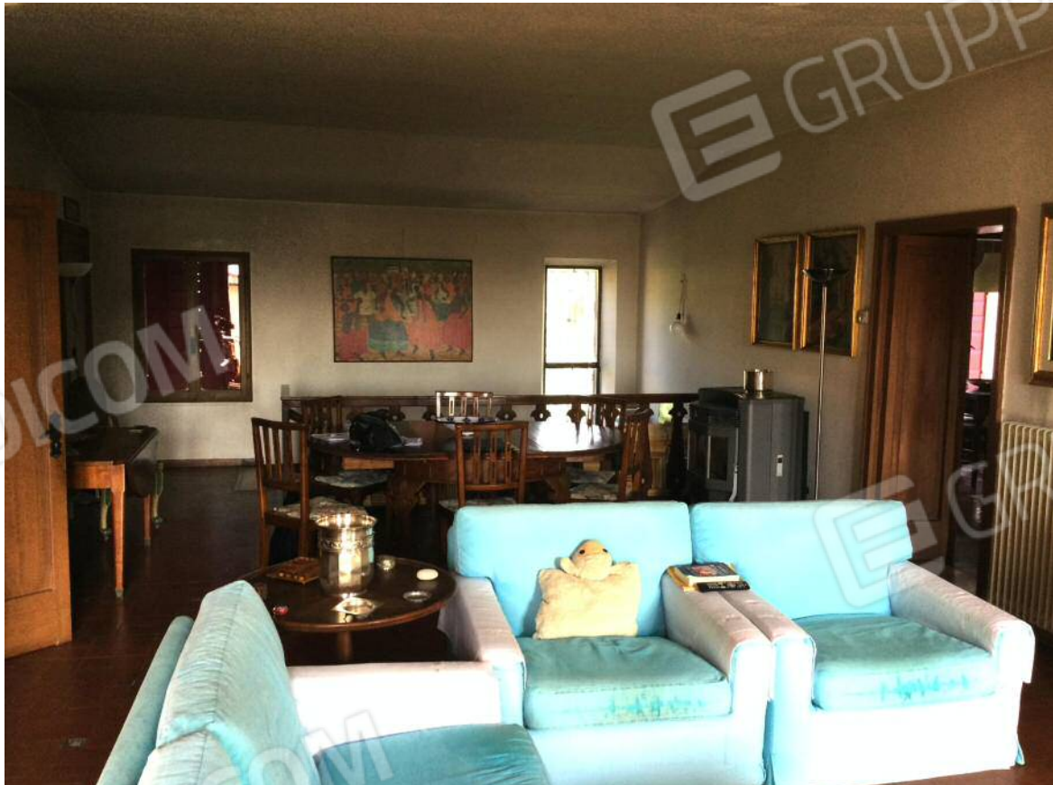
Soggiorno - pranzo (secondo piano)