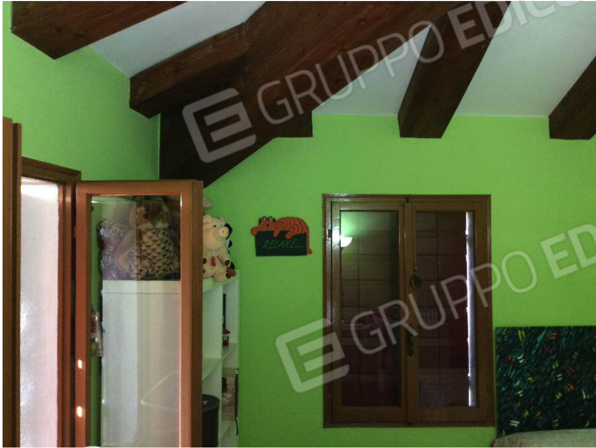
Camera (secondo piano)