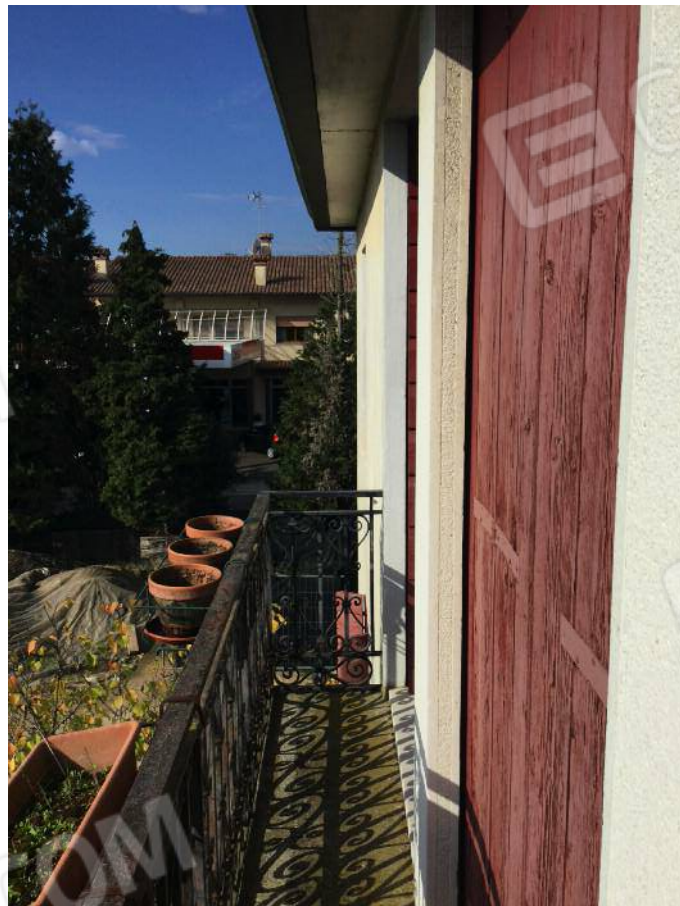
Balcone (secondo piano)