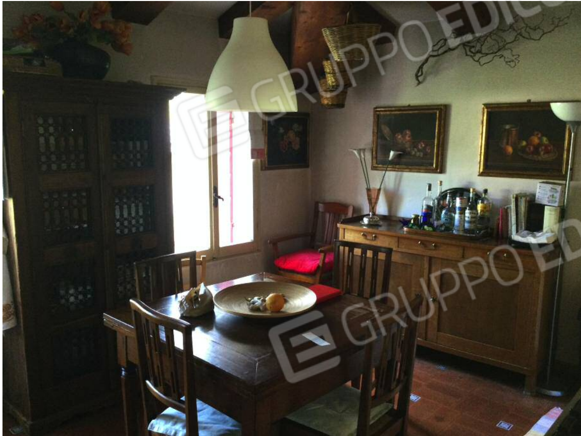
Cucina (secondo piano)