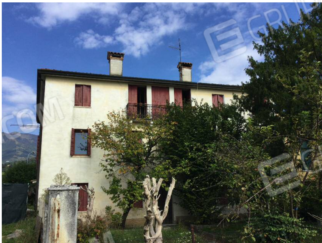
Prospetto Sud dell'edificio (appartamento al secondo piano)