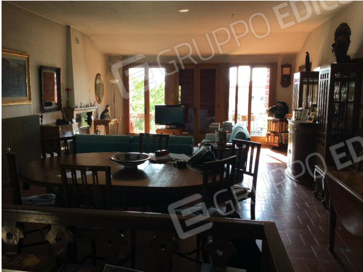
Soggiorno - pranzo (secondo piano)