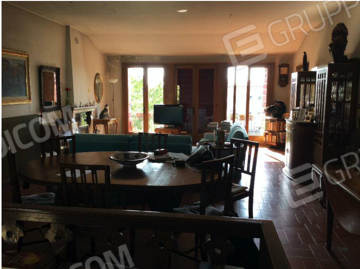
Soggiorno - pranzo (secondo piano)