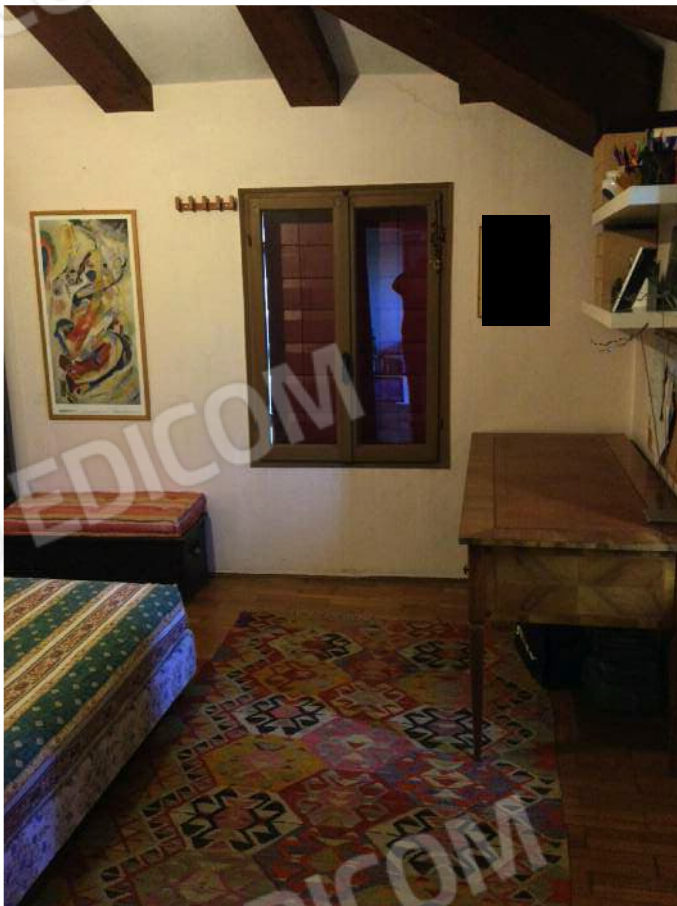
Camera (secondo piano)