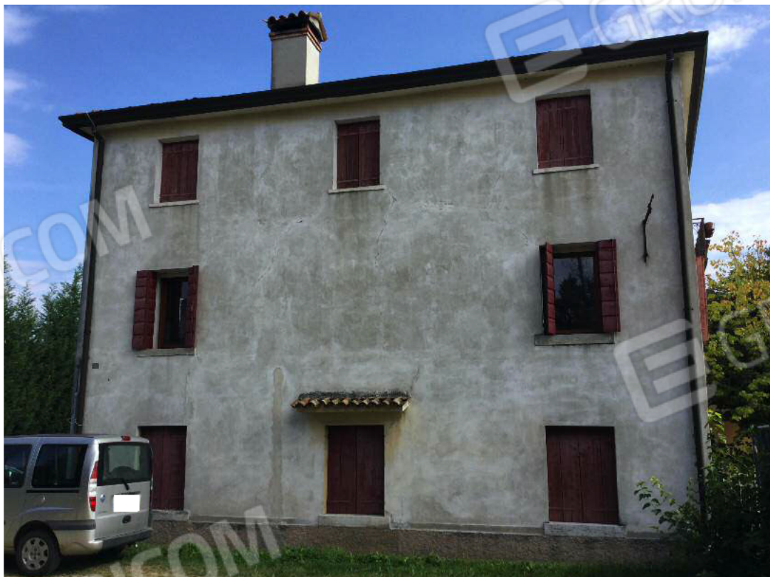
Prospetto Ovest dell'edificio (appartamento al secondo piano)