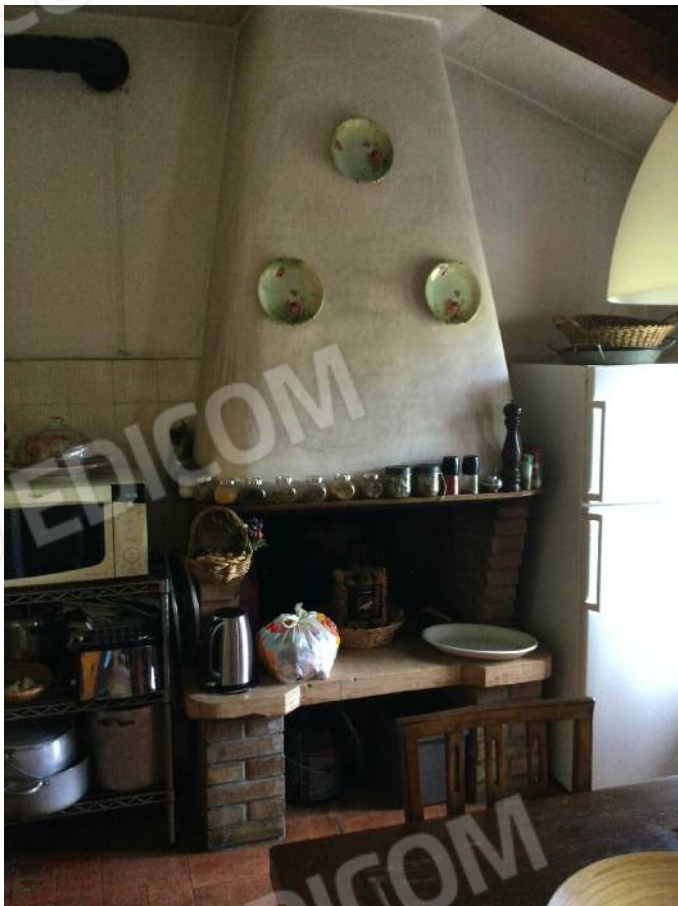
Cucina (secondo piano)