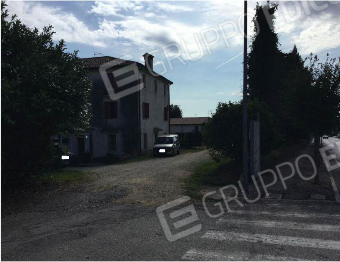
Scorcio prospetti Nord e Ovest dell'edificio (appartamento al secondo piano)