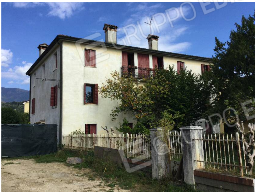
Prospetti Sud e Ovest dell'edificio (appartamento al secondo piano)