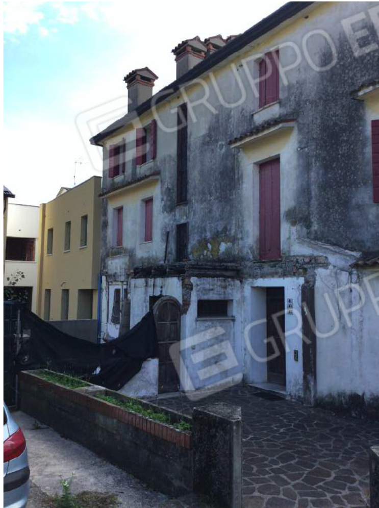
Dettaglio prospetto Nord dell'edificio (appartamento al secondo piano)