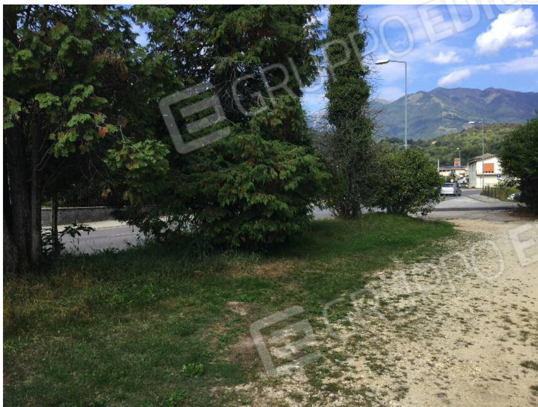
Area scoperta di pertinenza