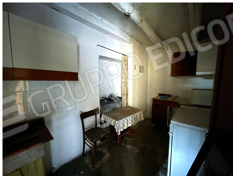
Cucina (piano terra)