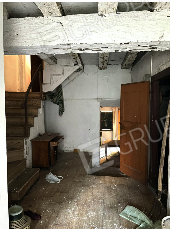
Disimpegno (piano terra)