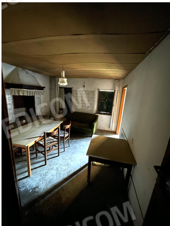
Soggiorno - pranzo (piano terra)