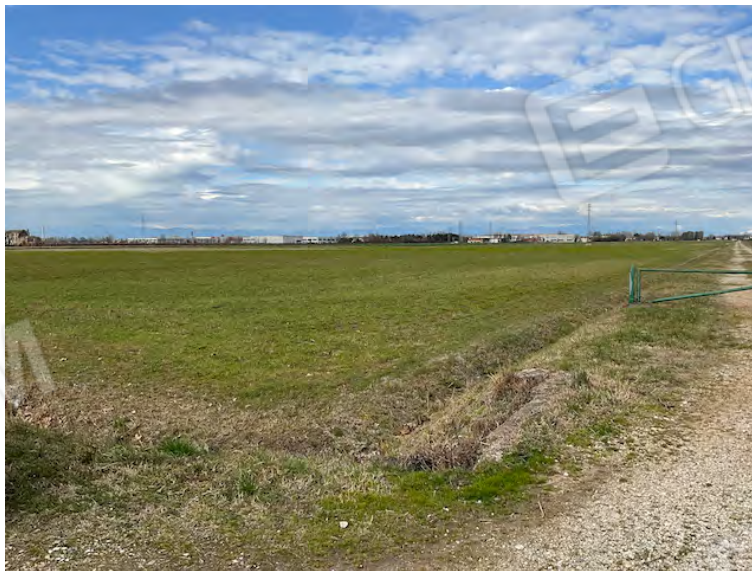
Lotto 1: accesso da sud