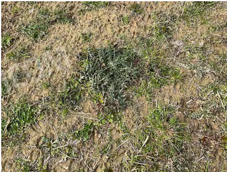
Lotto 1: terreno nudo