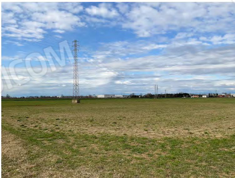
Lotto 1: elettrodotto