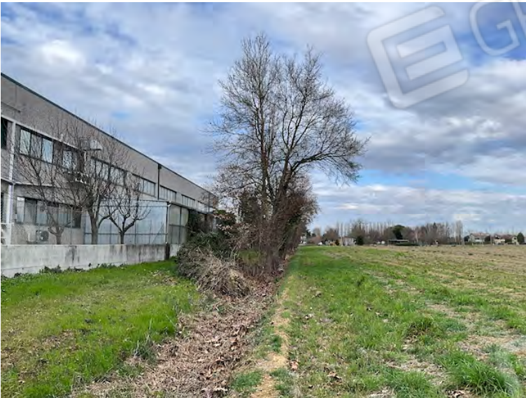
Lotto 2: una siepe arborea è cresciuta all'interno del fosso che separa l'area produttiva (a sinistra) dalla particella 14 (a destra)