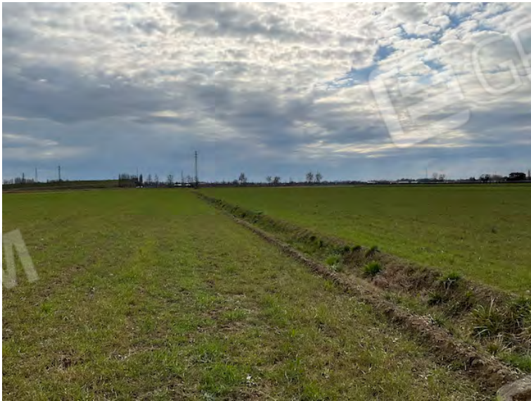
Lotto 1: fossa di scolo