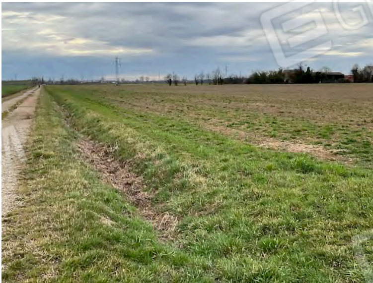
Lotto 2: vista da nord verso sud, a sinistra Strada degli Angeli, a destra le particelle 152 e 14, sullo sfondo l'elettrodotto