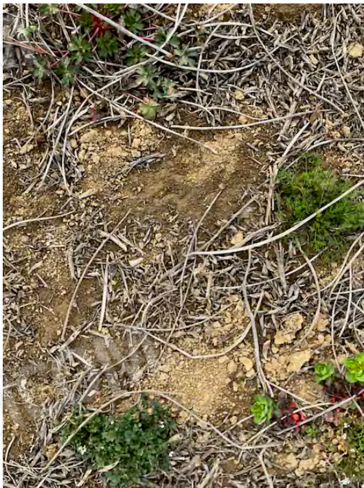
Lotto 2: residui dell'attività agricola (soia)