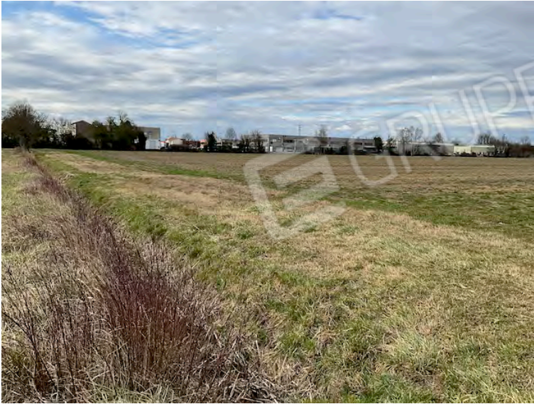
Lotto 2: vista verso nord dal confine sud