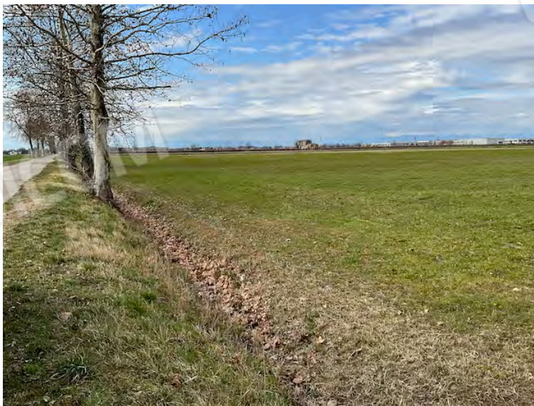
Lotto 1: accesso da sud a sinistra Via degli Angeli