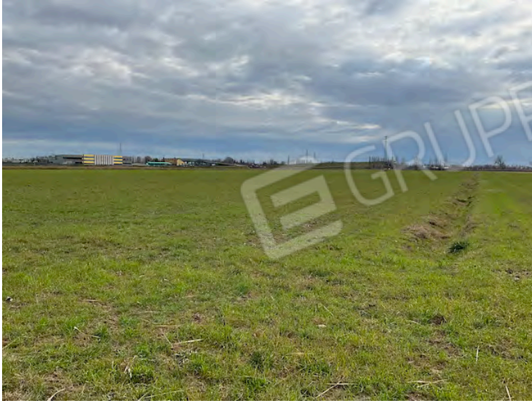
Lotto 1: particella 149 vista verso nord e area produttiva