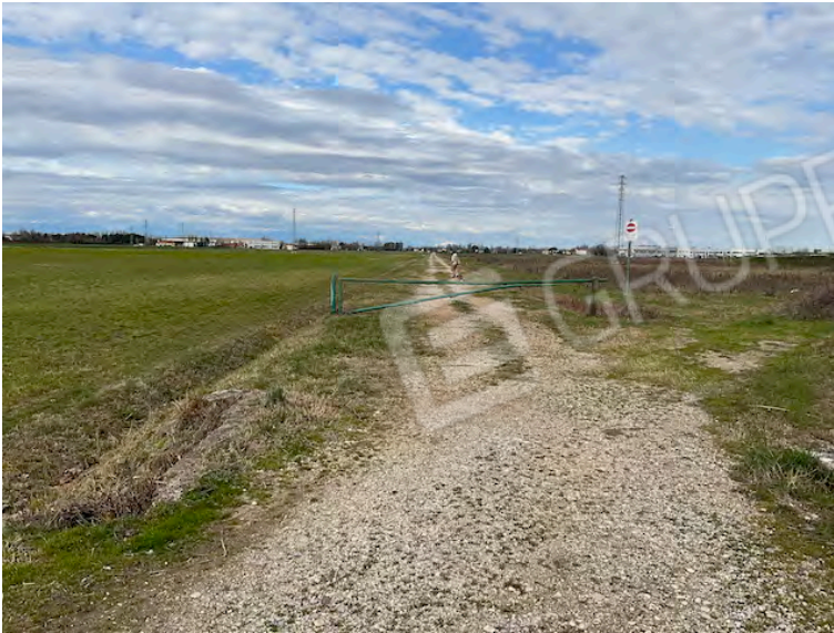
Lotto 1: accesso da sud, proseguenza Via degli Angeli