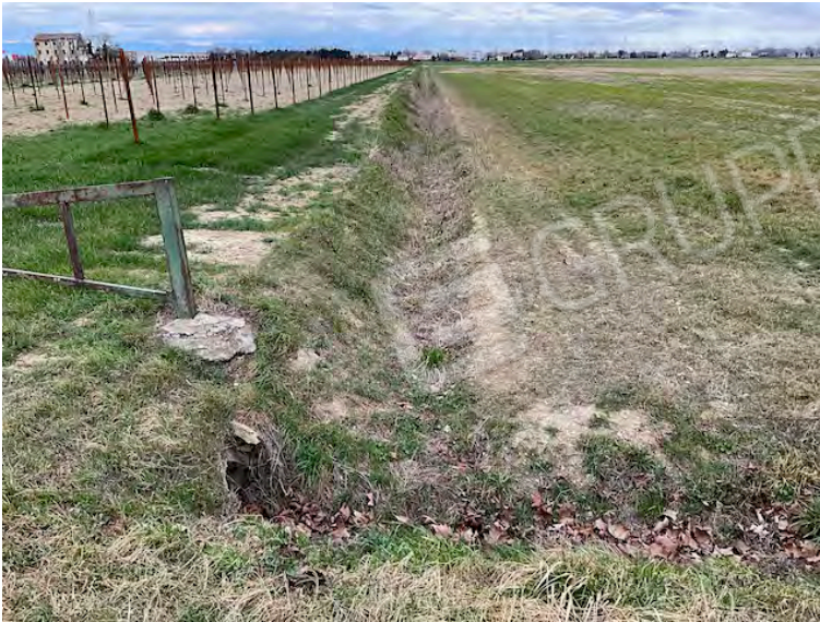
Lotto 1: confine sud-ovest, a sinistra la particella 47. Sullo sfondo la particella 38 priva di fabbricato, ancora riportato sulla mappa catastale non aggiornata