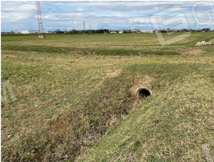
Lotto 1: capezzagna e fosso di scolo