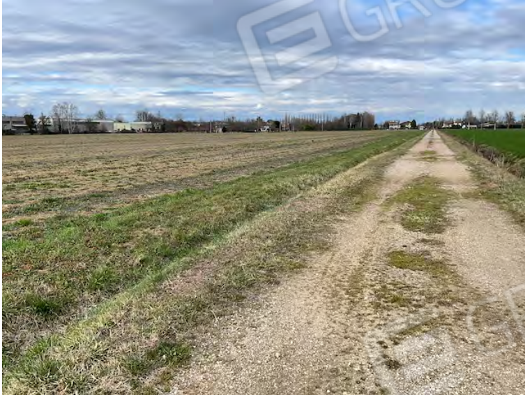
Lotto 2: a sinistra la particella 152 e strada degli Angeli vista verso nord