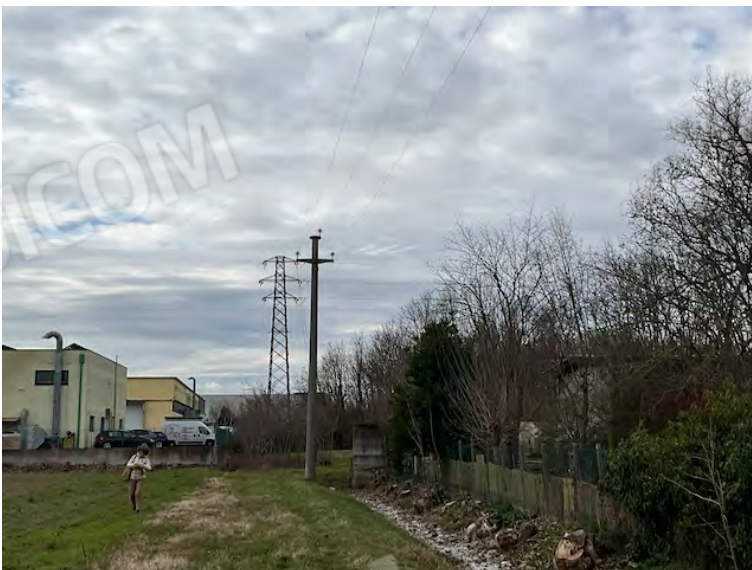
Lotto 2: confine nord della particella 14 (a sinistra)