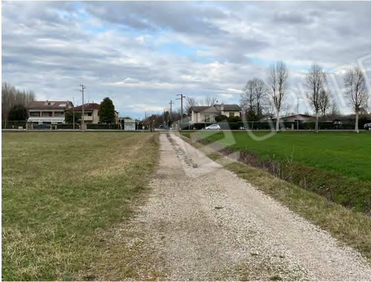
Lotto 2: accesso nord da Via san Michele, a sinistra la particella 152