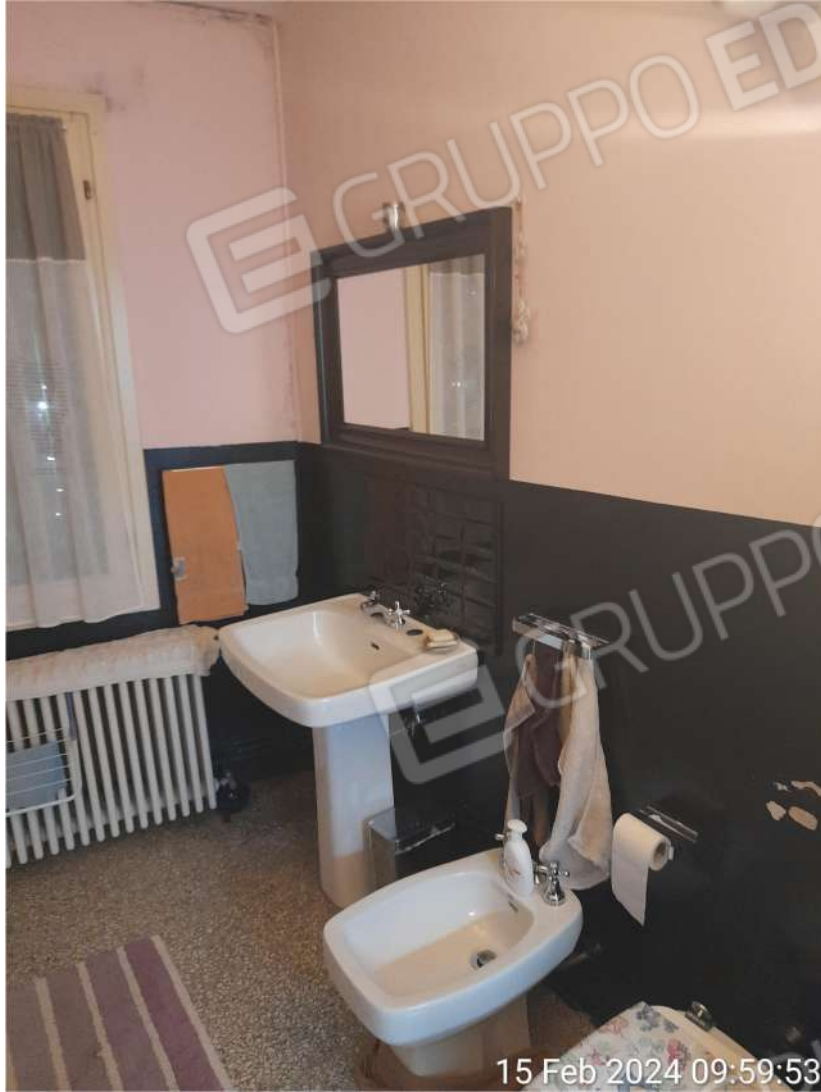
Bagno piano primo