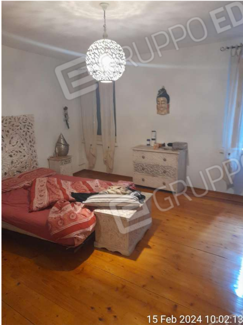
Camera piano primo