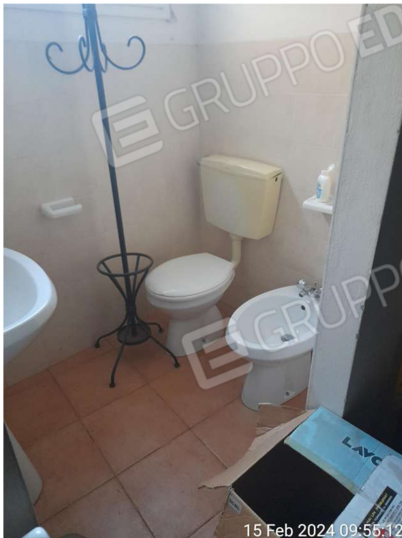
Bagno piano terra