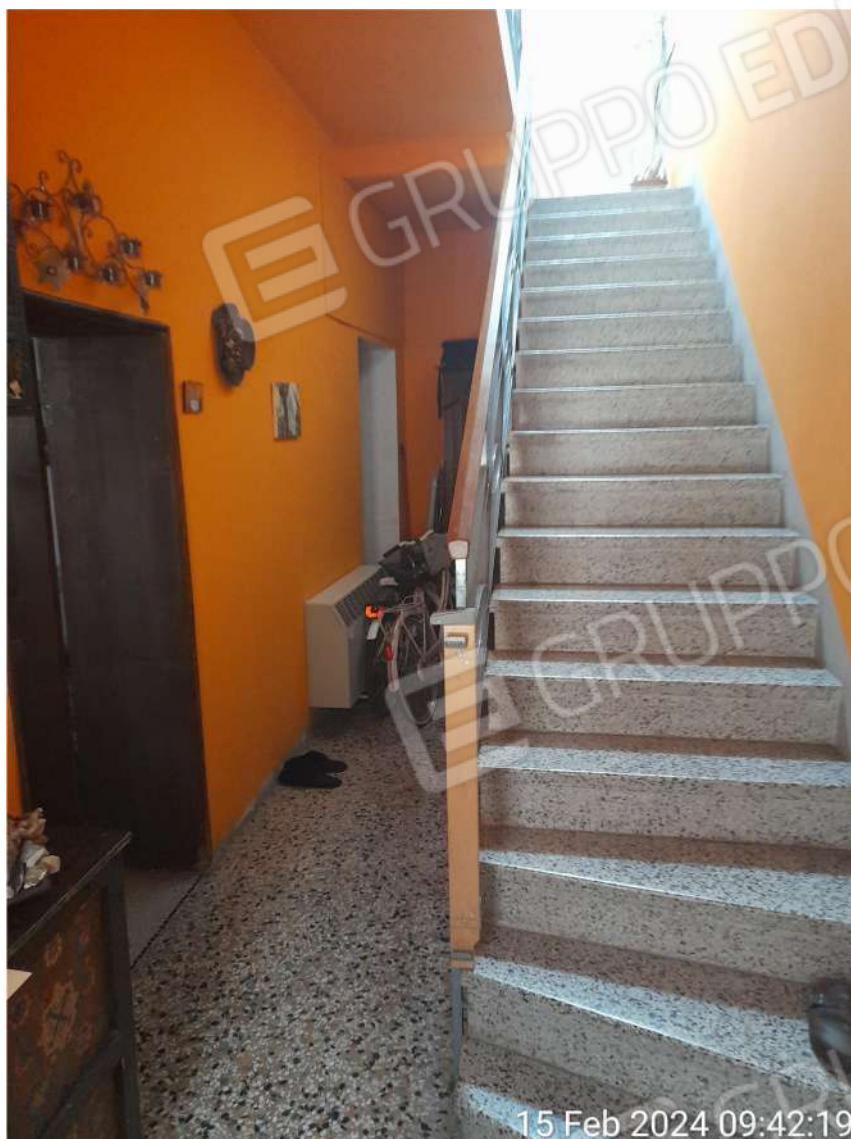
Ingresso al piano terra con scala di accesso alla zona notte