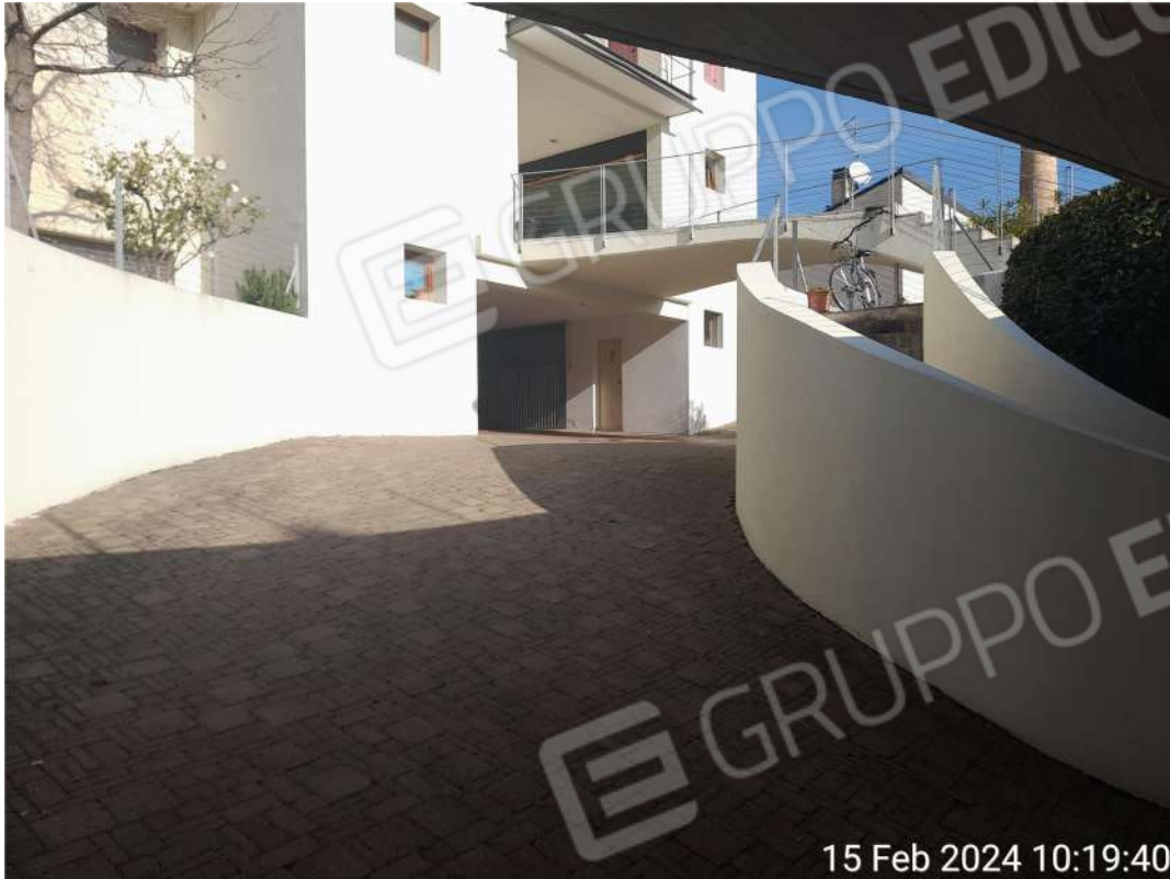
Rampa autorimessa garage vista da sotto