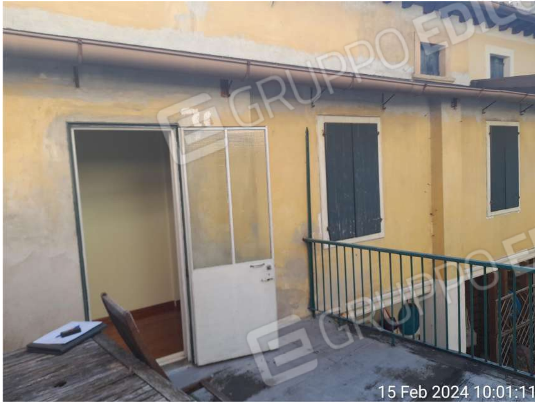
Terrazzo piano primo