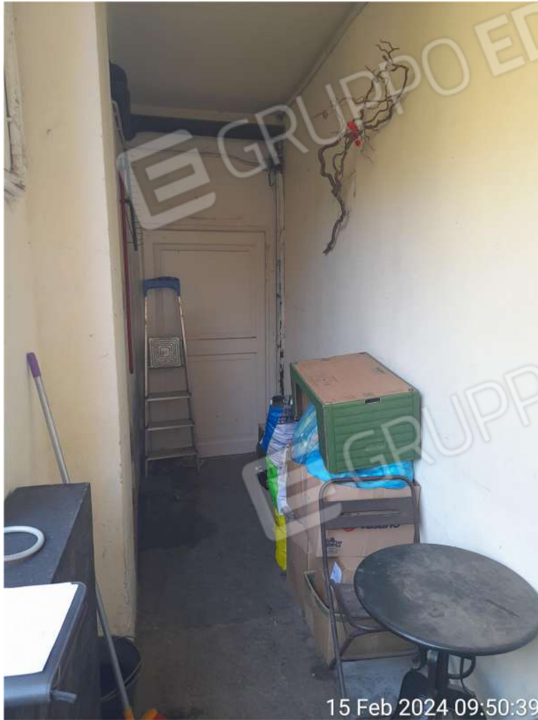
Loggia esterna - portico