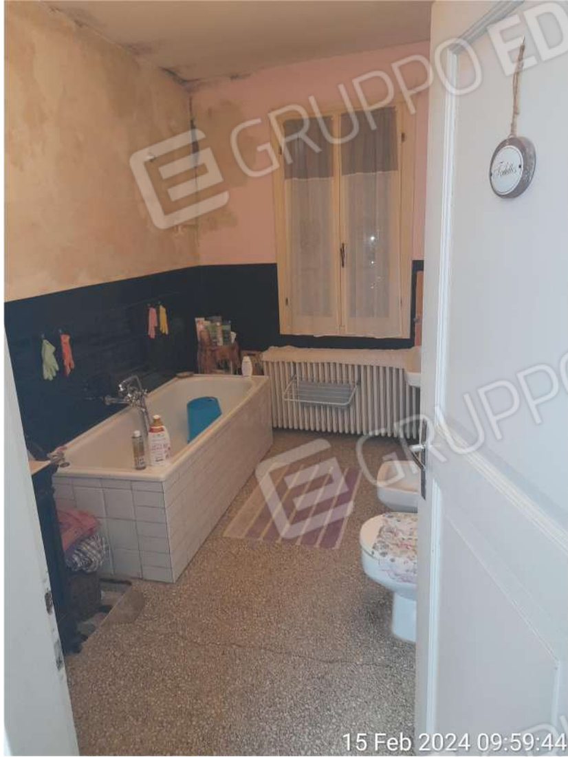
Bagno piano primo