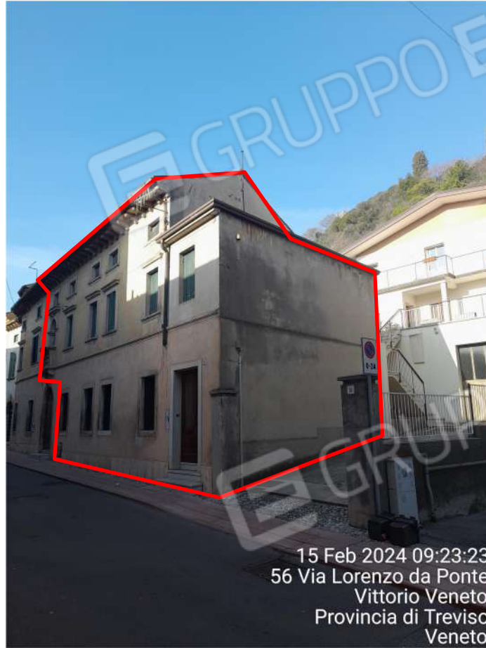
Vista esterna abitazione (il civico è 54 e non il 56 erroneamente attribuito dal software di localizzazione)