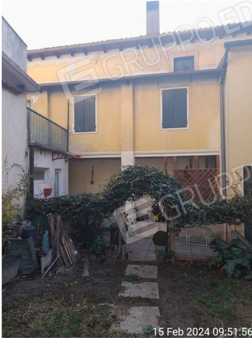
Area esterna e facciata nord con portico