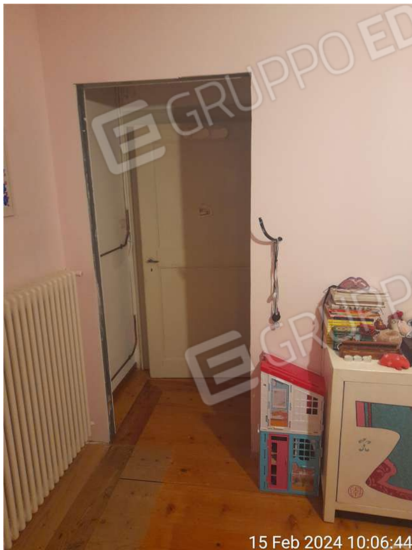
Parete da sanare sulla seconda camera al piano primo