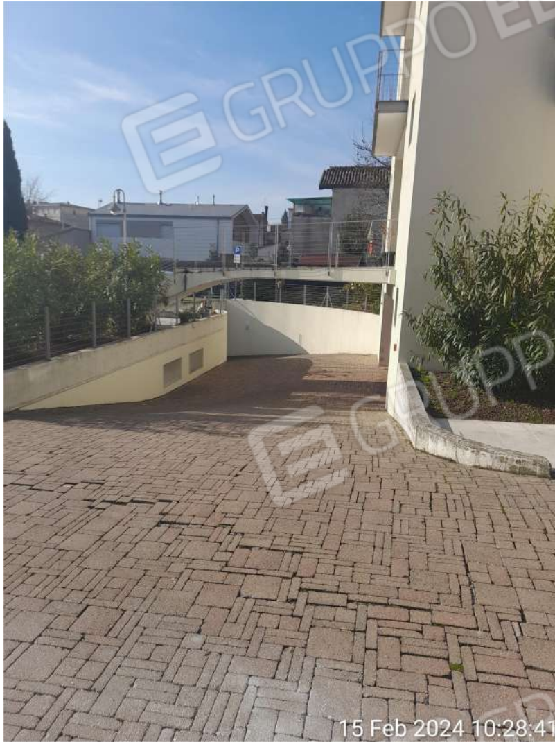
Rampa autorimessa garage