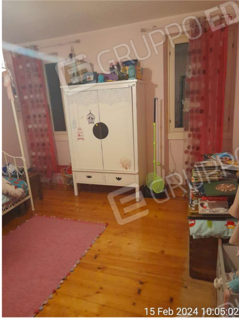
Seconda camera piano primo