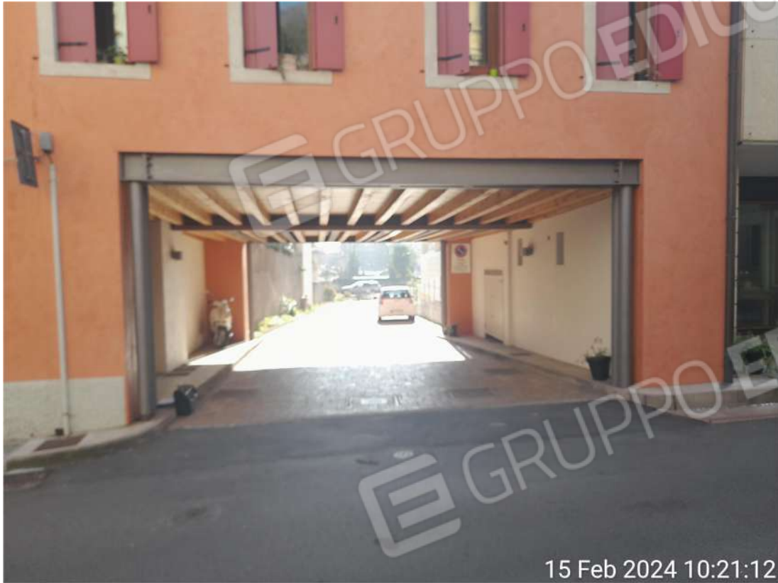
Accesso da via Da Ponte autorimessa garage