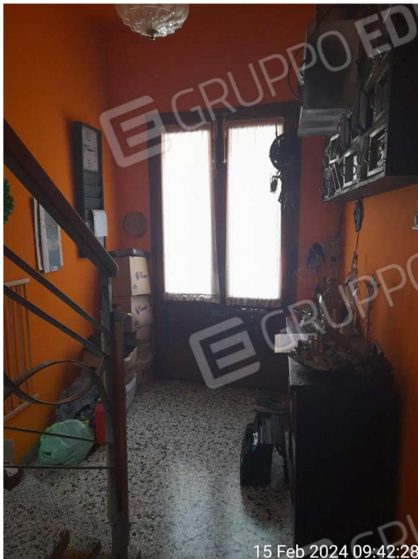
Ingresso al piano terra – vista portoncino