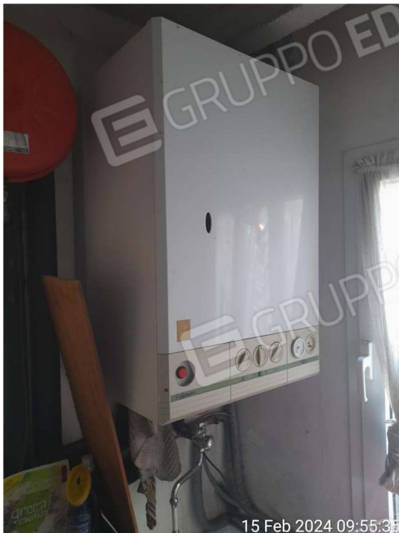
Caldaia in ripostiglio-bagno piano terra