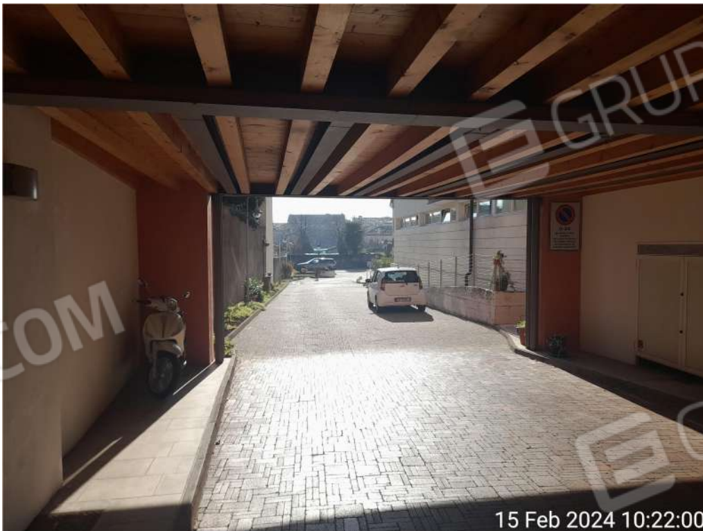
Accesso da via Da Ponte autorimessa garage