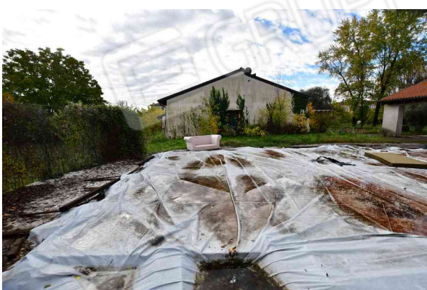
6. Vista verso sud.

Riferimento per l'individuazione dei luoghi: allegato grafico n. 3 – rilievo stato di fatto.