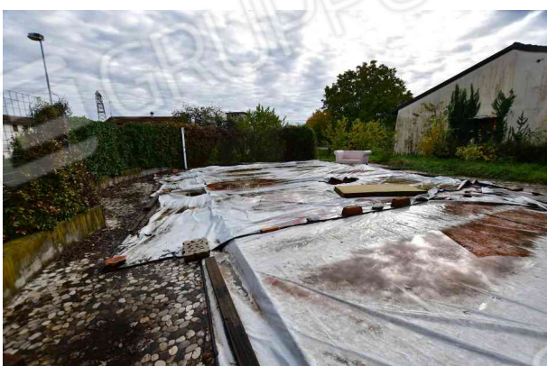
4. Vista verso est, lato nord (2 di 2).