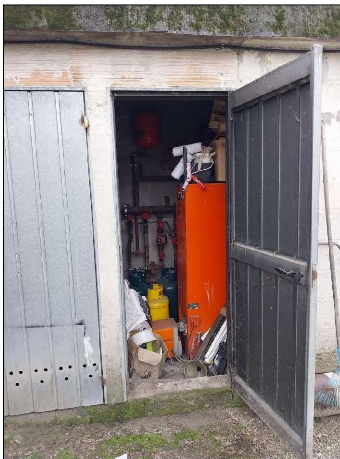
15) Interno magazzino