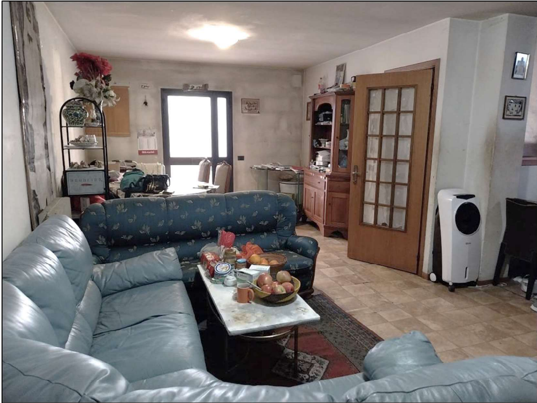
3) Ingresso – soggiorno