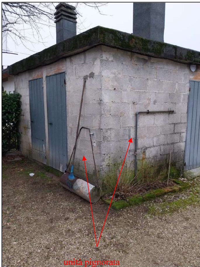
13) Magazzino staccato