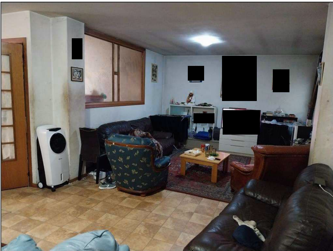
4) Soggiorno (vetrata sopra muretto divisorio con cucina9