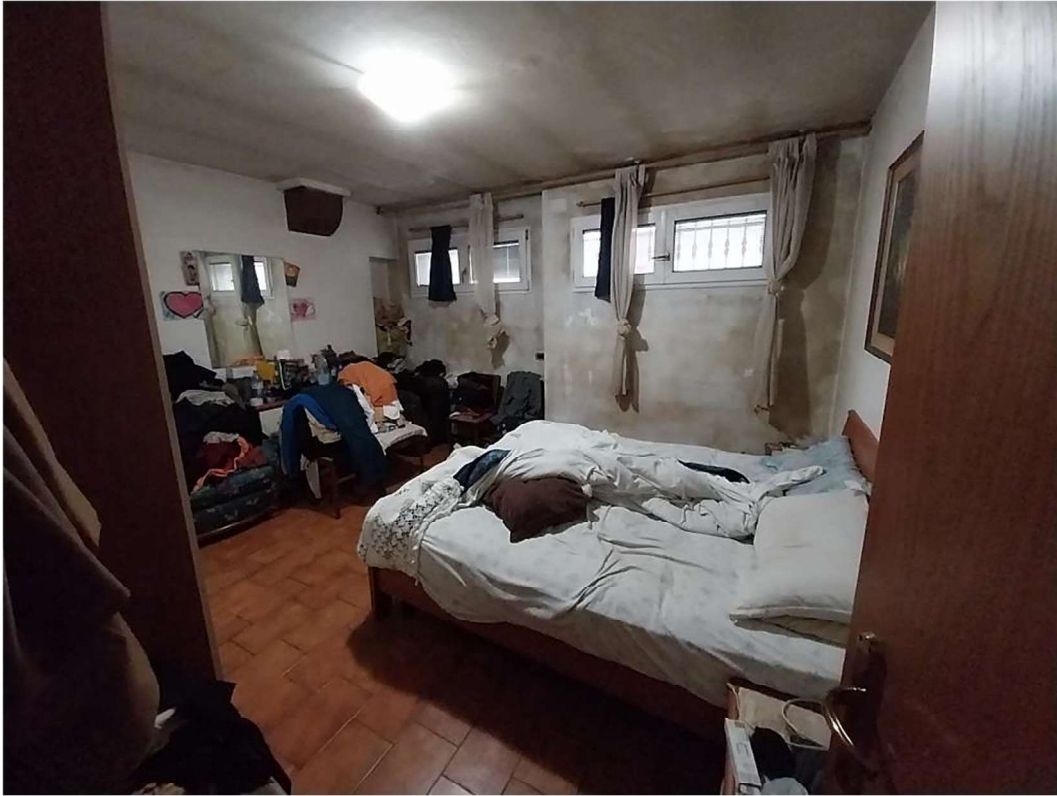
13) Camera matrimoniale