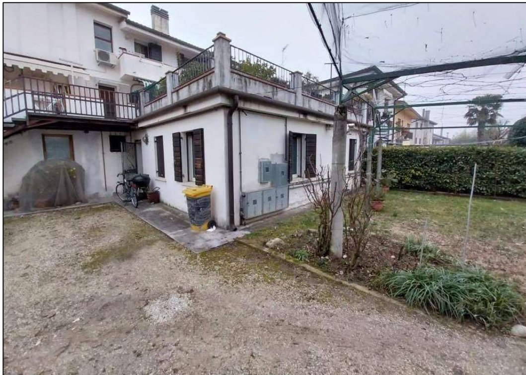
2) Lati sud ed est (parte con copertura a terrazza)