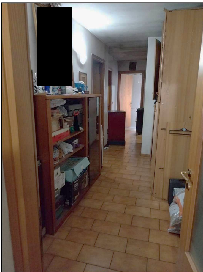
8) Corridoio lato ovest