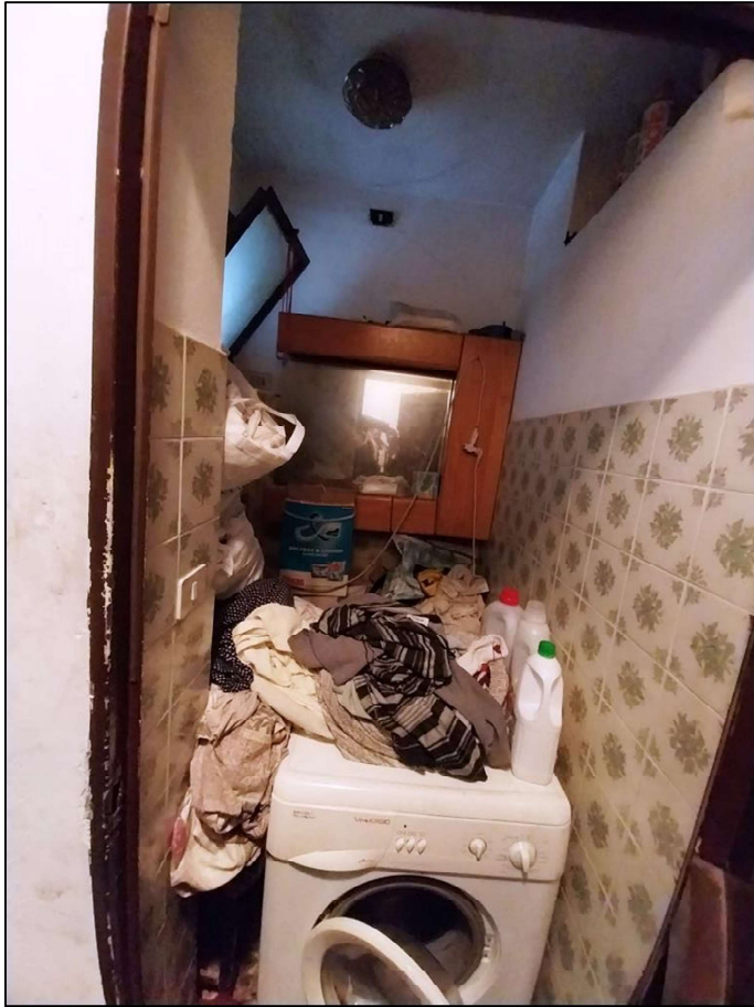
6) Wc lato est