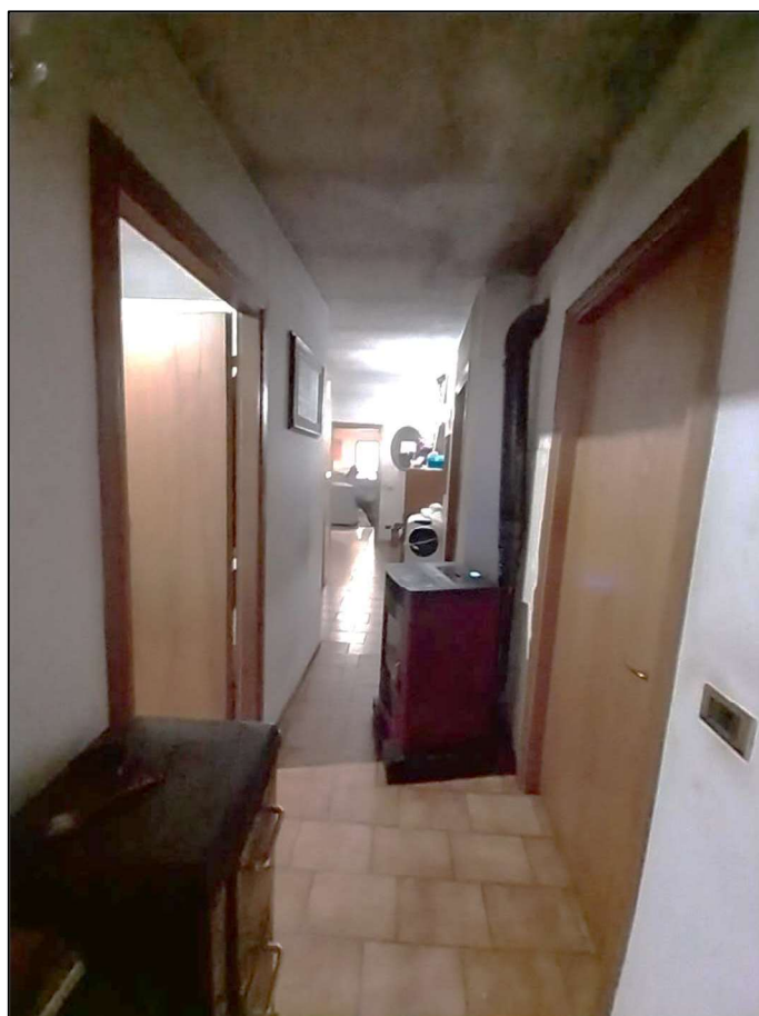
9) Corridoio lato ovest