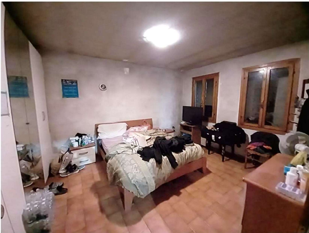
14) Camera matrimoniale