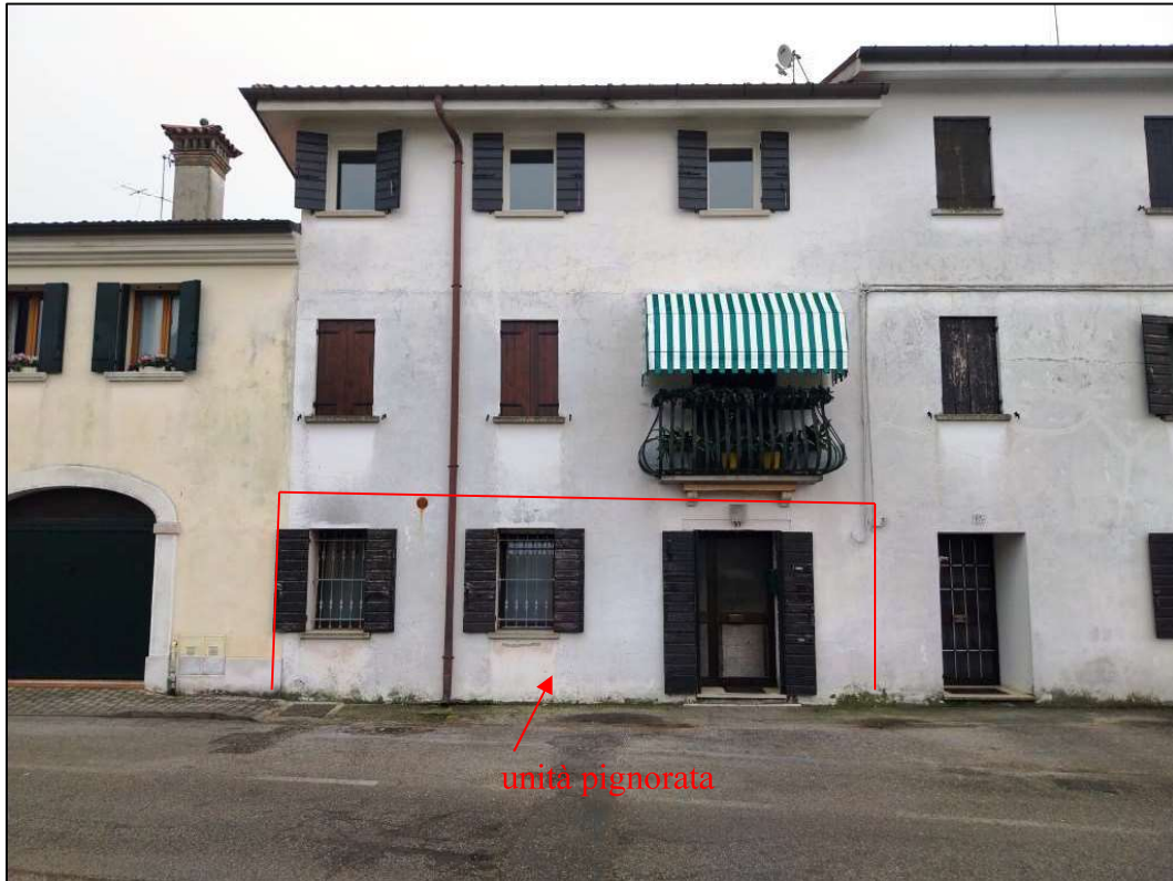
1) Lato nord – accesso da Via Caseggiato