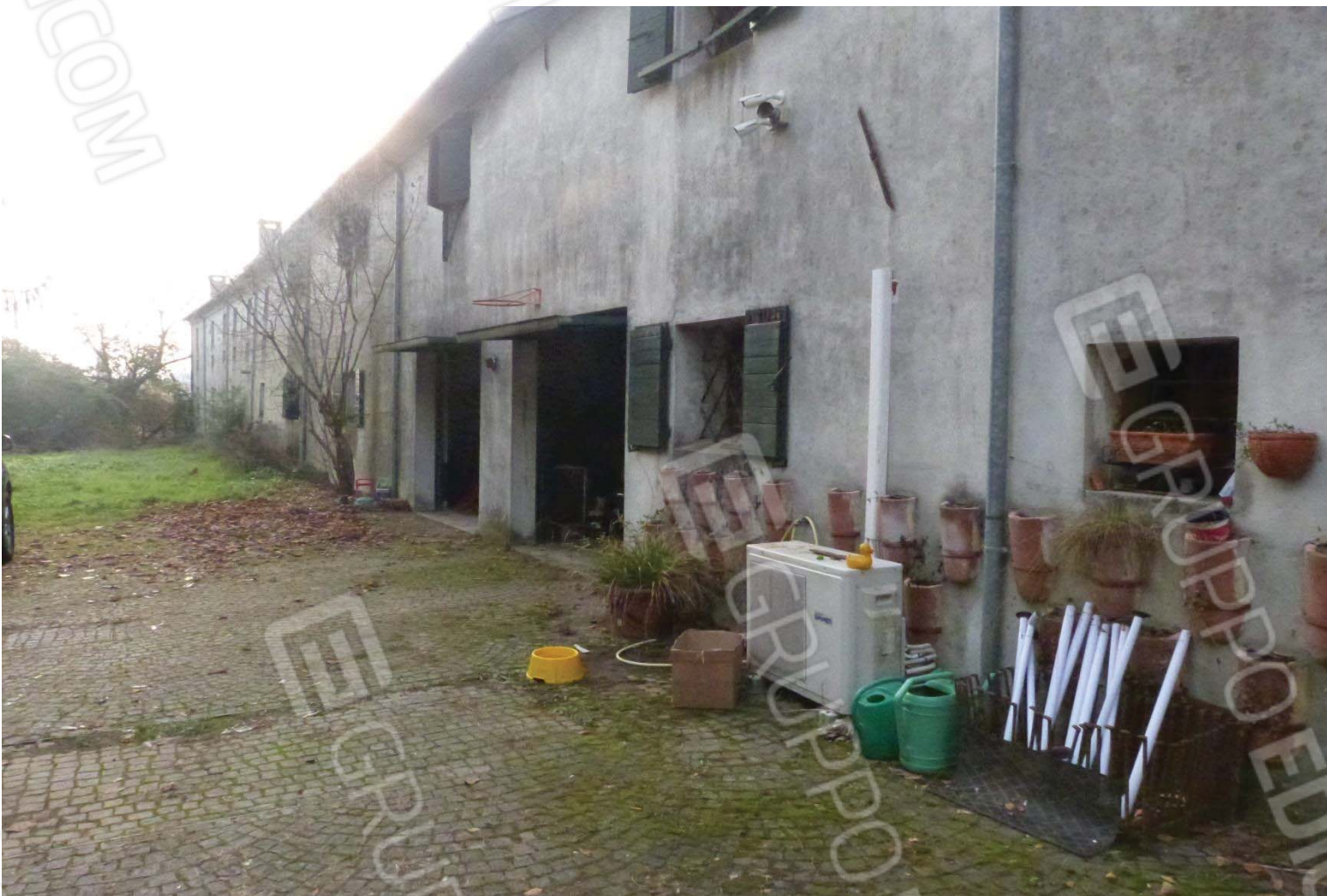
Area scoperta con piscina dismessa.