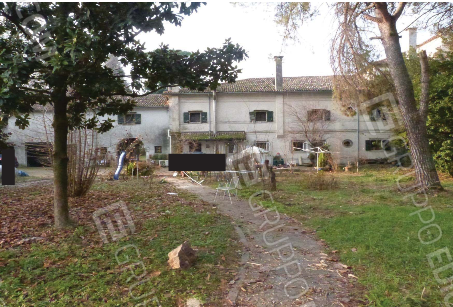
Prospetto nord della barchessa con gli accessi all'autorimessa.