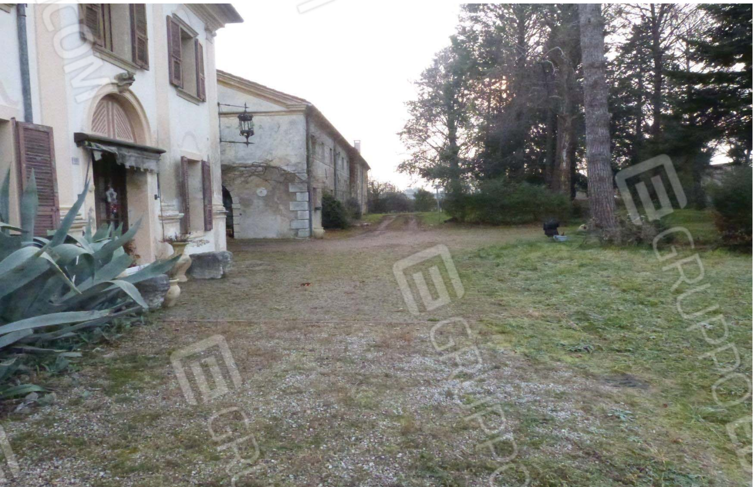
Portico passante a separare il corpo della villa dalla barchessa.