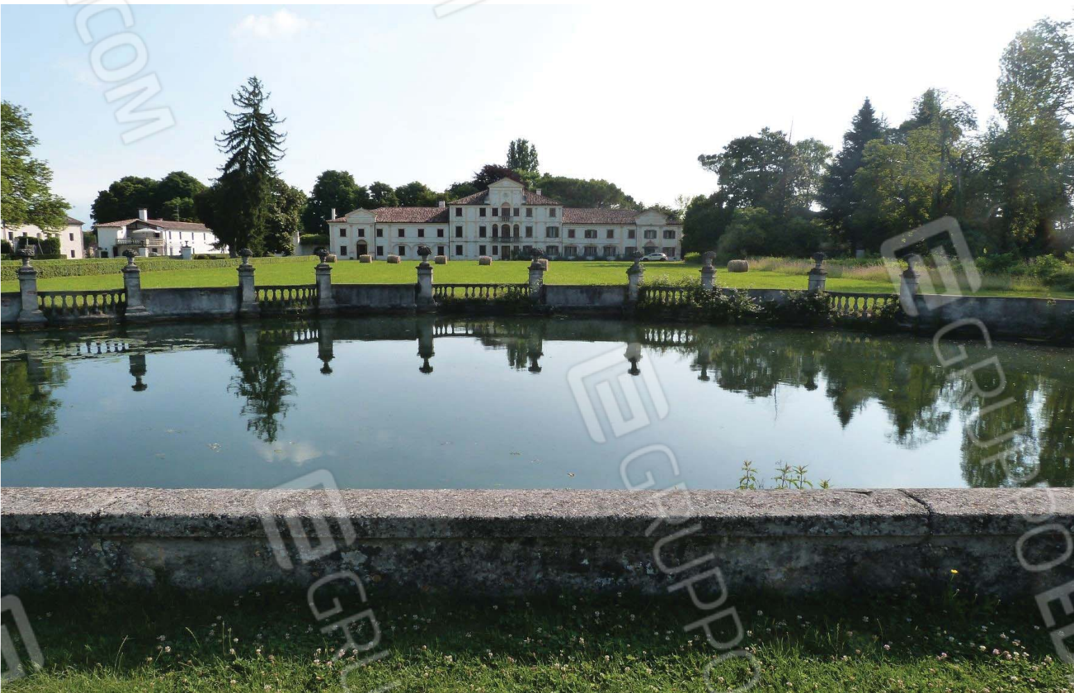
Vista del fronte principale di Villa Toderini.