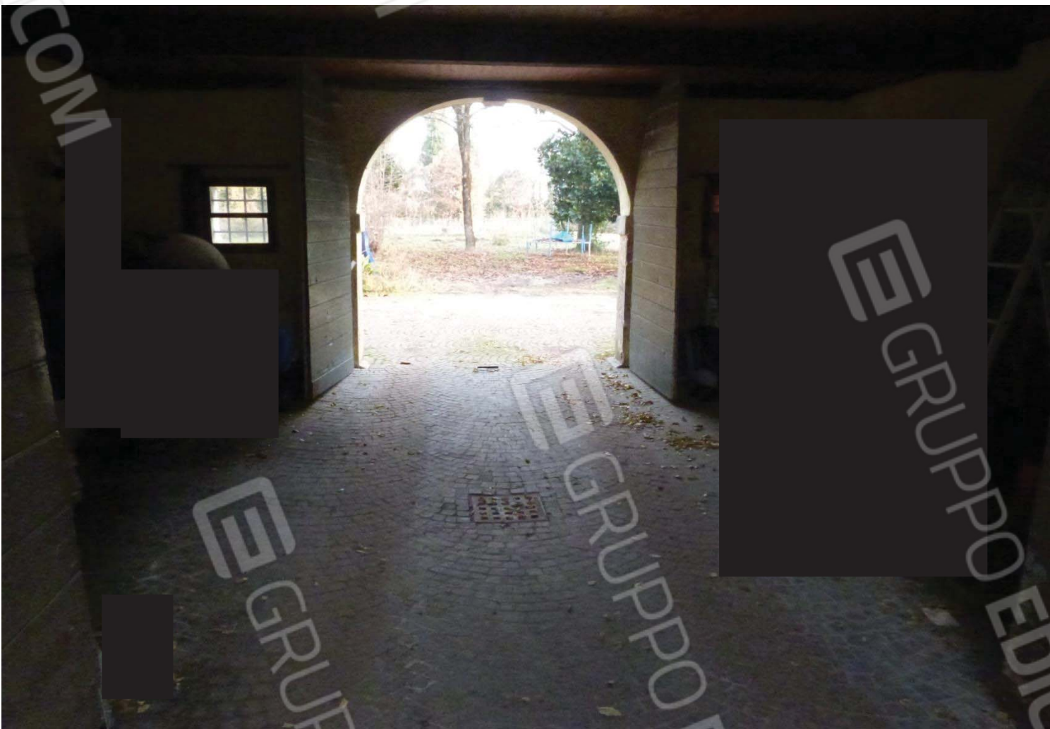
Ala est della villa-Prospetto nord e area scoperta.