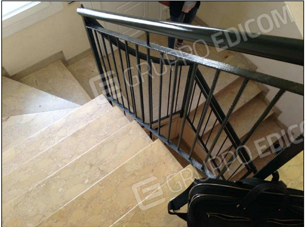
VISTA SCALE CONDOMINIALI