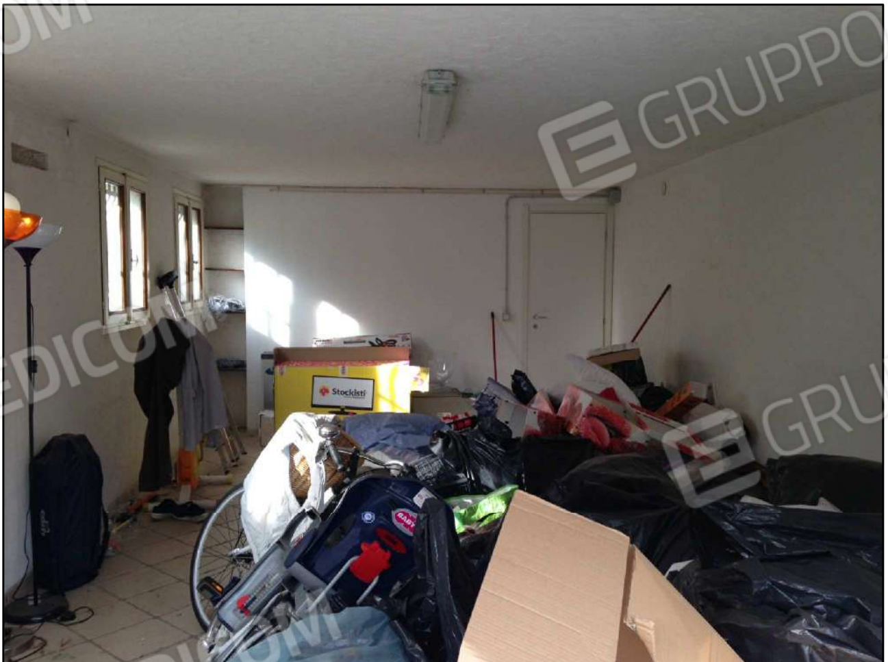
CONO VISUALE N. 08