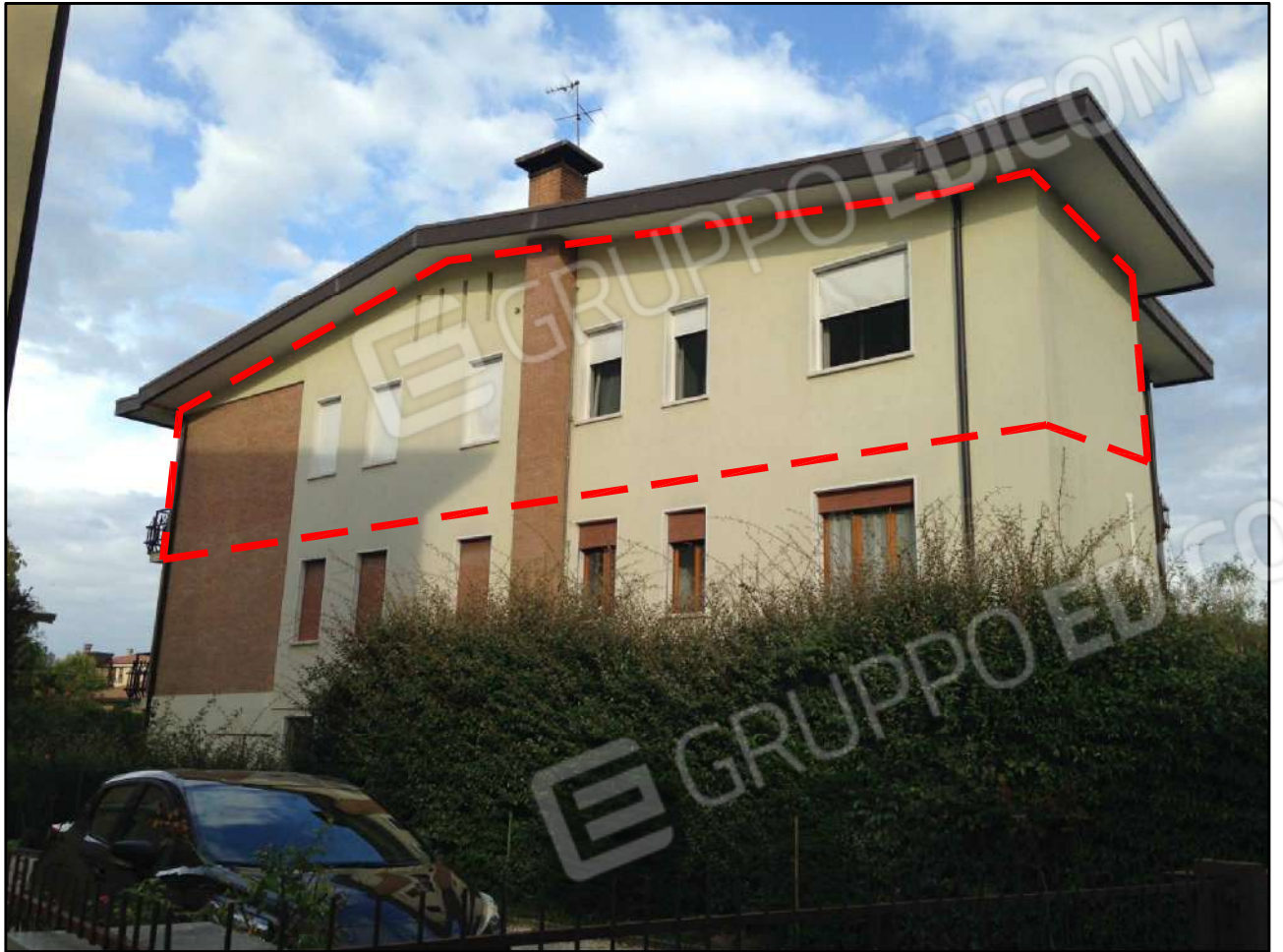
CONO VISUALE N. 01