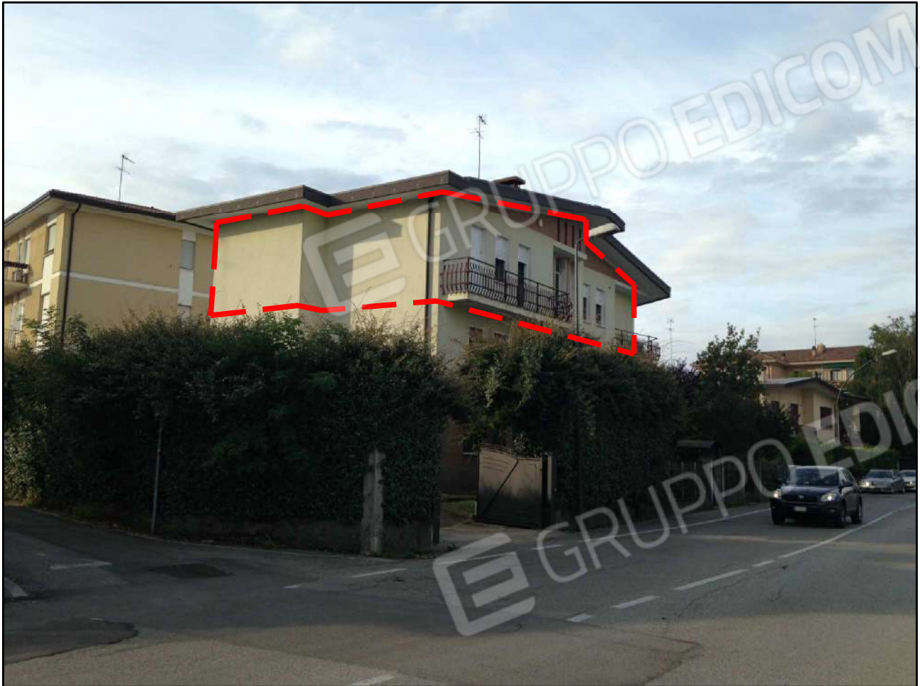
CONO VISUALE N. 03