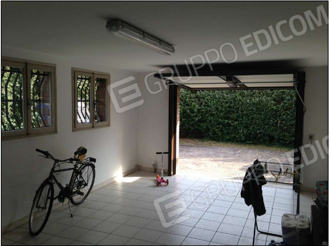
CONO VISUALE N. 07