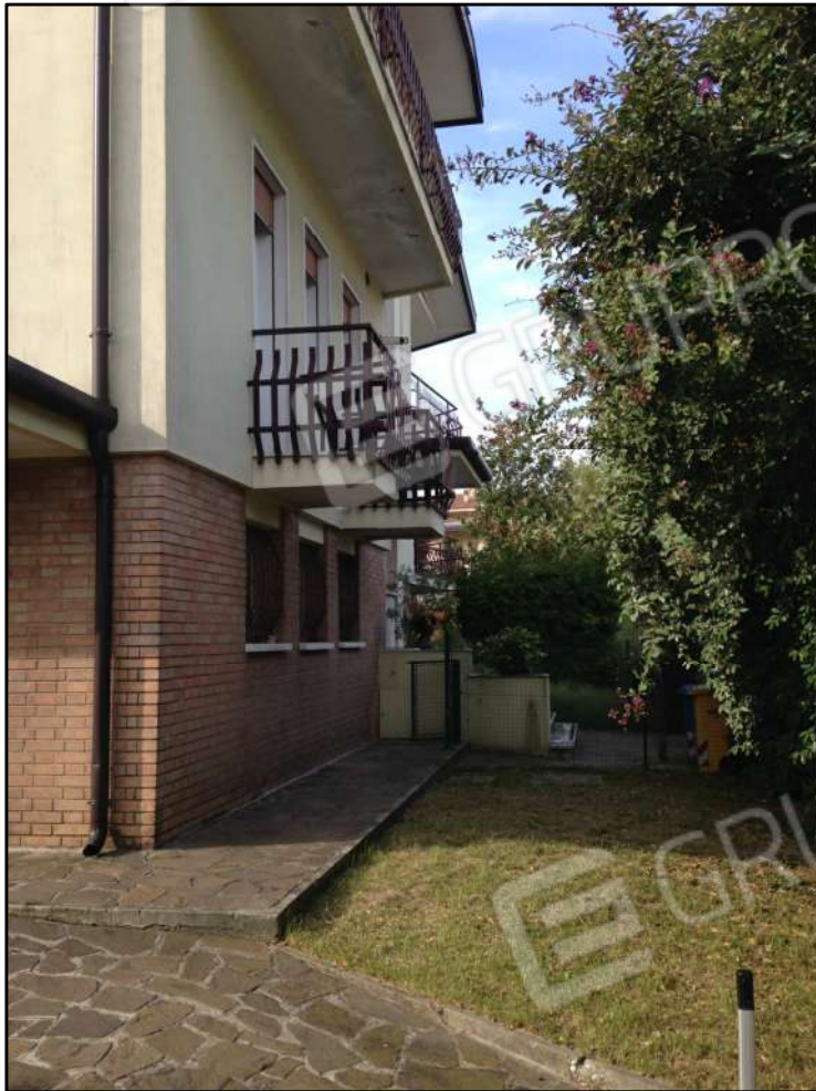
CONO VISUALE N. 05