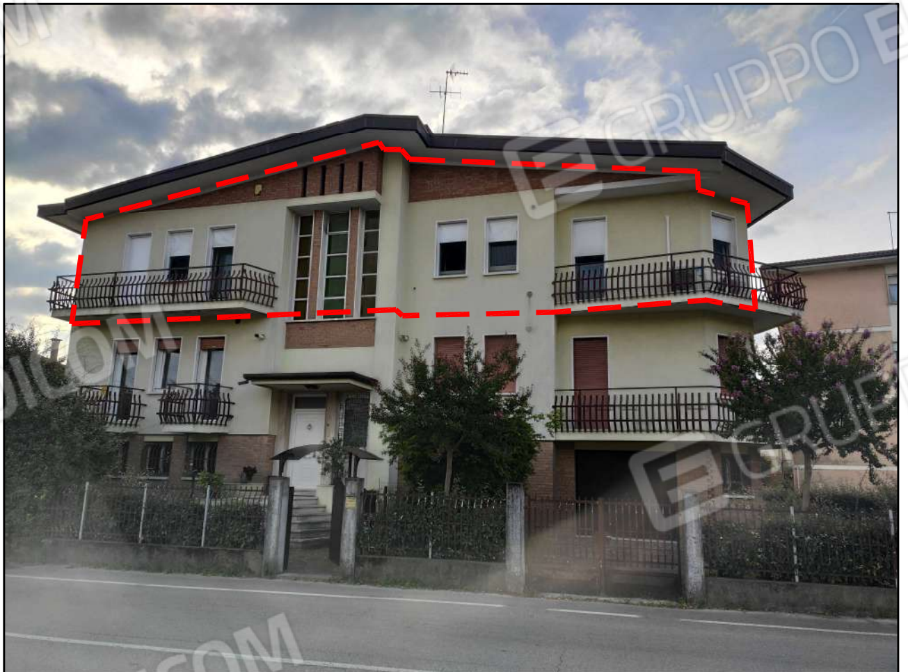
CONO VISUALE N. 02