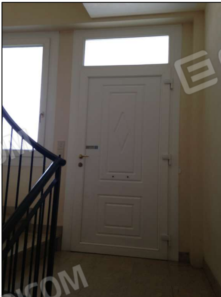
VISTA INTERNA ACCESSO COMUNE