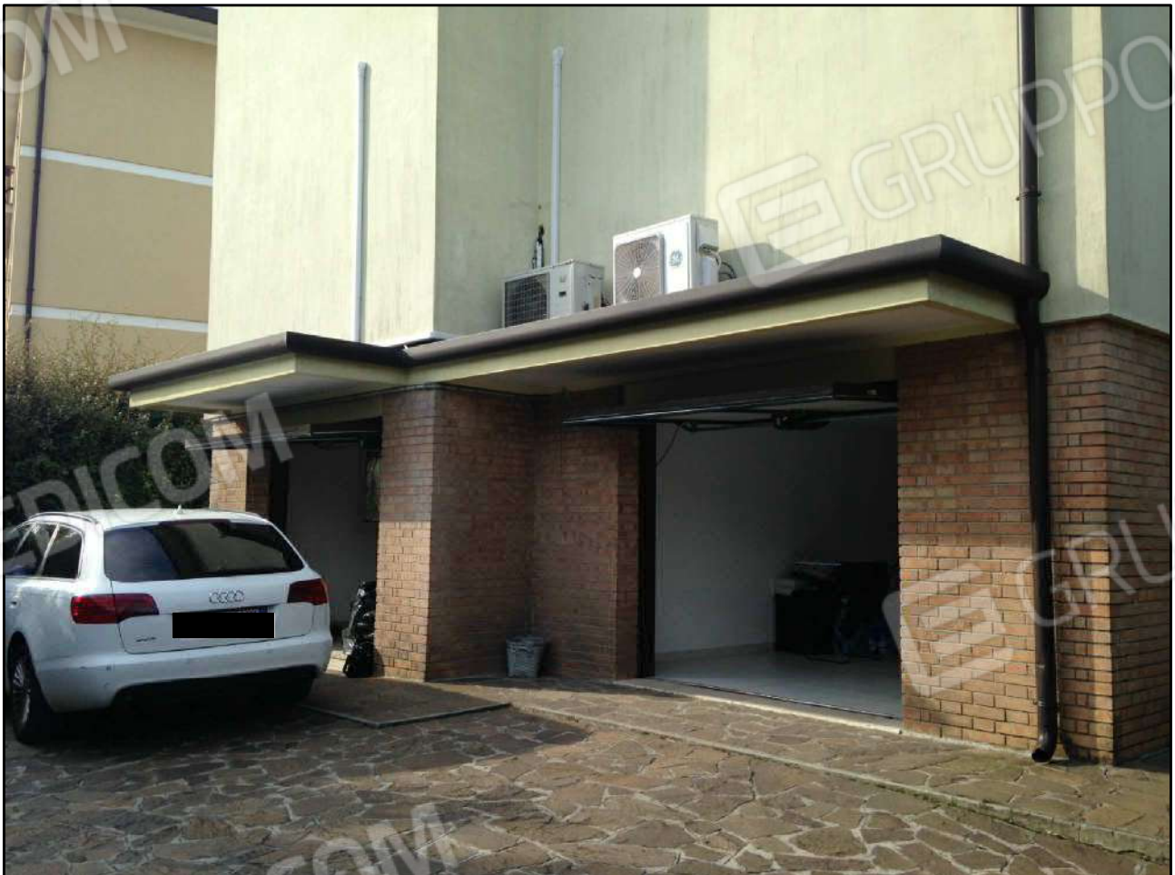
CONO VISUALE N. 04