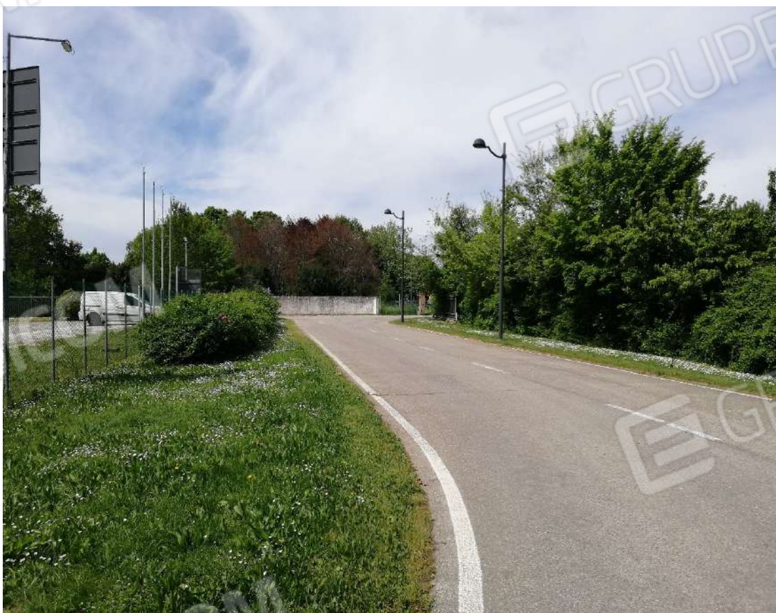
Fotografia n. 02 – Strada di accesso al lotto