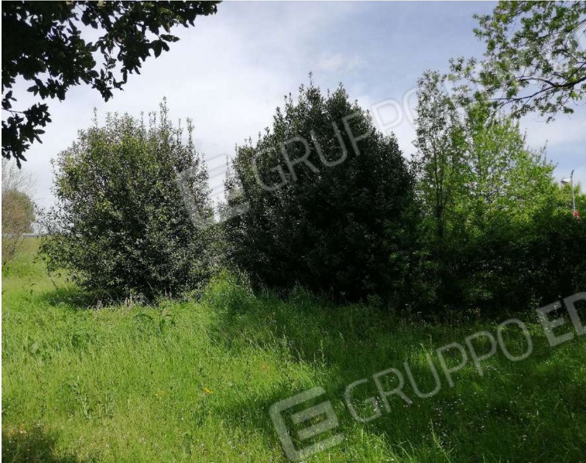
Fotografia n. 13 – Zona a prato con alberature sparse limitrofe