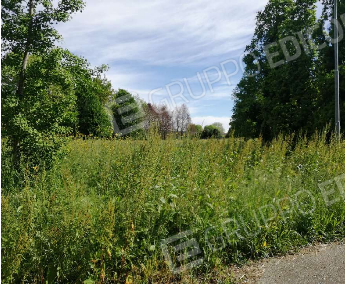
Fotografia n. 07 – Zona a prato contornata da quinte arboree