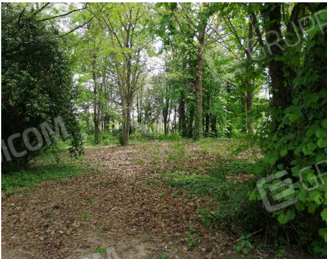
Fotografia n. 20 – Zona boscata, lato Nord del lotto