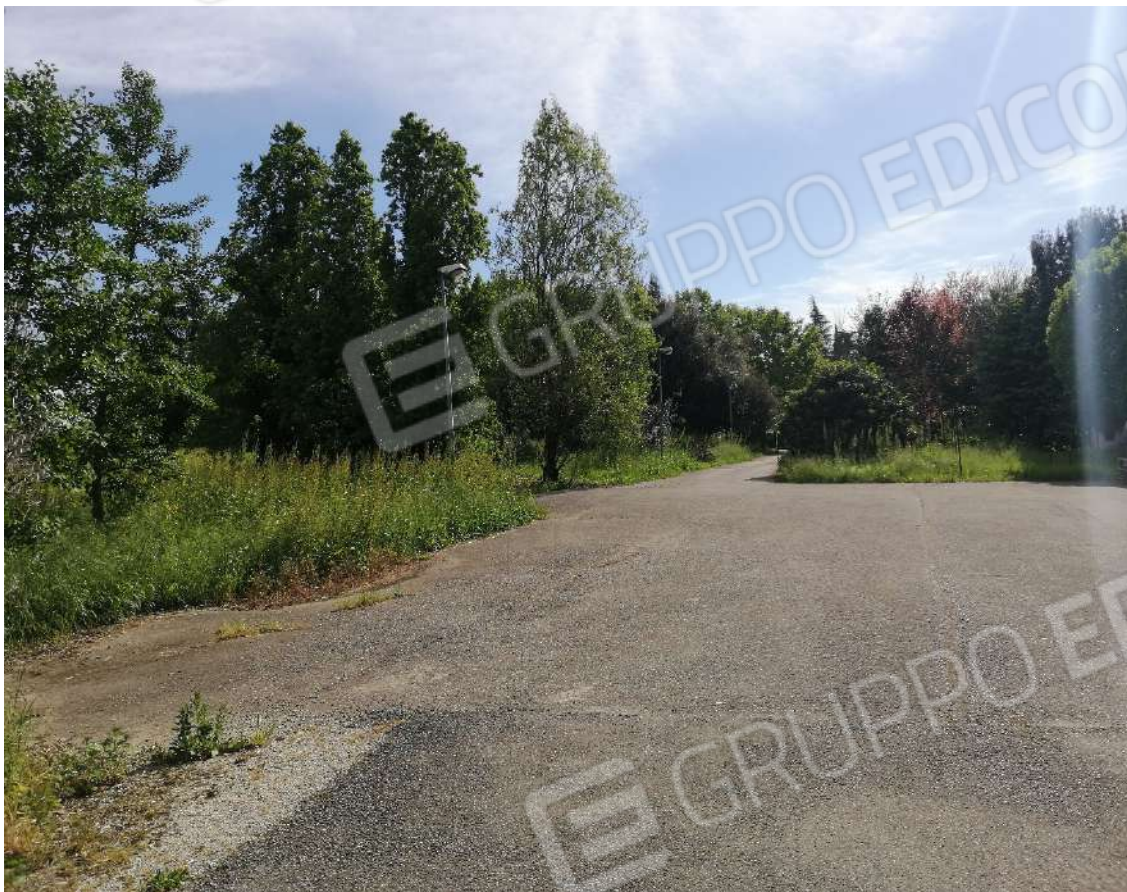
Fotografia n. 05 – Piazzale lungo la strada di accesso, fronte lotto 1