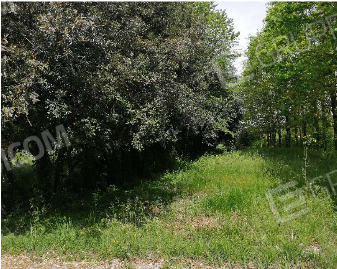
Fotografia n. 10 – Zona a prato contornata da quinte arboree