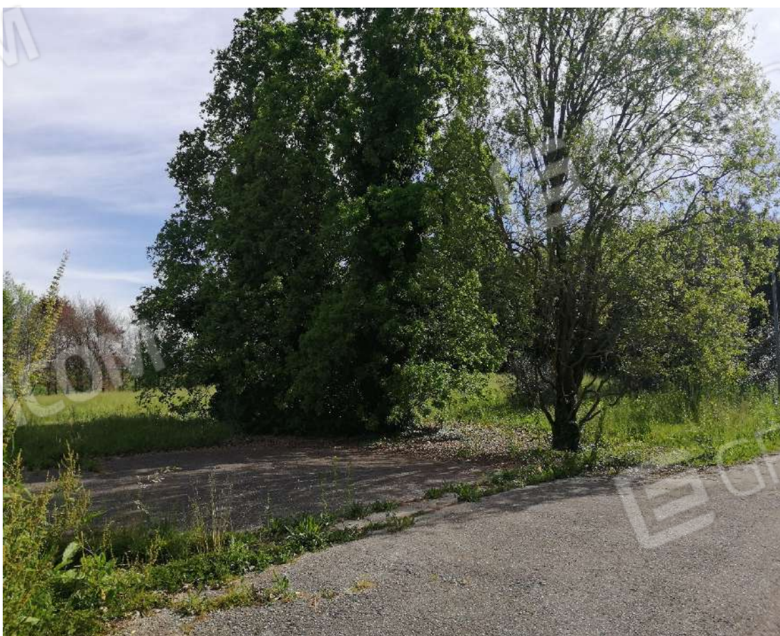
Fotografia n. 06 – Piazzale lungo la strada di accesso, fronte lotto 1, con prosopis alberature