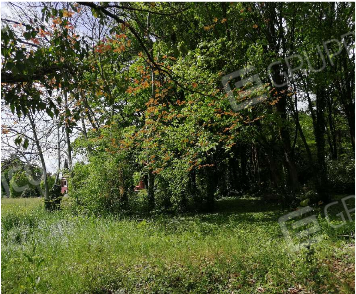
Fotografia n. 16 – Inizio zona boscata, lato Nord del lotto