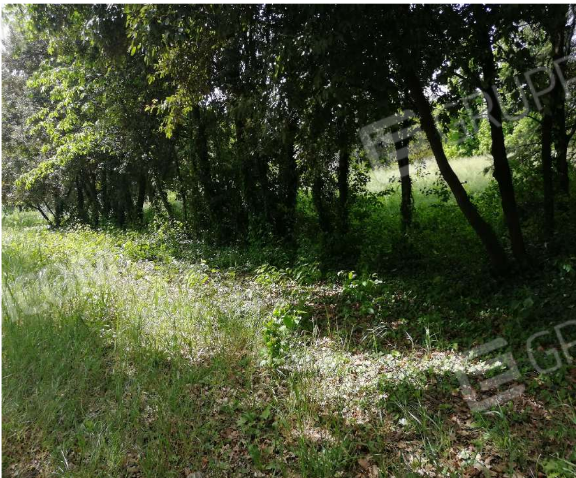
Fotografia n. 12 – Zona a prato e filari arborei