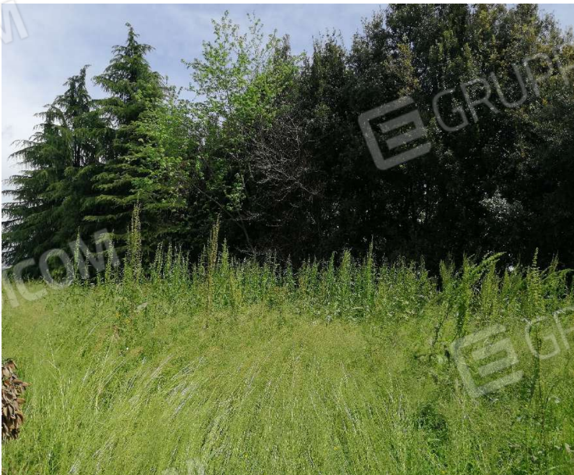
Fotografia n. 08 – Zona a prato contornata da quinte arboree