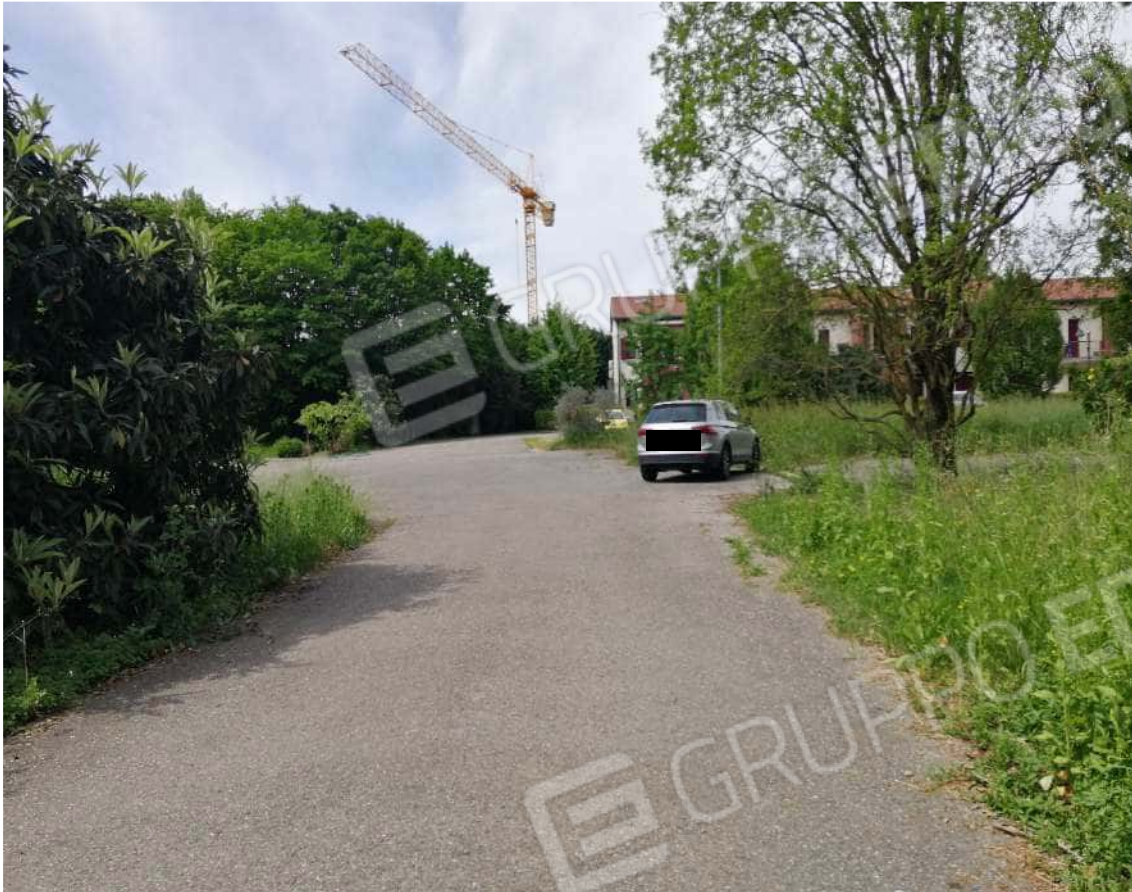
Fotografia n. 03 – Strada di accesso al lotto in prossimità del limitrofo lotto 1