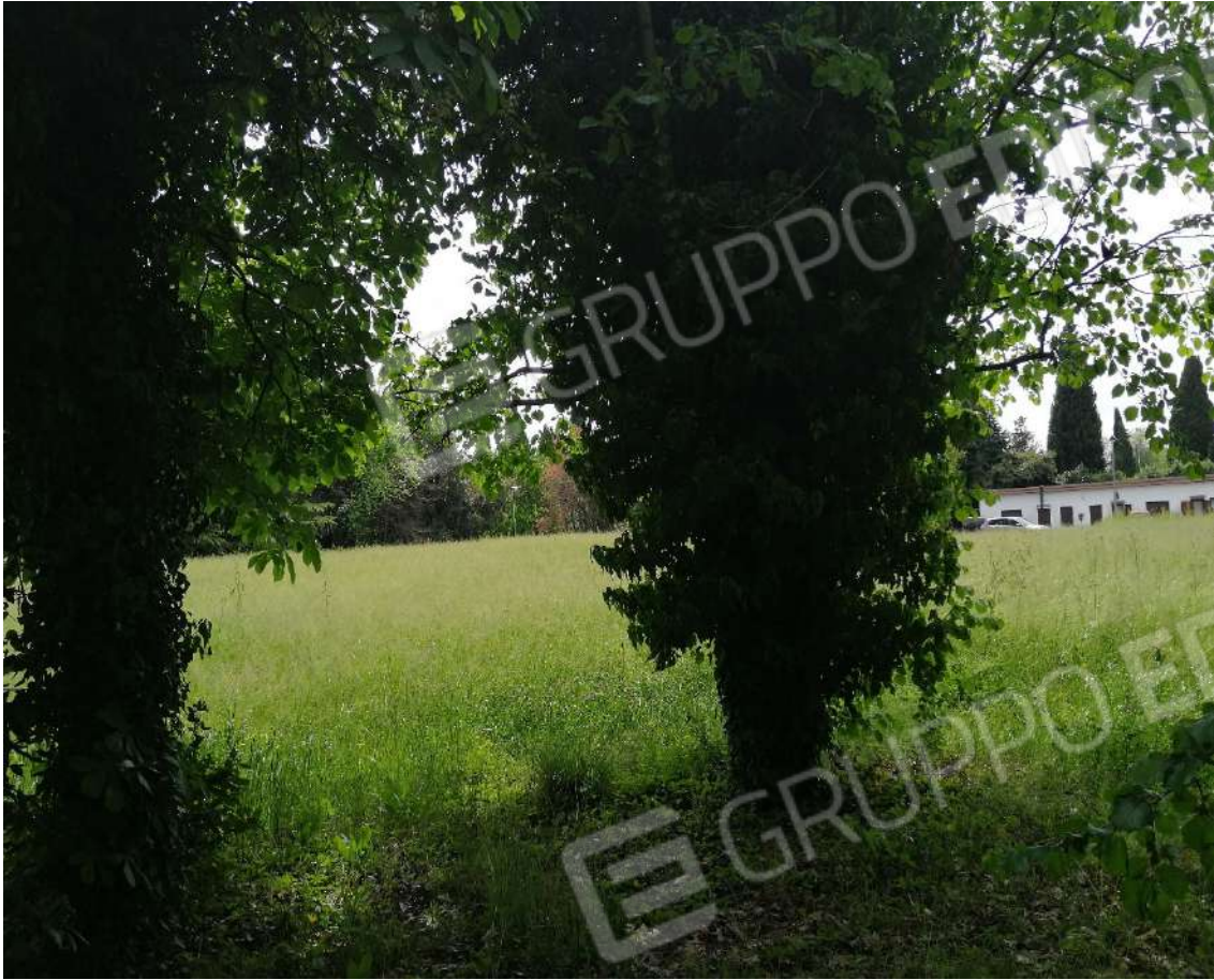
Fotografia n. 17 – Zona a prato con filare di quercie, con vista del lotto 1 sullo sfondo