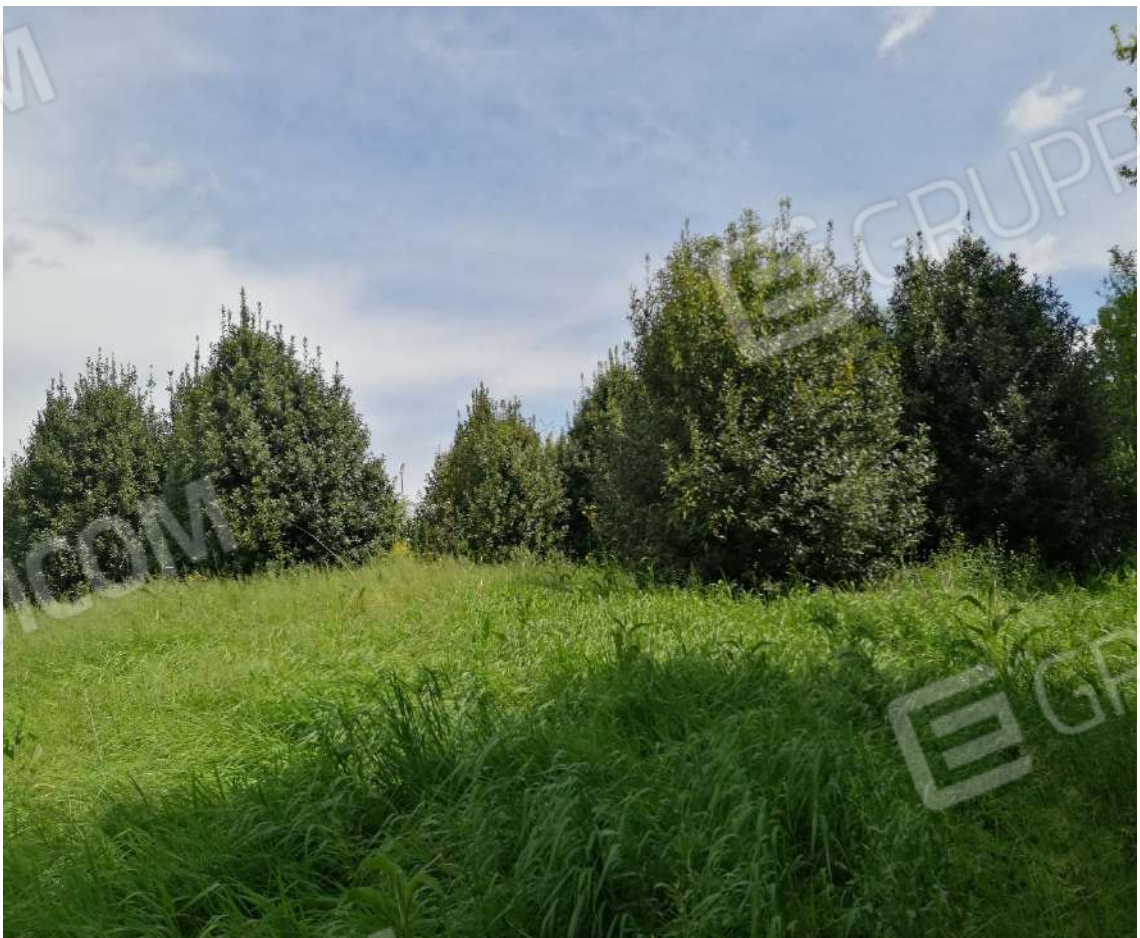
Fotografia n. 14 – Zona a prato con alberature sparse limitrofe