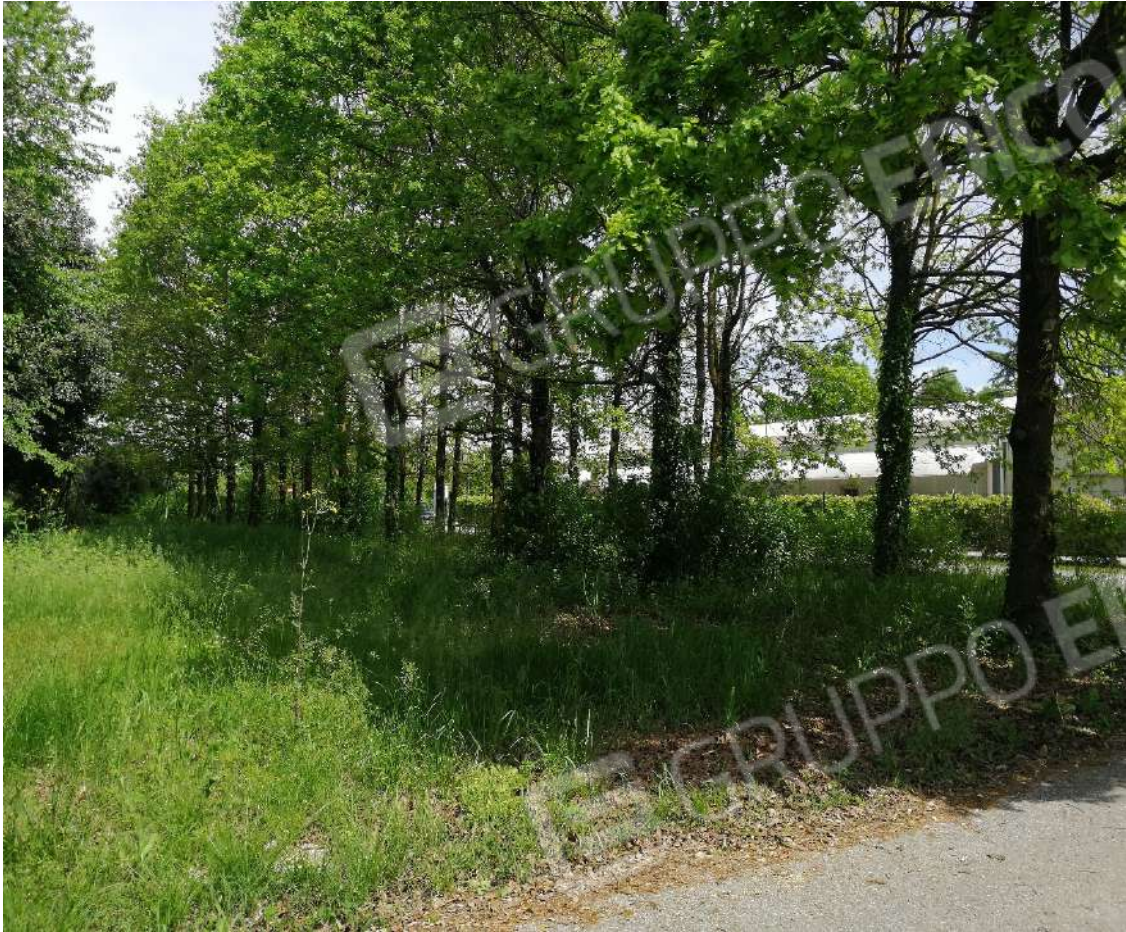
Fotografia n. 09 – Zona a prato contornata da quinte arboree