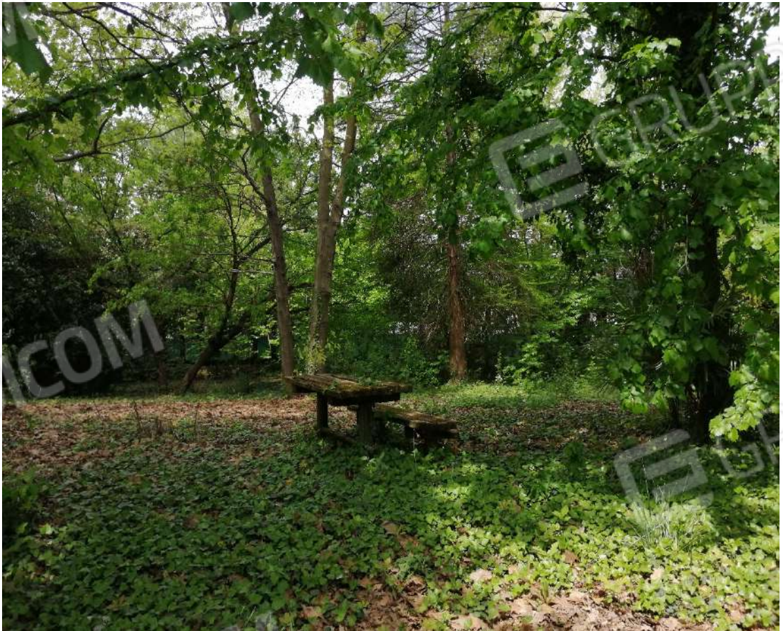
Fotografia n. 18 – Zona boscata, lato Nord del lotto