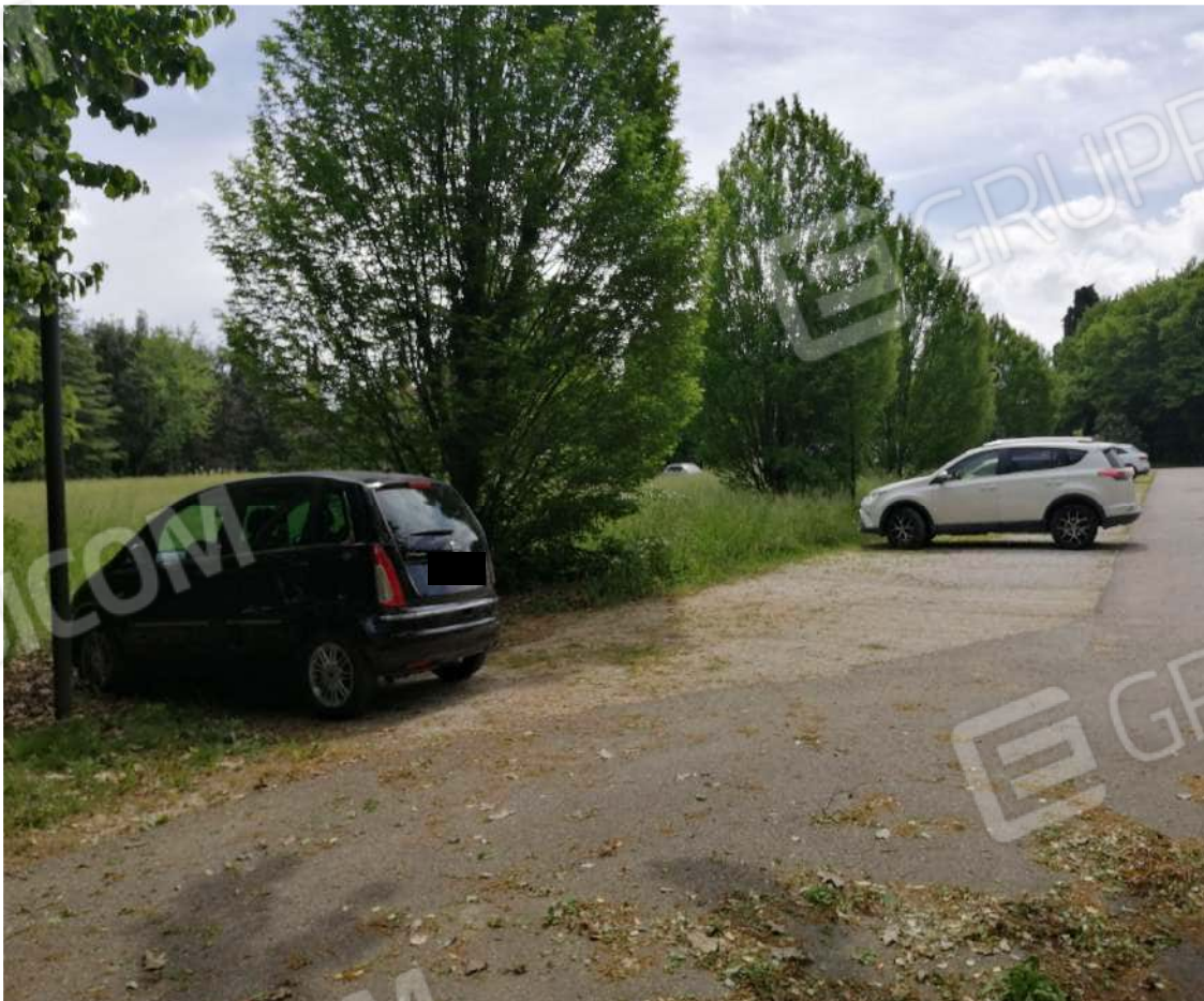
Fotografia n. 04 – Zona di parcheggio laterale al lotto