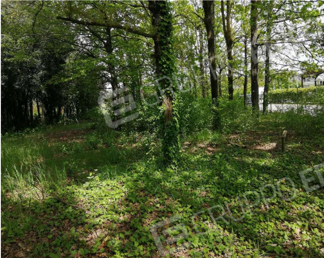
Fotografia n. 11 – Termine del prato verso area boscata