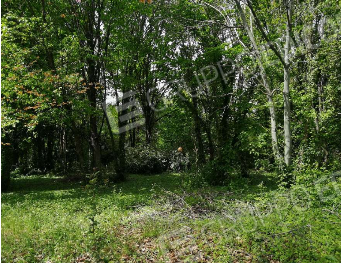
Fotografia n. 15 – Inizio zona boscata, lato Nord del lotto