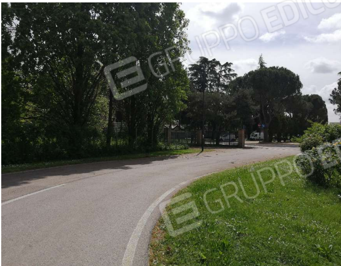
Fotografia n. 01 – Strada di accesso al lotto