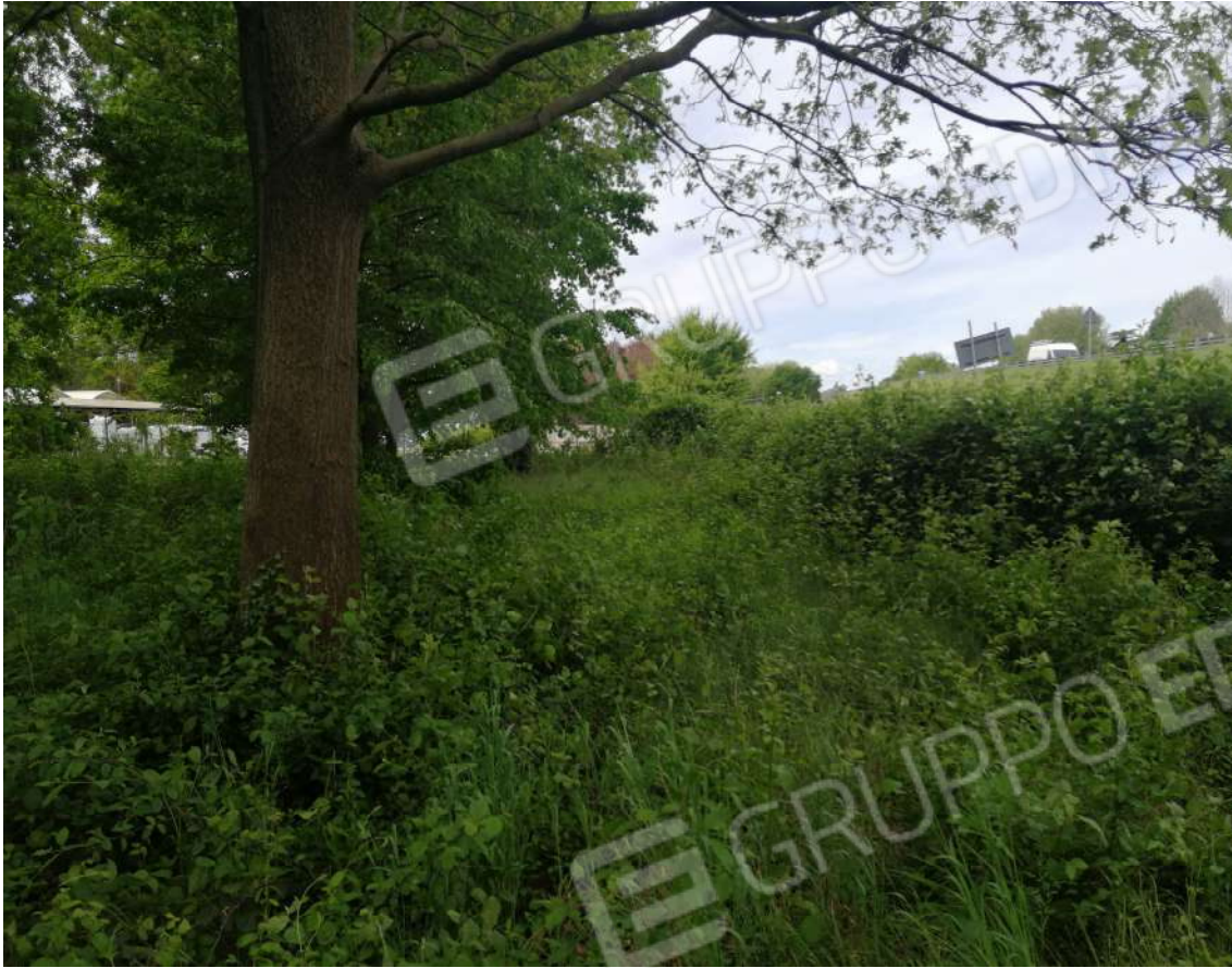
Fotografia n. 05 – Filari arborei in zona Ovest