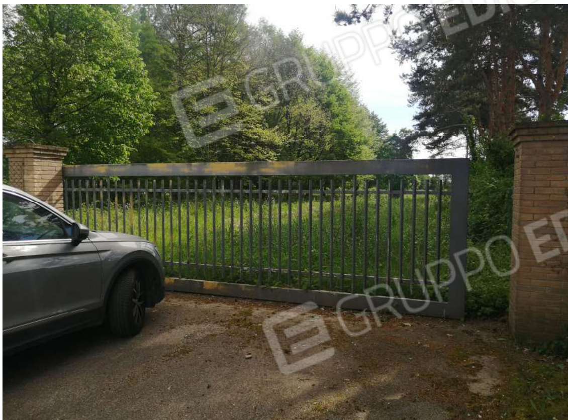
Fotografia n. 01 – Cancellò d'ingresso al fondo