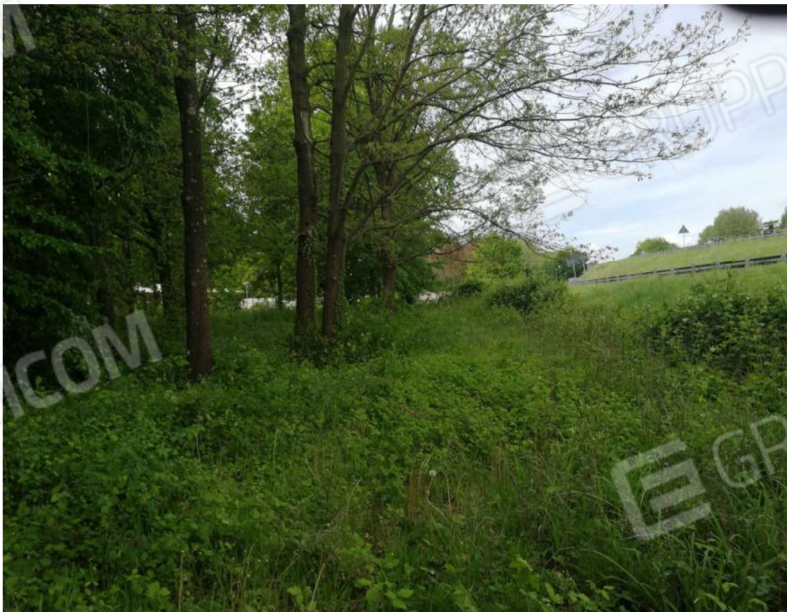
Fotografia n. 08 – Zona Nord del fondo verso tangenziale