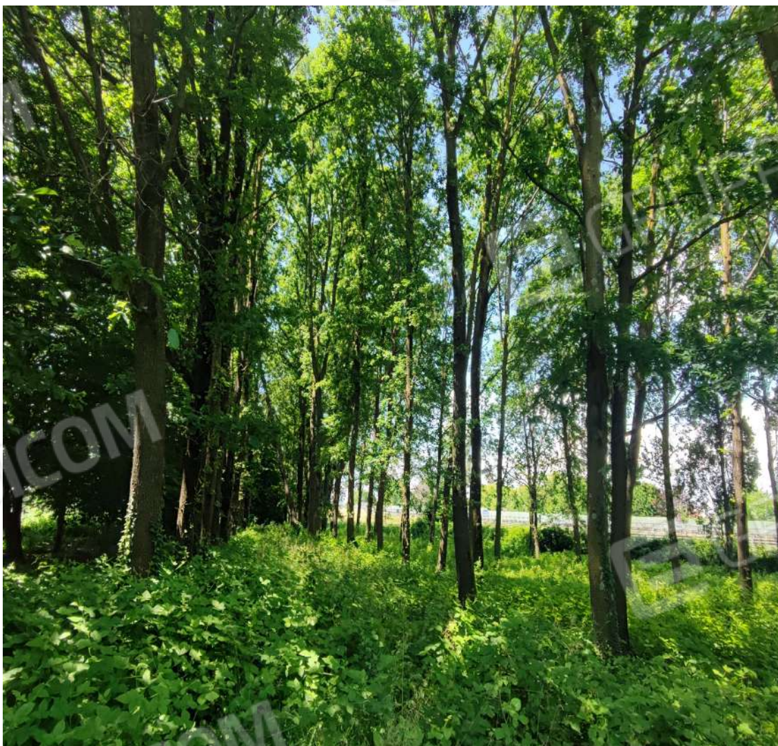
Fotografia n. 16 – Zona dei Frassini