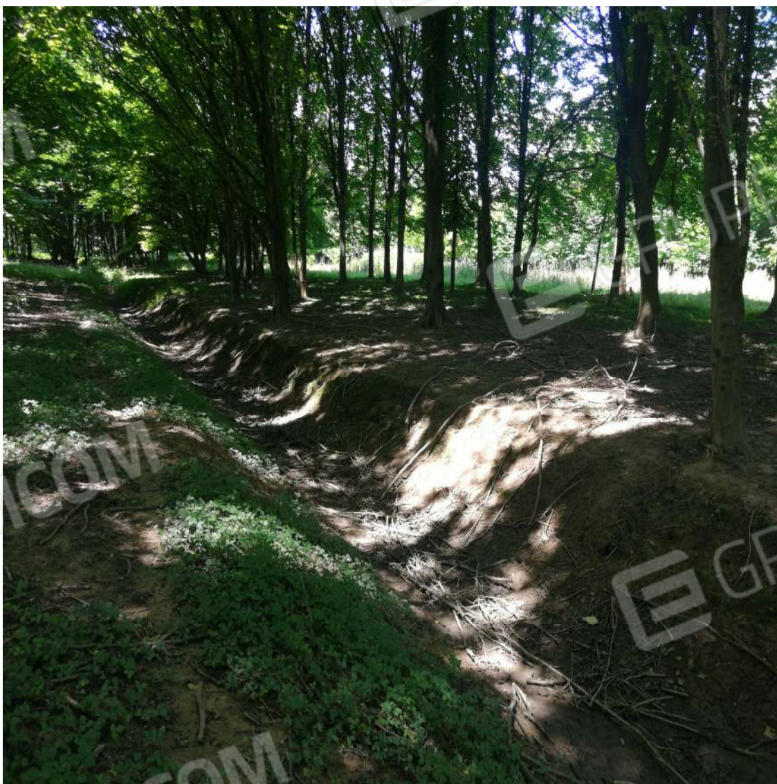
Fotografia n. 14 – Grande scolina all'interno del fondo, lungo l'asse Est-Ovest