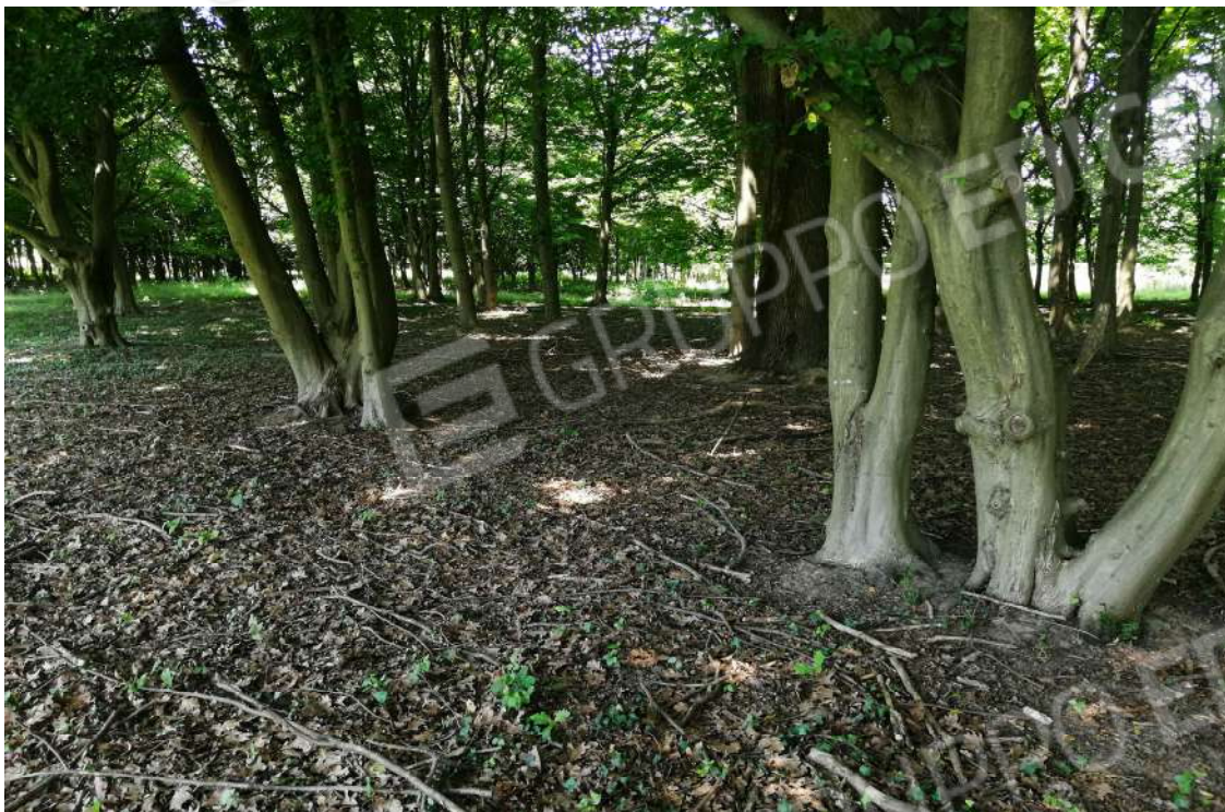
Fotografia n. 13 – Zona dei Faggi