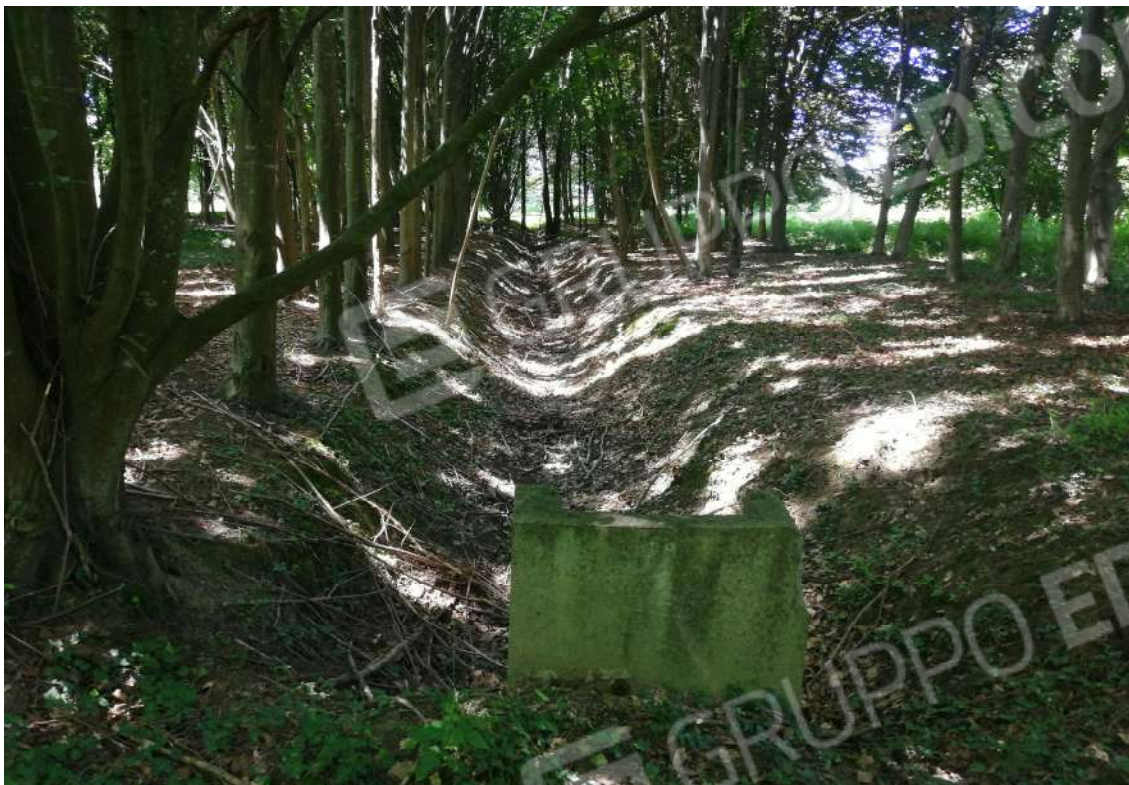
Fotografia n. 15 – Grande scolina all'interno del fondo, lungo l'asse Est-Ovest