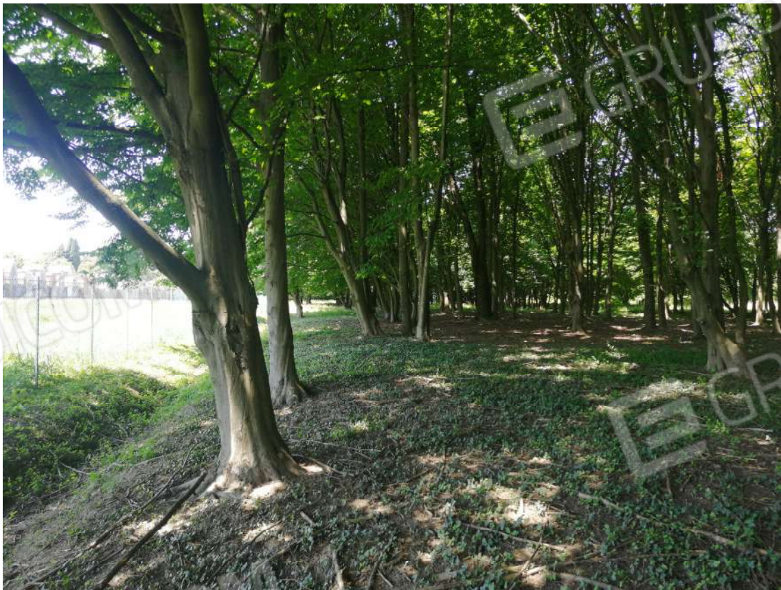
Fotografia n. 20 – Zona dei Faggi verso l'invaso (confine Sud)