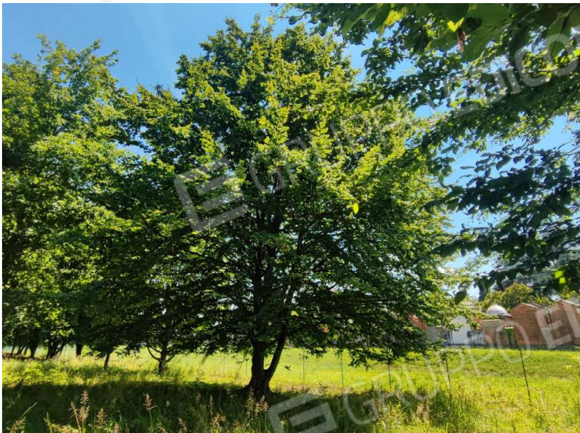
Fotografia n. 23 – Zona Sud del fondo verso invaso idrico e cimitero