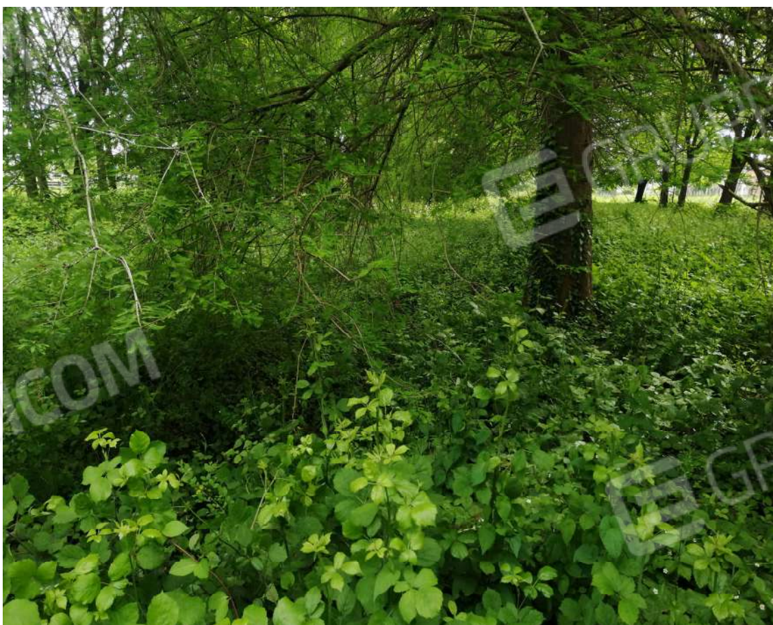
Fotografia n. 24 – Zona Est del fondo ove il confine non è materializzato