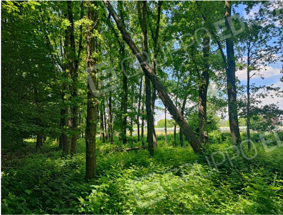
Fotografia n. 19 – Interno del fondo boscato verso la tangenziale (confine Nord)