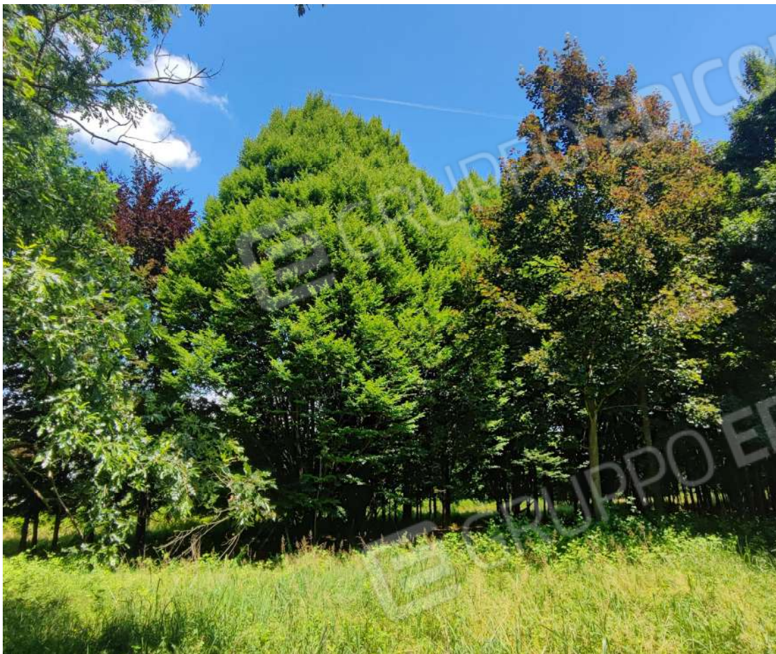
Fotografia n. 17 – Esempari di Taxodium e Quercus ilex