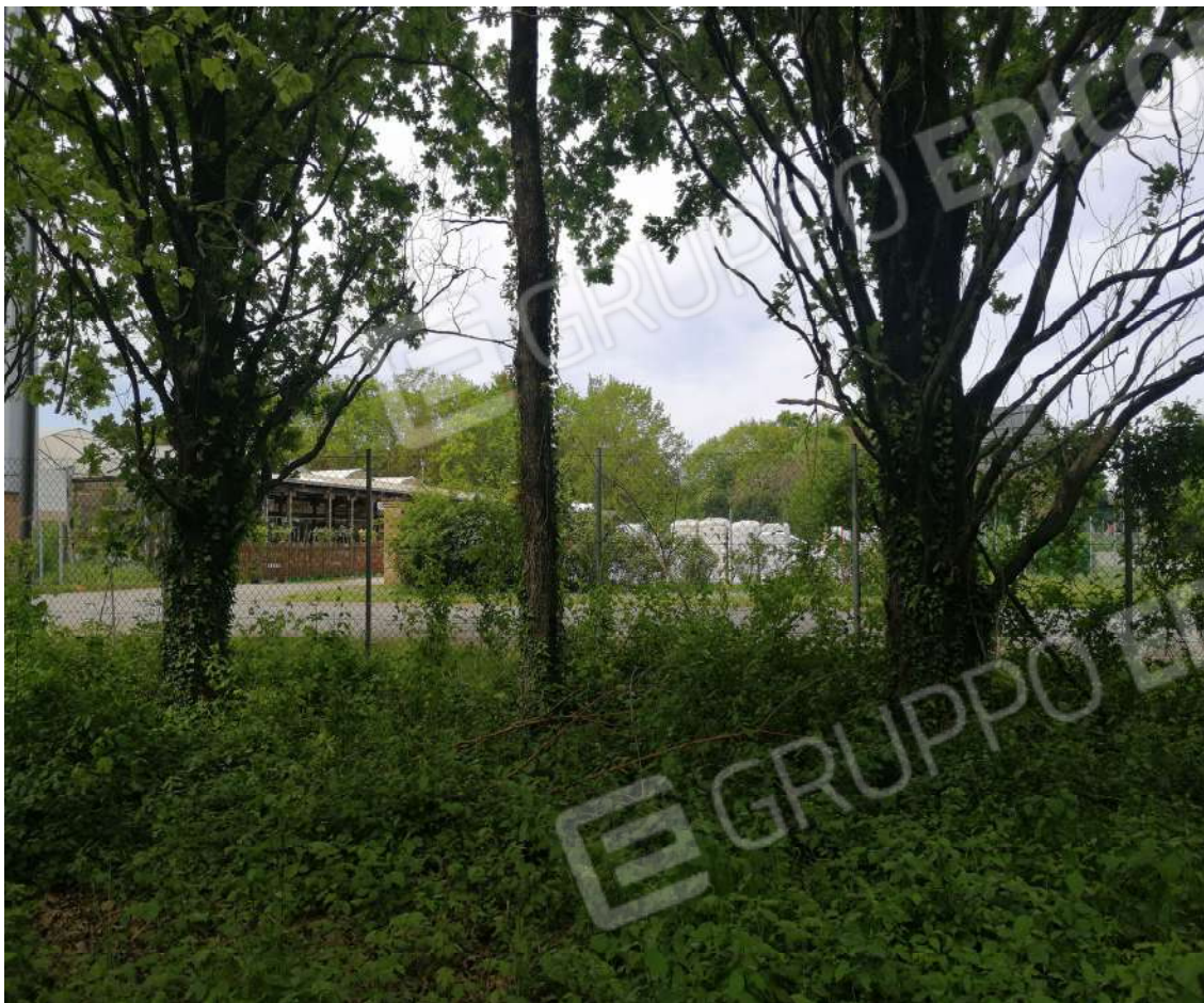
Fotografia n. 03 - Zona Ovest di accesso al fondo, con rete di confine, vista dall'interno del fondo