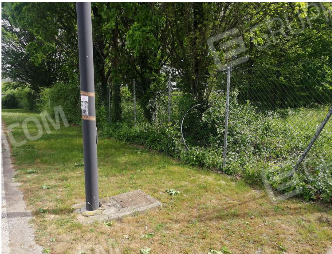
Fotografia n. 02 – Zona Ovest di accesso al fondo, con rete di confine