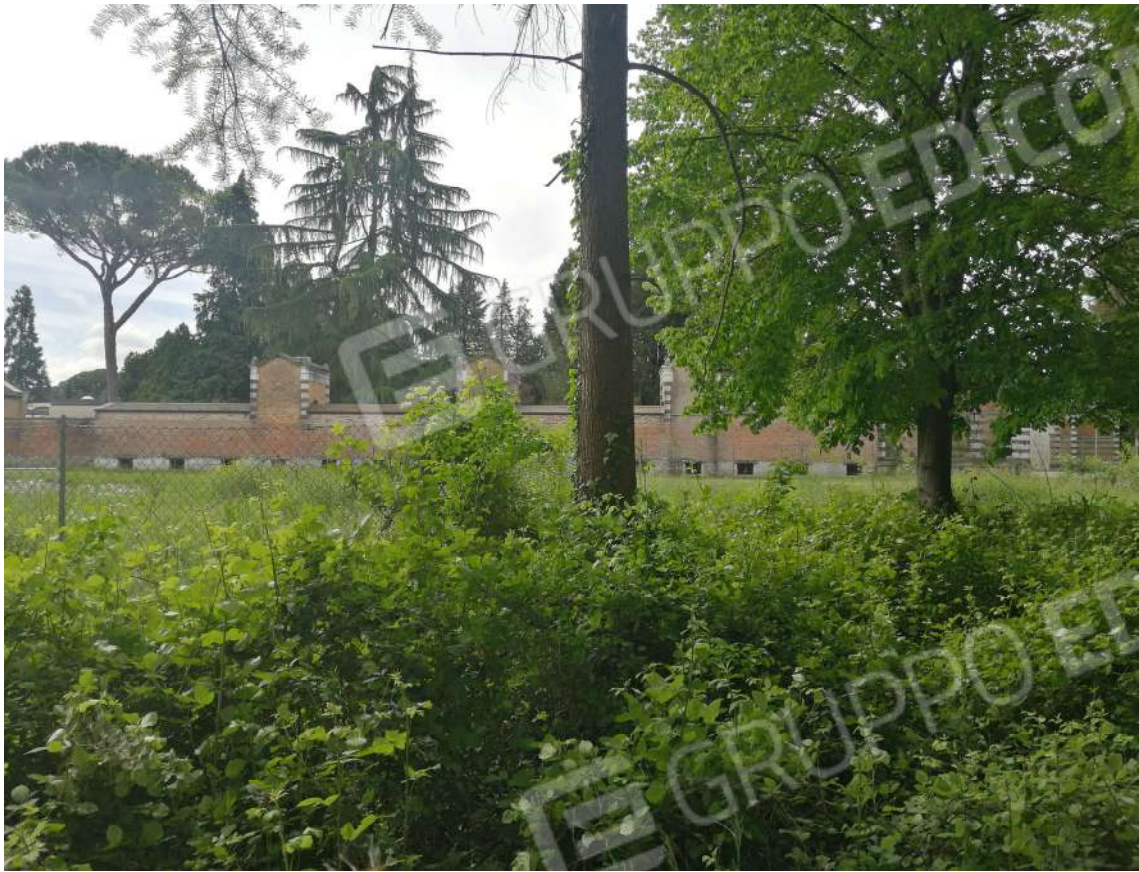
Fotografia n. 07 – Zona Sud del fondo verso cimitero