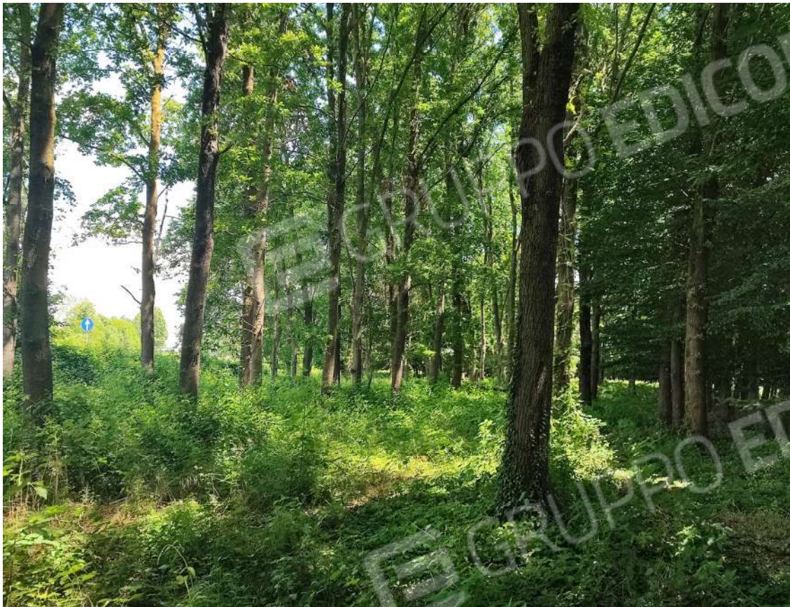
Fotografia n. 09 – Filari arborei di Querce