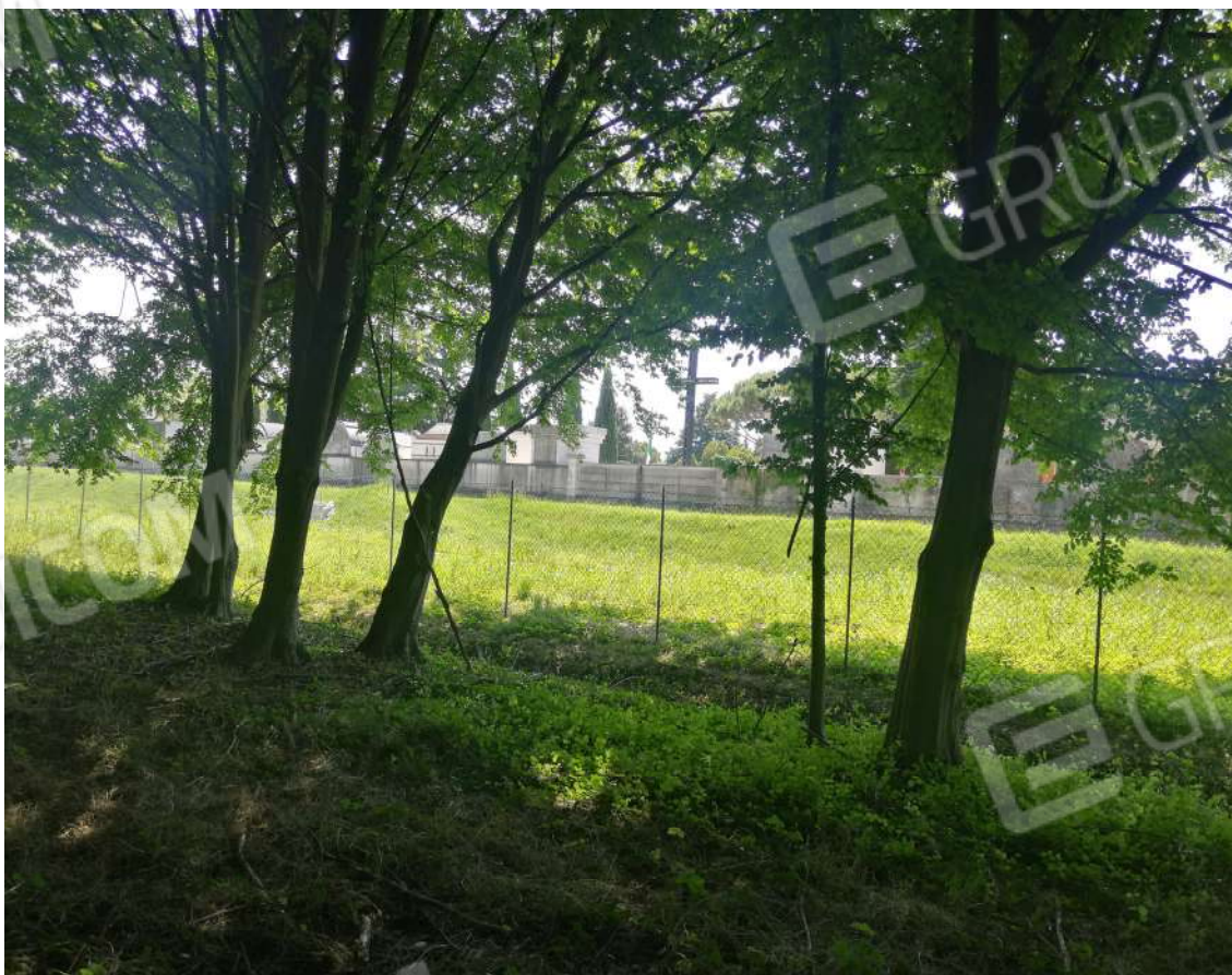
Fotografia n. 12 – Confine Sud del fondo verso l'invaso idrico ed il cimitero