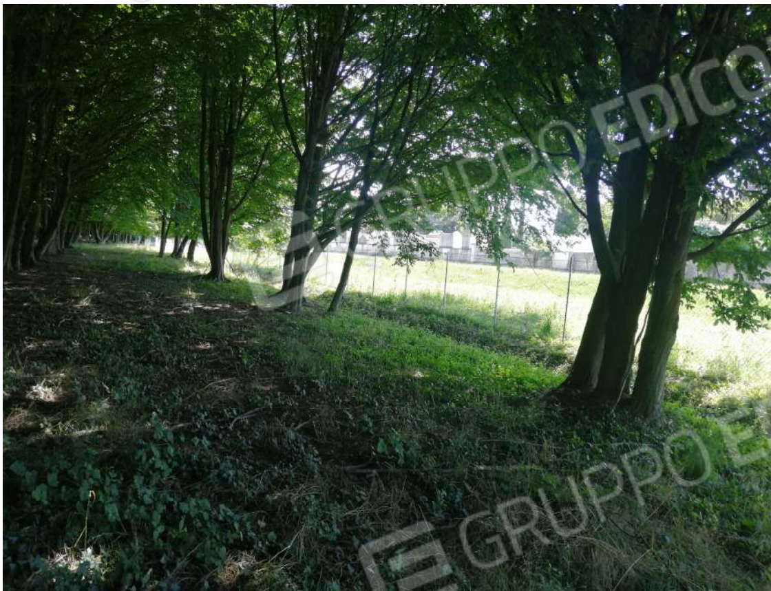
Fotografia n. 11 – Confine Sud del fondo verso l'invaso idrico ed il cimitero