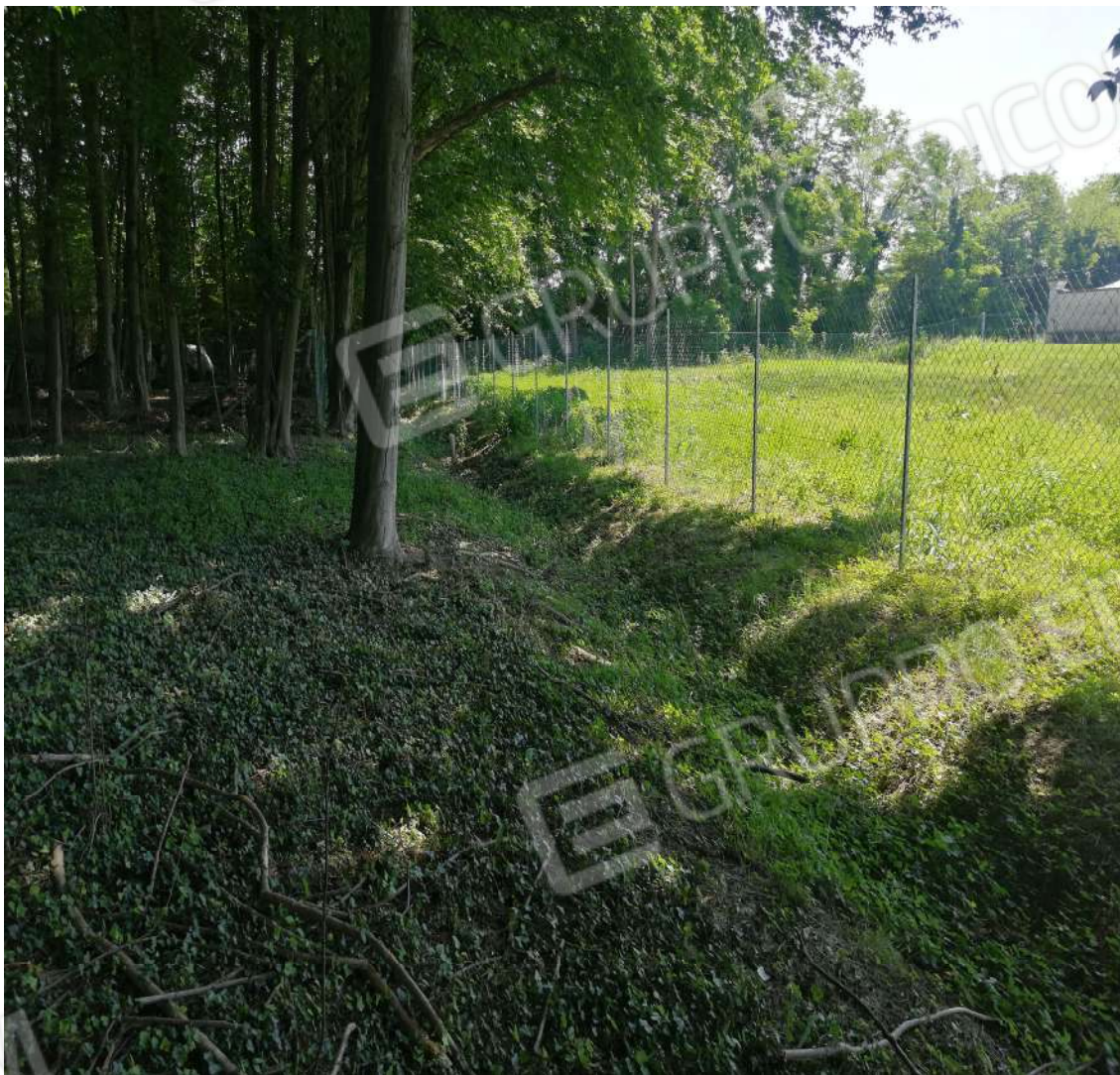
Fotografia n. 21 – Zona dei Faggi verso l'invaso (confine Sud)