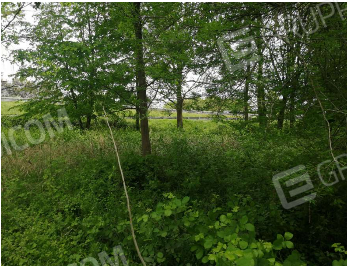
Fotografia n. 04 – Zona Ovest del fondo boscato