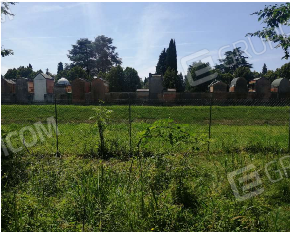
Fotografia n. 10 – Confine Sud del fondo verso l'invaso idrico ed il cimitero