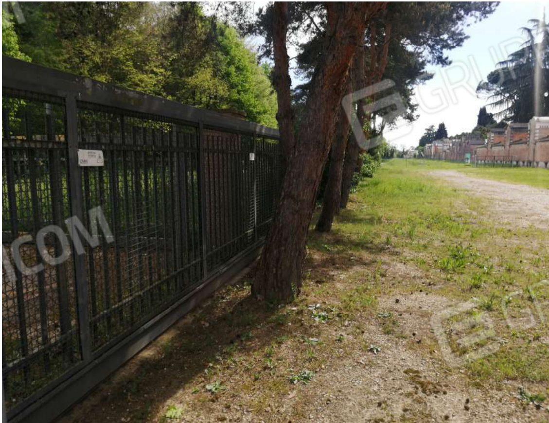
Fotografia n. 06 – Cancellone d'ingresso verso strada di accesso e cimitero