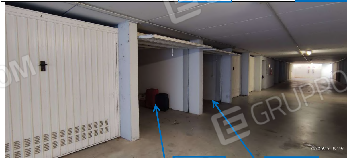
FOTO 14_PIANO SEMINTERRATO_GARAGE