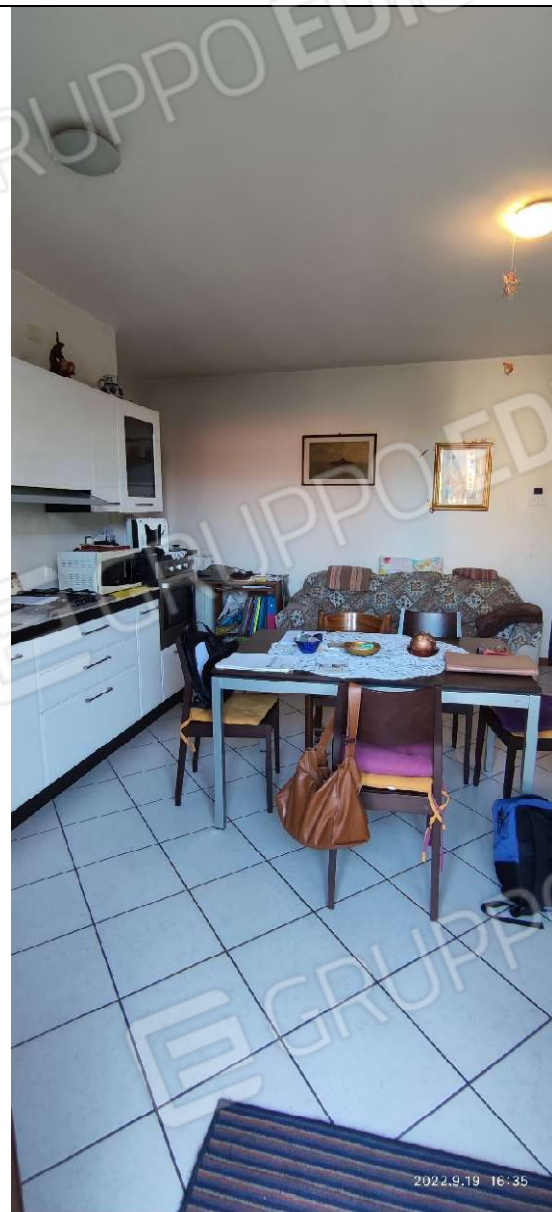
FOTO 4 SOGGIORNO-ANGOLO COTTURA CON VISTA VERSO DISOBBLIGO