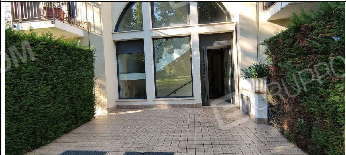
FOTO 2_PARTICOLARE INGRESSO CONDOMINIALE SU VANO SCALA E ASCENSORE