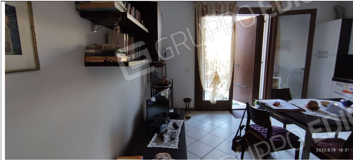
FOTO 5_SOGGIORNO-ANGOLO COTTURA CON VISTA VERSO AREA SCOPERTA A SUD