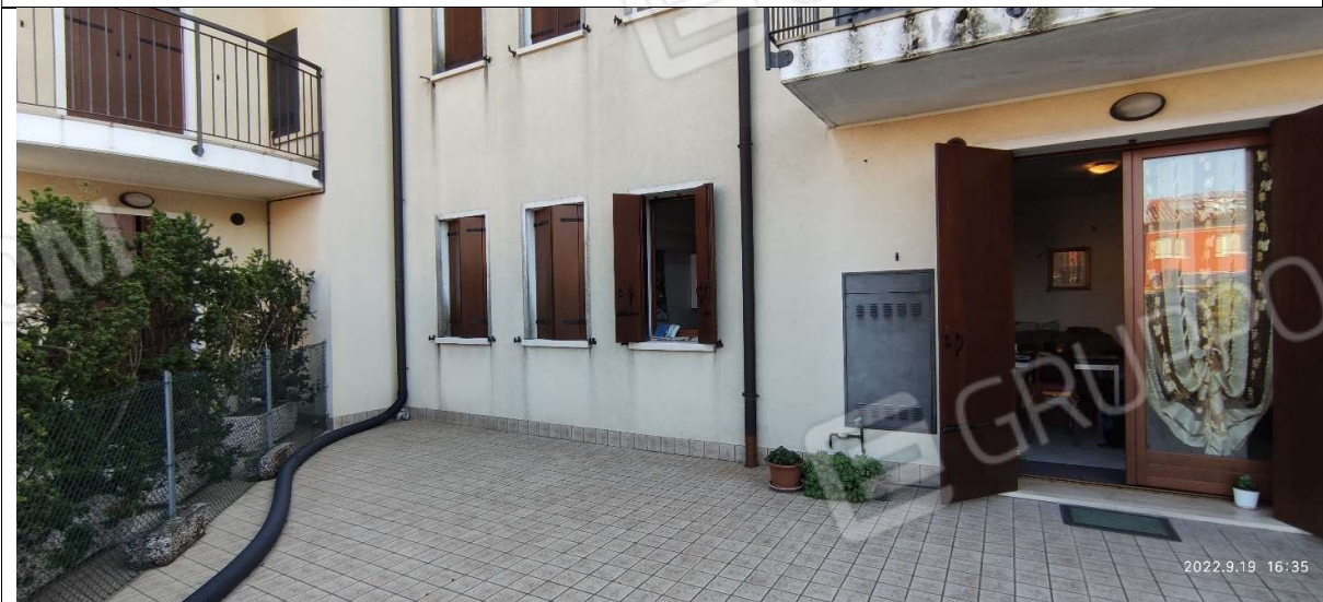
FOTO 9 PROSPETTO SUD