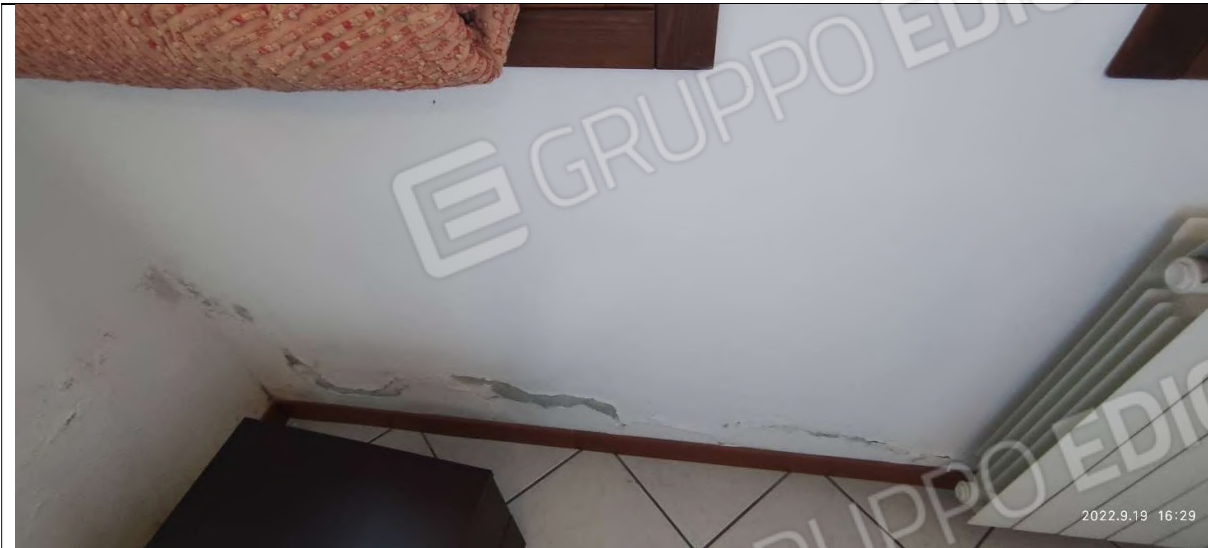
FOTO 10_TRACCE DI UMIDATA' SU CAMERA