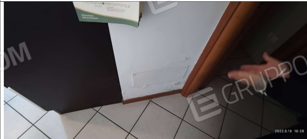
FOTO 11_TRACCE DI UMIDITA' ZONA SOGGIORNO-ANGOLO COTTURA