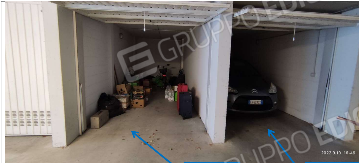
FOTO 13_GARAGE PARTICOLARE