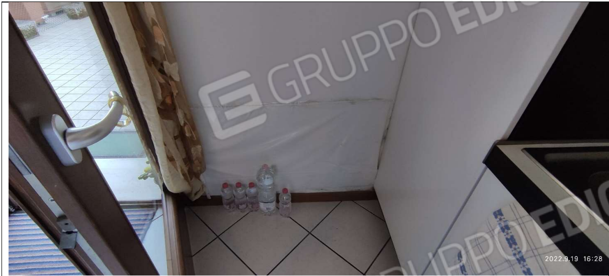
FOTO 12 _TRACCE DI UMIDITA' ZONA SOGGIORNO-ANGOLO COTTURA