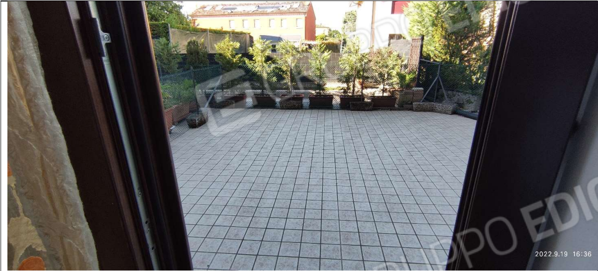
FOTO 8 AREA SCOPERTA COMUNE A SUD