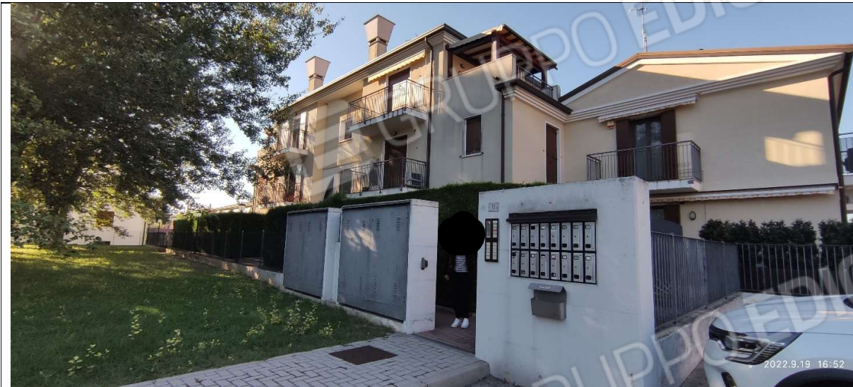
FOTO 1_INGRESSO CONDOMINALE DALLA VIA SAN MICHELE - PROSPETTO NORD