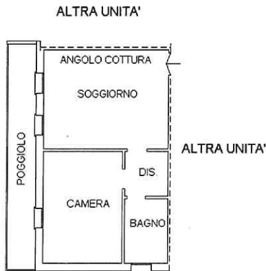
PIANTA PIANO PRIMO H=2.70