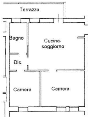
PIANTA PIANO PRIMO h=2.70