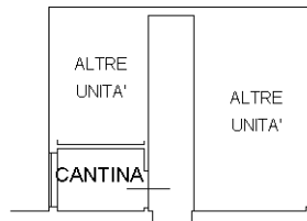
PIANO SESTO H=2.20ml