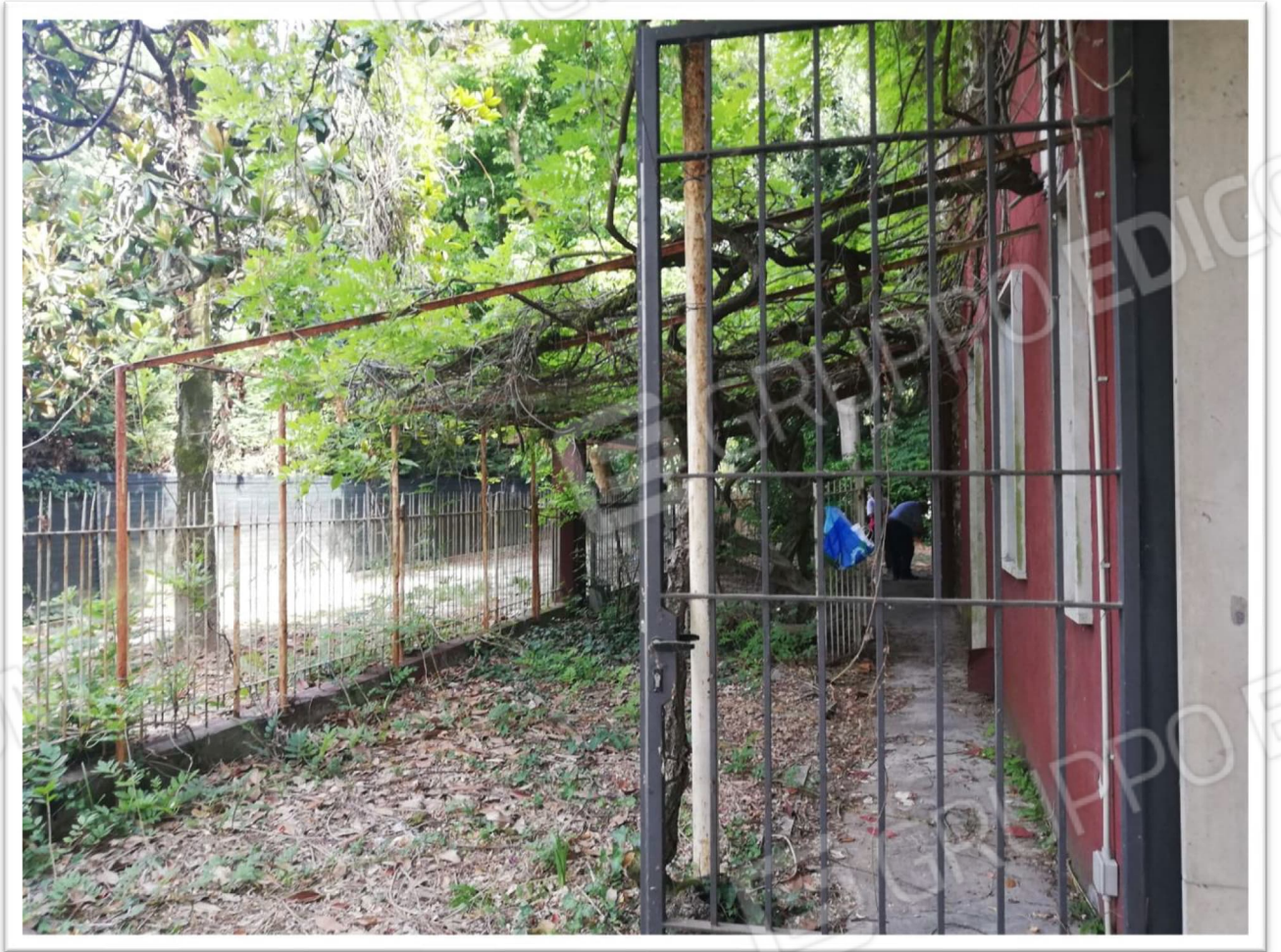
Figura 20 - Scoperto comune