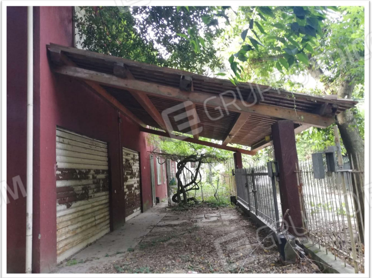
Figura 23 - Scoperto e tettoia comune