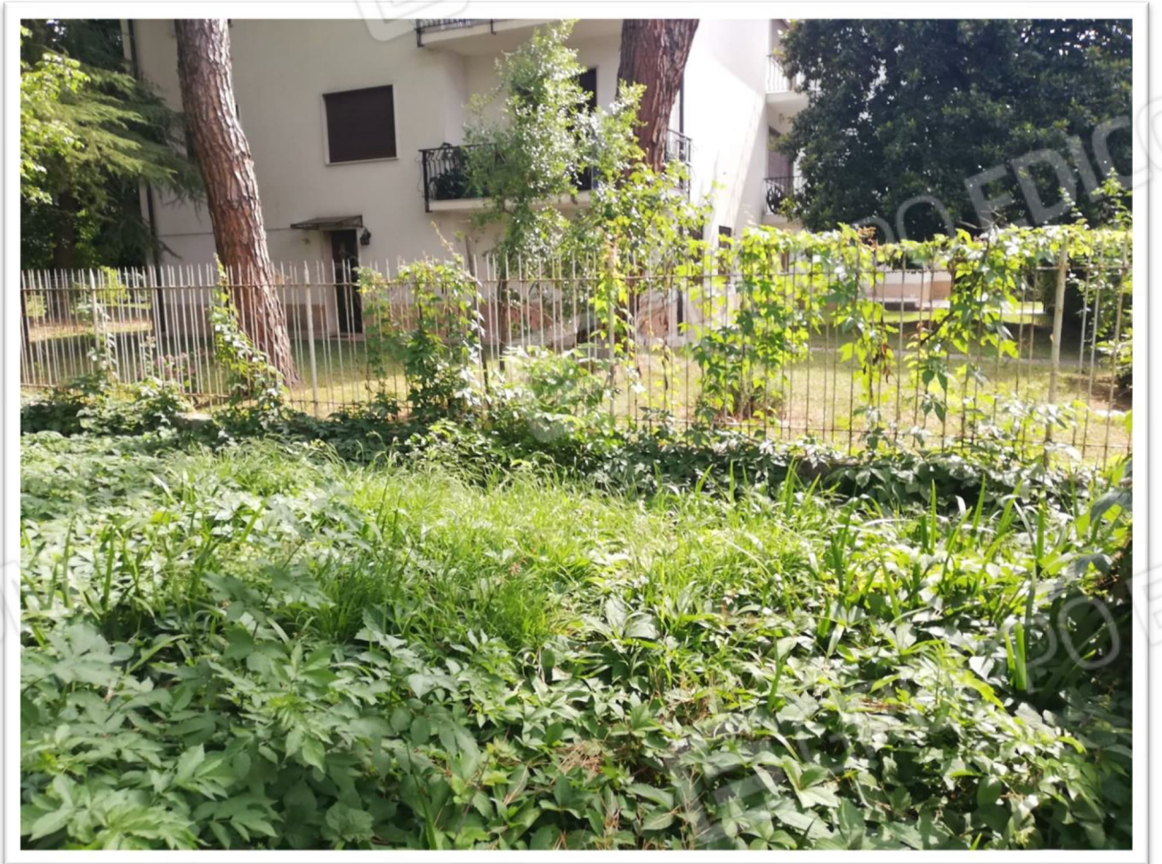
Figura 21 - Scoperto comune