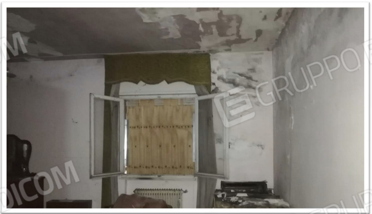
Figura 18 – Soggiorno