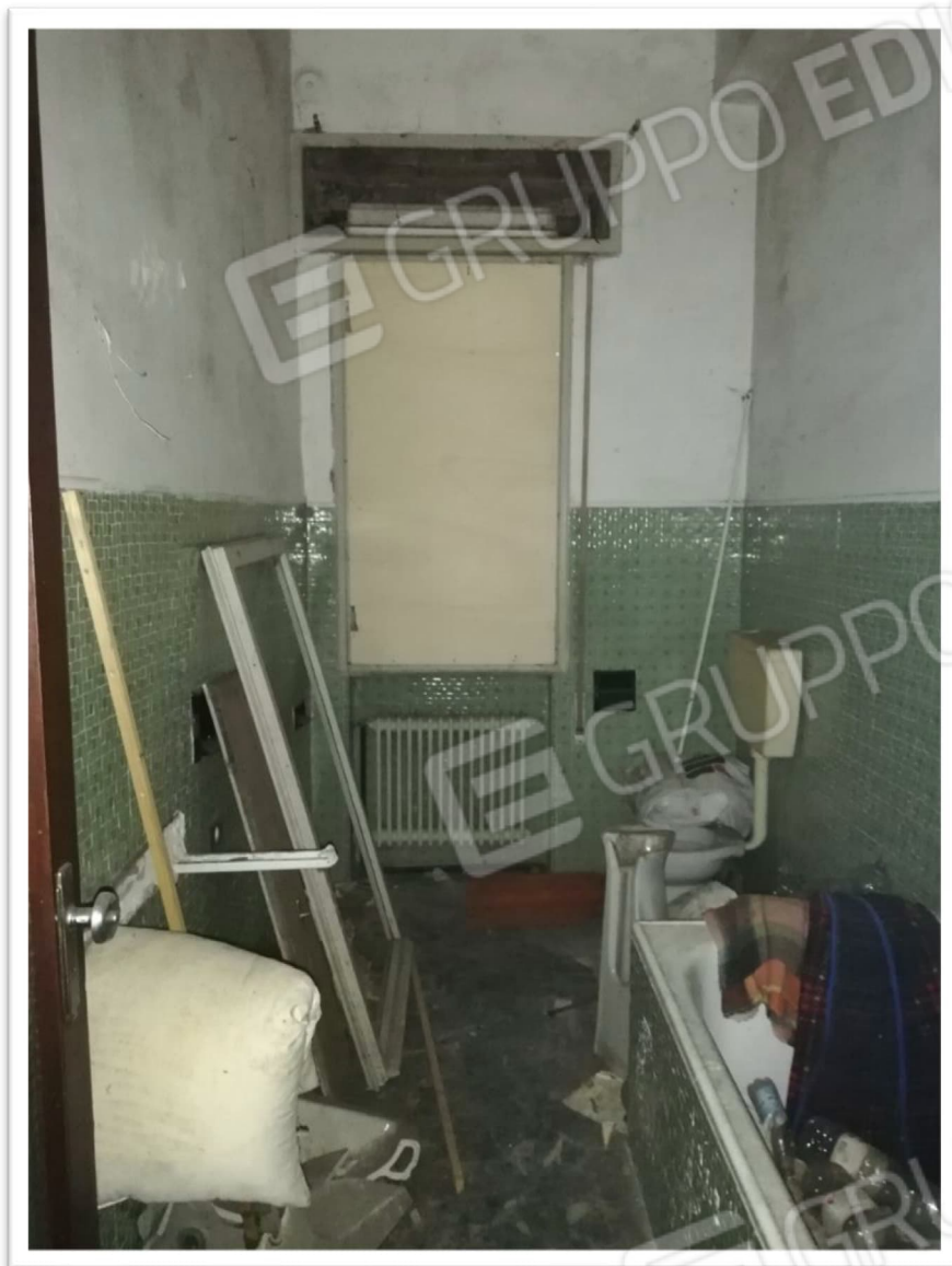
Figura 8 - Bagno