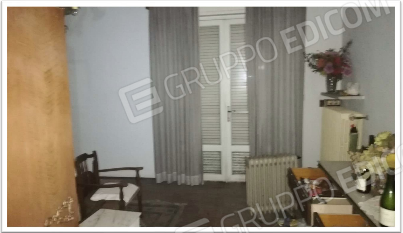
Figura 15 – Camera