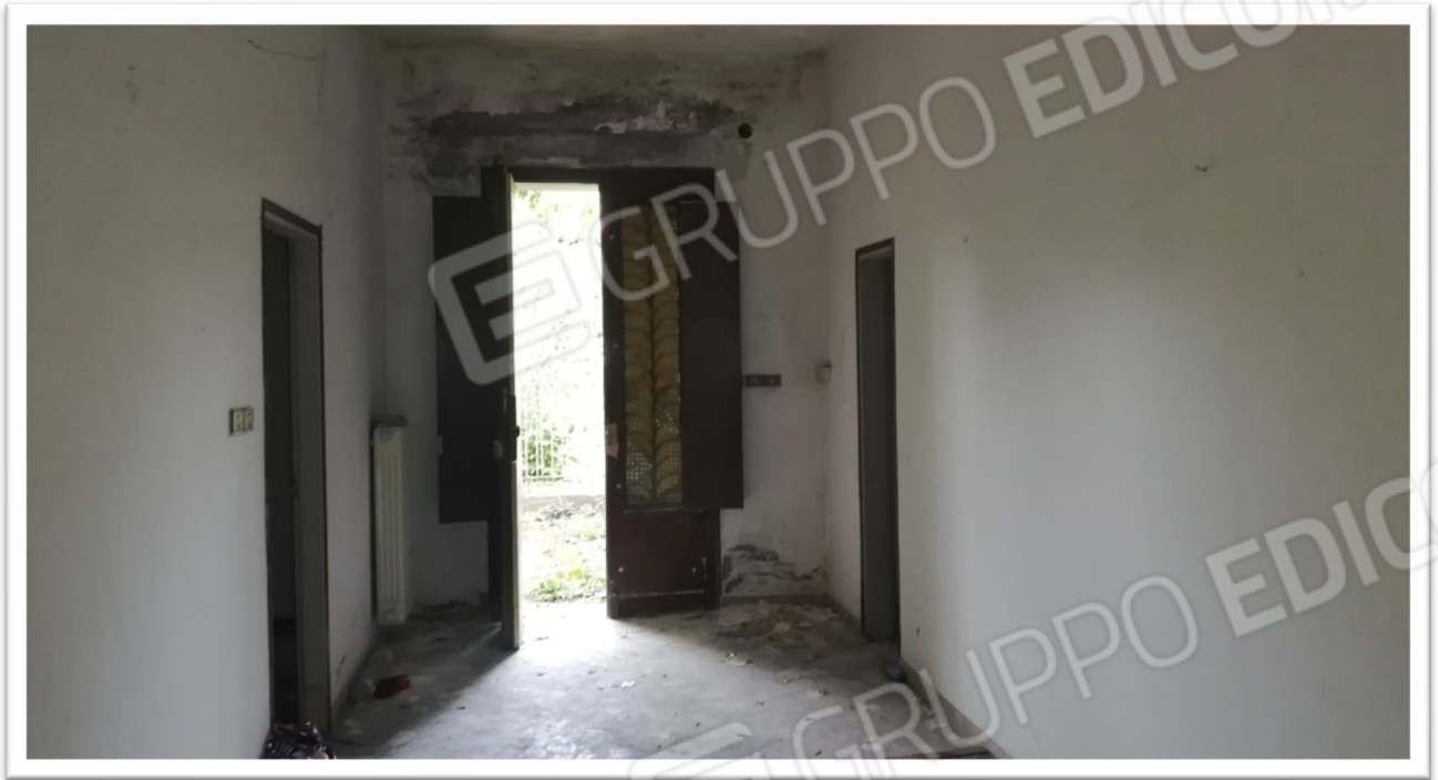
Figura 3 – Ingresso