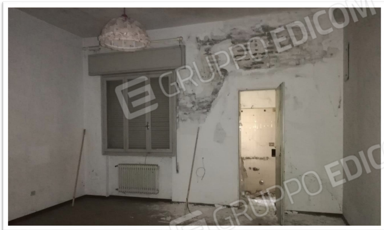
Figura 6 – Camera