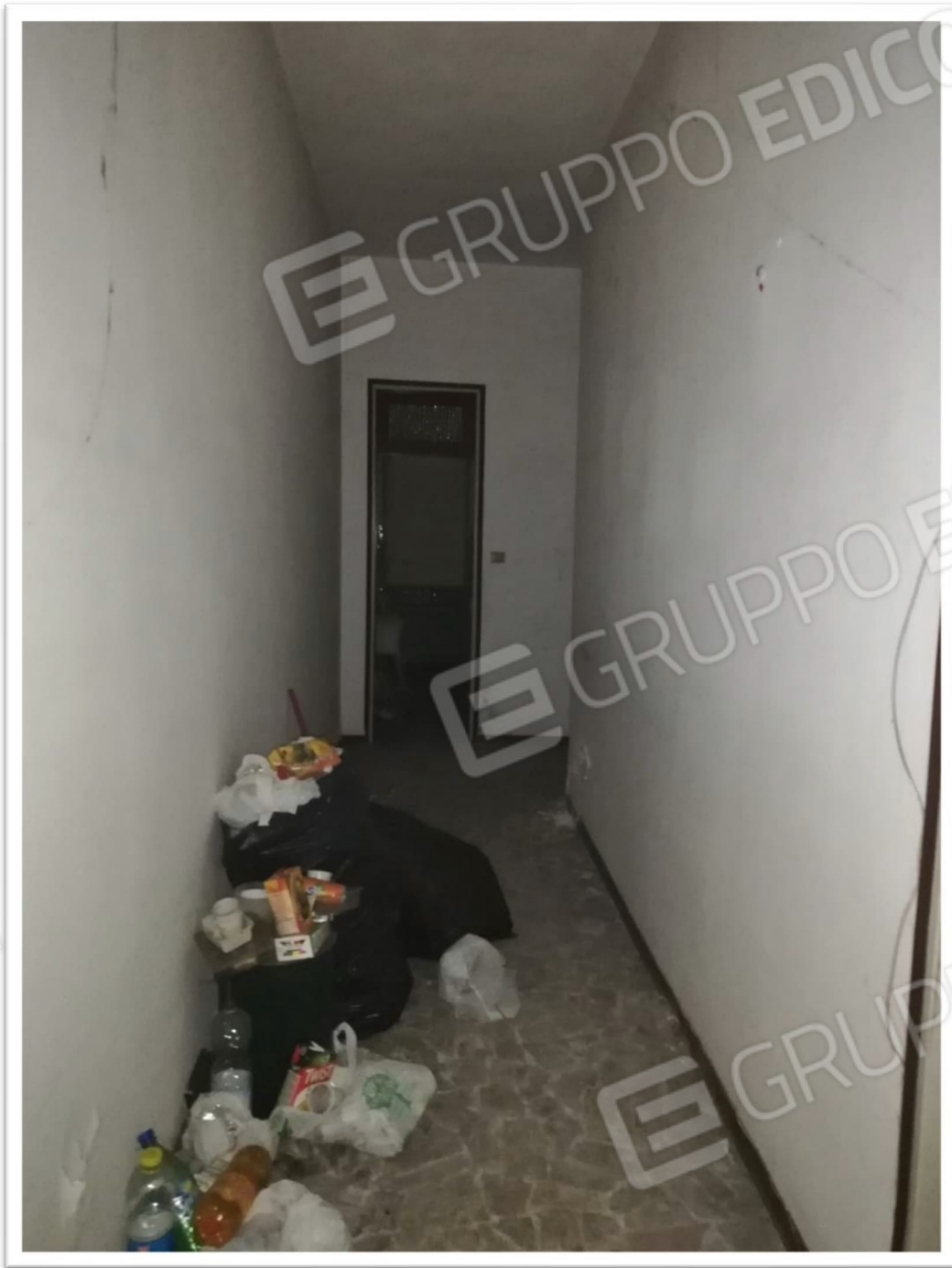
Figura 5 – Corridoio