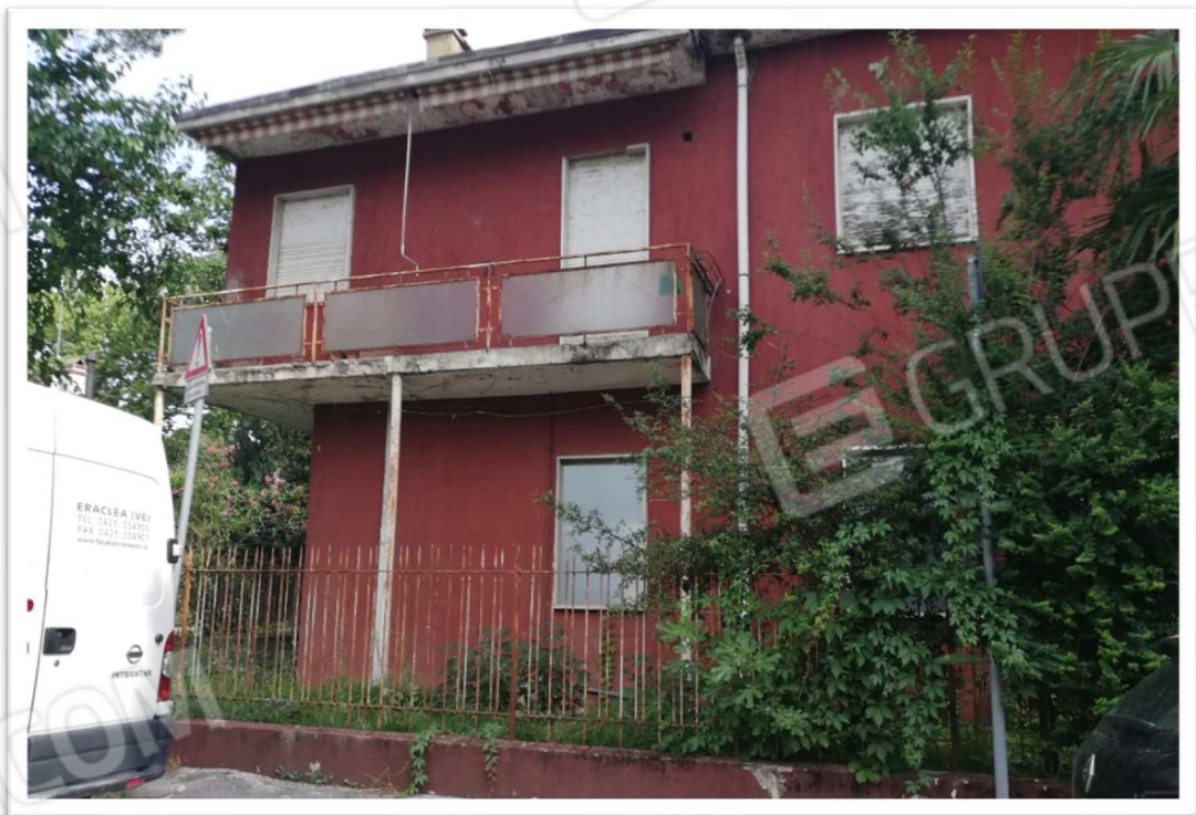
Figura 2 - Veduta intero compendio