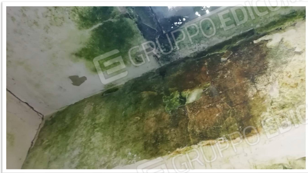
Figura 11 – Soffitto disimpegno