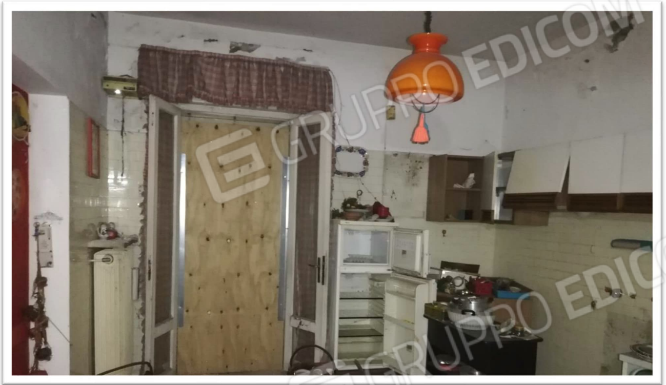
Figura 17 – Cucina