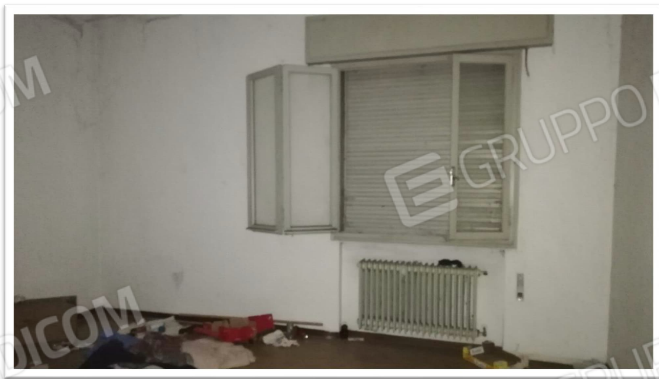
Figura 7 – Camera