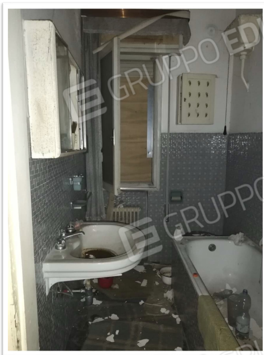
Figura 14 - Bagno