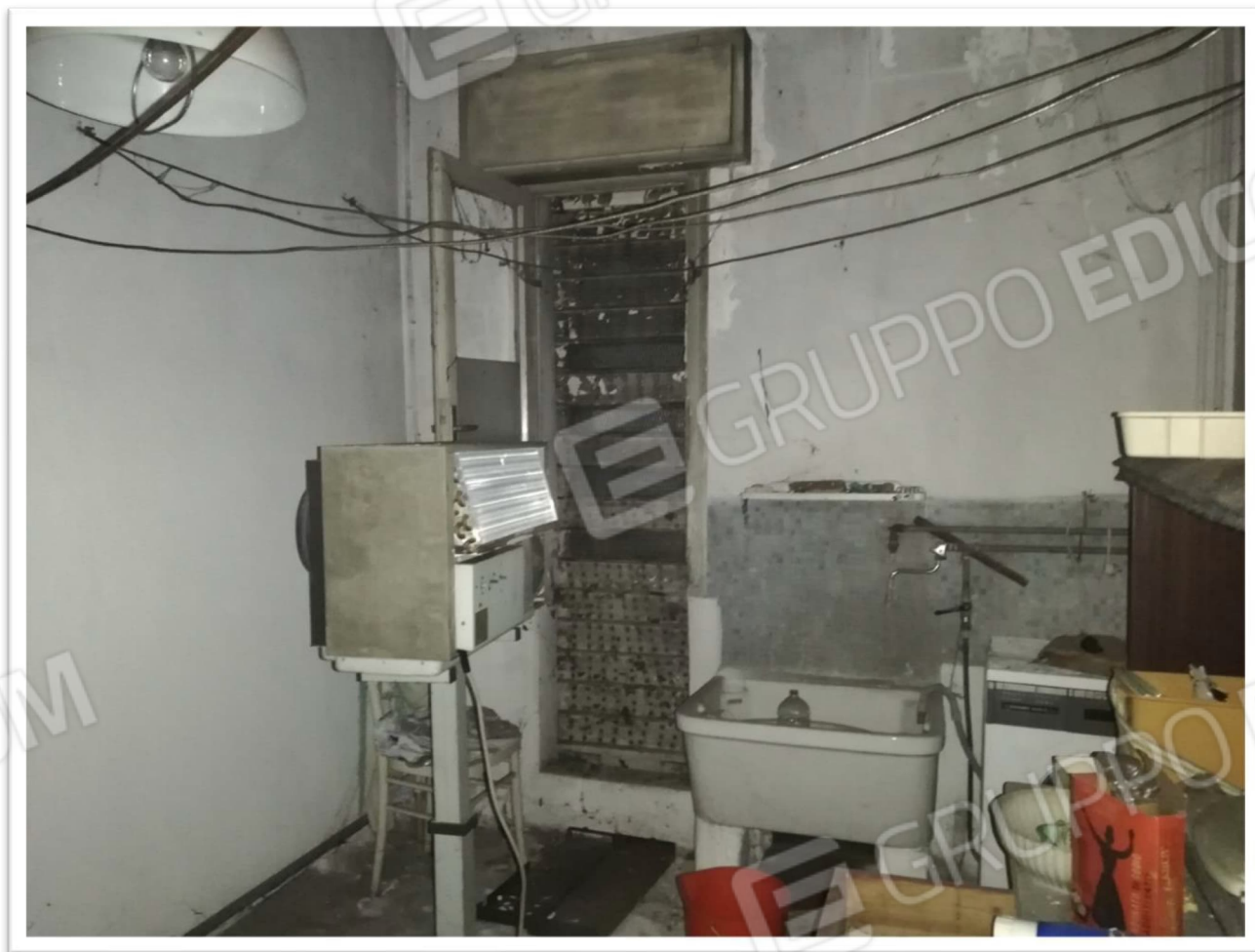
Figura 19 - Centrale termica