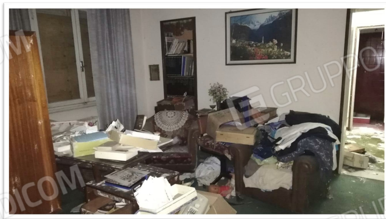
Figura 12 - Stanza studio