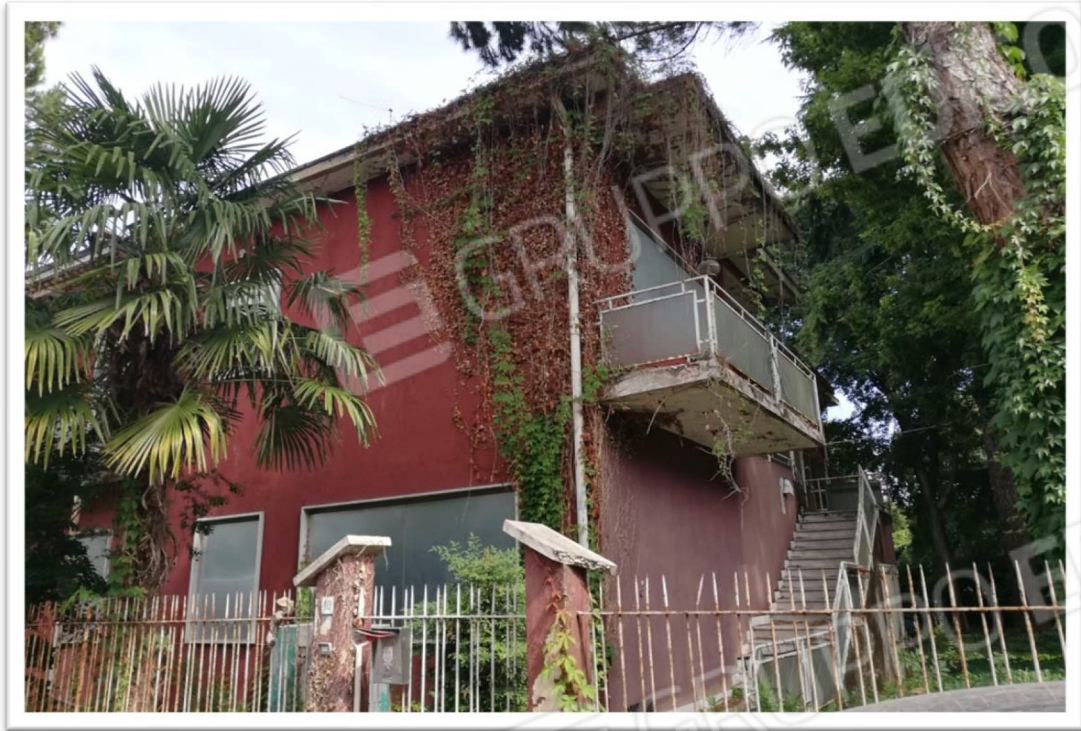
Figura 1 - Veduta intero compendio