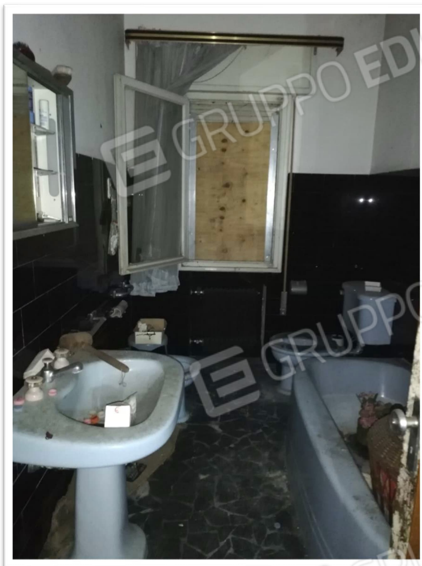
Figura 13 – Bagno