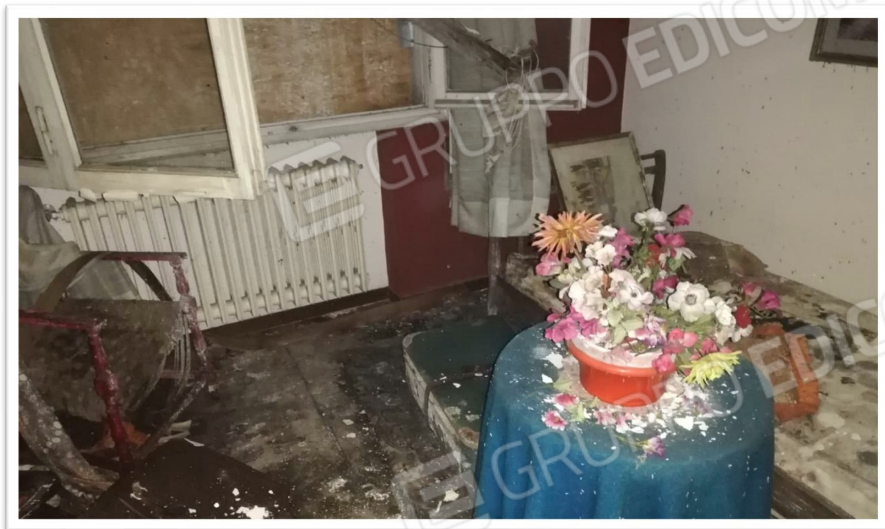
Figura 9 - Soggiorno