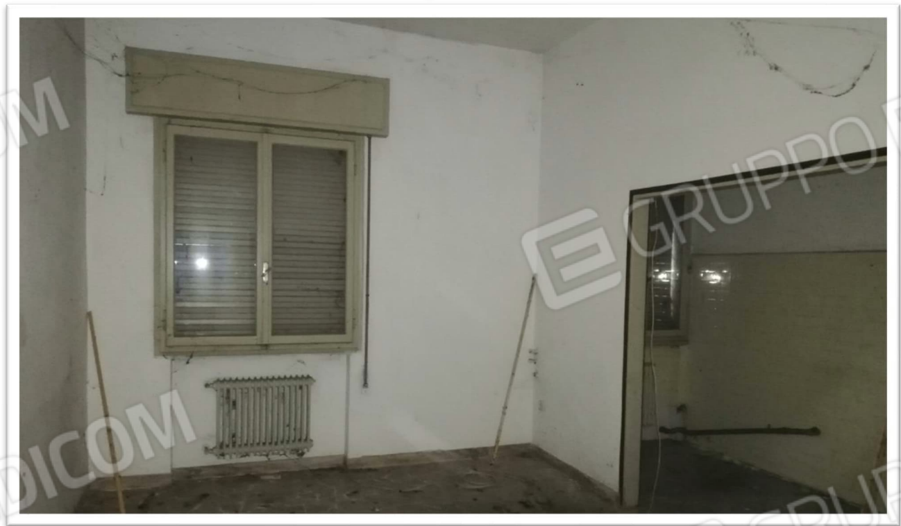
Figura 4 - Soggiorno con angolo cottura