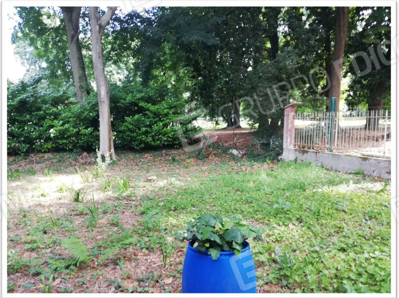
Figura 22 - Scoperto comune