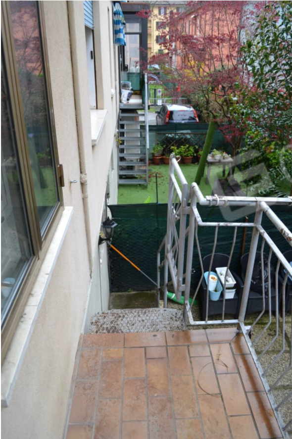
Foto 19. Terrazzino con scala accesso scoperto PT