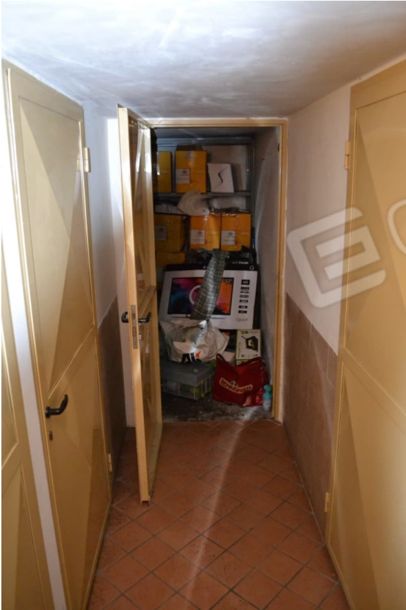
Foto 23. Accesso al garage dal vano scala condominiale