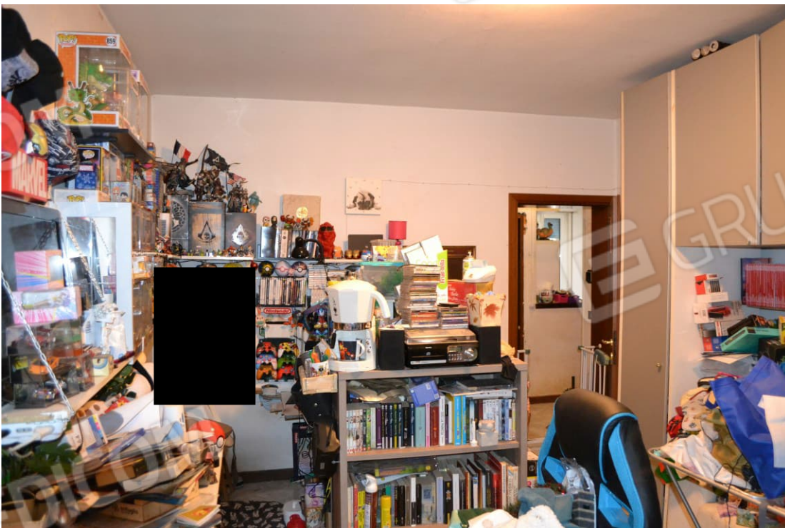
Foto 18. Altra vista su camera da letto matrimoniale