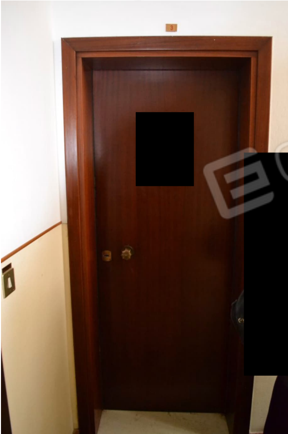
Foto 5, portoncino di ingresso appartamento dal vano scala