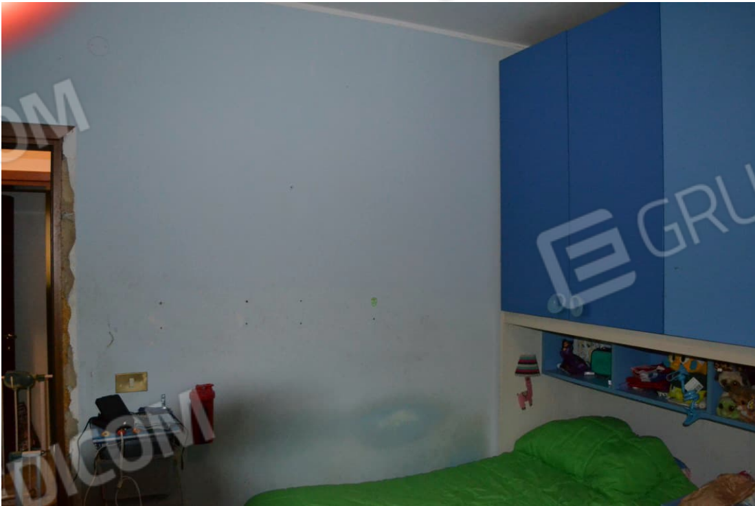
Foto 14. Altra vista su camera da letto