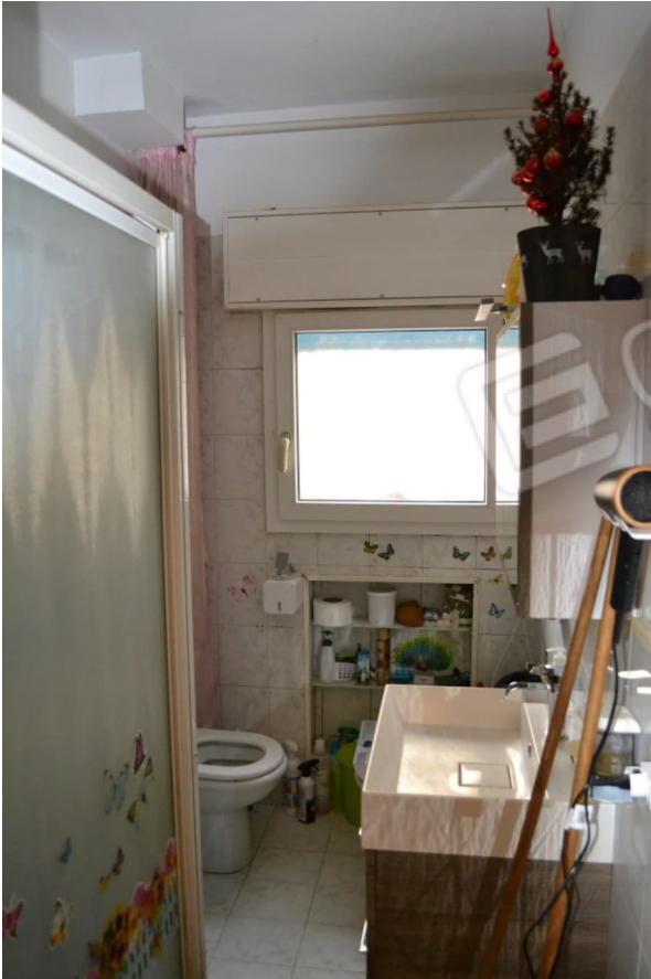
Foto 15. bagno