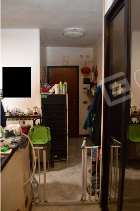
Foto 7. Controvista su ingresso