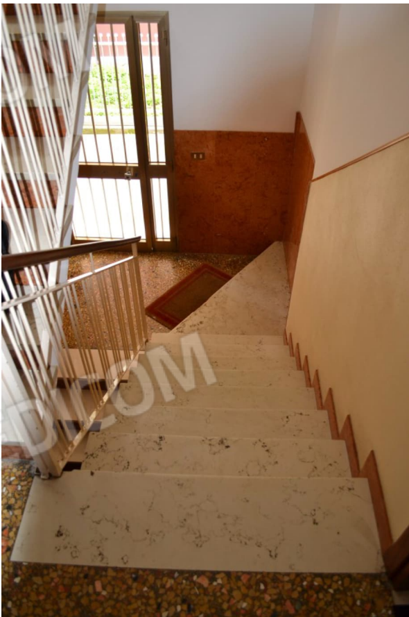
Foto 4. Vano scala condominiale