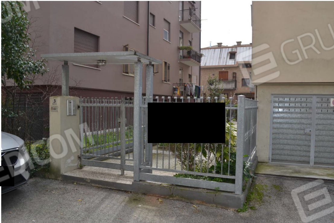
Foto 2. Accesso pedonale su via Calucci