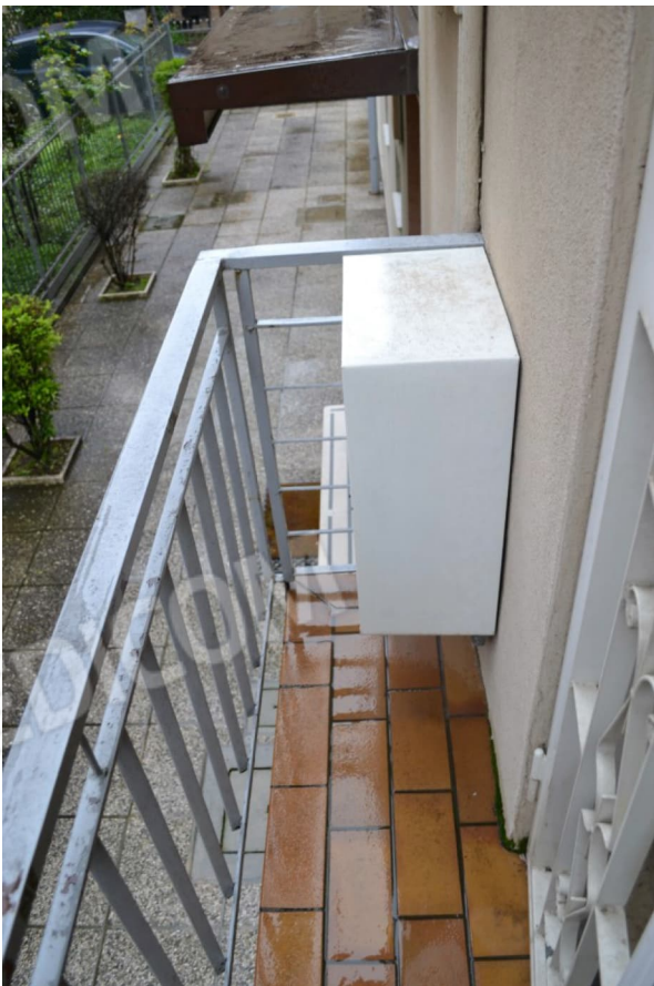
Foto 12. Terrazzino lato soggiorno