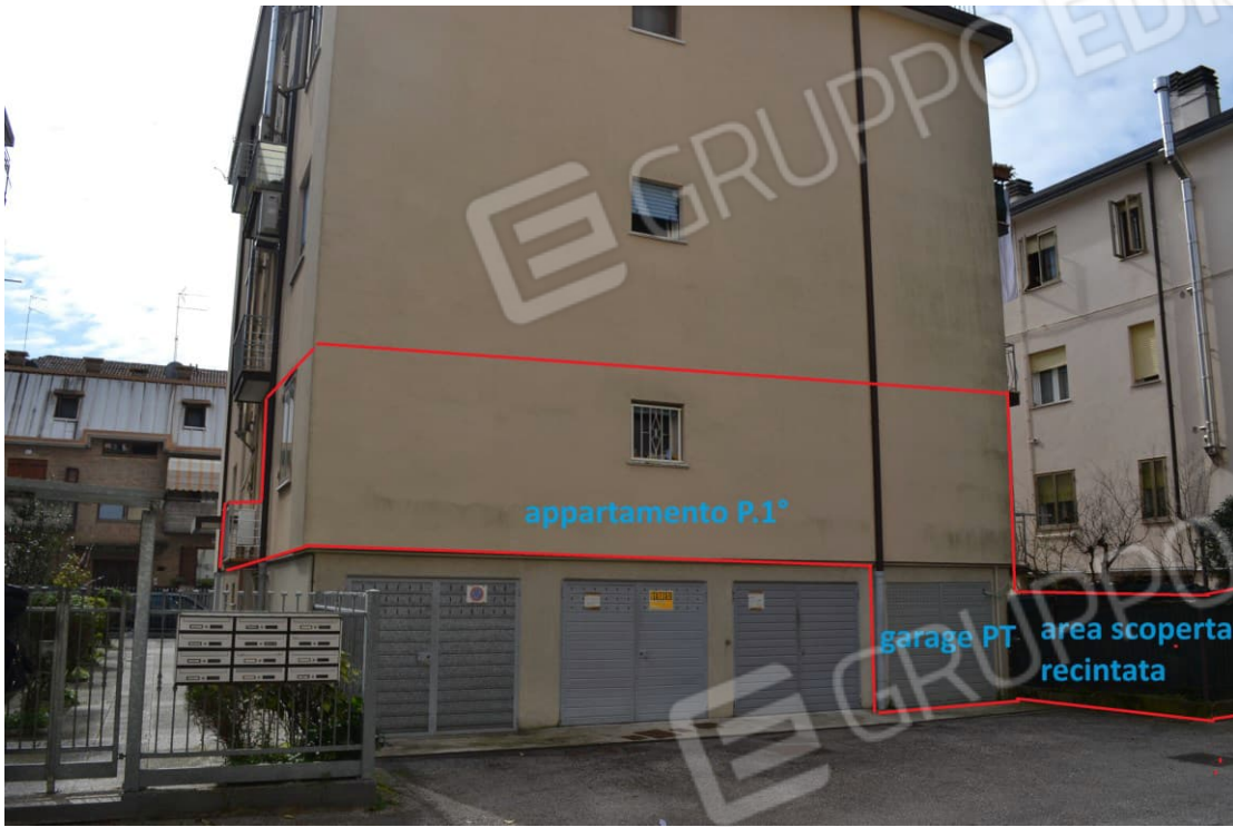
Foto 1. Prospetto su via Calucci