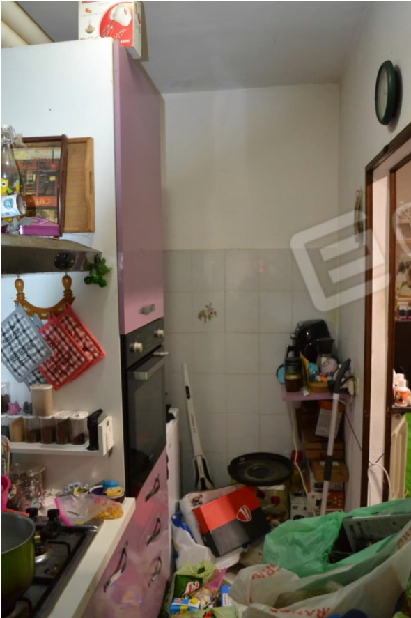
Foto 11. Altra vista su cucinino