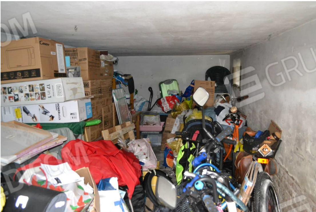
Foto 26. Altra vista su garage al PT.