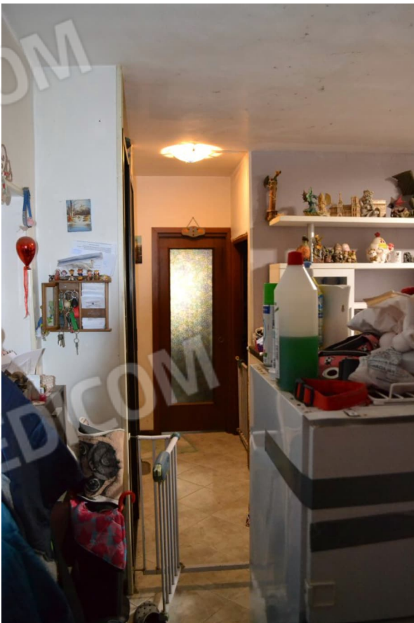
Foto 6. Ingresso e vista su soggiorno