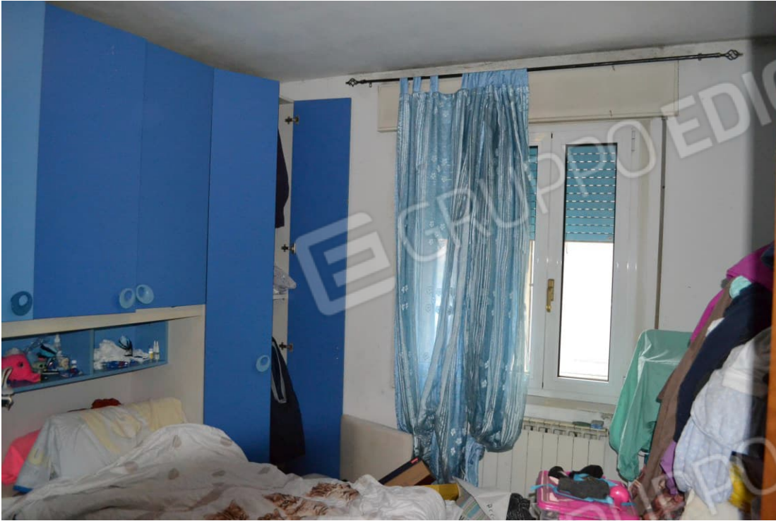
Foto 13. Camera da letto