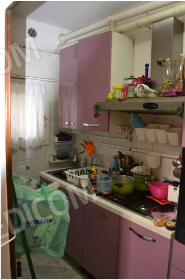
Foto 10. cucinino