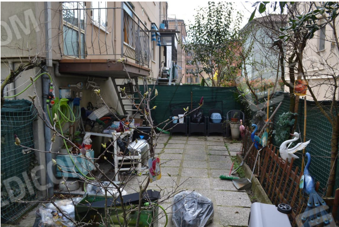
Foto 22. Altra vista su scoperto esclusivo PT