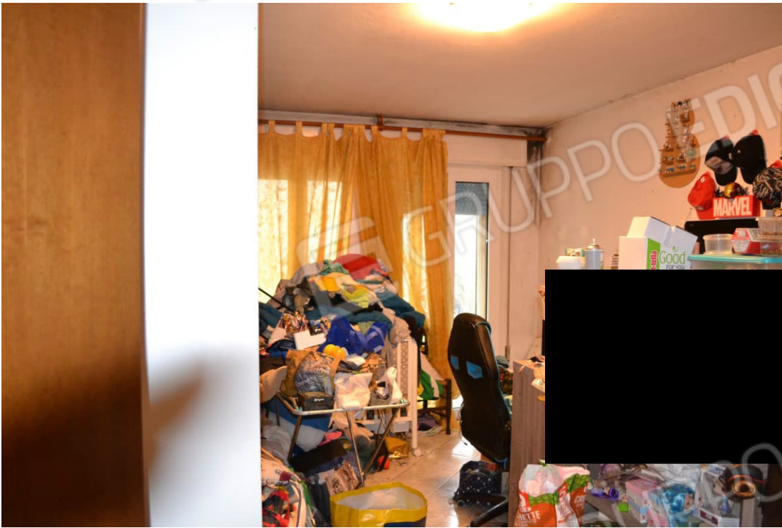
Foto 17, camera da letto matrimoniale usata come magazzino