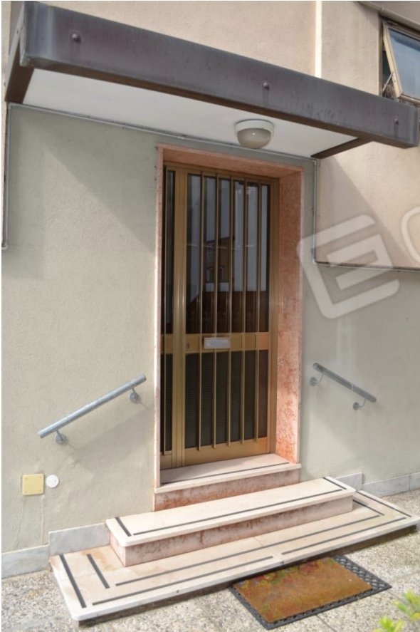
Foto 3. accesso vano scala condominiale