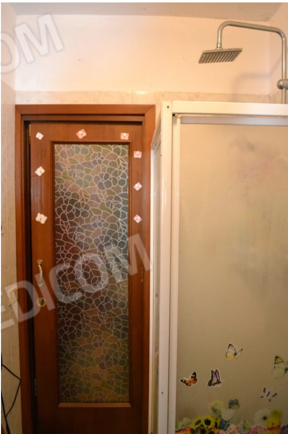
Foto 16. Controvista su bagno