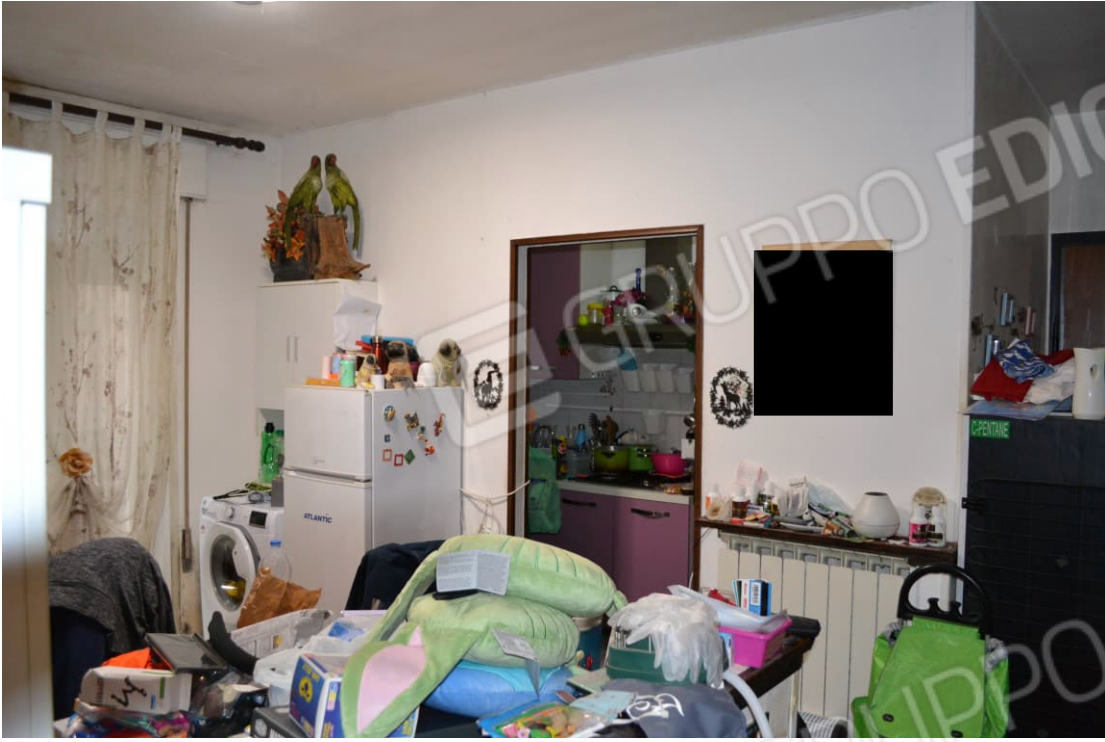
Foto 9. Altra vista su soggiorno