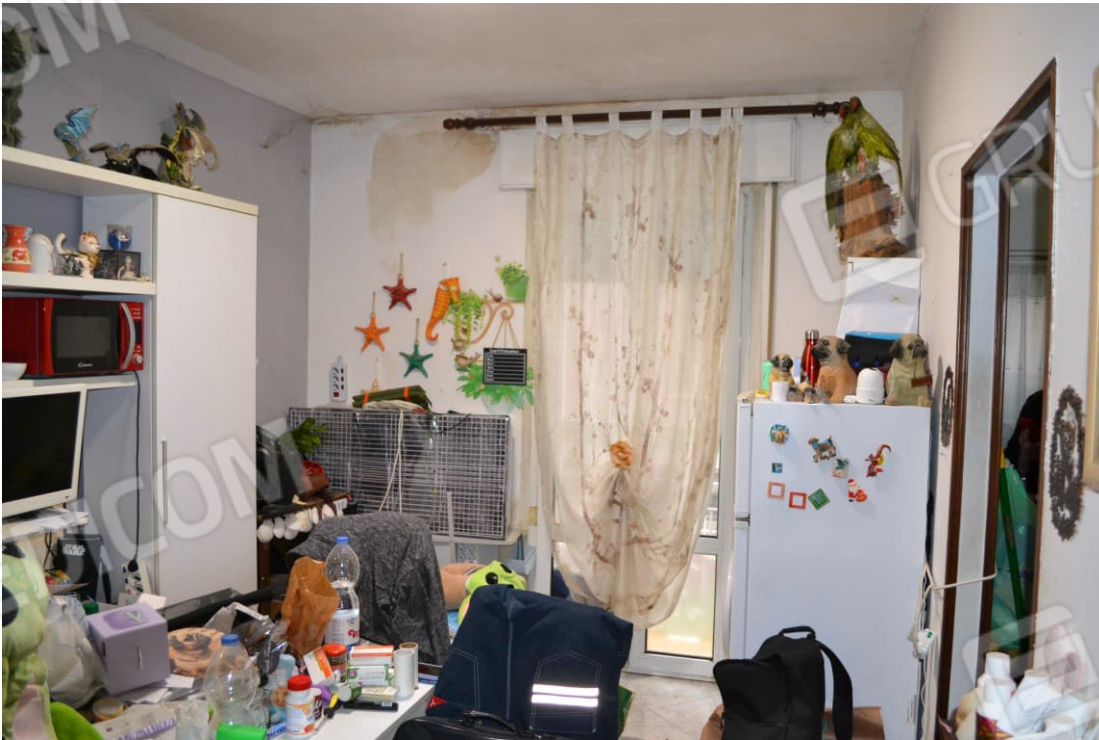
Foto 8. soggiorno