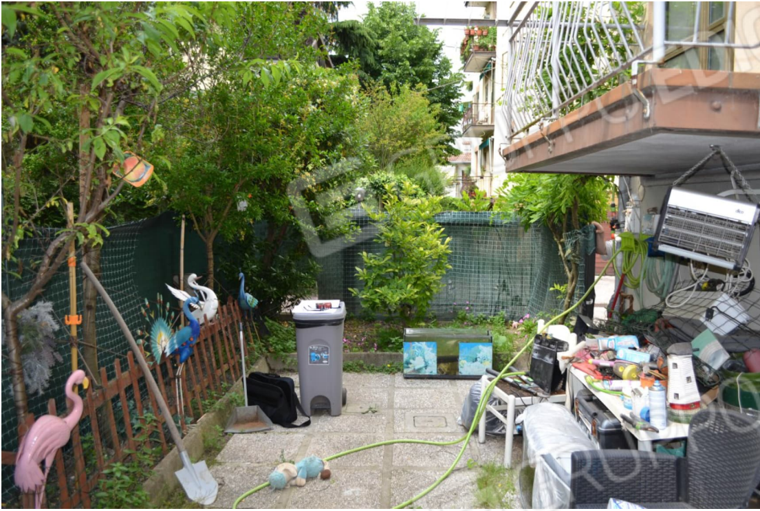
Foto 21. Scoperto esclusivo PT