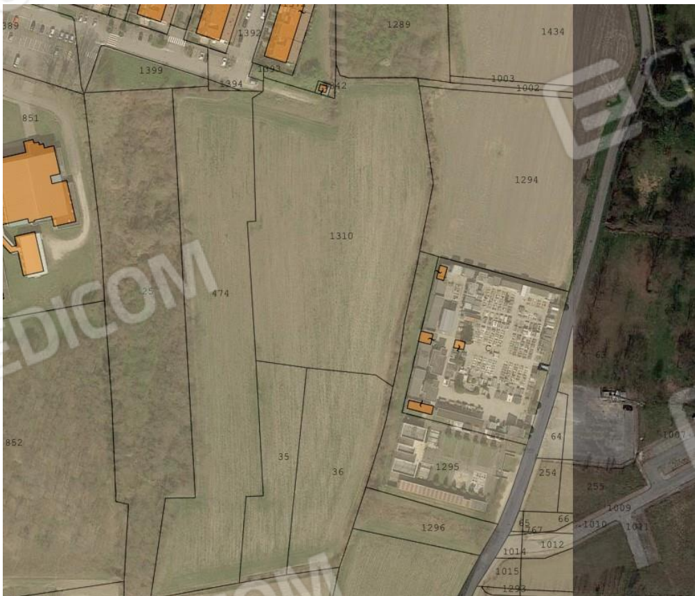
Estratto mappa sovrapposto a vista satellitare