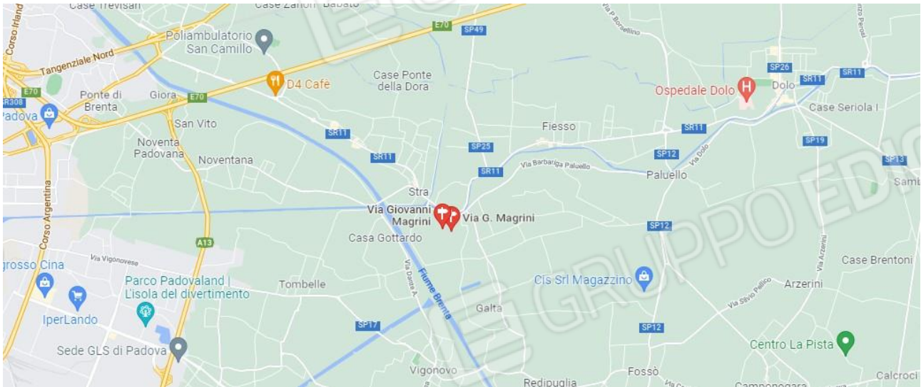
Google maps – stradario

Tre terreni contigui parzialmente edificabili- facenti parte di due lottizzazioni.