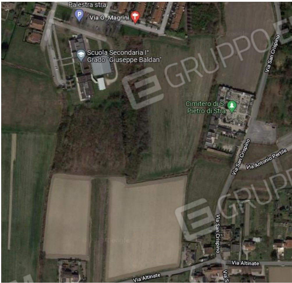
Google maps – vista satellitare