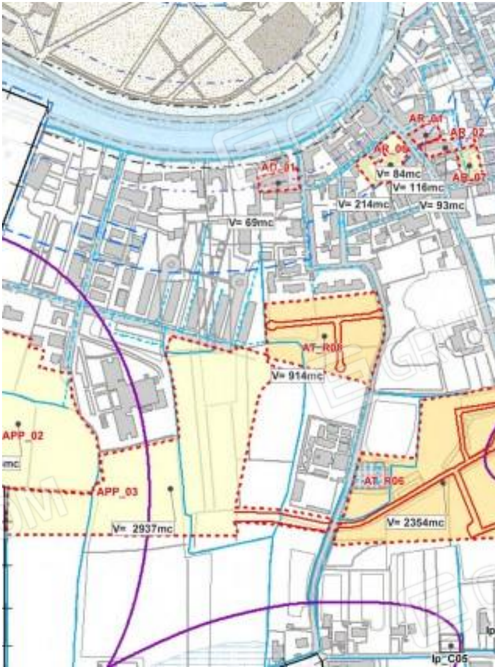
Individuazione lottizzazioni APP 3 e AT-R08