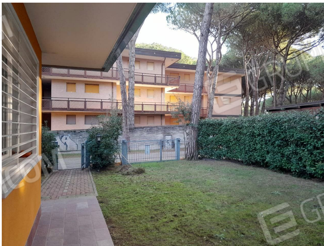
FOTO N.05_Zona accesso carraio