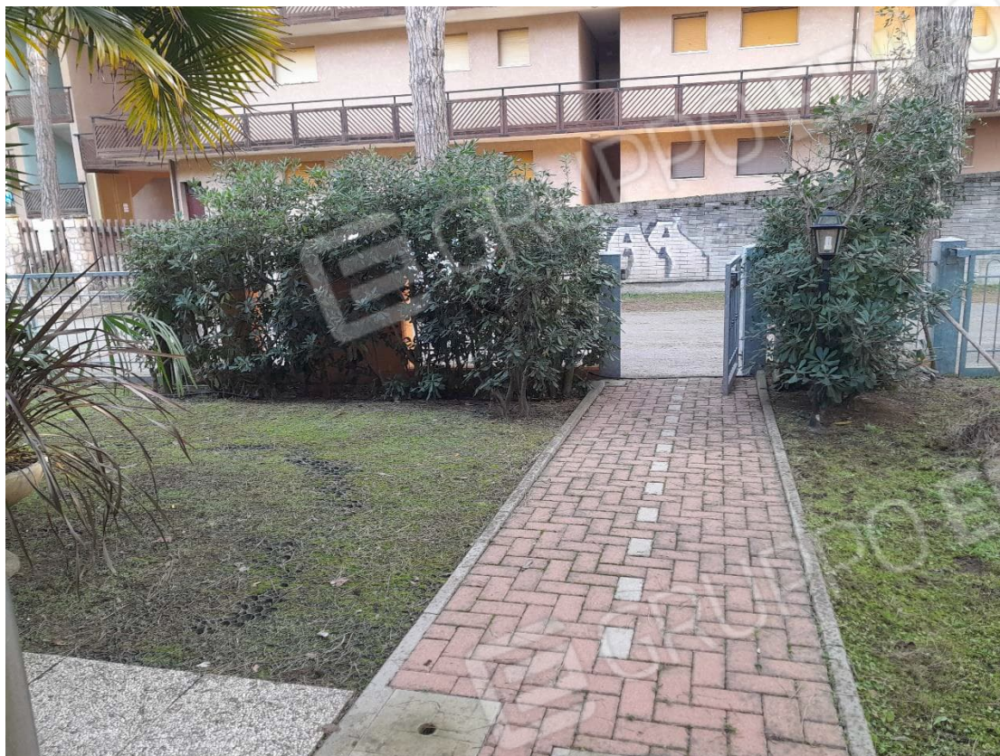
FOTO N.04_Percorso accesso pedonale