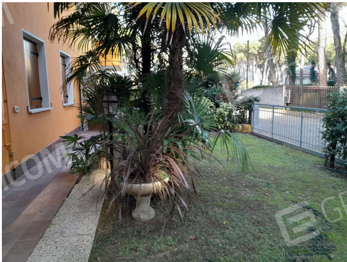
FOTO N.03_ Cortile esclusivo