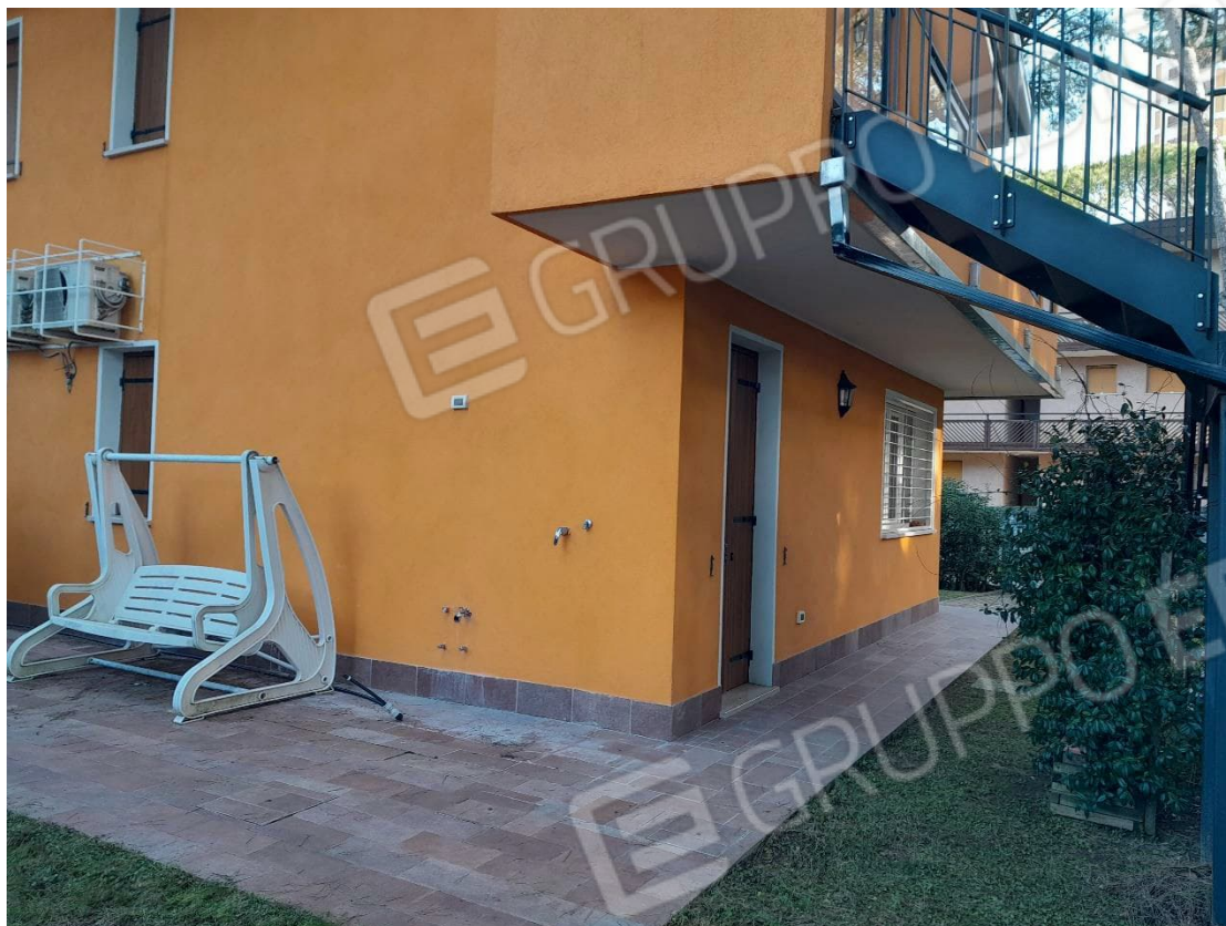
FOTO N.07_Zona scoperto esclusivo