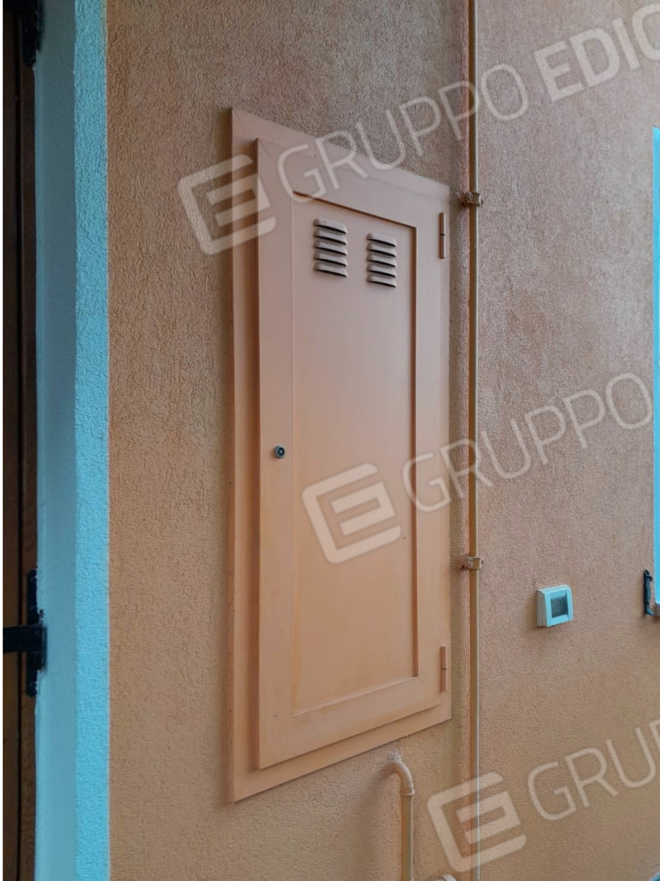
FOTO N.08_Particolare cassetta gas