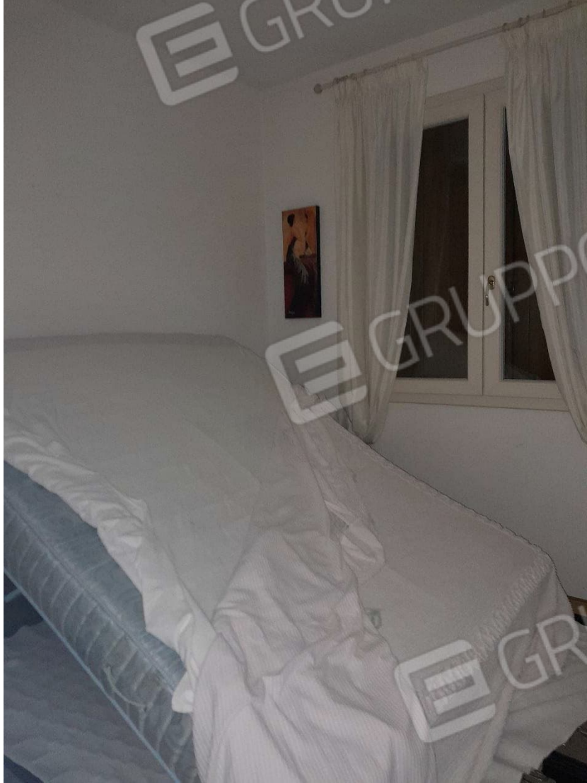
FOTO N.13_Camera 02