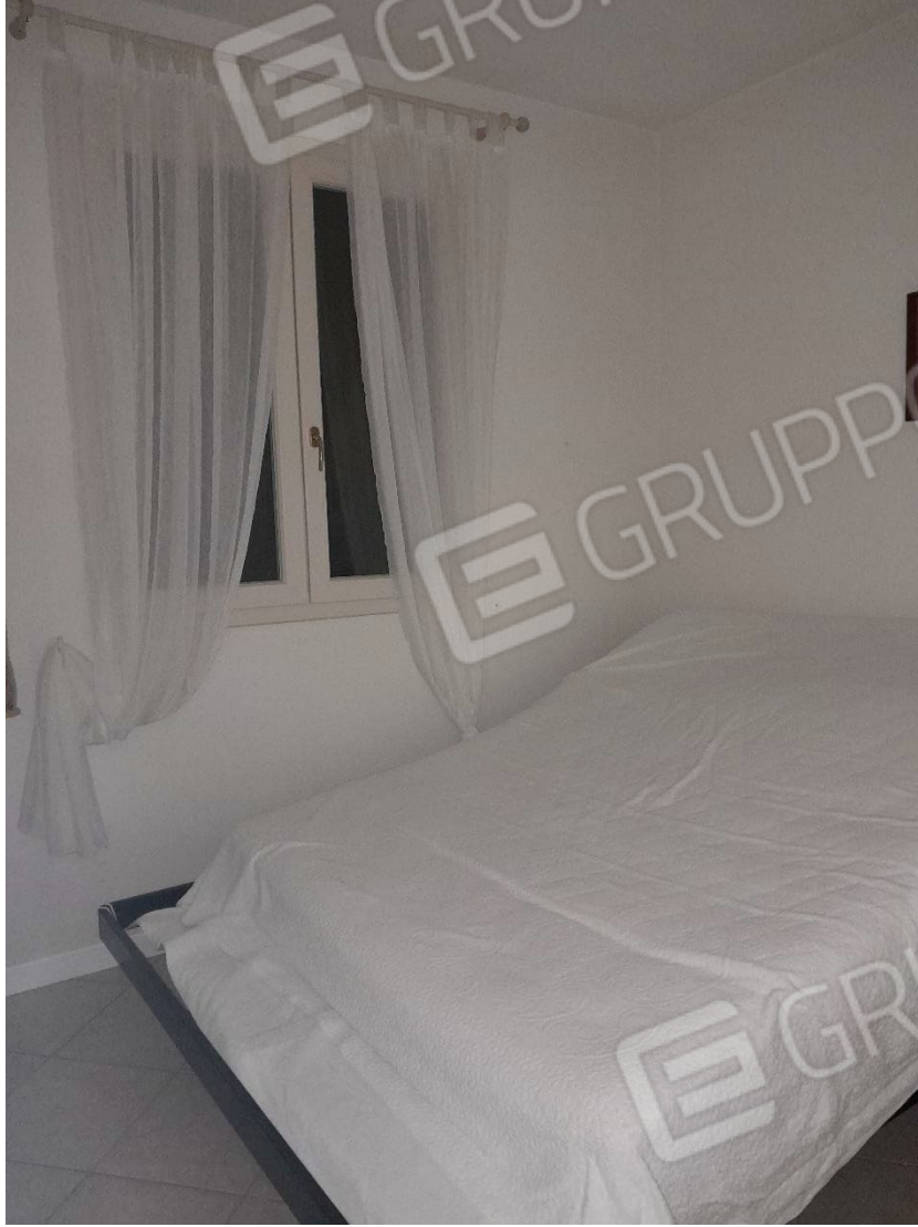
FOTO N.12_Camera 01