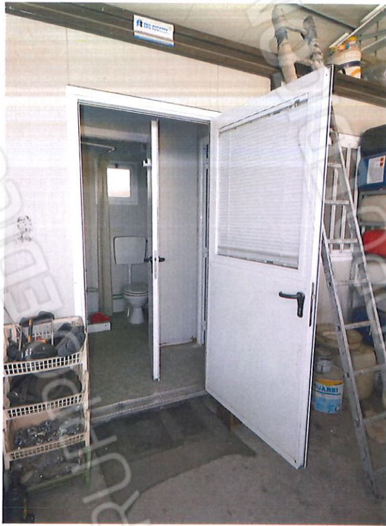
foto 13 prefabbricato servizio igienico, dettaglio