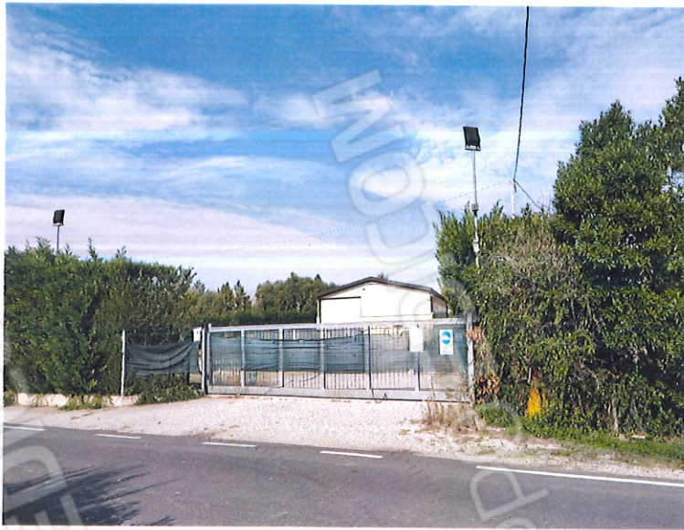
foto1 vista da Via Bosello