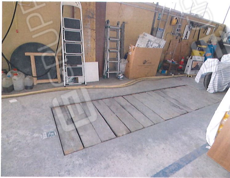
foto 11 dettaglio fossa per manutenzione mezzi