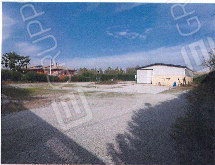
foto 2 capannone prospetto sud, sul fondo edificio rosso di cui al lotto 1