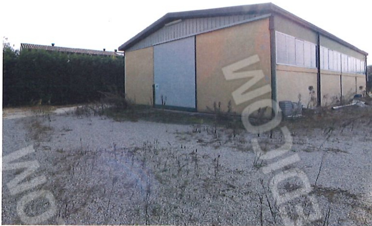
foto 3 capannone angolo nord ovest