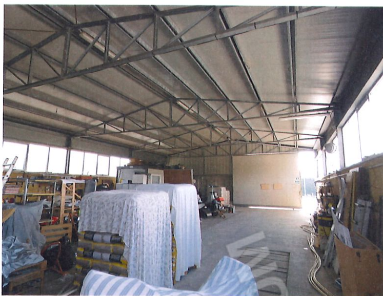
foto 9 capannone interno vista verso l'ingresso principale sud