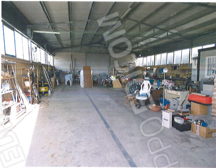
foto 10 capannone interno vista verso nord