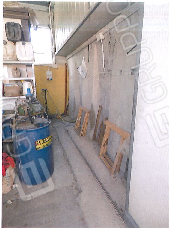
foto 7-8 prospetto sud, vista dall'esterno e dall'interno