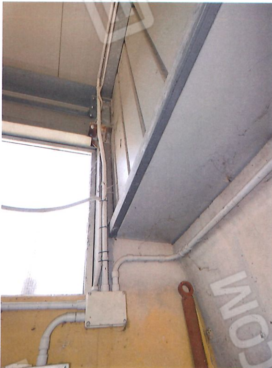
foto 14 -15 impianto elettrico dettagli