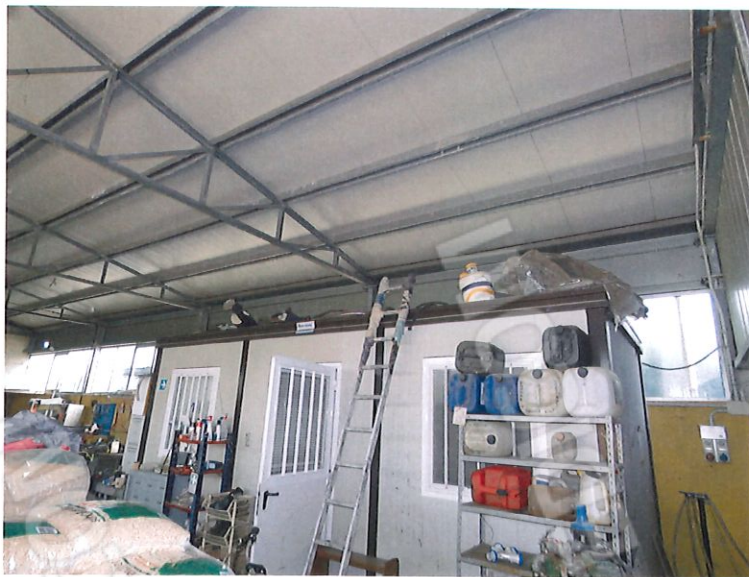
foto 12 prefabbricato servizio igienico