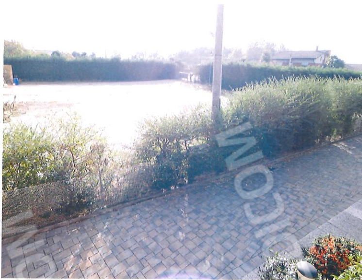
foto 4-5-6 capannone e piazzale visti dall'abitazione di cui al lotto 1 di vendita