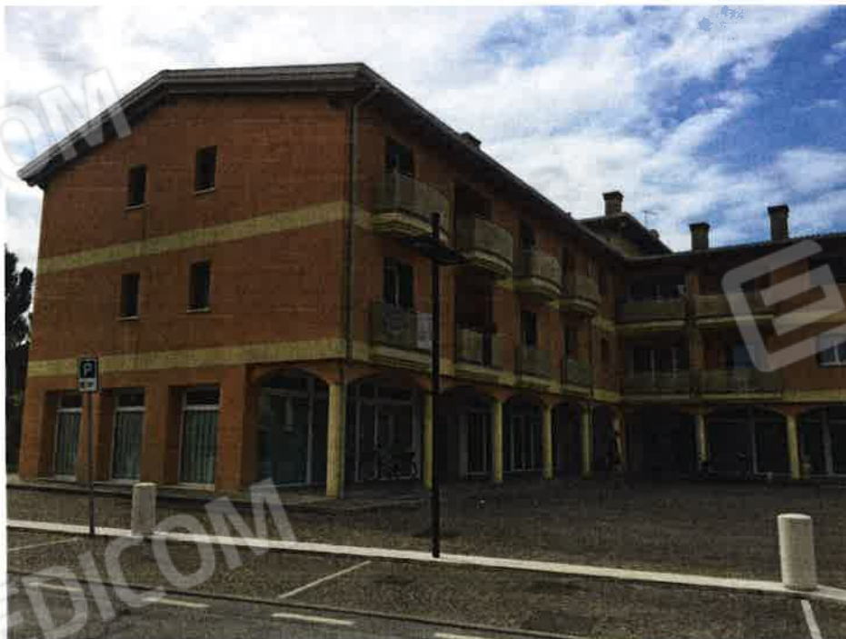
_foto generali del complesso edilizio